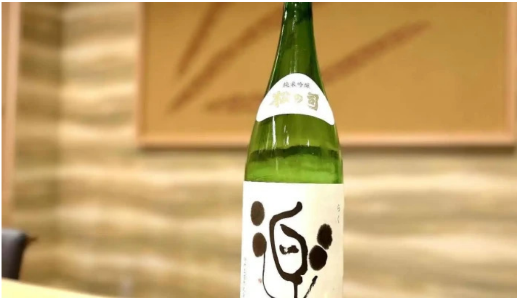
月の光 料理飲み物