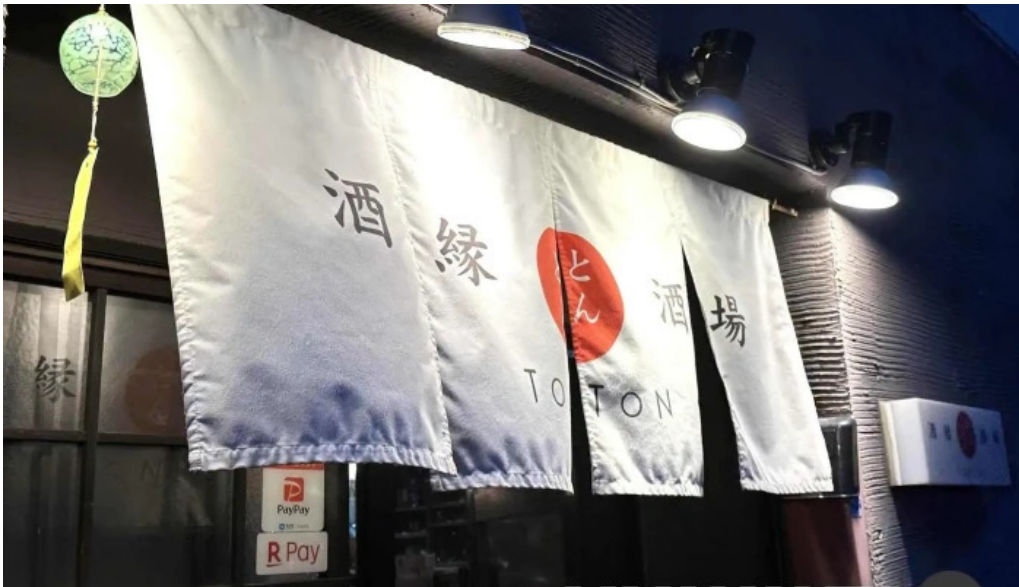
酒縁酒場屯々 すべて