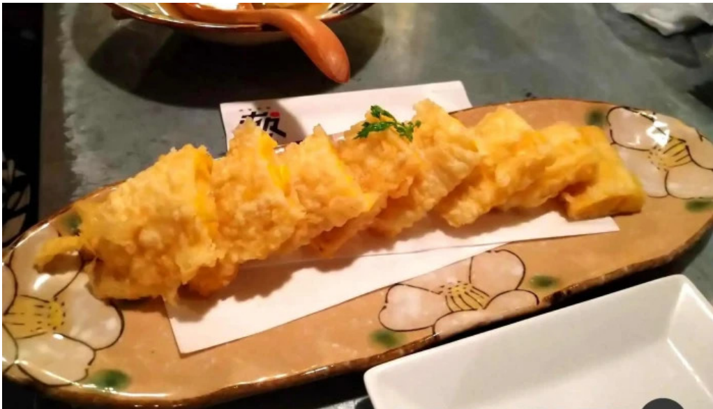
酒縁酒場屯々 天ぷら