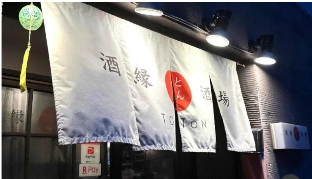
酒縁酒場・屯々 網走市