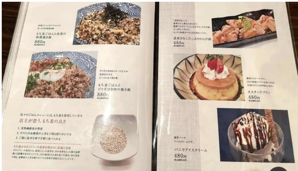
酒縁酒場屯々 メニュー