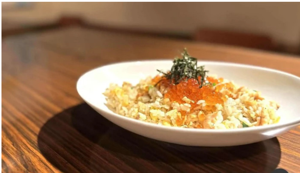
酒縁酒場屯々 料理飲み物