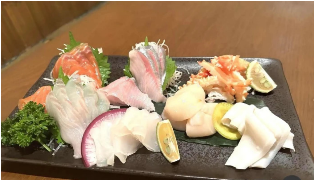
酒縁酒場屯々