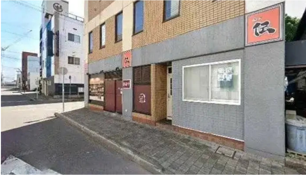
酒縁酒場屯々 ストリートビューと 360 ビュー