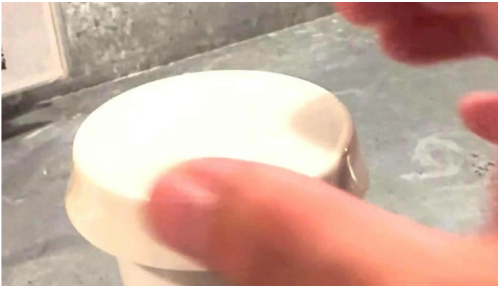
酒縁酒場屯々 comentario 2