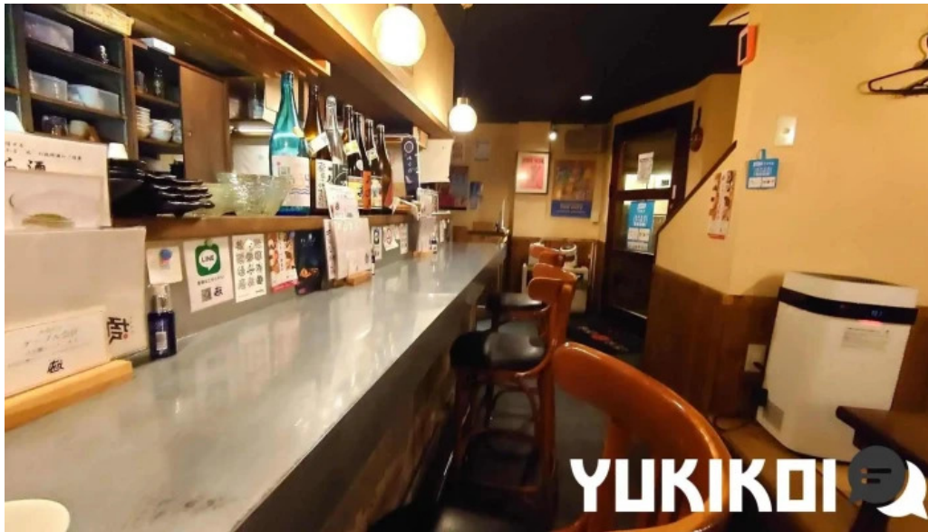
酒縁酒場屯々 雰囲気