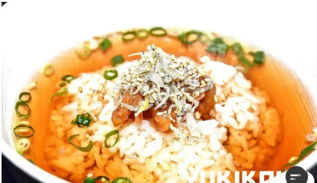
酒縁酒場屯々 スープ