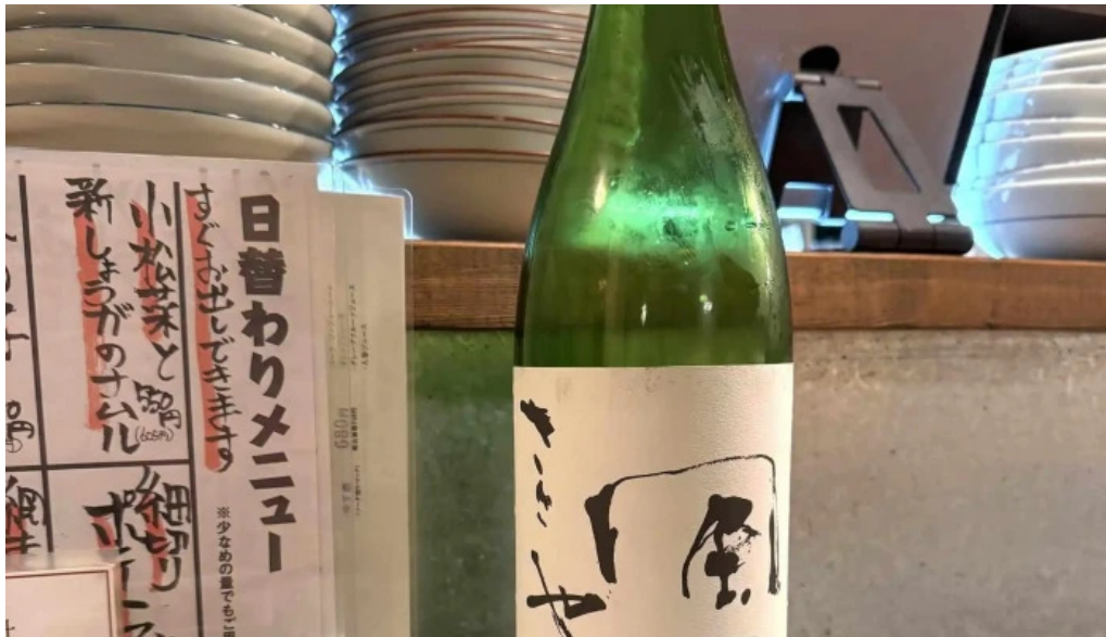
酒縁酒場屯々 comentario 1