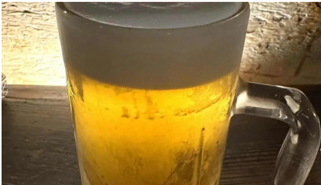
炉端 五十集屋いさばや ビール