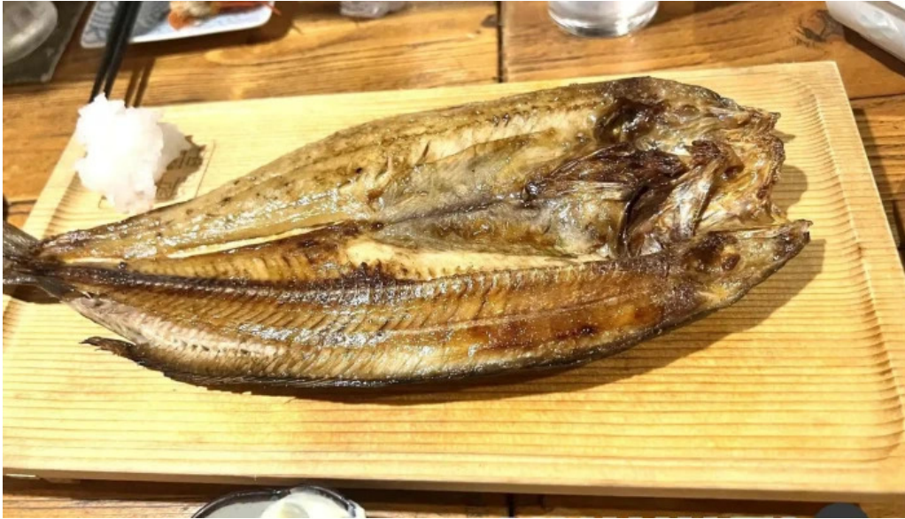
炉端 五十集屋いさばや シーフード