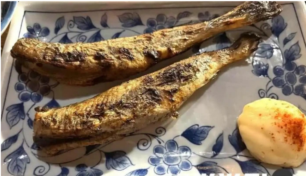
炉端 五十集屋いさばや サバ