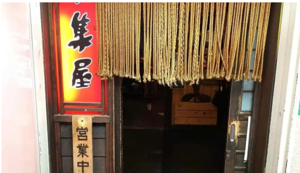
炉端 五十集屋いさばや すべて