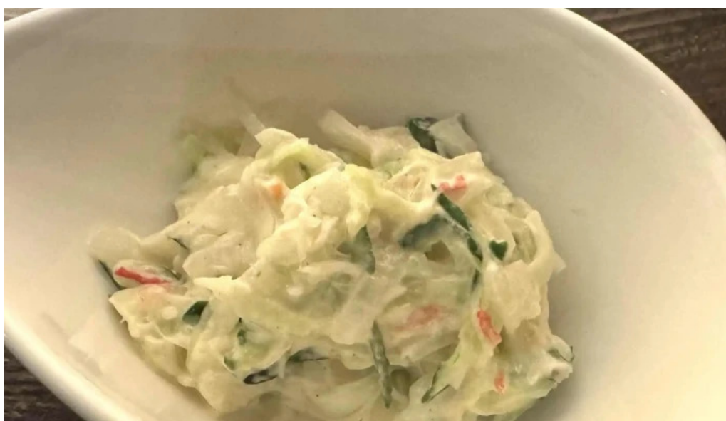
炉端 五十集屋いさばや comentario 1