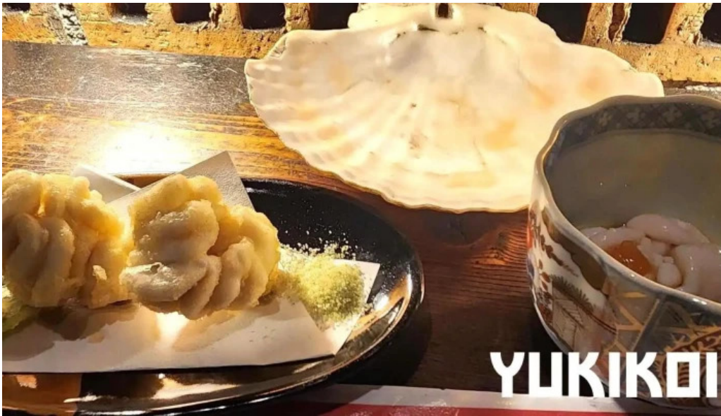
炉端 五十集屋いさばや 料理飲み物