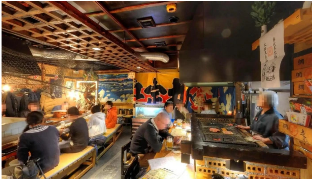
炉端 五十集屋いさばや ストリートビューと 360 ビュー