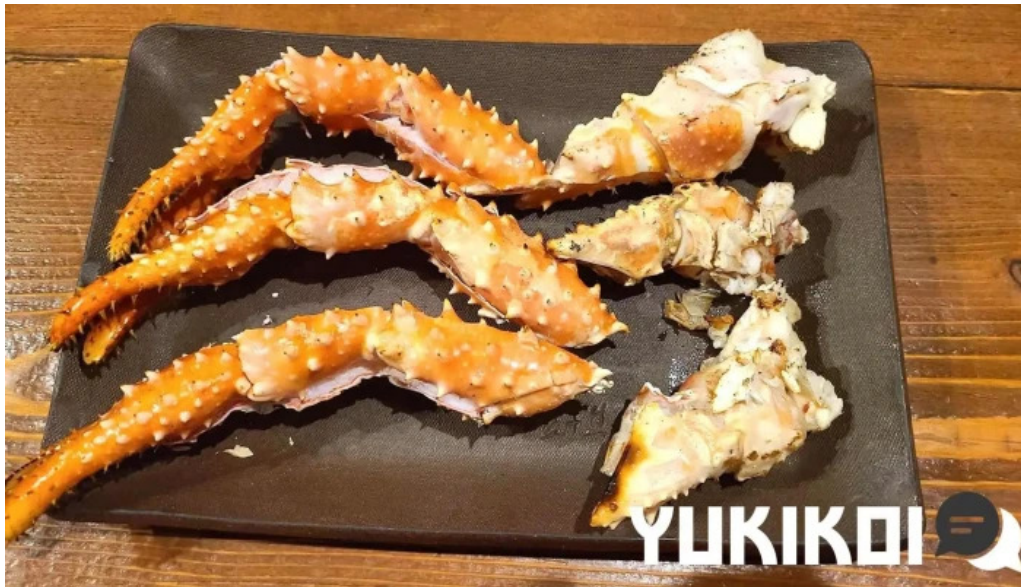
炉端 五十集屋いさばや タラバガニ科