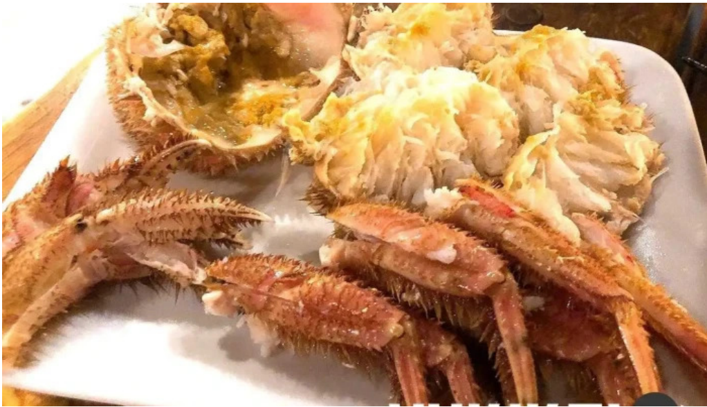
炉端 五十集屋いさばや ケガニ