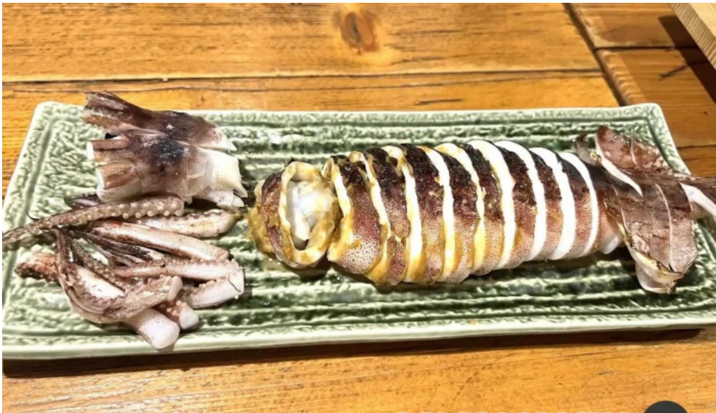
炉端 五十集屋いさばや イカ焼き