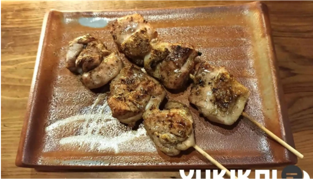
炉端 五十集屋いさばや 焼き鳥