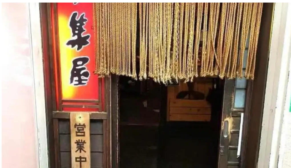
炉端 五十集屋（いさばや） 網走市