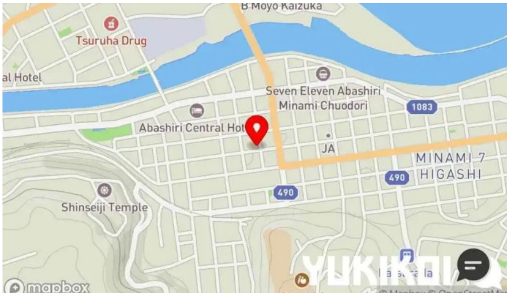
炉端 五十集屋いさばや地図