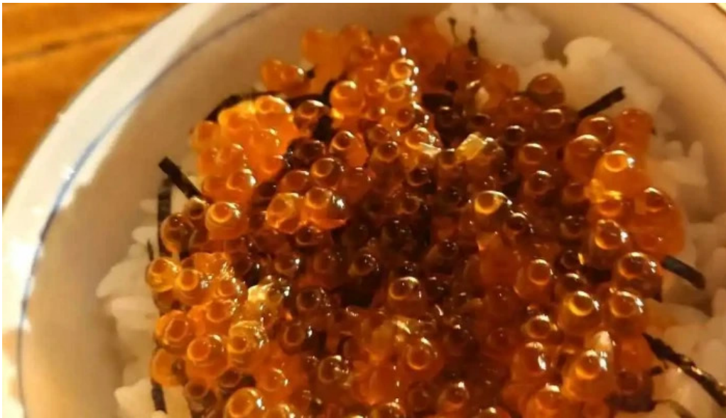
炉端 五十集屋いさばや 丼物