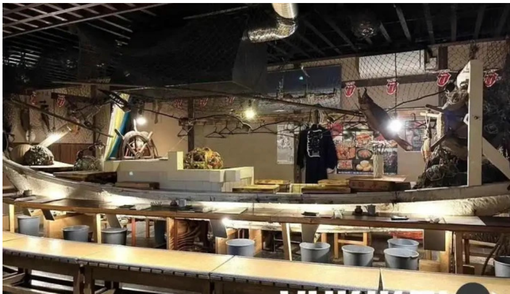
炉端 五十集屋いさばや 雰囲気