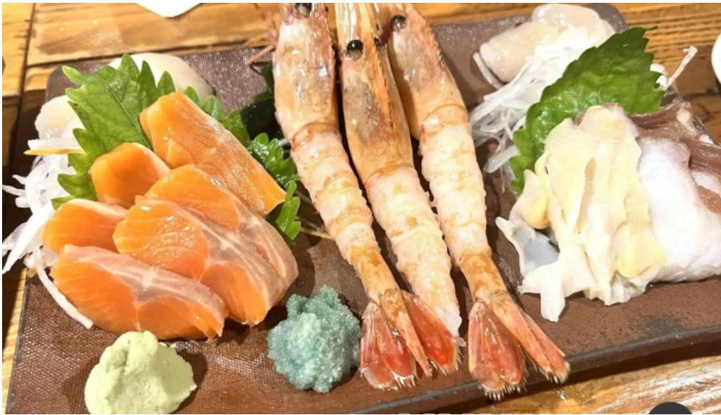
炉端 五十集屋いさばや 刺身