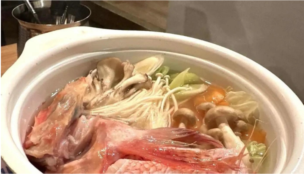
Bei noHai Xian Chu wiroriWang Zou Dian sukiShao ki