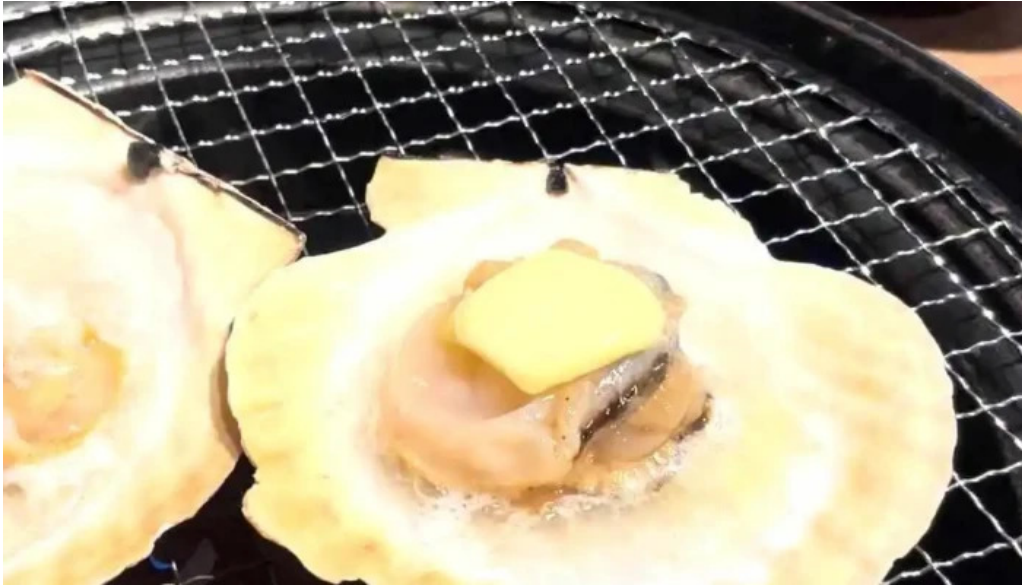
Bei noHai Xian Chu wiroriWang Zou Dian itayagaiKe