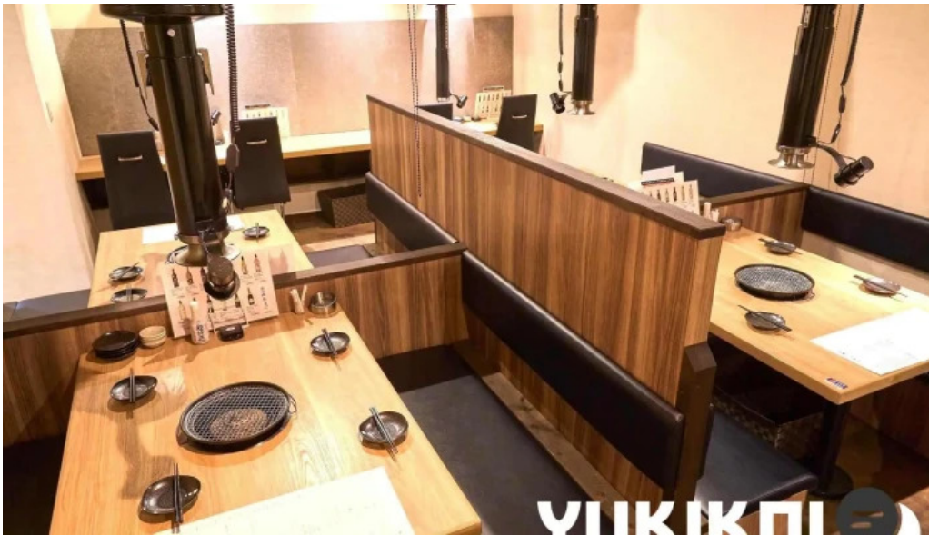
Bei noHai Xian Chu wiroriWang Zou Dian subete