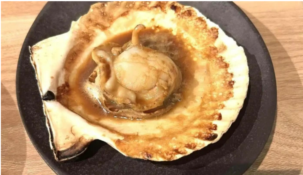
Bei noHai Xian Chu wiroriWang Zou Dian Zui Xin