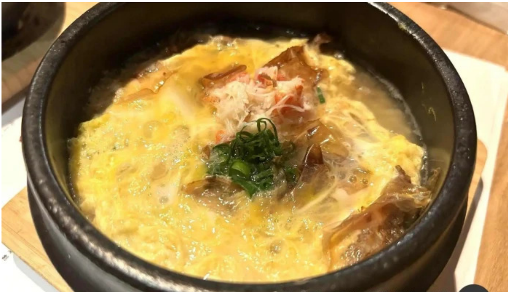
Bei noHai Xian Chu wiroriWang Zou Dian Za Chui