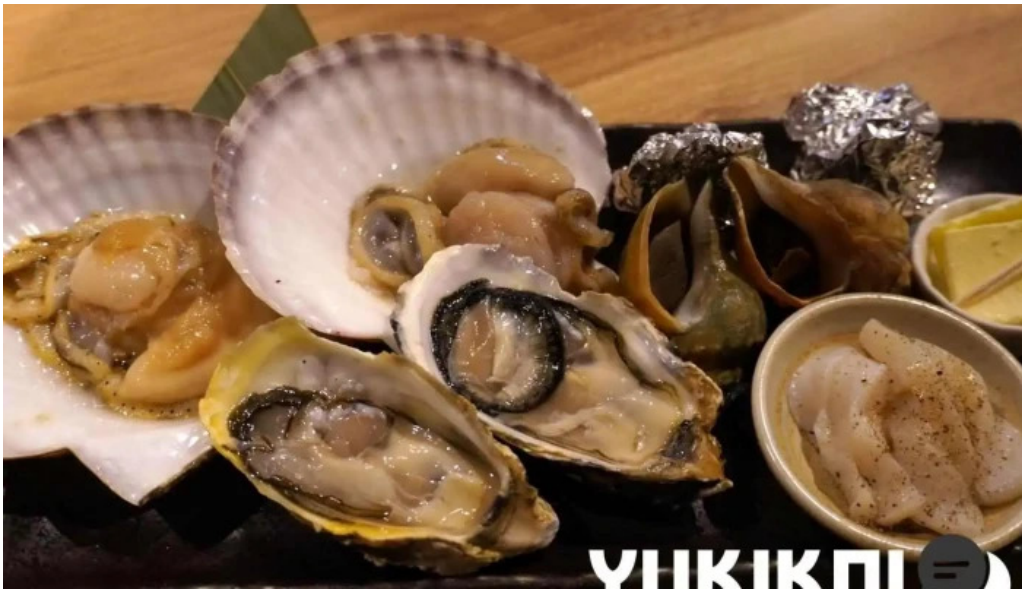
Bei noHai Xian Chu wiroriWang Zou Dian shi hu do