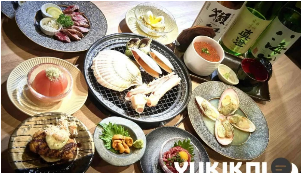
Bei noHai Xian Chu wiroriWang Zou Dian o na Ti Gong