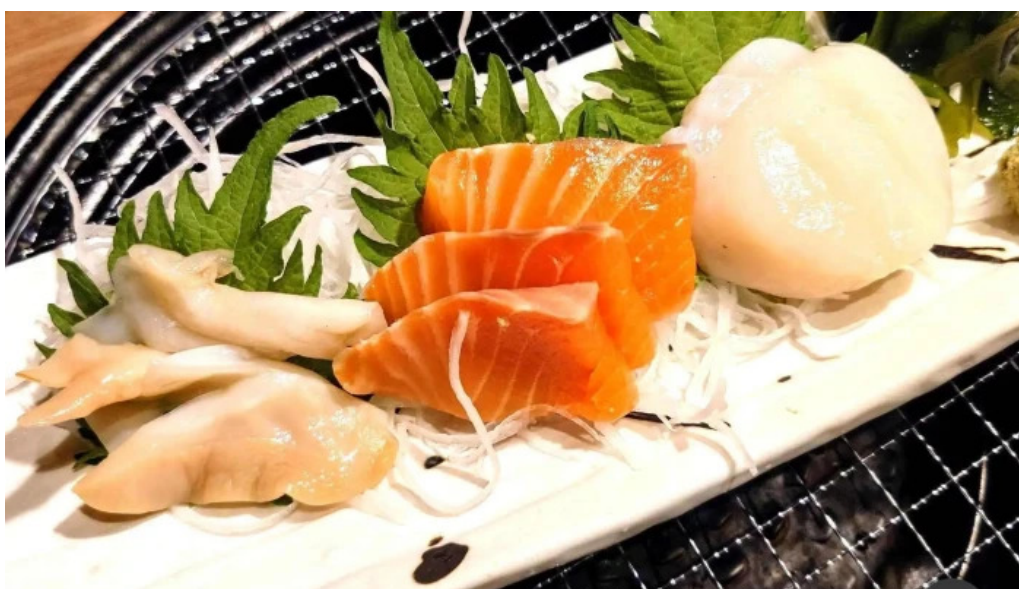
Bei noHai Xian Chu wiroriWang Zou Dian Ci Shen