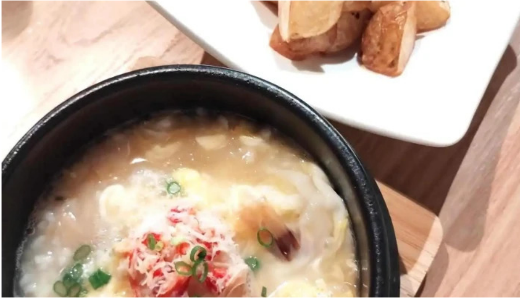
Bei noHai Xian Chu wiroriWang Zou Dian su pu