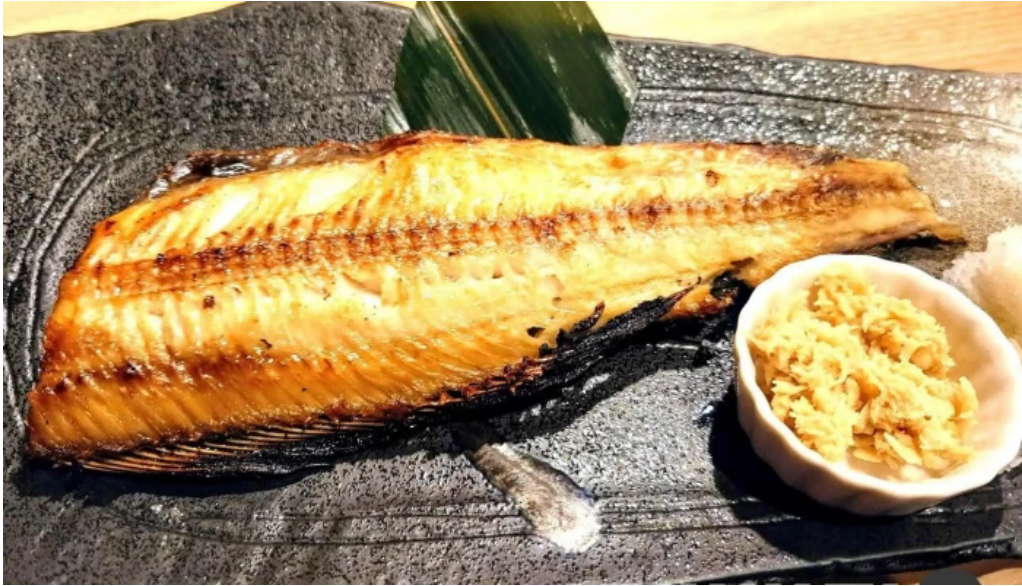
Bei noHai Xian Chu wiroriWang Zou Dian saba