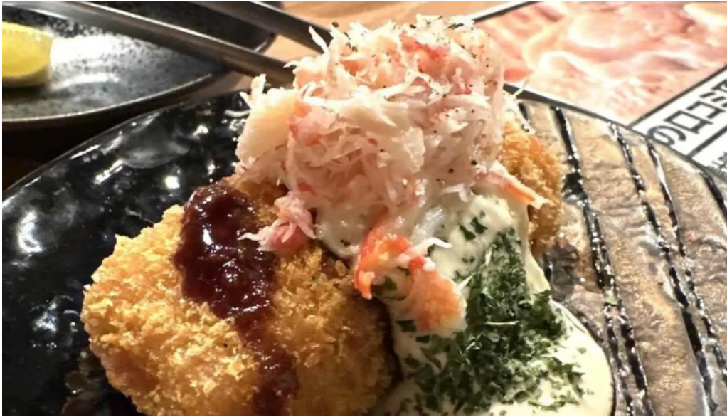
Bei noHai Xian Chu wiroriWang Zou Dian Tian pura