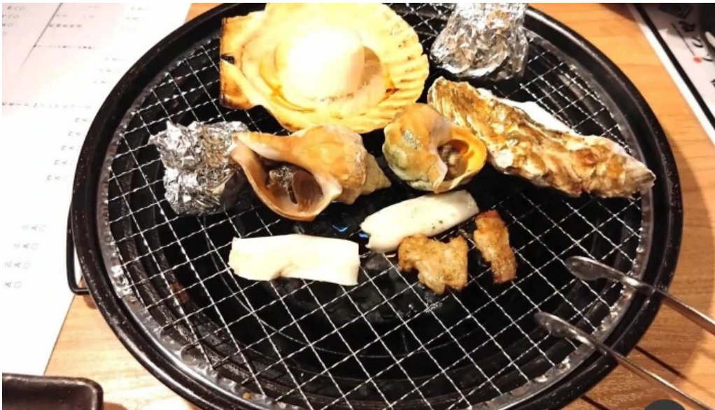
Bei noHai Xian Chu wiroriWang Zou Dian Liao Li Yin miWu