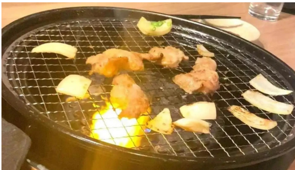
Bei noHai Xian Chu wiroriWang Zou Dian Dong Hua