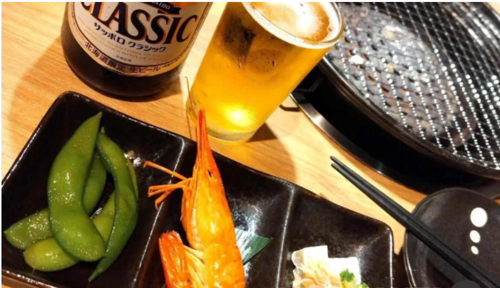
Bei noHai Xian Chu wiroriWang Zou Dian Zhi Dou