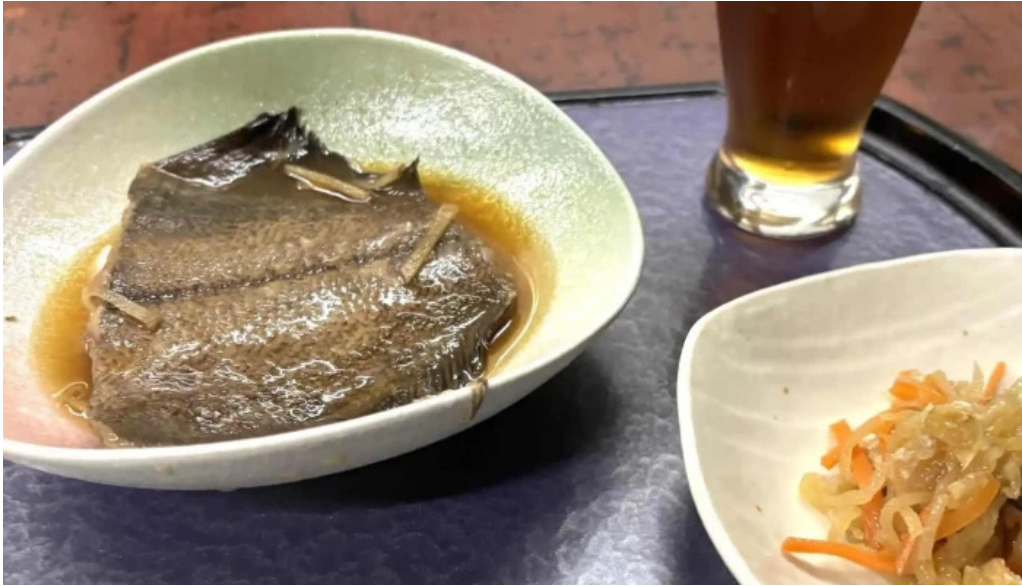
おふくろ comentario 6