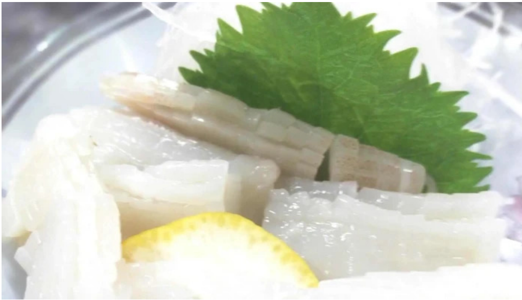
おふくろ comentario 4