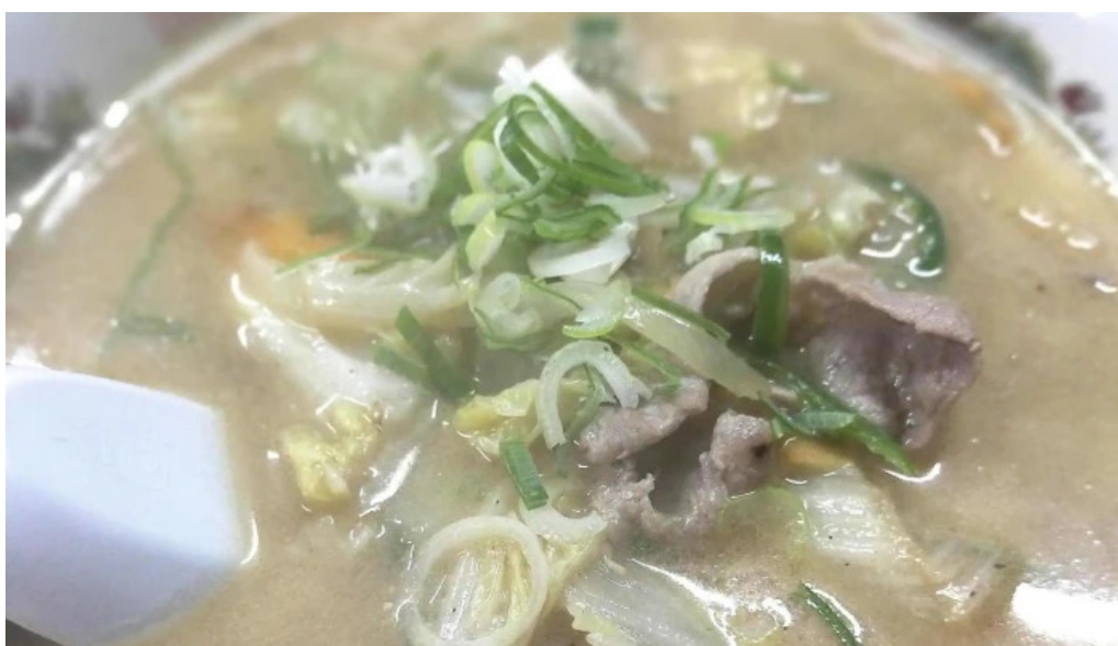
おふくろ comentario 1