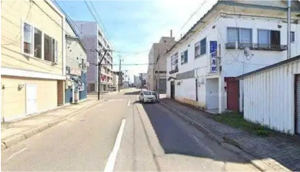
おふくろ ストリートビューと 360 ビュー