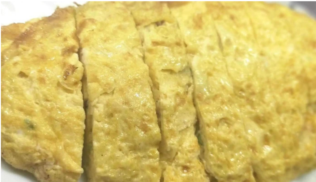
おふくろ comentario 3