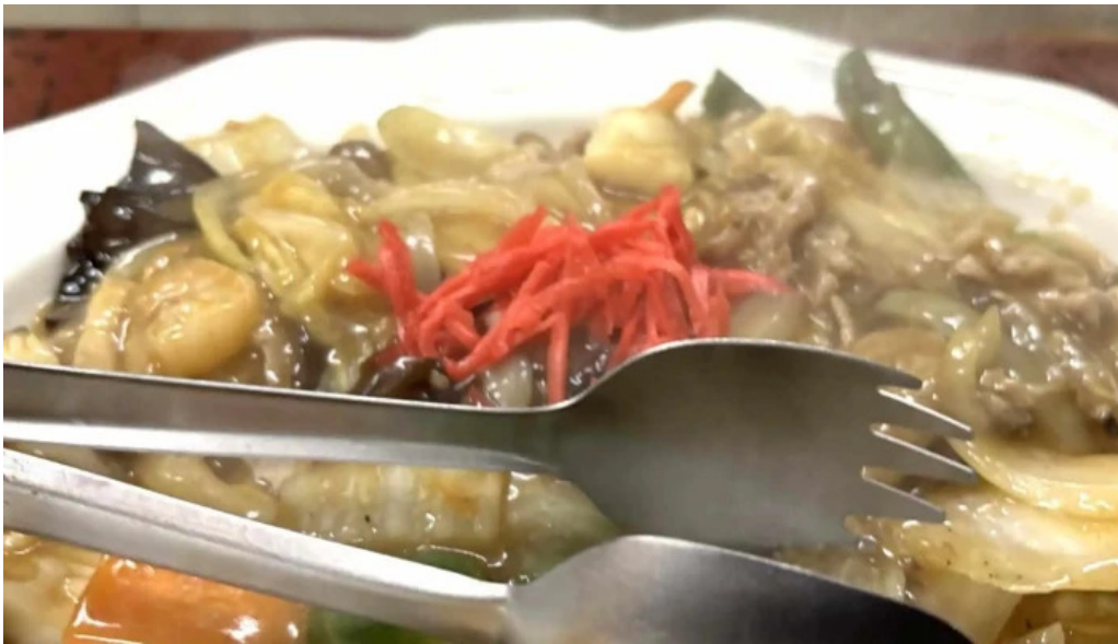
おふくろ comentario 5