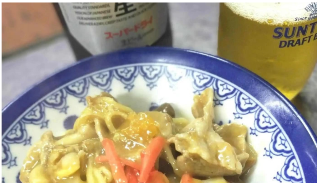
おふくろ comentario 2