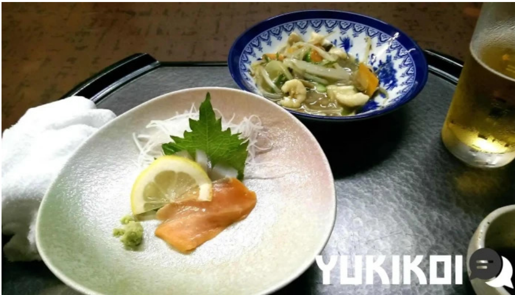
おふくろ 料理飲み物