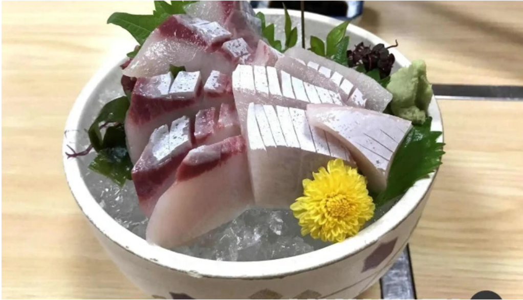
炉端焼 弥吉 刺身