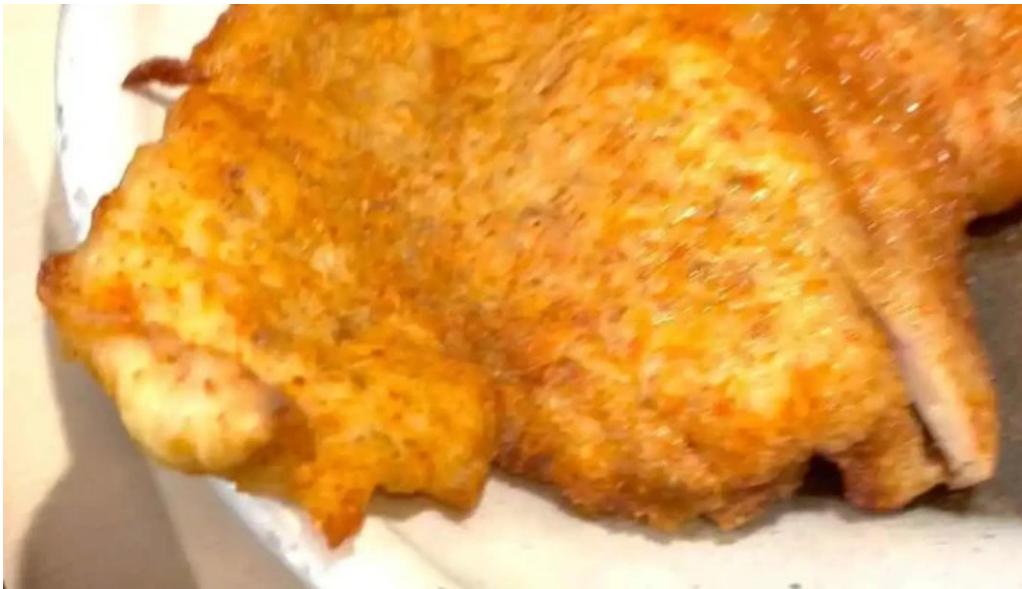
炉端焼 弥吉 動画