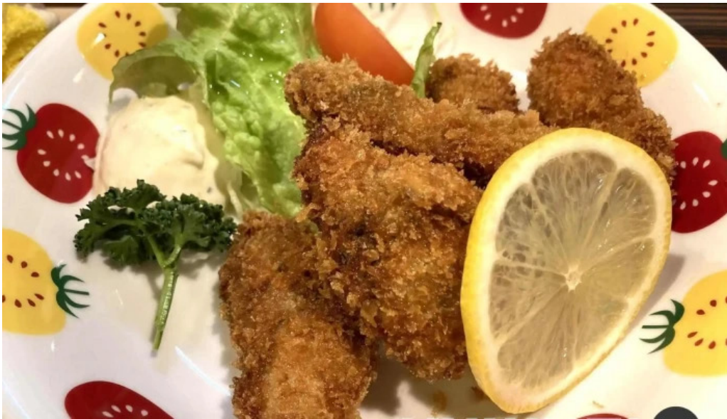
炉端焼 弥吉 豚カツ