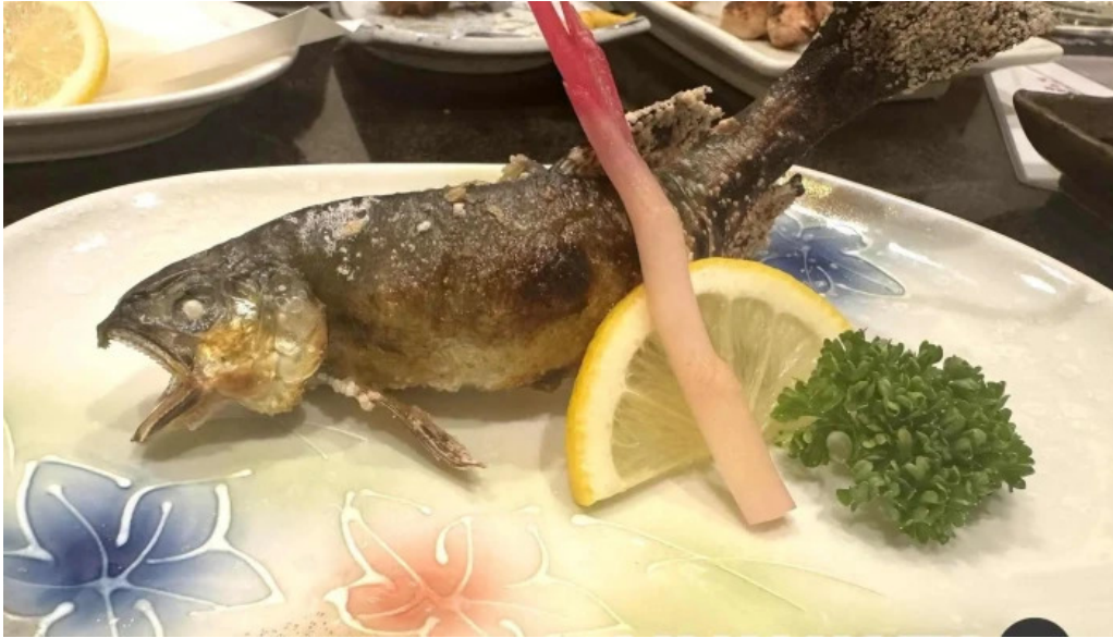
炉端焼 弥吉 サバ