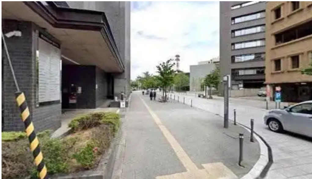
炉端焼 弥吉 ストリートビューと 360 ビュー