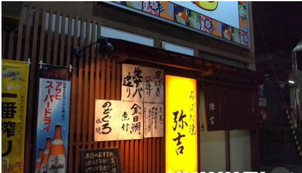
炉端焼 弥吉 すべて