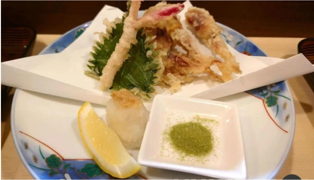
炉端焼 弥吉 天ぷら