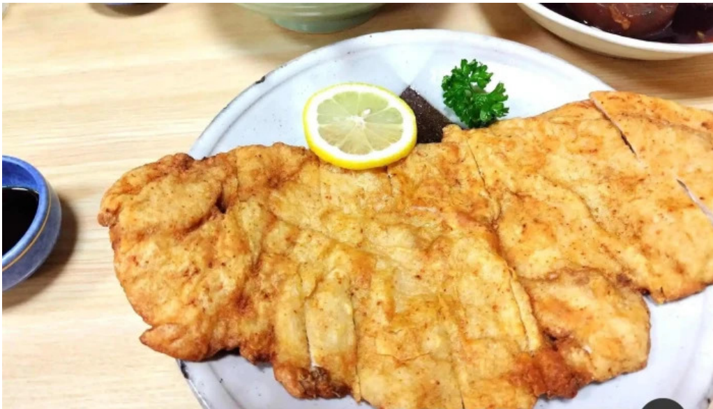
炉端焼 弥吉 ヴィーナーシュニッツェル