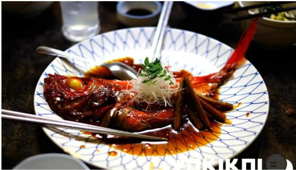
炉端焼 弥吉 料理飲み物