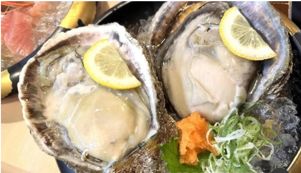
炉端焼 弥吉 カキ