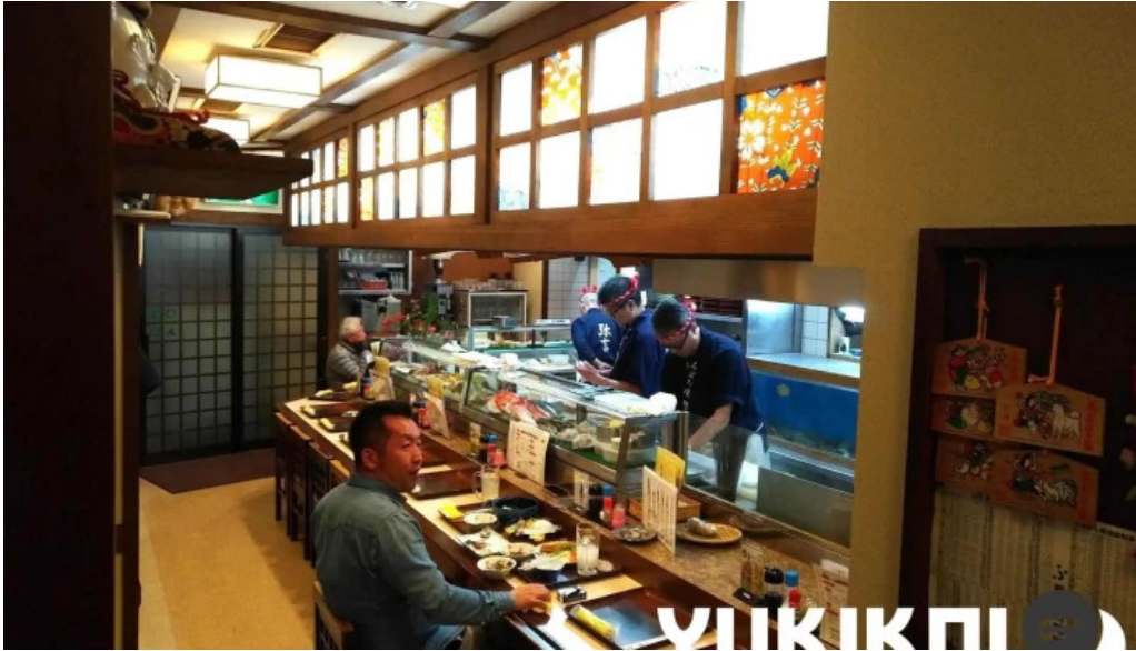
炉端焼 弥吉 雰囲気