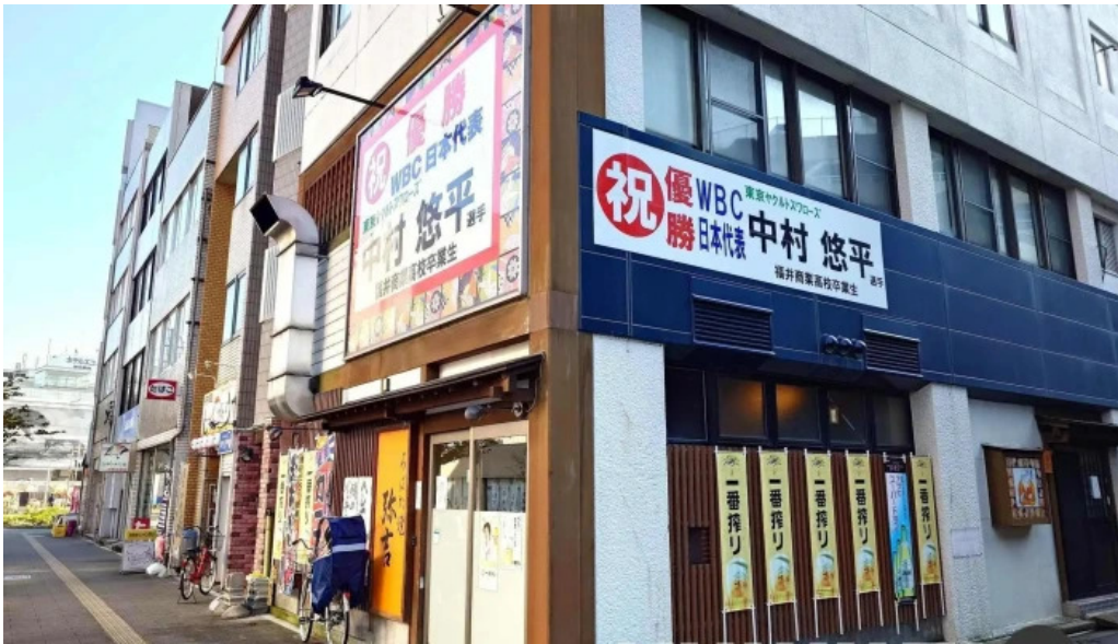
炉端焼 弥吉 最新