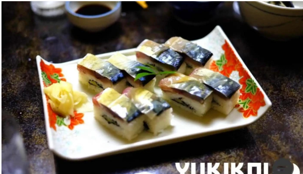
炉端焼 弥吉 寿司