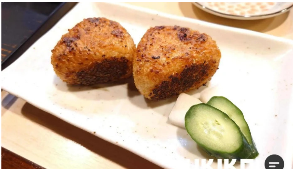
炉端焼 弥吉 おにぎり