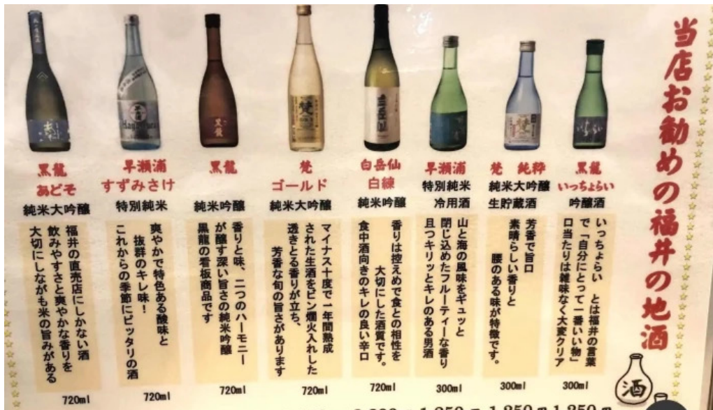
炉端焼 弥吉 ×メニュー