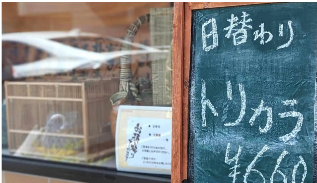
板前の台所 よし田 動画