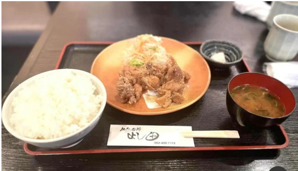
板前の台所 よし田 から揚げ