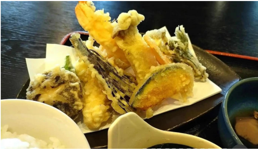
板前の台所 よし田 天ぷら