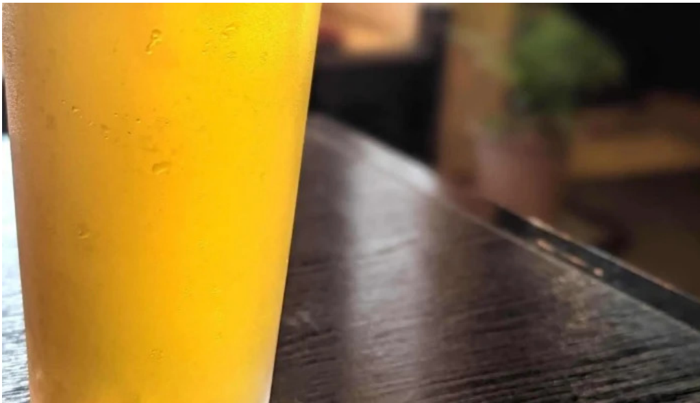
板前の台所 よし田 近く