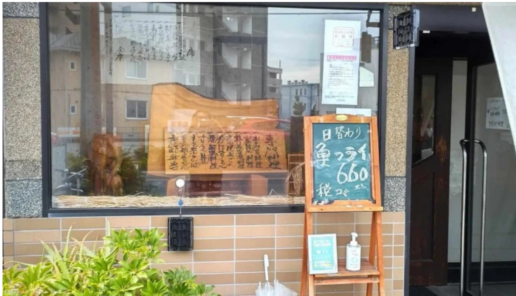
板前の台所 よし田 営業時間