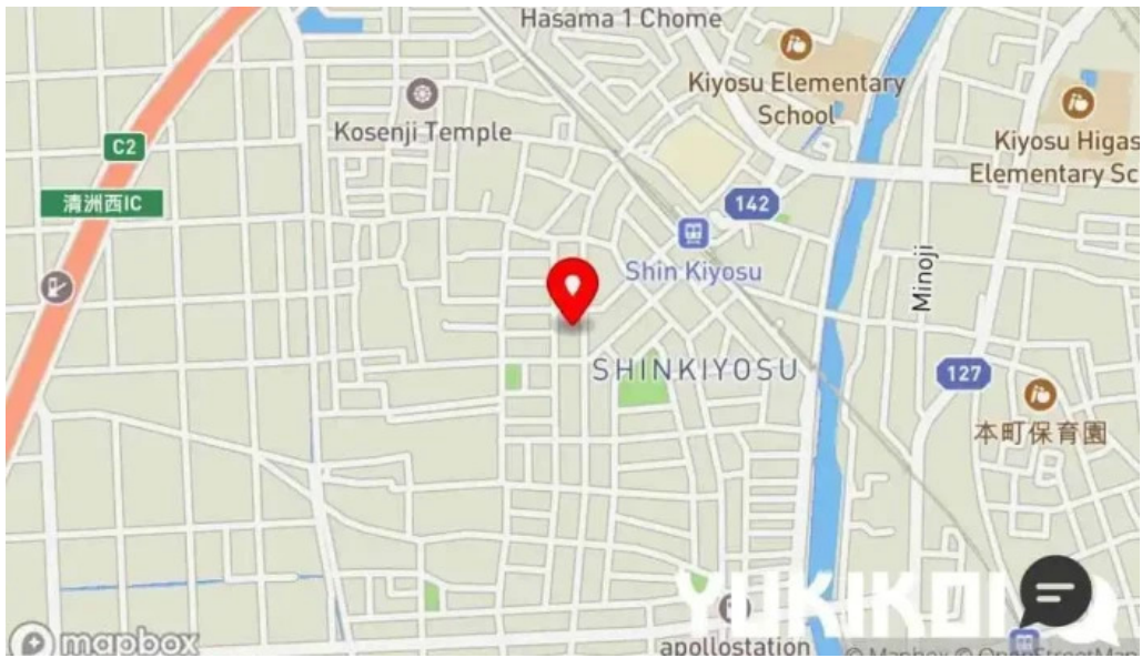
板前の台所 よし田 地図