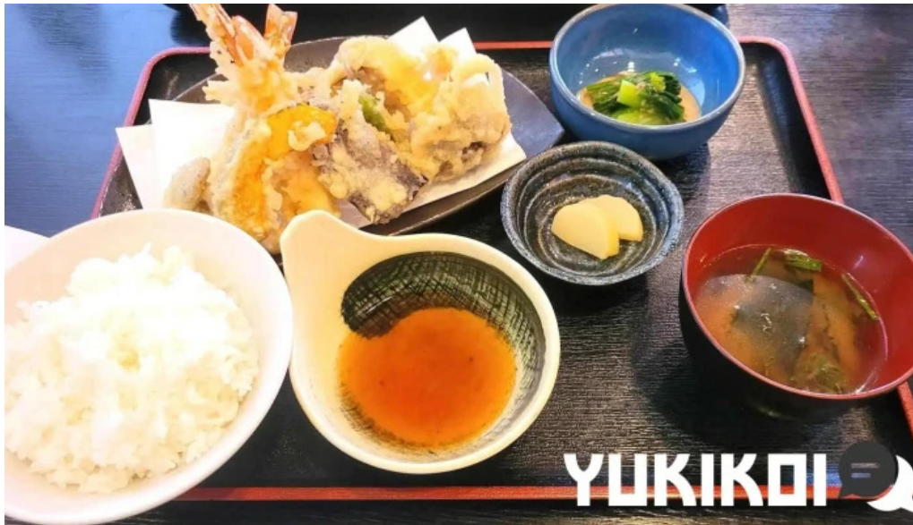
板前の台所 よし田 スープ