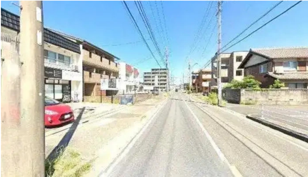
板前の台所 よし田 清須市