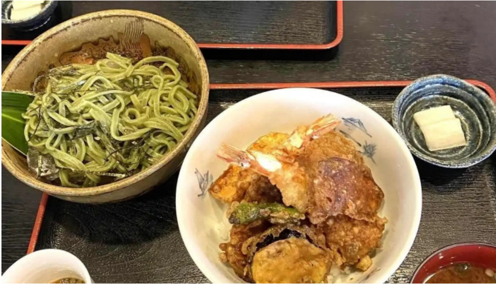
板前の台所 よし田 料理飲み物