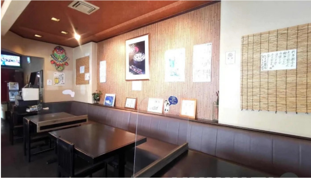
板前の台所 よし田 雰囲気