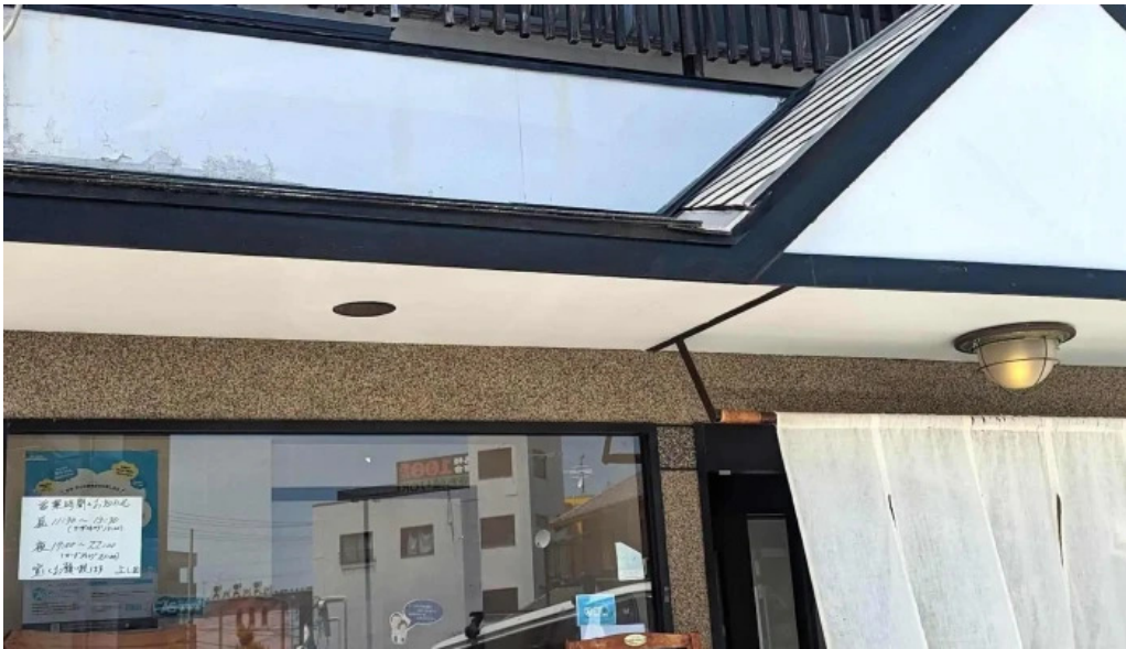
板前の台所 よし田 所在地