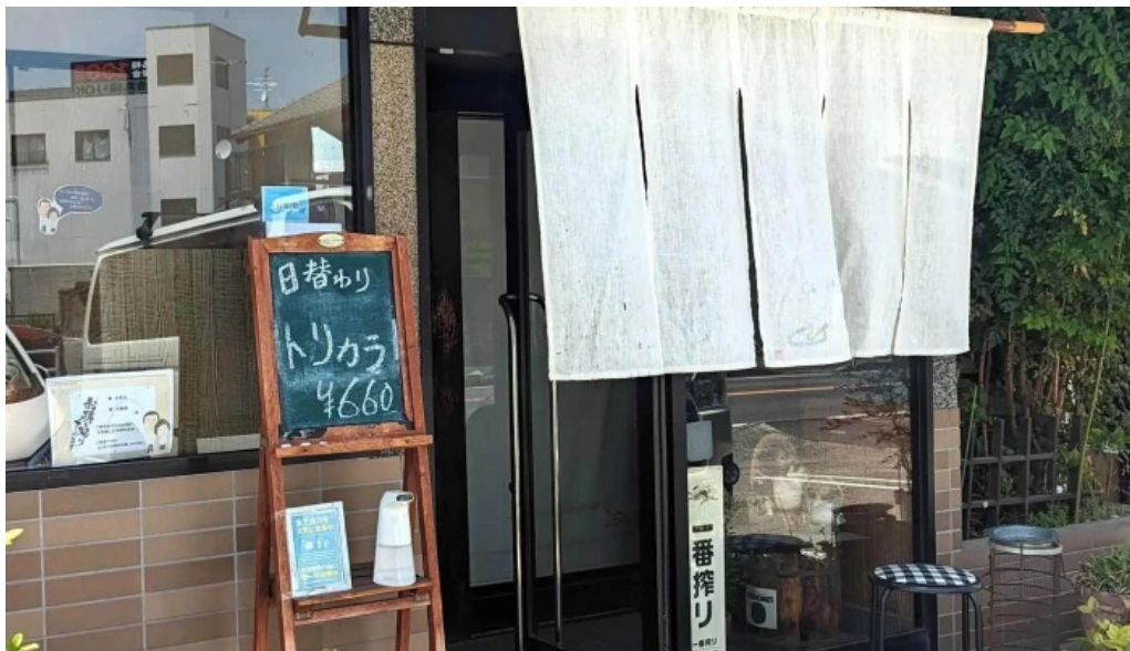
板前の台所 よし田 instagram