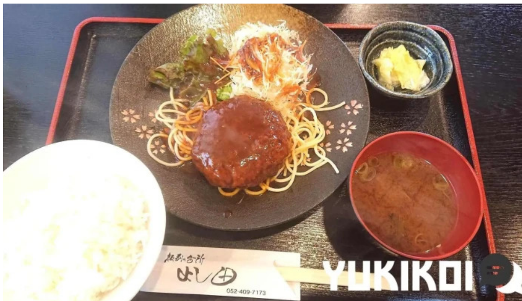
板前の台所 よし田 麵