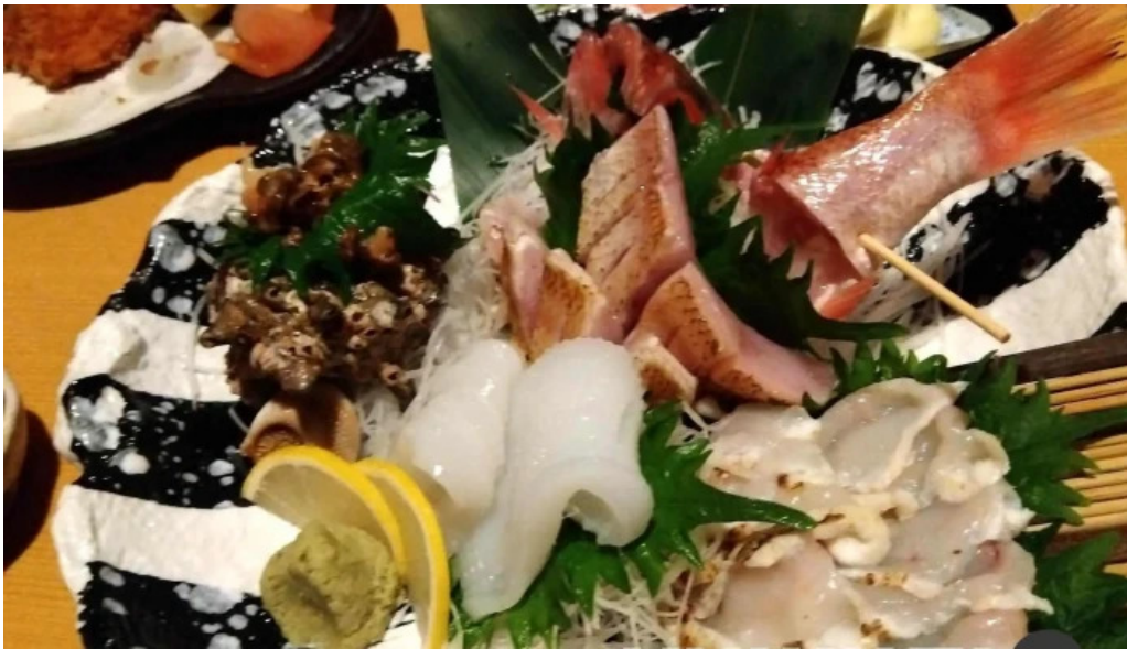
食彩美酒 小旬 刺身