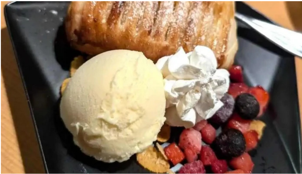
食彩美酒 小旬 浜田市