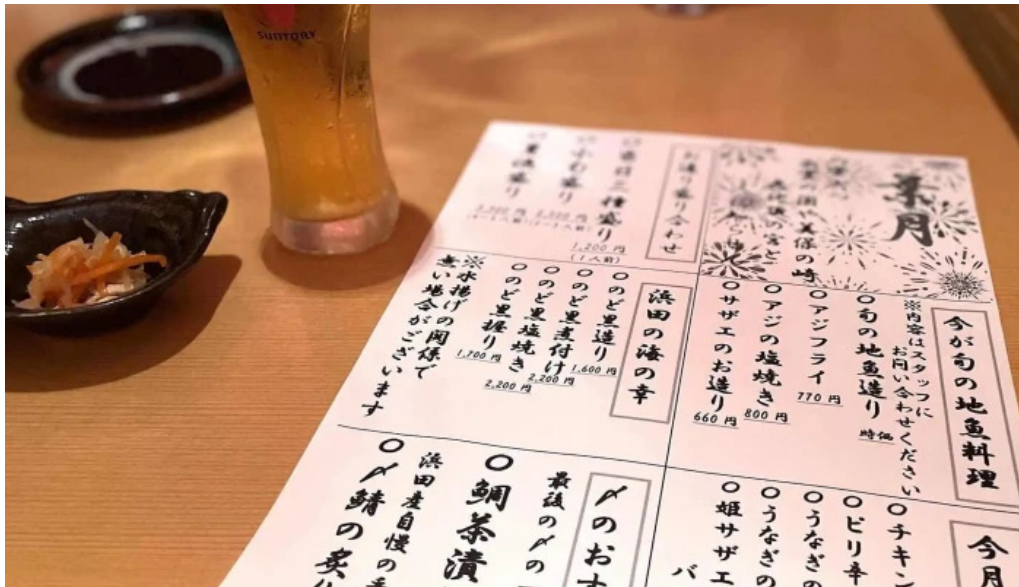
食彩美酒 小旬 comentario 5