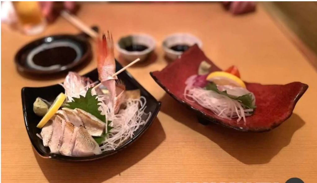
食彩美酒 小旬 料理飲み物