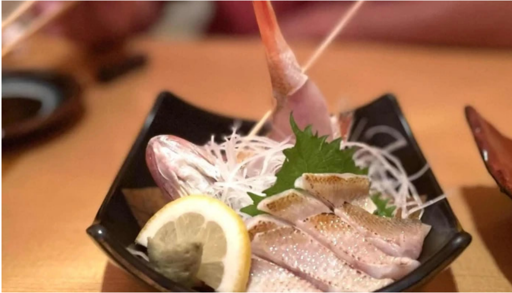
食彩美酒 小旬 comentario 7