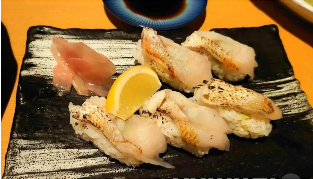
食彩美酒 小旬 シーフード