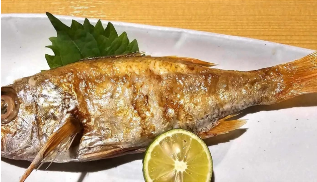
食彩美酒 小旬 comentario 1