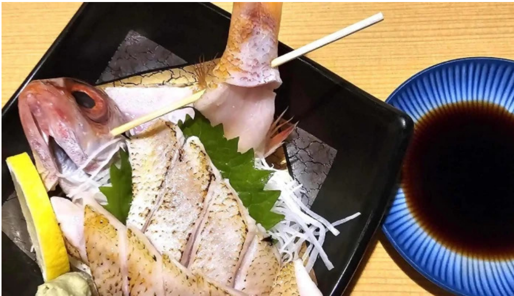
食彩美酒 小旬 comentario 2