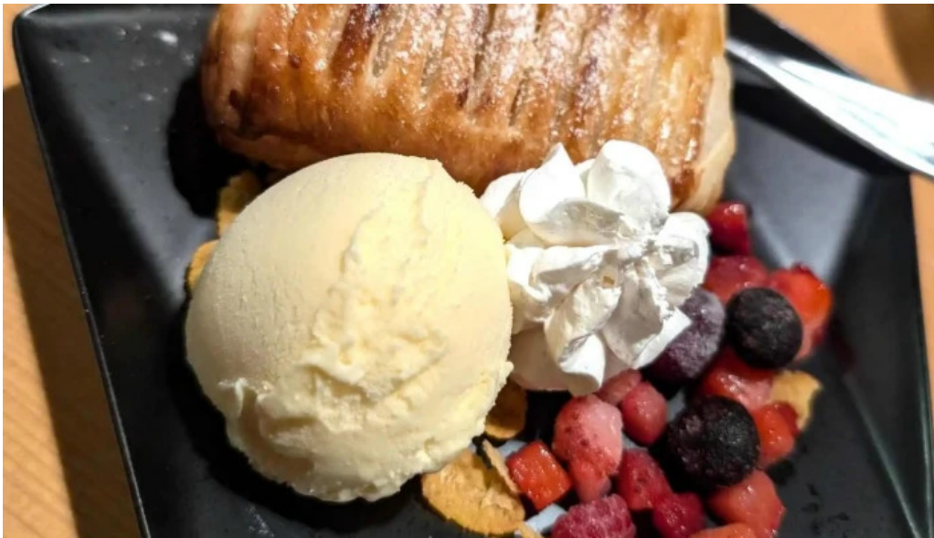
食彩美酒 小旬 すべて