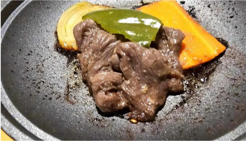
食彩美酒 小旬 comentario 3