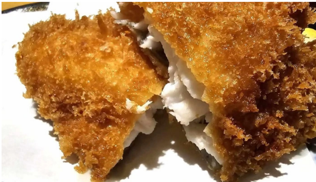
食彩美酒 小旬 comentario 4