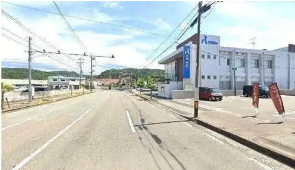
食彩美酒 小旬 ストリートビューと 360 ビュー