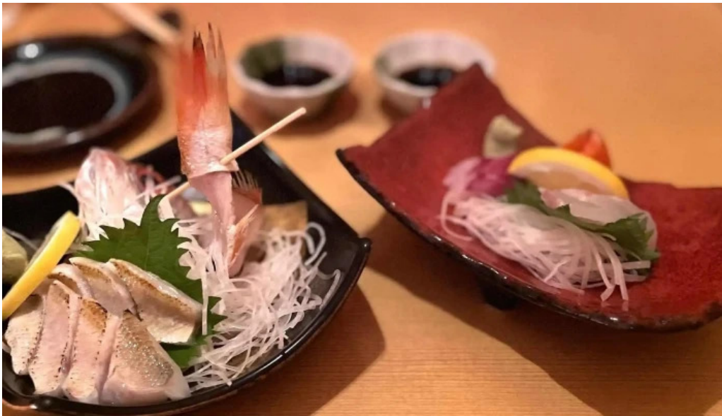
食彩美酒 小旬 comentario 6