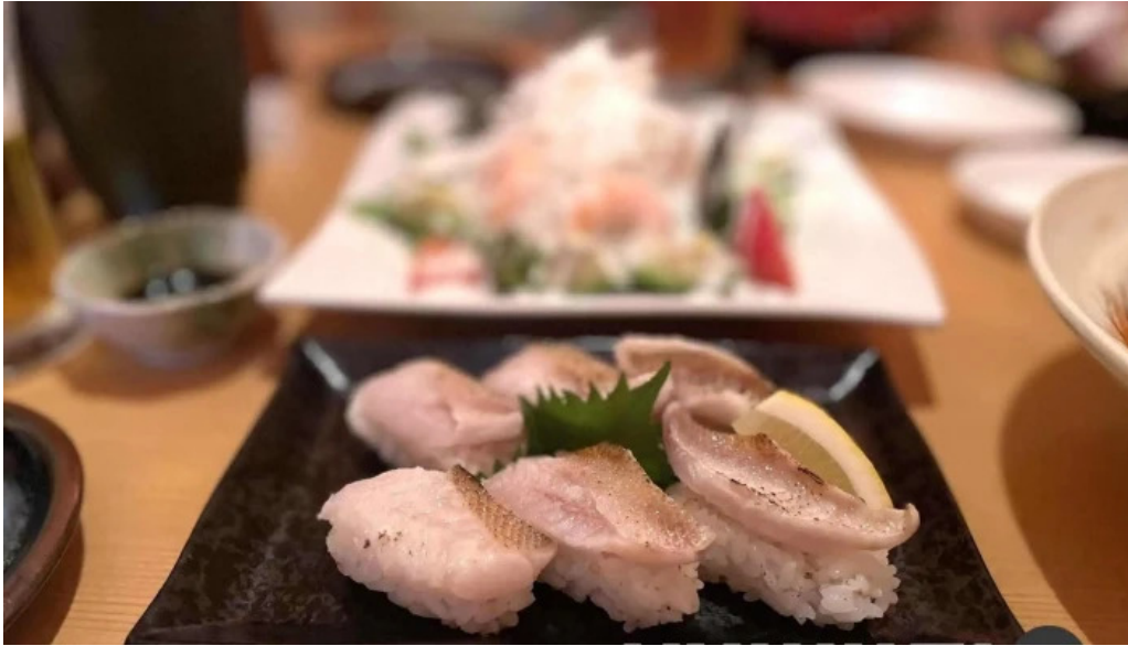
食彩美酒 小旬 寿司