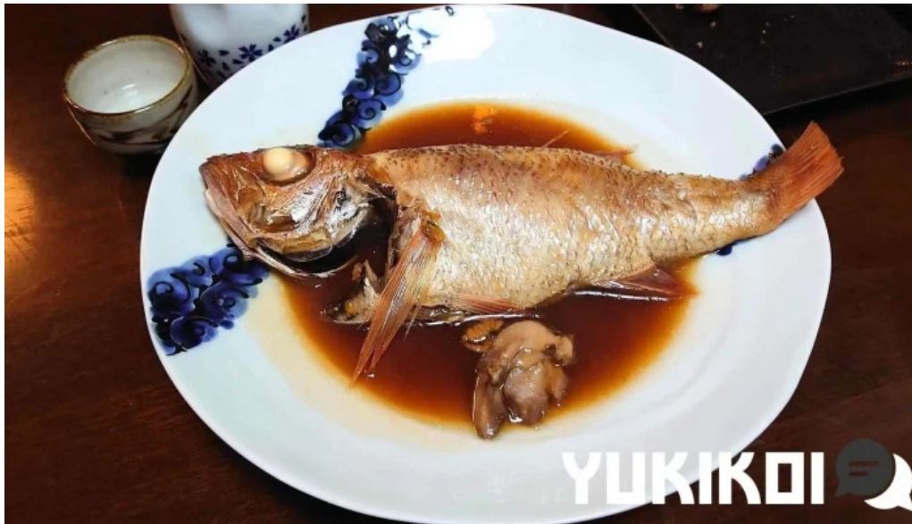
縄文そして長兵衛 魚類