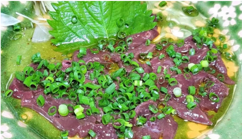
縄文そして長兵衛 comentario 2