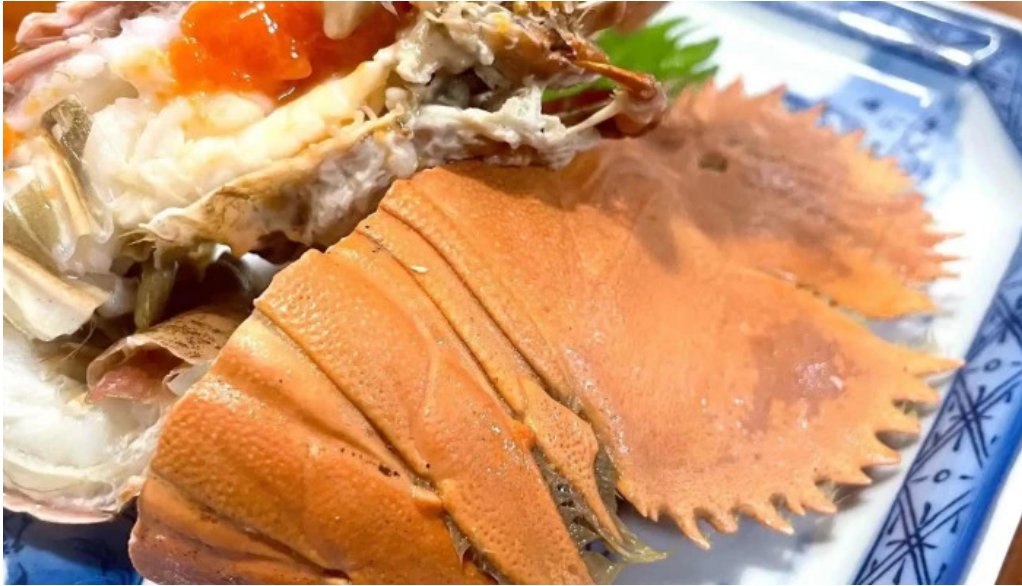
縄文そして長兵衛 comentario 3