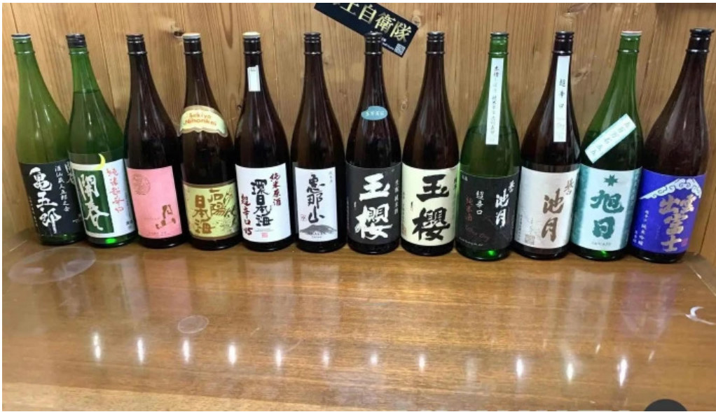
縄文そして長兵衛 すべて