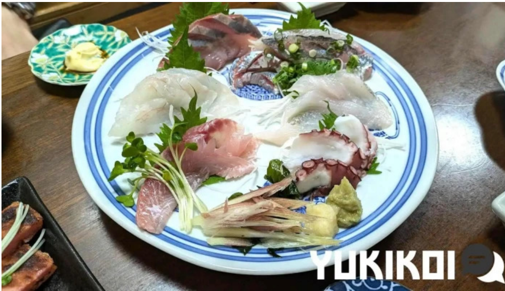
縄文そして長兵衛 刺身