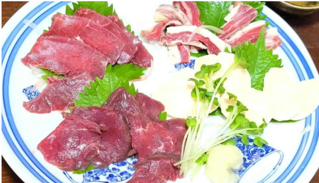
縄文そして長兵衛 comentario 1