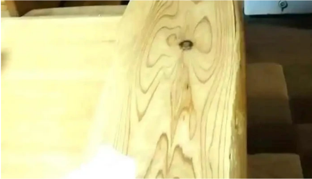
縄文そして長兵衛 動画