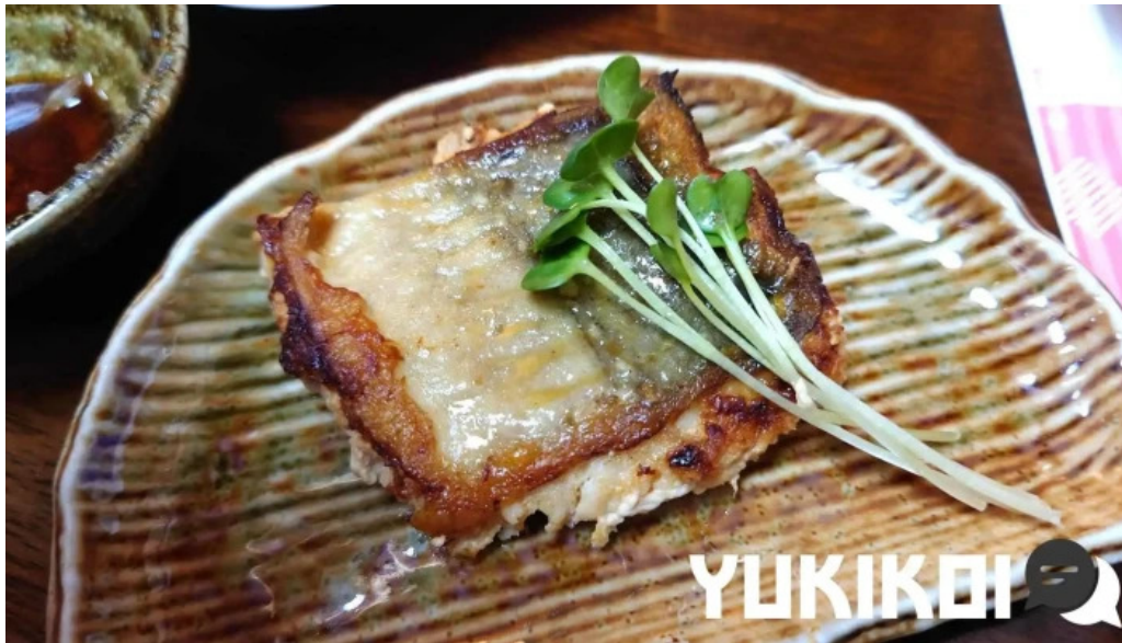
縄文そして長兵衛 豚ばら肉