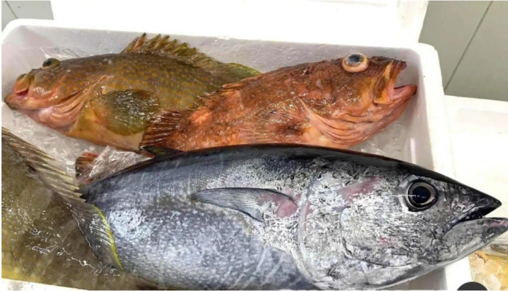
縄文そして長兵衛 最新