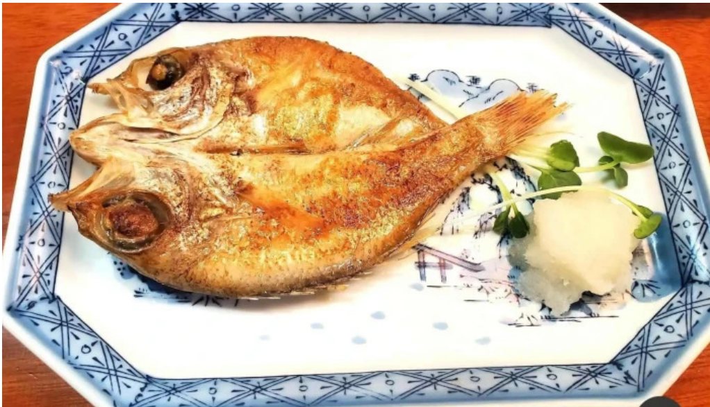
縄文そして長兵衛 料理飲み物