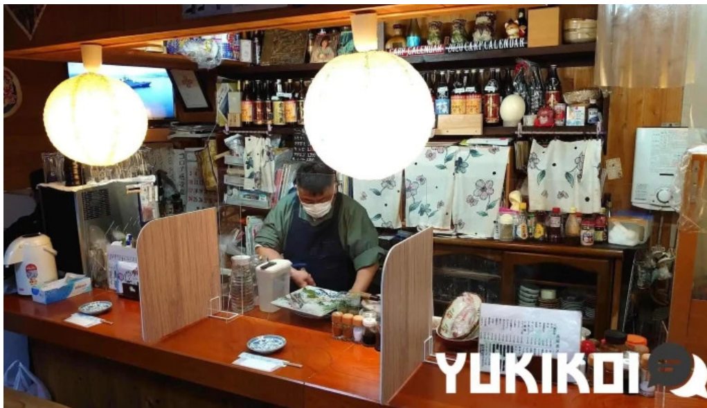
縄文そして長兵衛 雰囲気