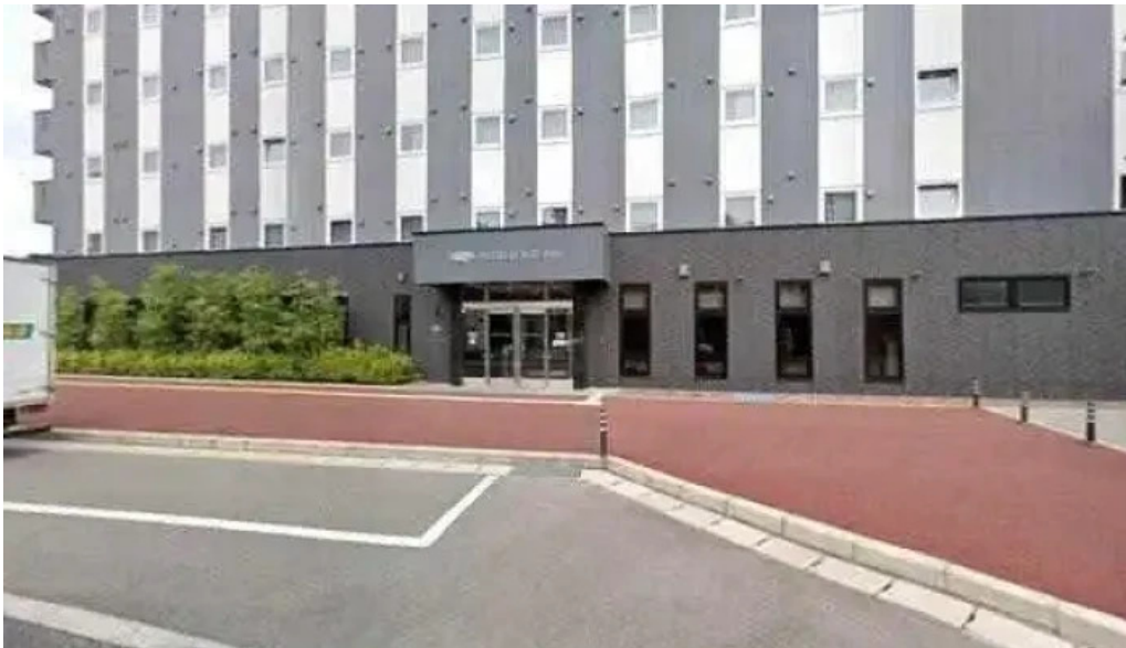
縄文そして長兵衛 ストリートビューと 360 ビュー