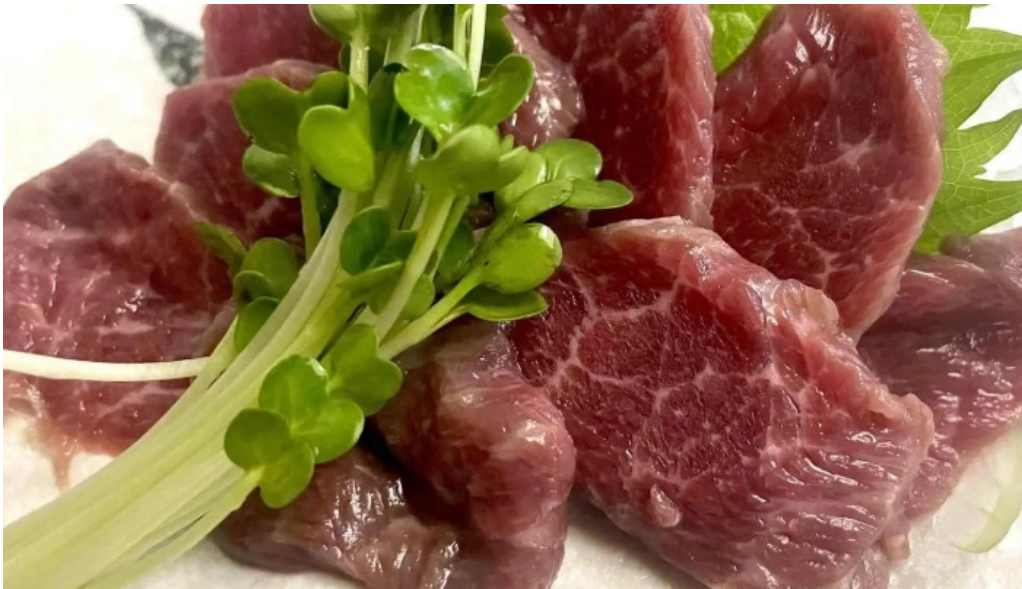
縄文そして長兵衛 comentario 4