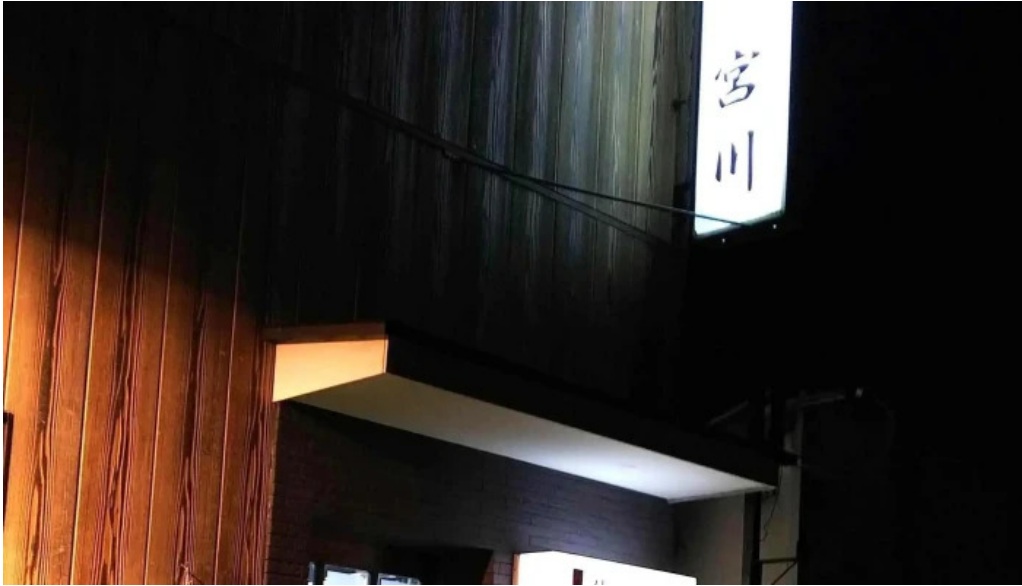
御食事処 宮川 comentario 7