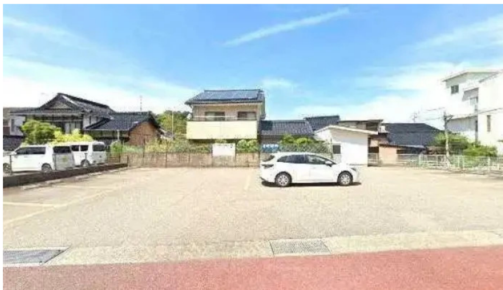
御食事処 宮川 ストリートビューと360ビュー