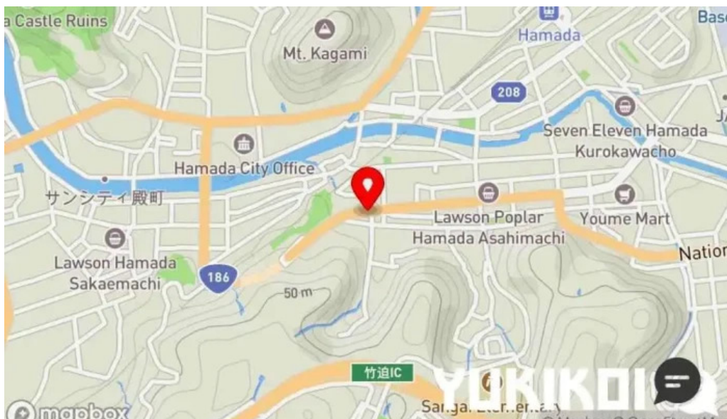
御食事処 宮川地図