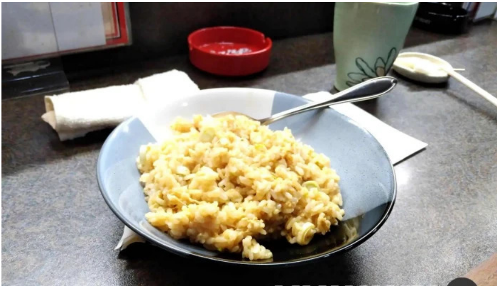
御食事処 宮川 料理飲み物