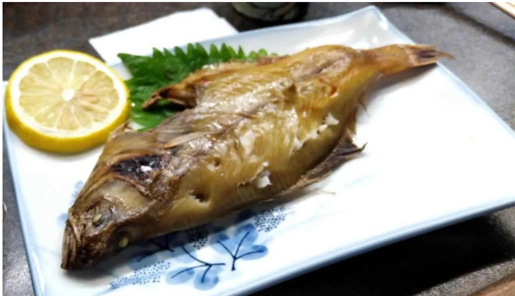
御食事処 宮川 comentario 5