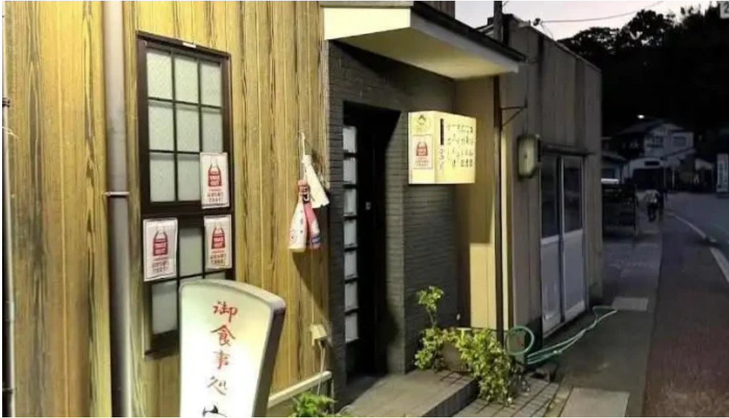
御食事処 宮川 浜田市