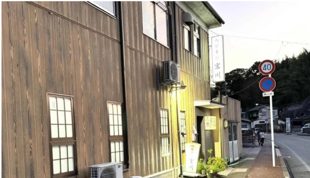
御食事処 宮川 comentario 1