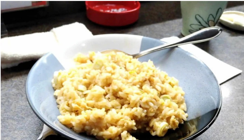
御食事処 宮川 comentario 6