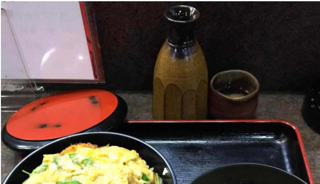
御食事処 宮川 comentario 8