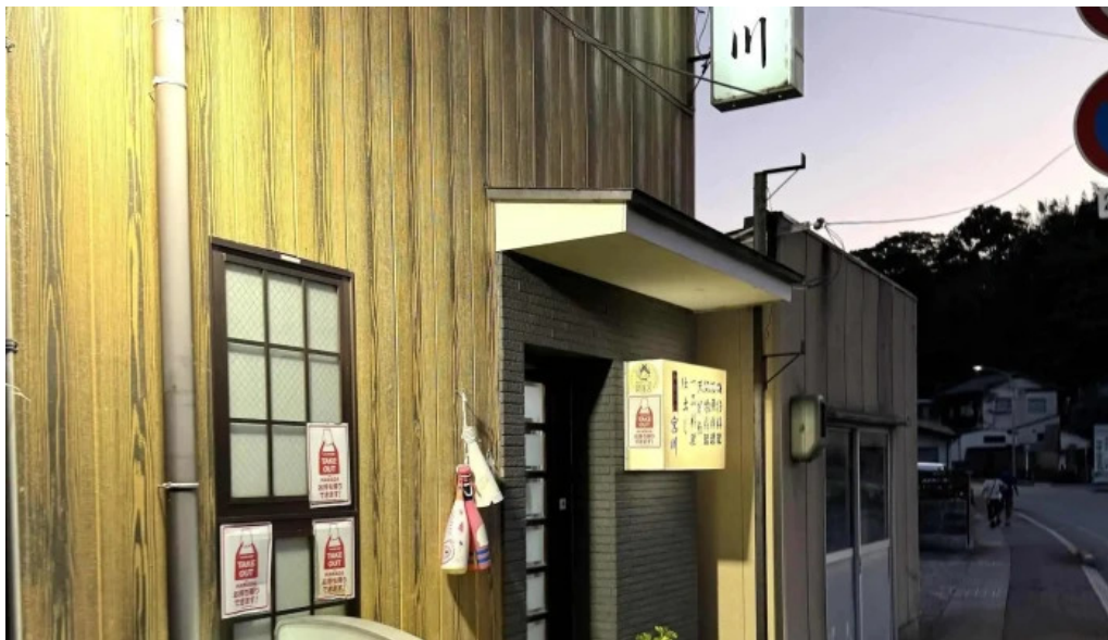
御食事処 宮川 comentario 2