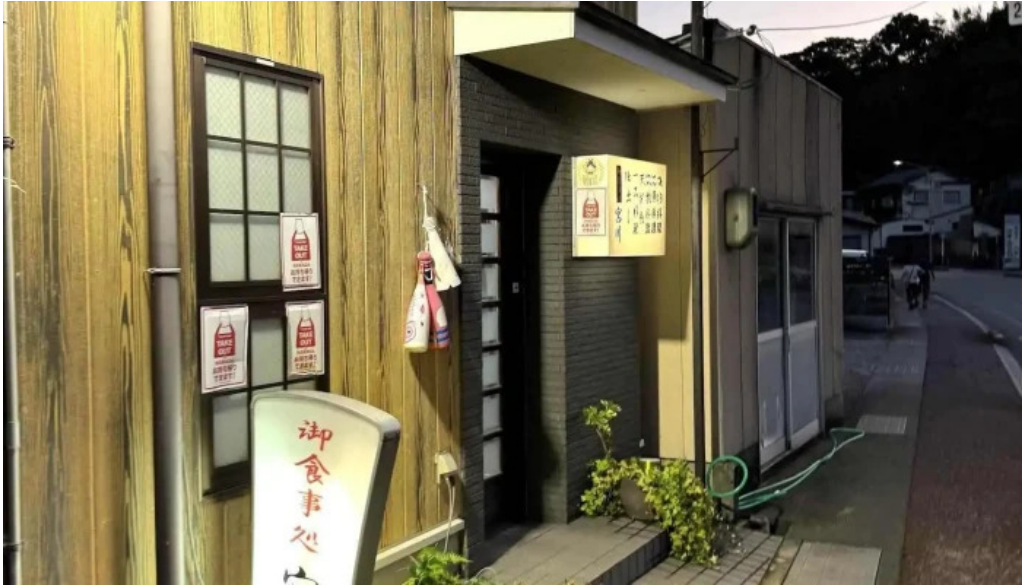
御食事処 宮川 すべて