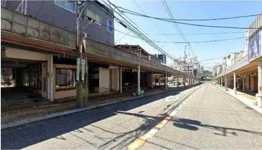
らるご ストリートビューと 360 ビュー