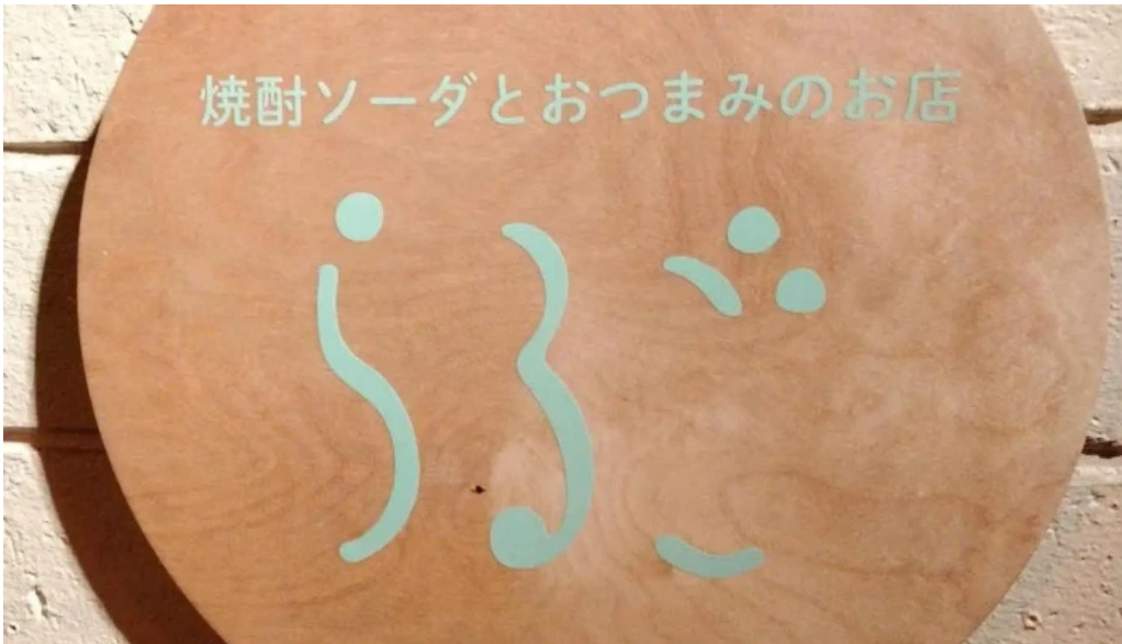
らるご オーナー提供