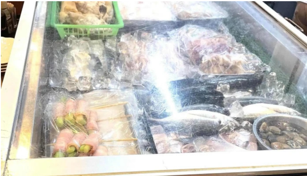
がしんたれ遊食処 comentario 4