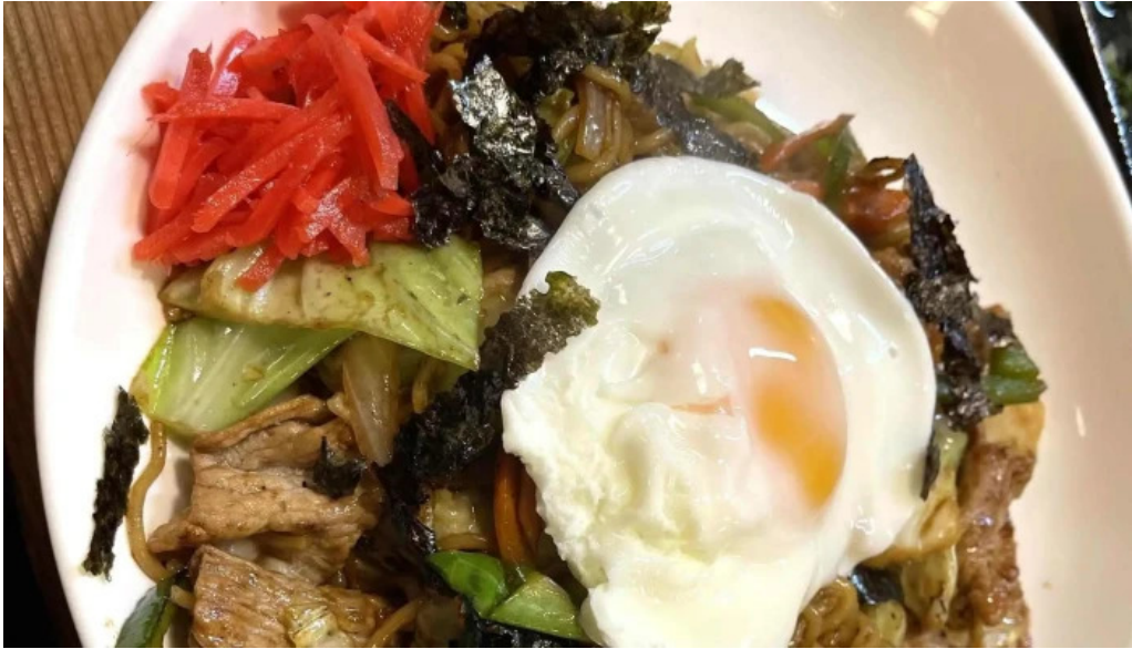
がしんたれ遊食処 comentario 7