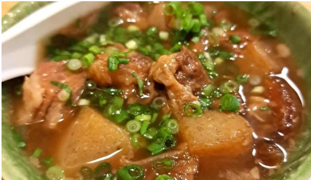
がしんたれ遊食処 スープ