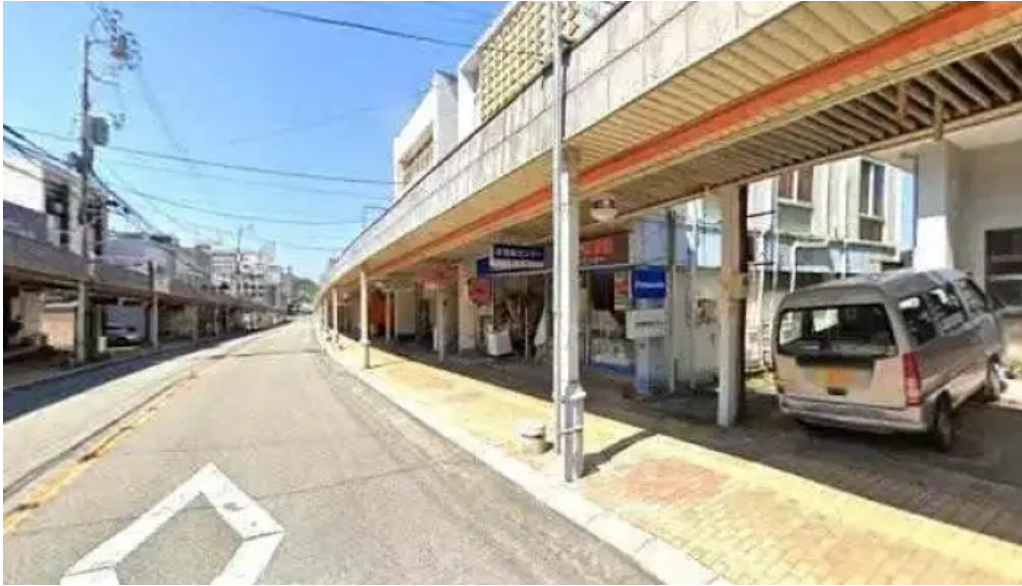
がしんたれ遊食処 ストリートビューと 360 ビュー