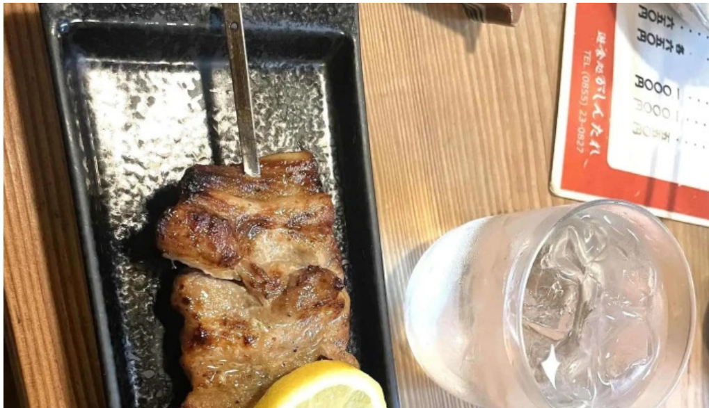
がしんたれ遊食処 comentario 1