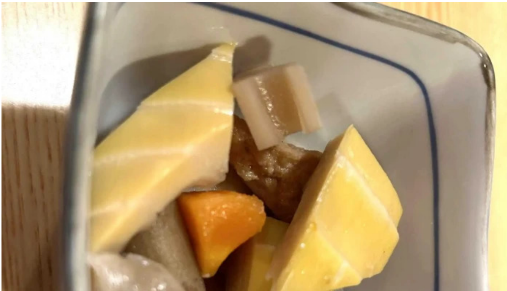
がしんたれ遊食処 comentario 9