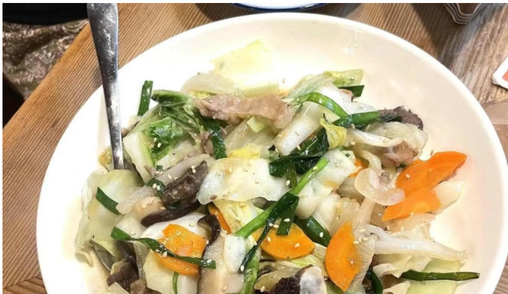
がしんたれ遊食処 comentario 2