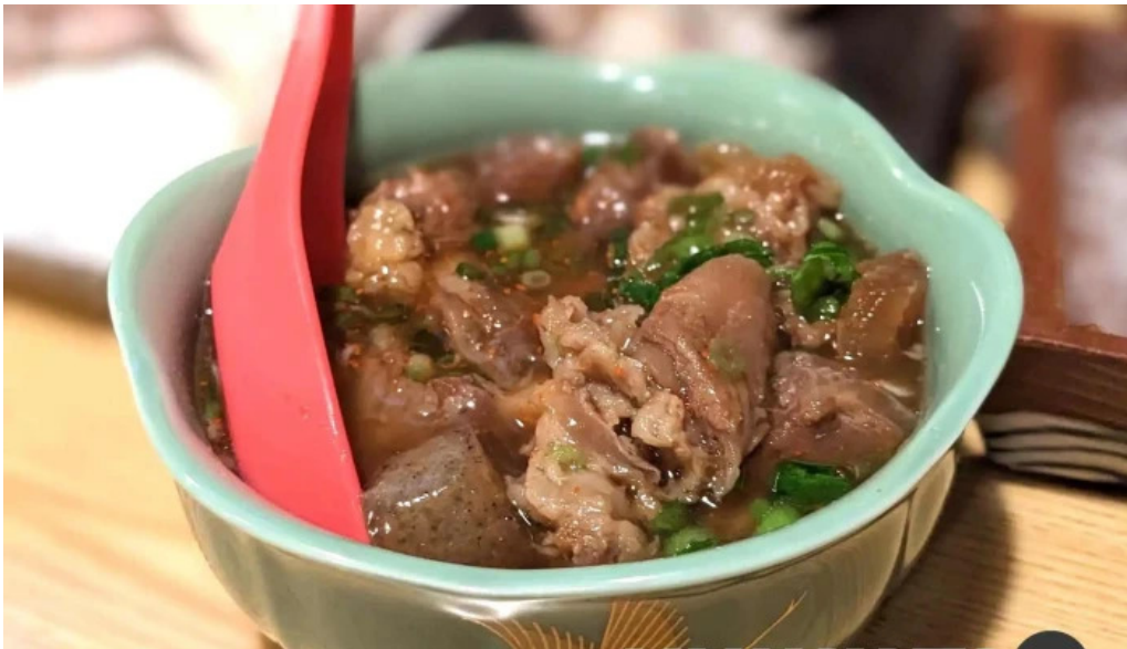
がしんたれ遊食処 料理飲み物