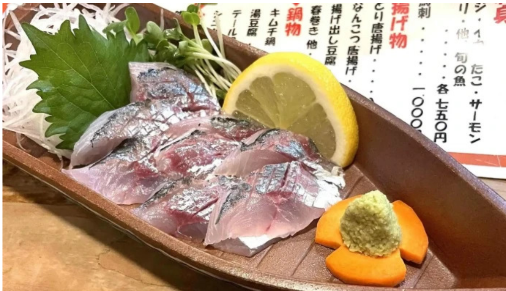
がしんたれ遊食処 comentario 3