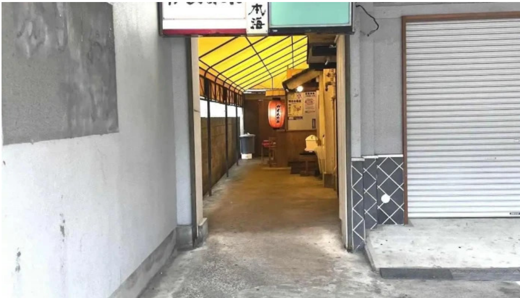
がしんたれ遊食処 すべて