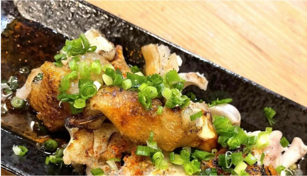
がしんたれ遊食処 comentario 5