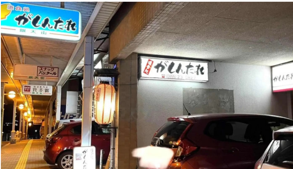
がしんたれ遊食処 comentario 8