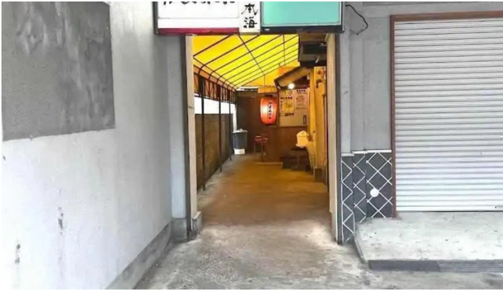
がしんたれ遊食処 浜田市