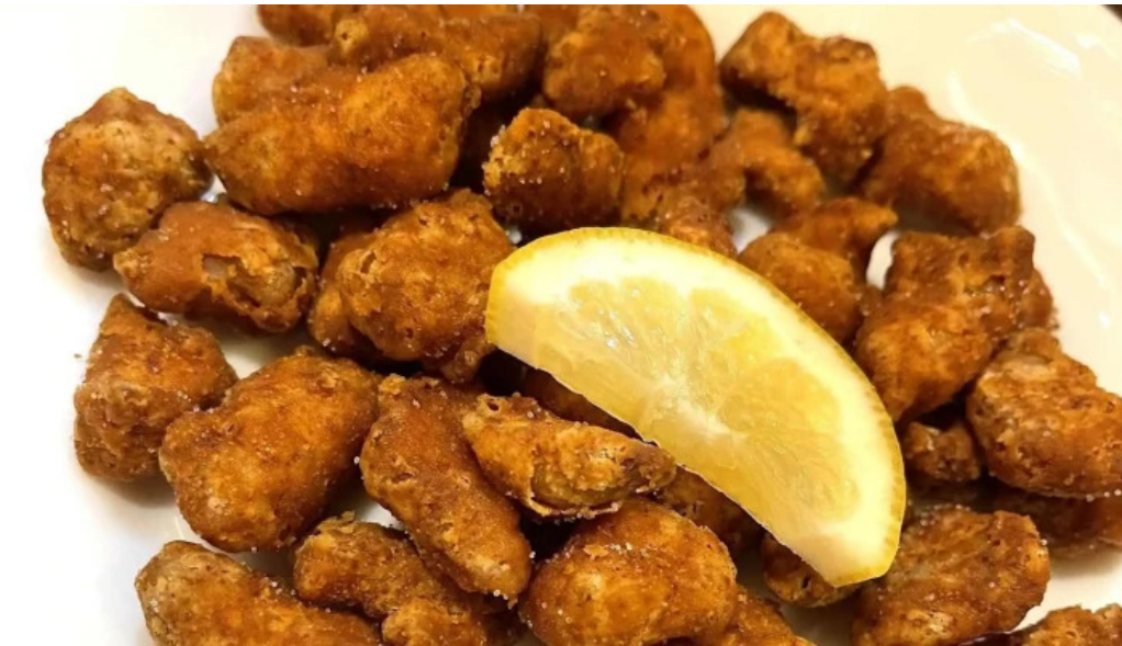
がしんたれ遊食処 comentario 6