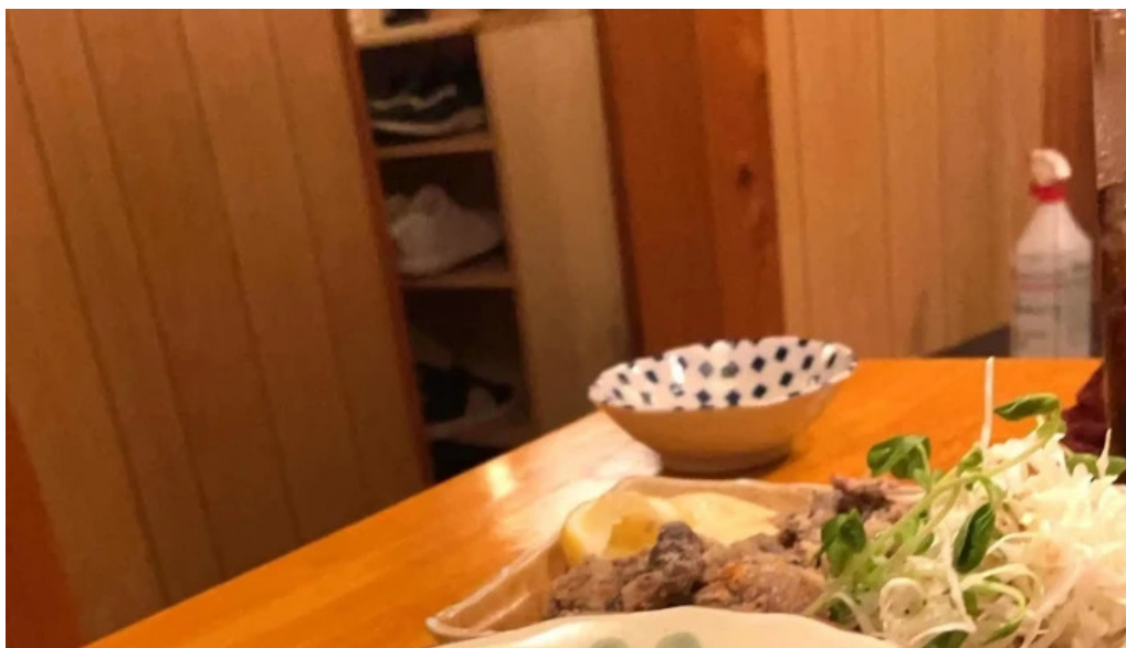
おいでや comentario 2