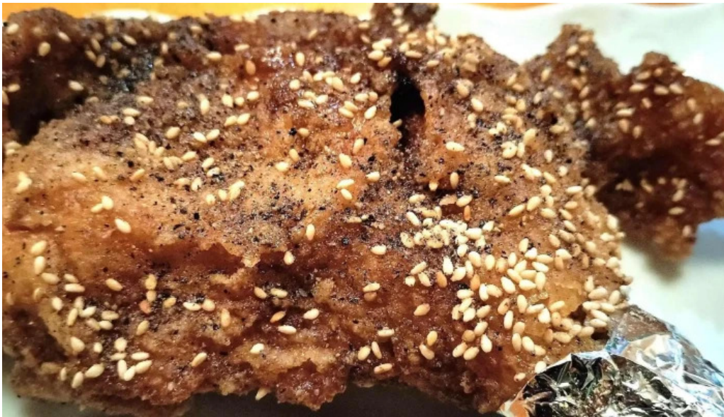
おいでや comentario 5