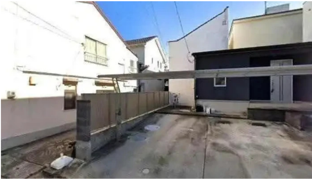
おいでや ストリートビューと 360 ビュー