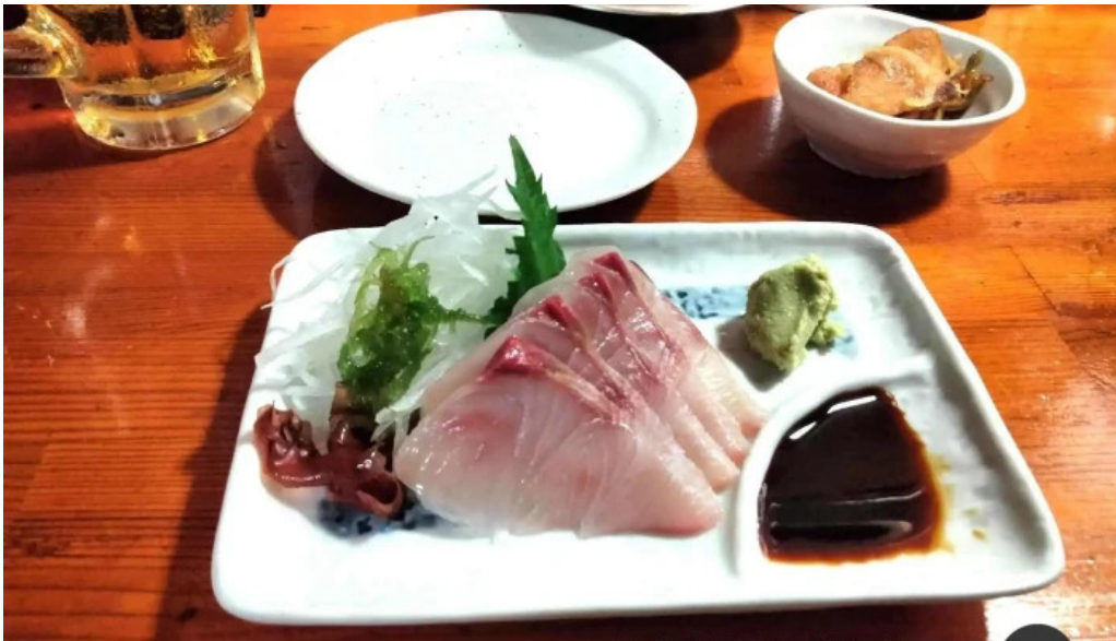
おいでや 料理飲み物