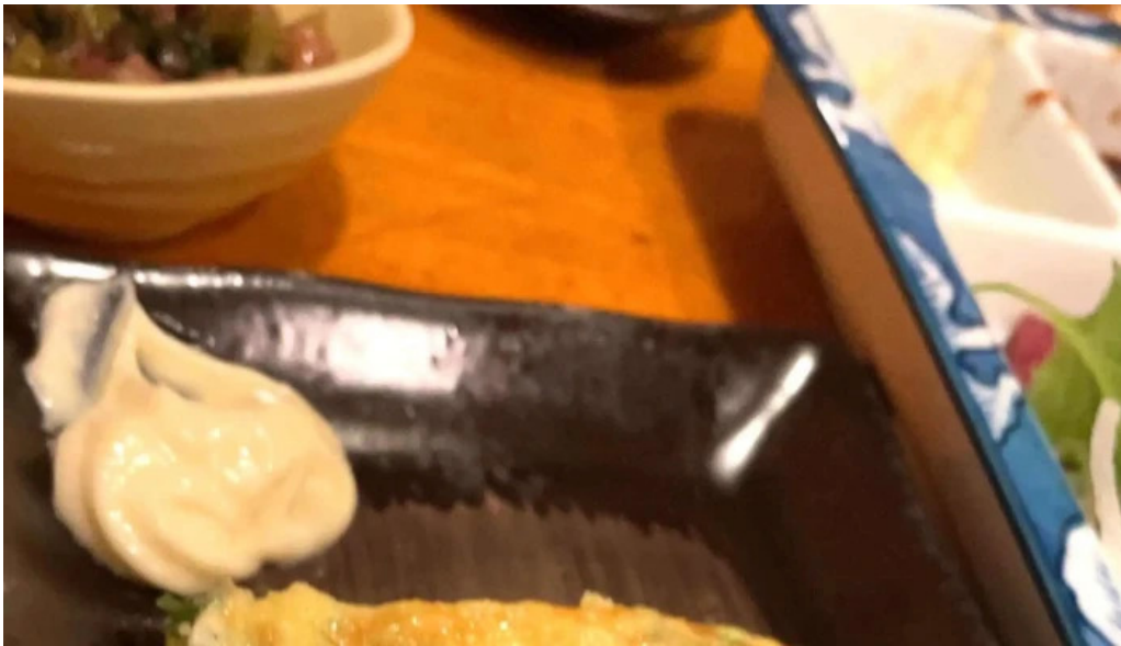
おいでや comentario 3