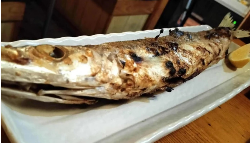
おいでや comentario 6