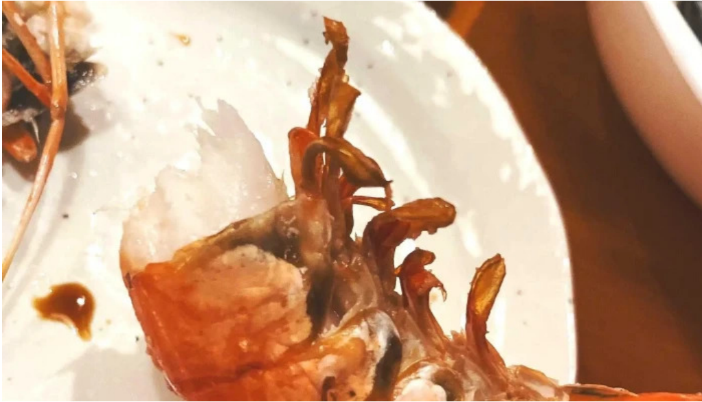
おいでや comentario 8