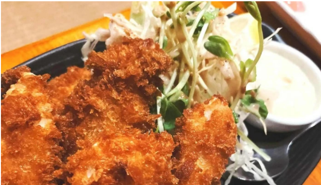
おいでや comentario 7