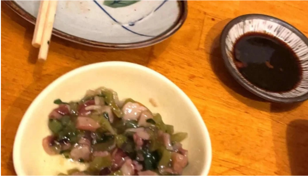
おいでや comentario 4