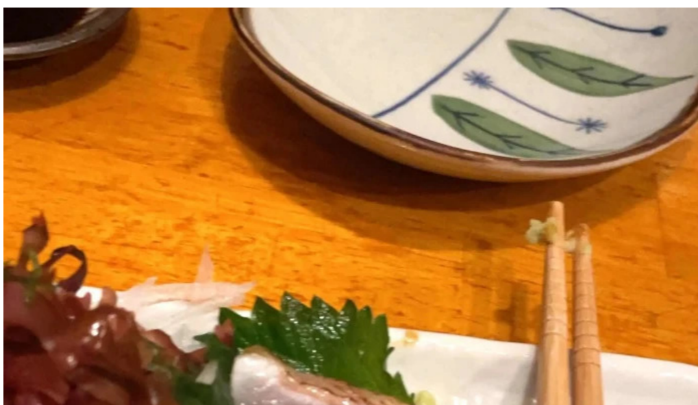
おいでや comentario 1