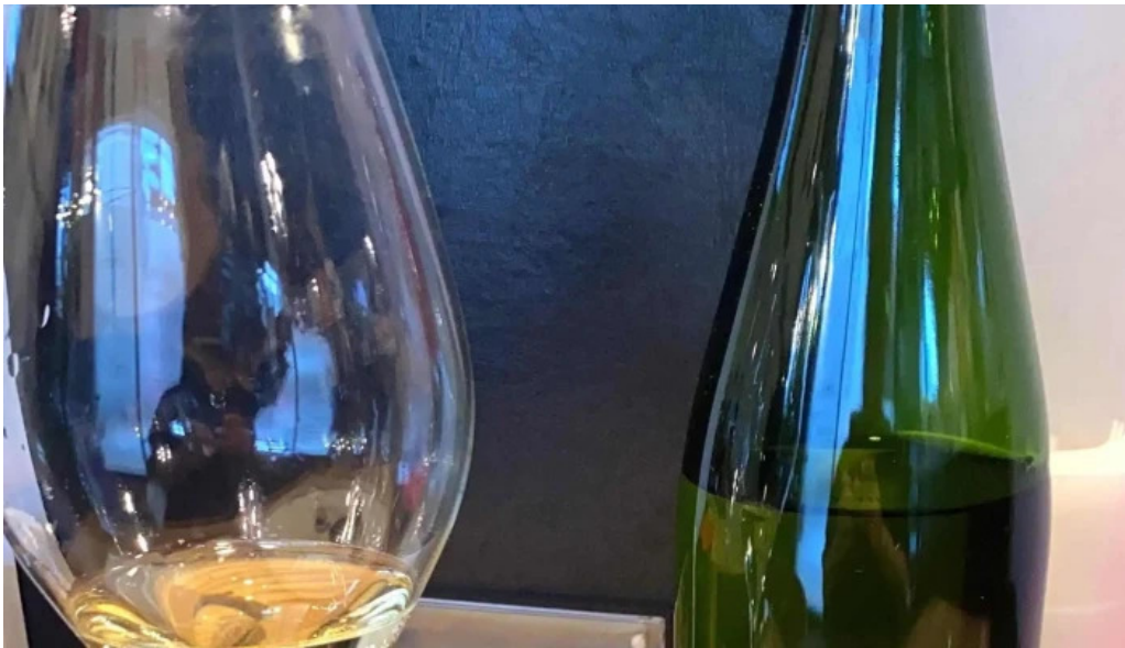
ボクのワイン キミのワイン comentario 5