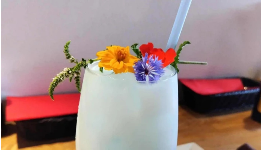
ボクのワイン キミのワイン comentario 4