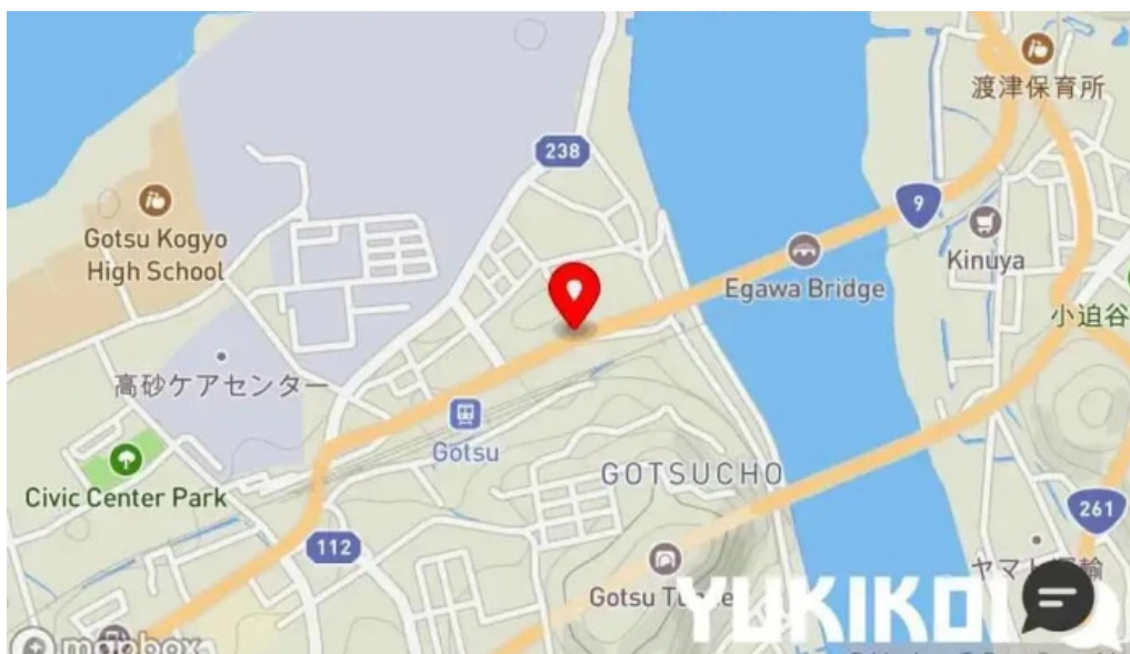
ボクのワイン キミのワイン地図