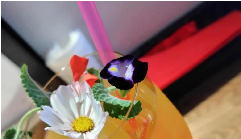
ボクのワイン キミのワイン comentario 3