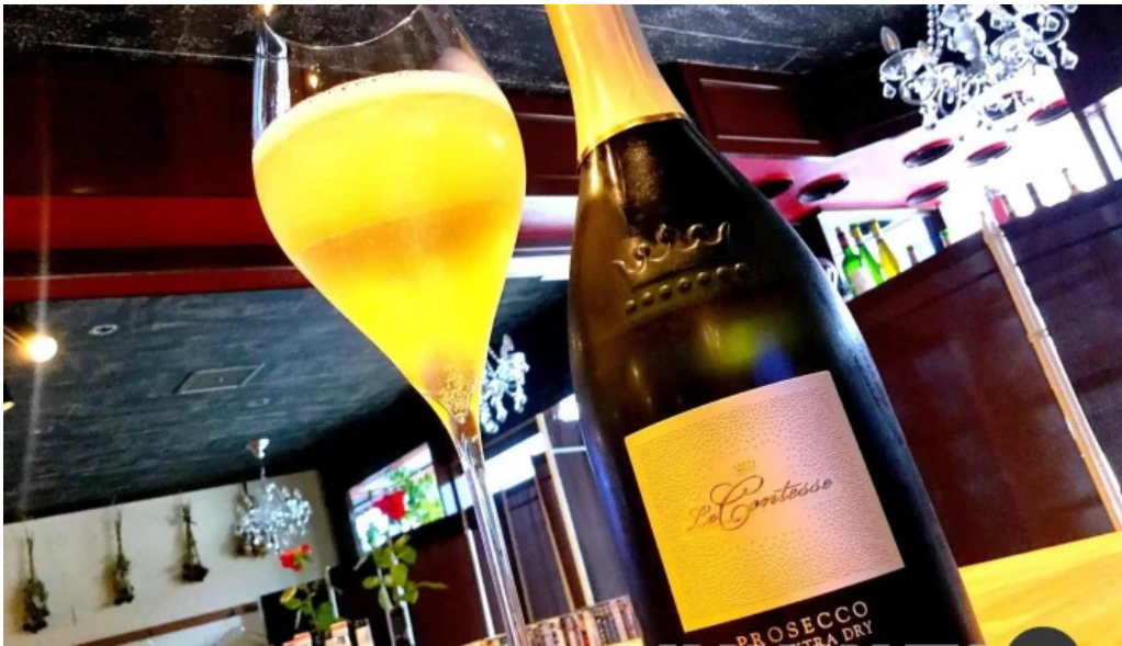
ボクのワイン キミのワイン シャンパン