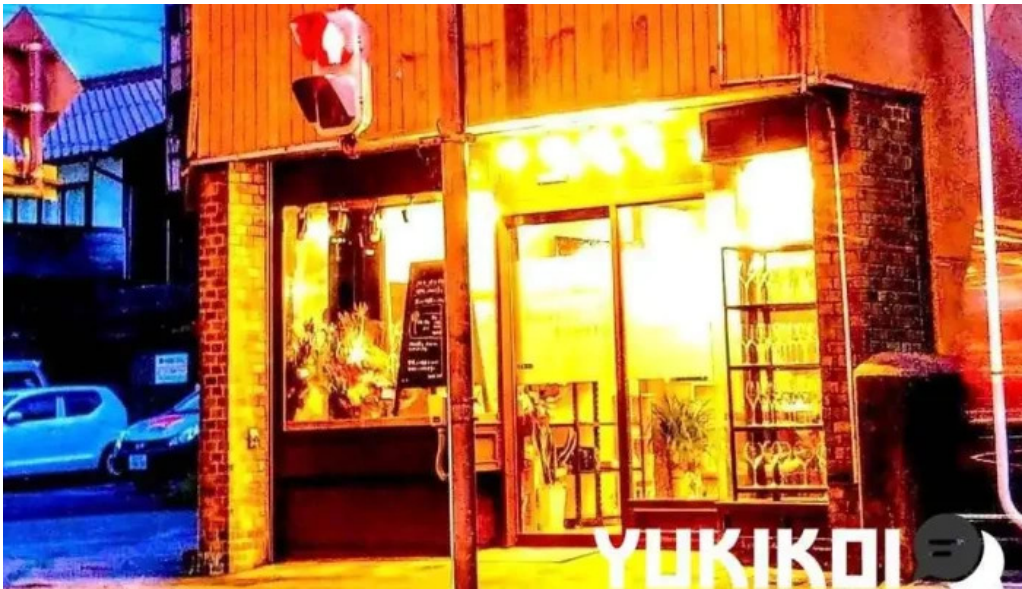
ボクのワイン キミのワイン すべて