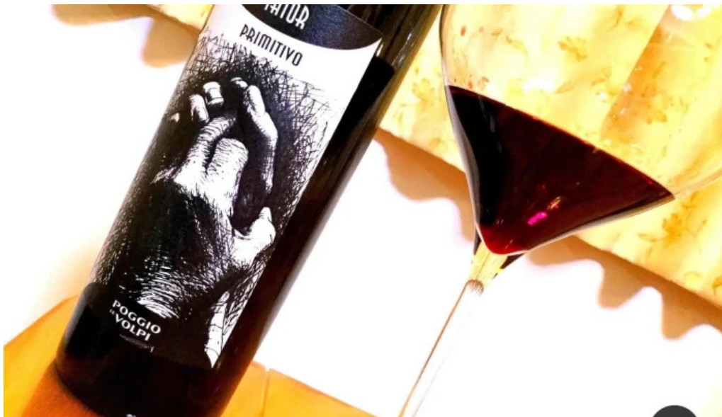
ボクのワイン キミのワイン ワイン