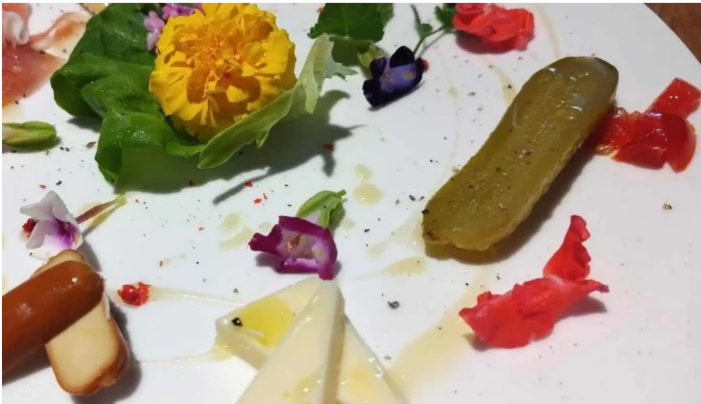
ボクのワイン キミのワイン comentario 1