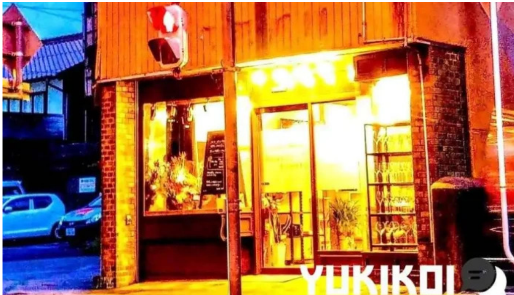
ボクのワイン キミのワイン 江津市