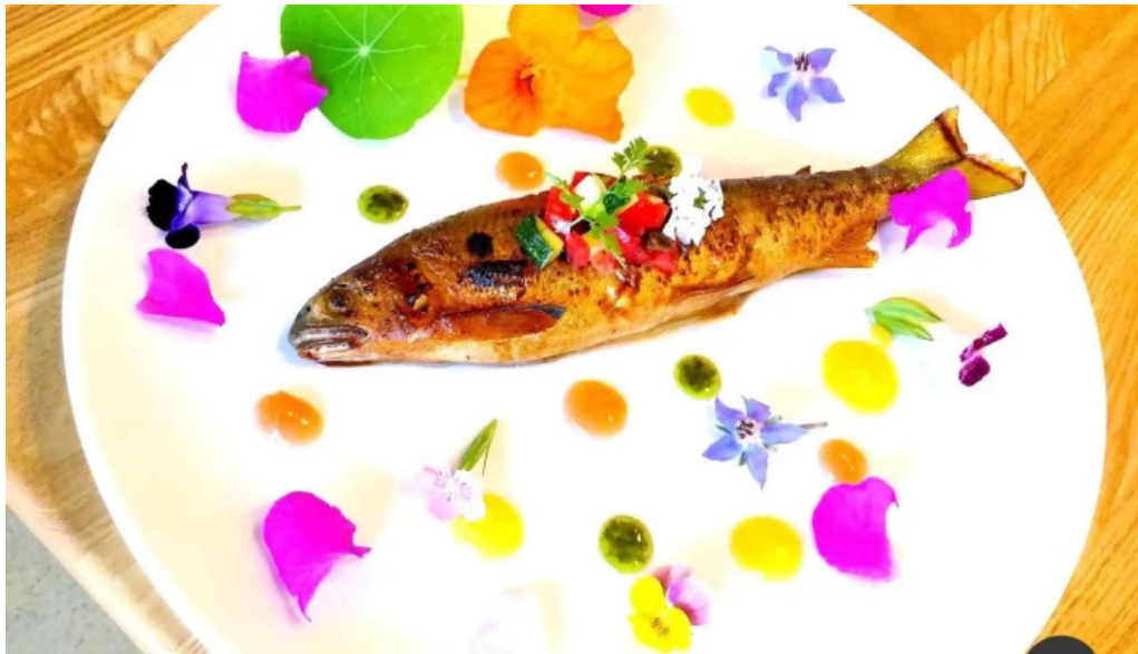
ボクのワイン キミのワイン 魚類