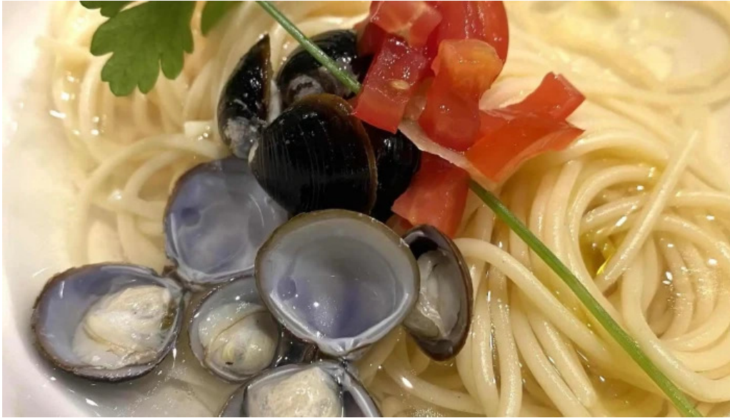
ボクのワイン キミのワイン comentario 6