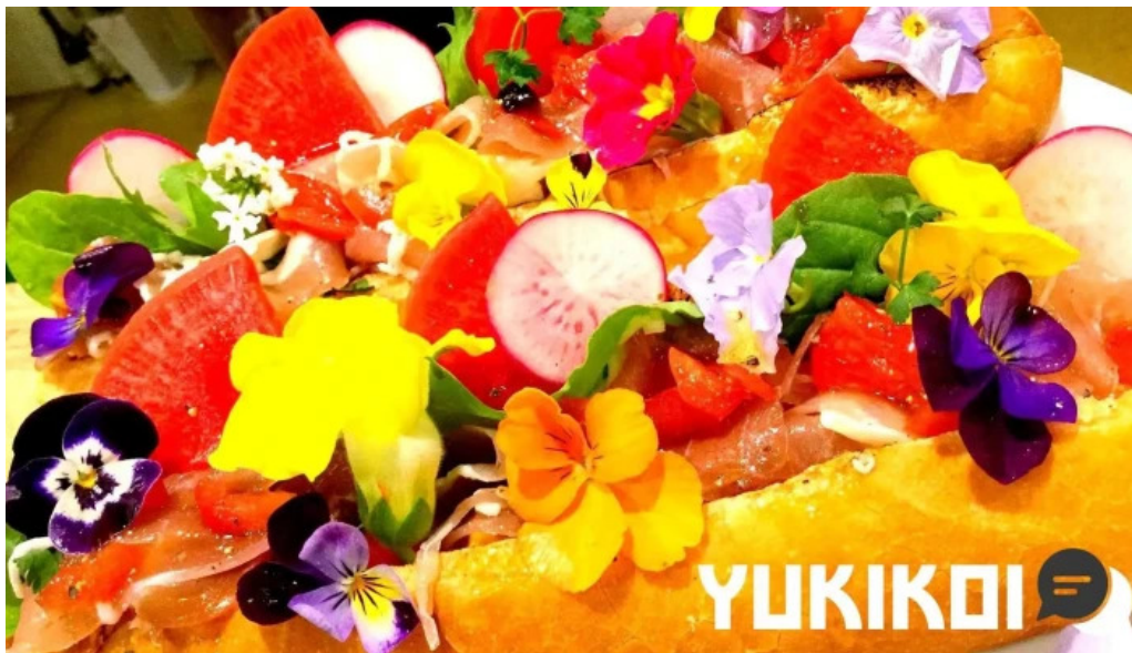
ボクのワイン キミのワイン 料理飲み物