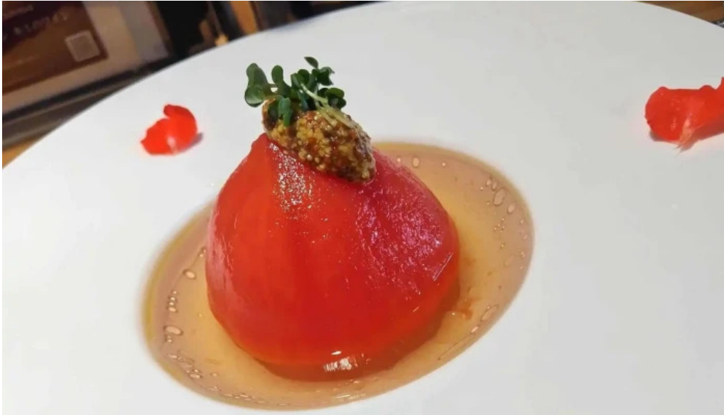
ボクのワイン キミのワイン comentario 2