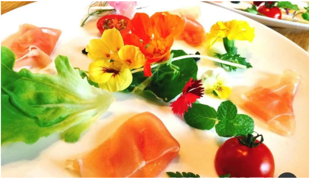
ボクのワイン キミのワイン オーナー提供