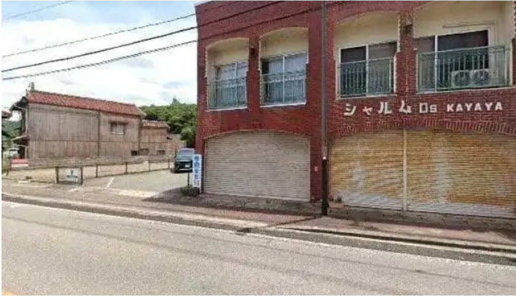
ボクのワイン キミのワイン ストリートビューと 360 ビュー