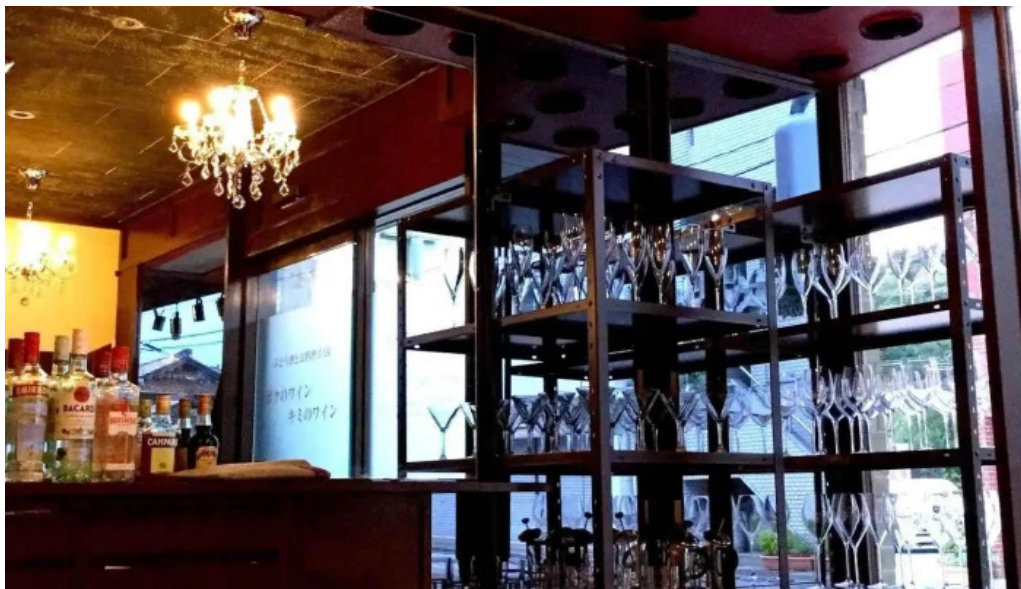
ボクのワイン キミのワイン 雰囲気