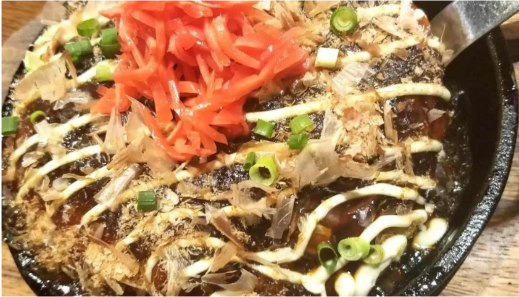
岩釜焼 喜楽 instagram