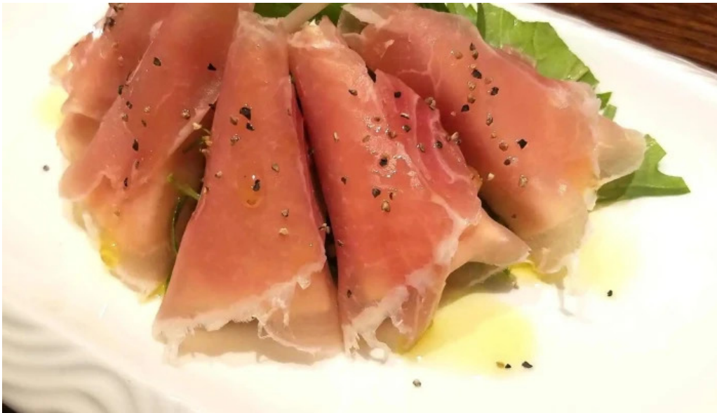
炉ばた焼 喜楽 ウェブサイト