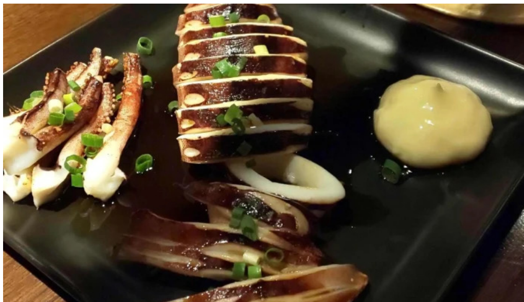
炉ばた焼 喜楽 行き方