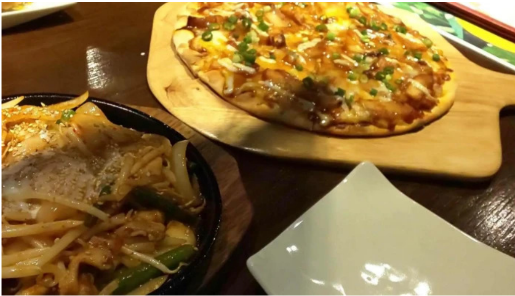
炉ばた焼 喜楽 カタログ