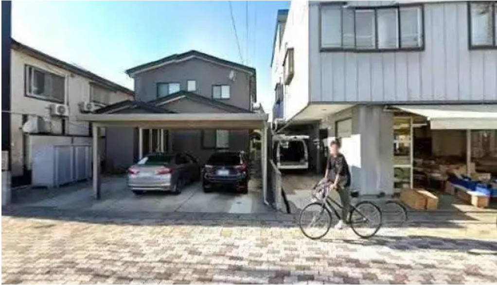
炉ばた焼 喜楽 柏崎市