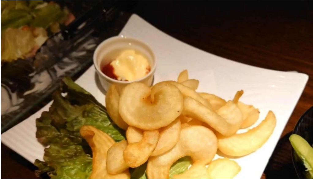
炉ばた焼 喜楽 スコア