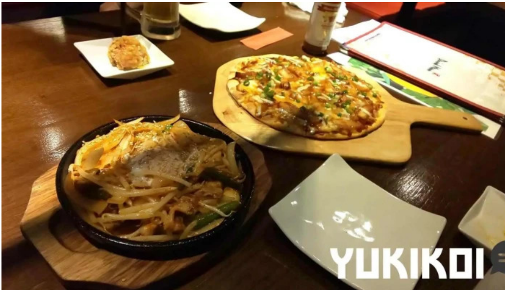
炉ばた焼 喜楽 料理飲み物