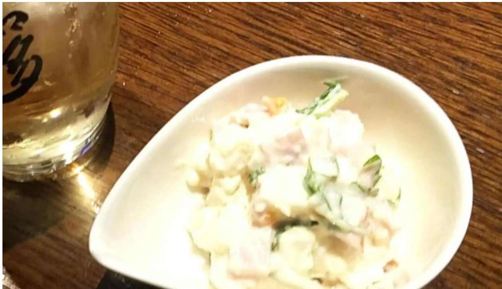
炉ばた焼 喜楽 割引