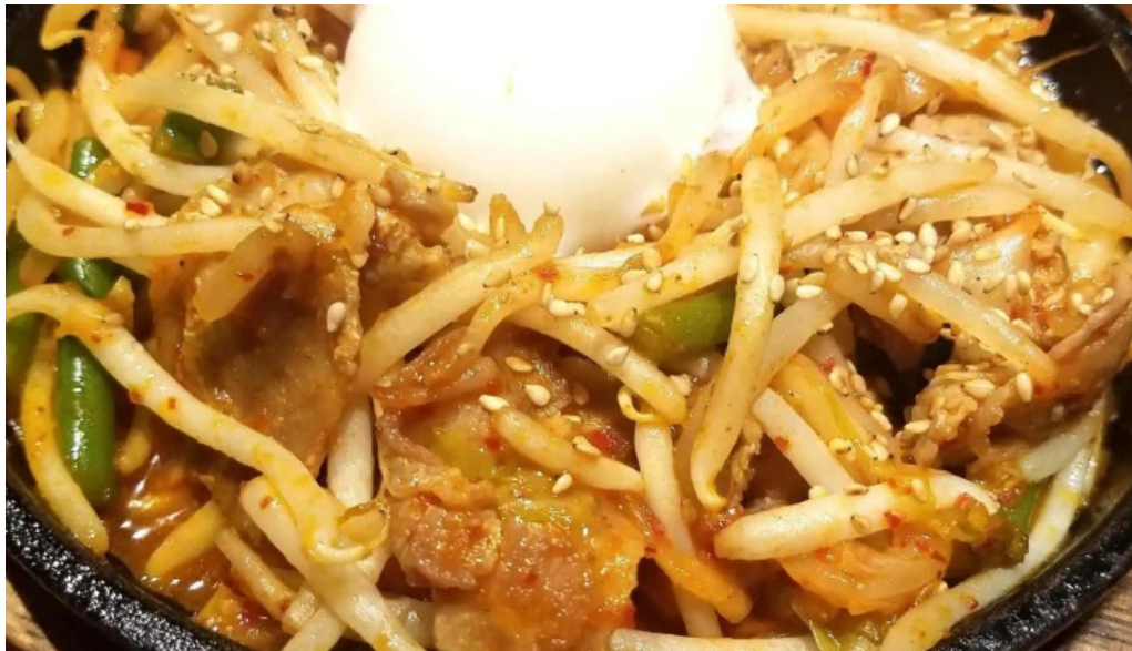
炉ばた焼 喜楽 写真