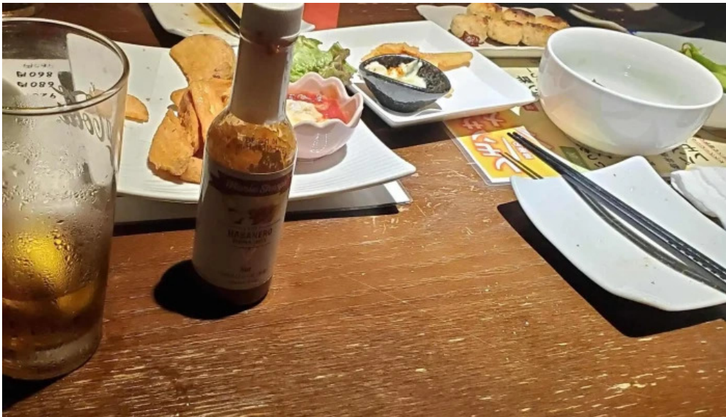
炉ばた焼 喜楽 コメント