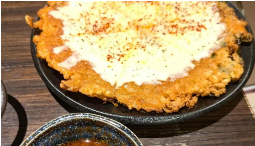
鉄板鍋づくし 枚方本店 行き方