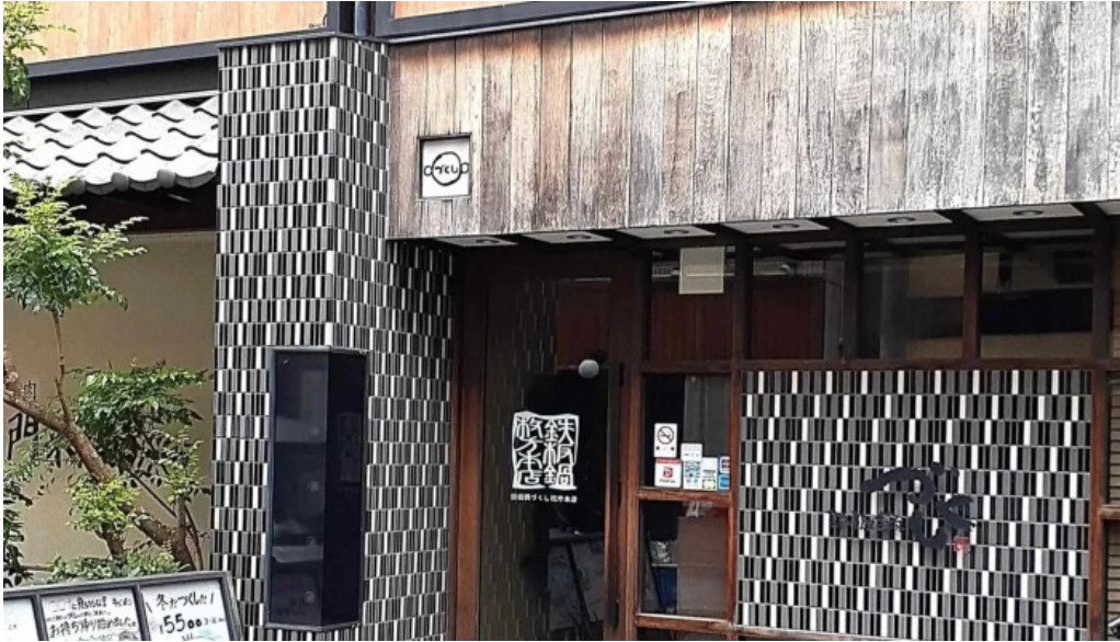
鉄板鍋づくし 枚方本店 営業時間