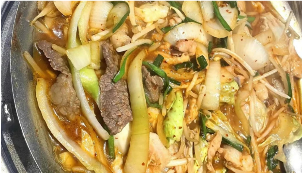
鉄板鍋づくし 枚方本店 動画