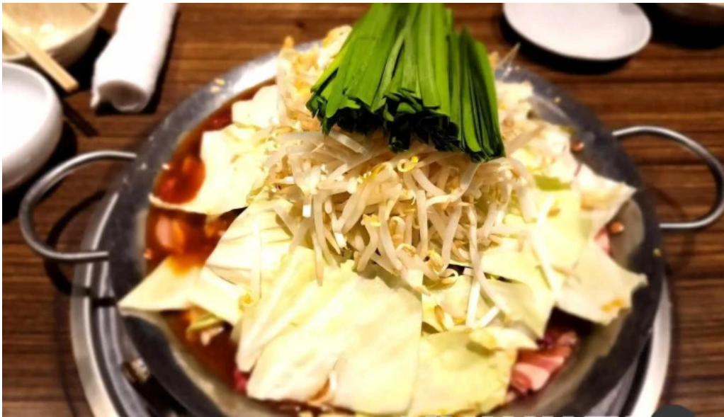
鉄板鍋づくし 枚方本店 料理飲み物