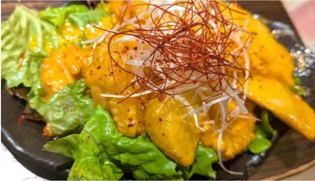
鉄板鍋づくし 枚方本店 エリア