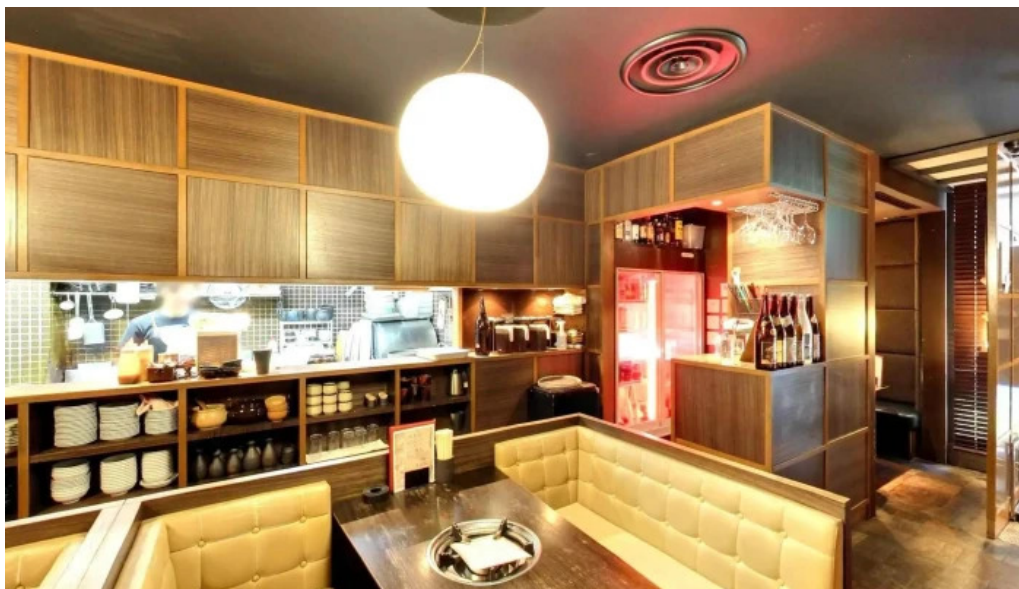
鉄板鍋づくし 枚方本店 雰囲気