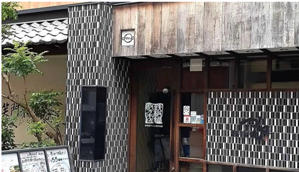
鉄板鍋づくし 枚方本店 カタログ