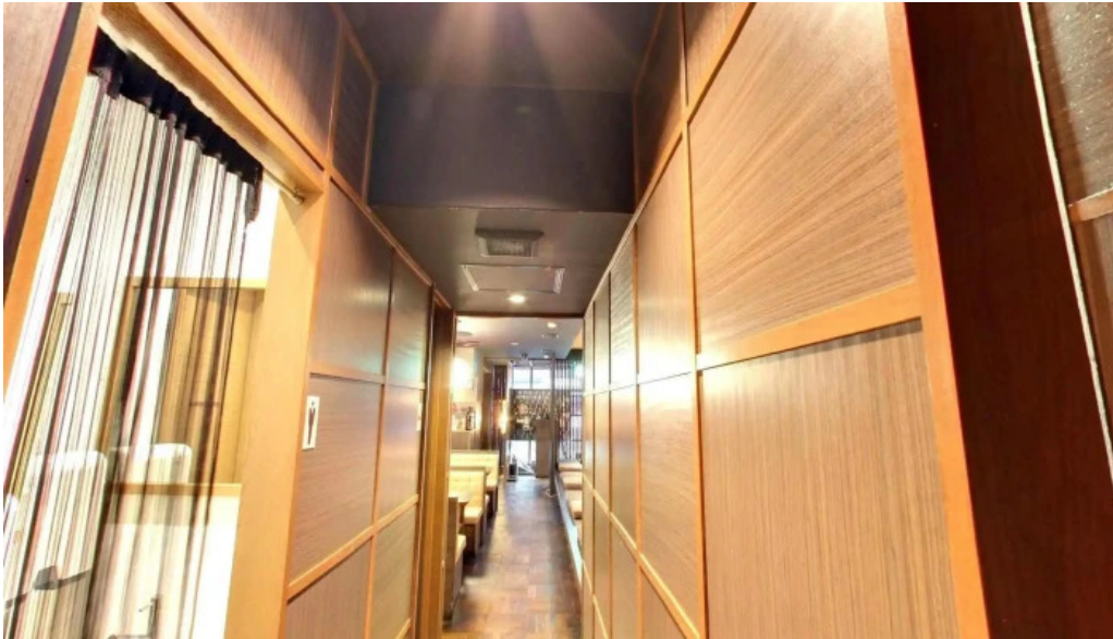
鉄板鍋づくし 枚方本店 枚方市