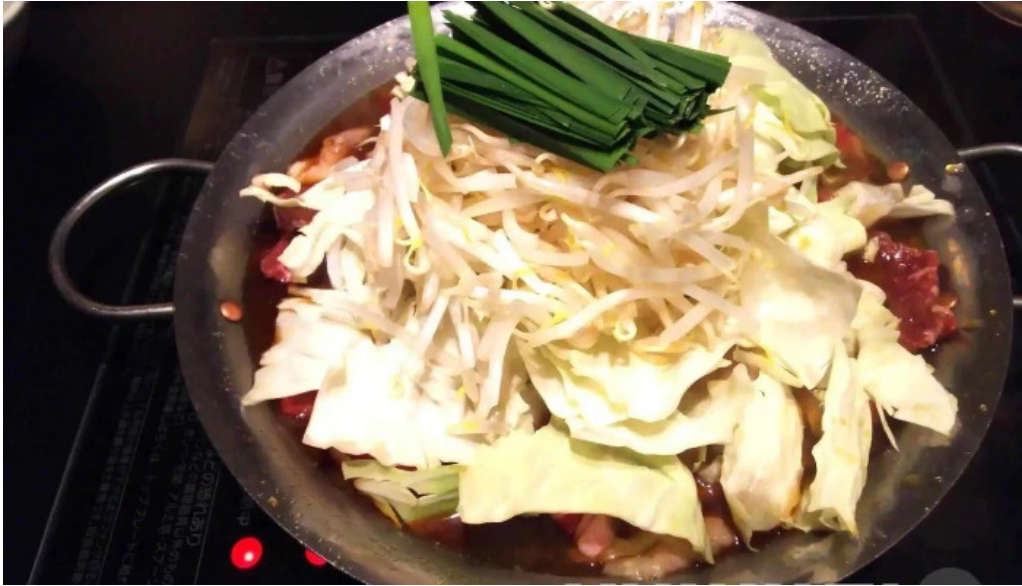
鉄板鍋づくし 枚方本店 鍋料理