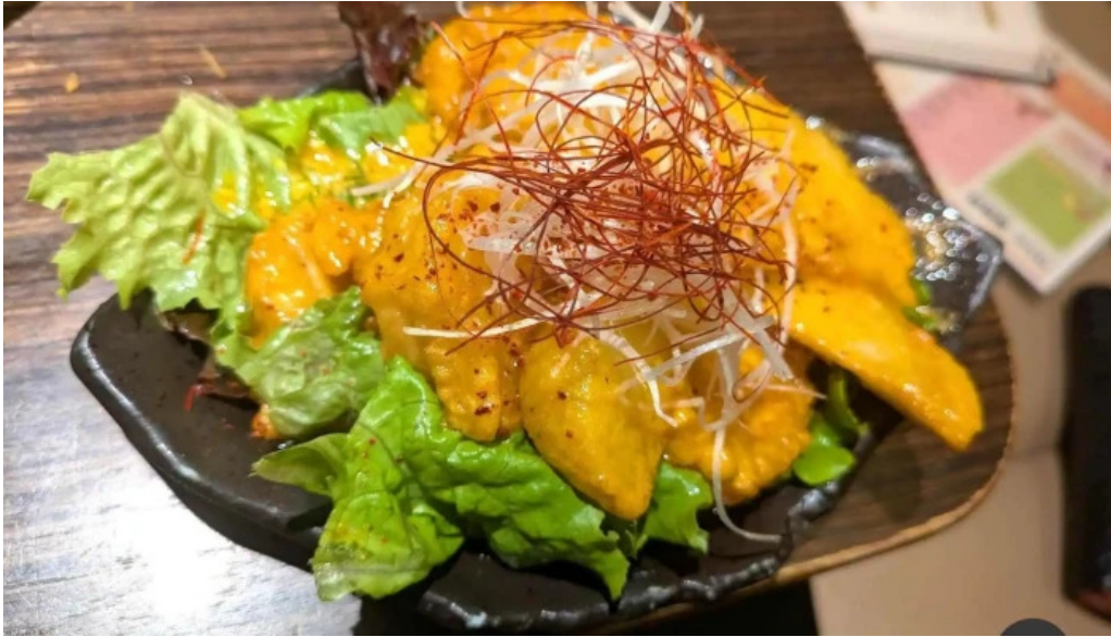
鉄板鍋づくし 枚方本店 最新