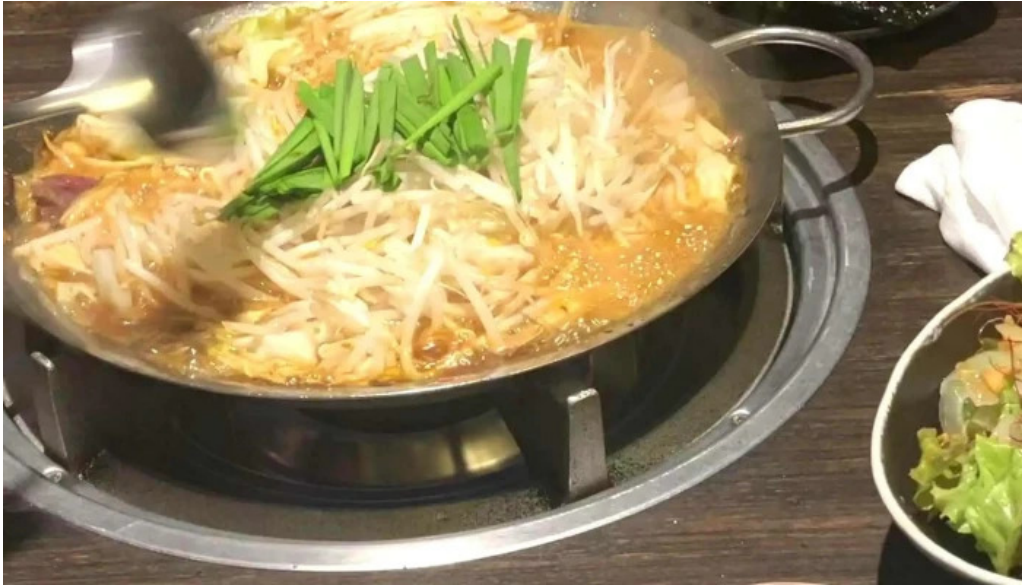
鉄板鍋づくし 枚方本店 番号