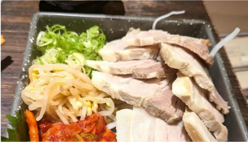
鉄板鍋づくし 枚方本店 所在地