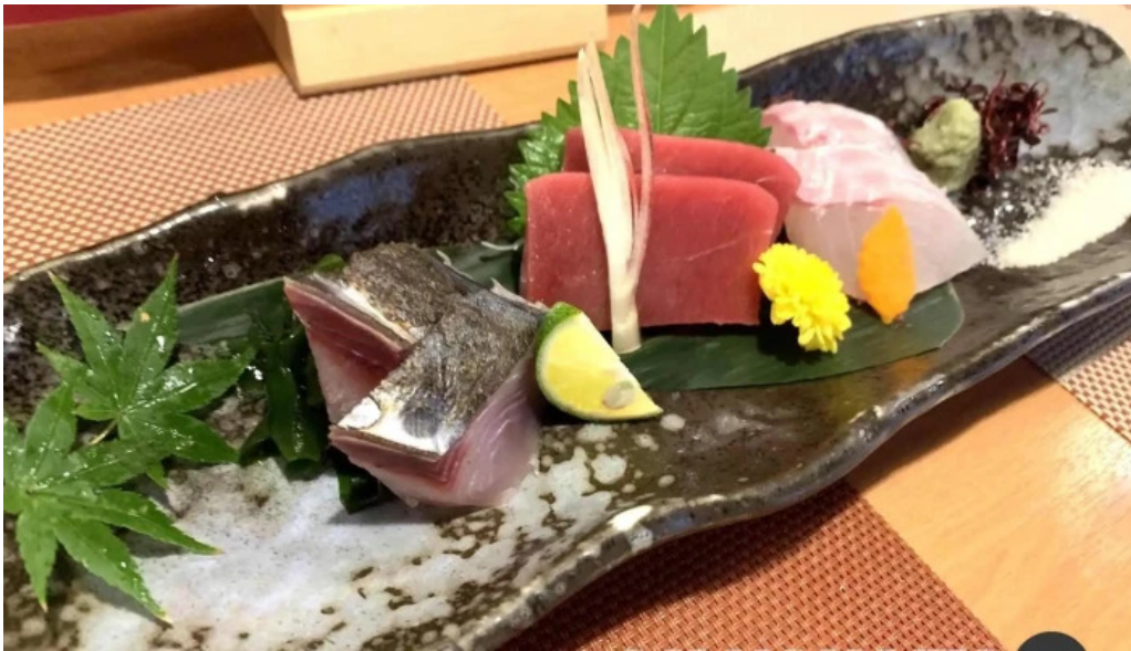
海鮮炭火 いちごいちえ 枚方本店 刺身