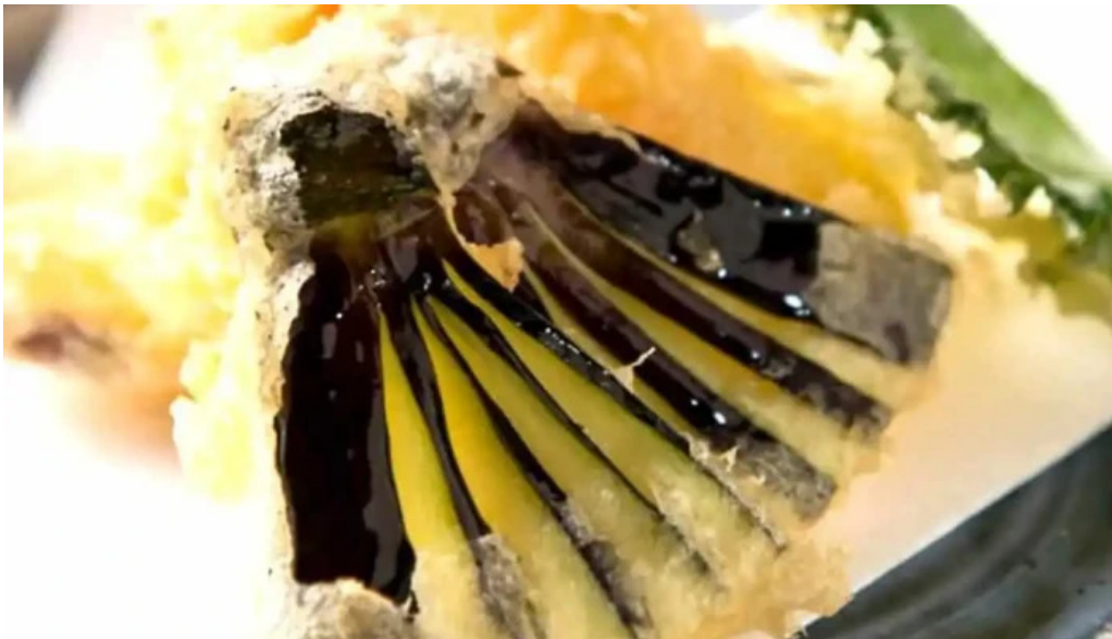
海鮮炭火 いちごいちえ 枚方本店 シーフード