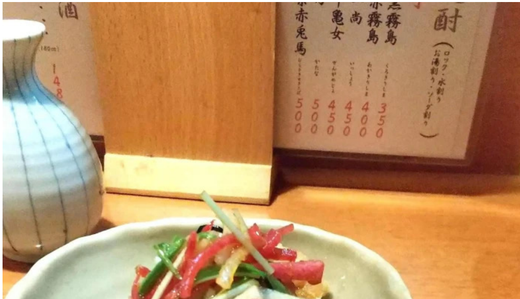
海鮮炭火 いちごいちえ 枚方本店 住所