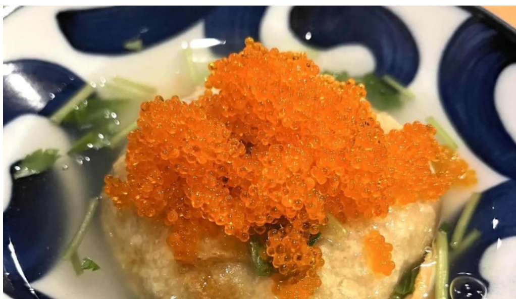
海鮮炭火 いちごいちえ 枚方本店 口コミ