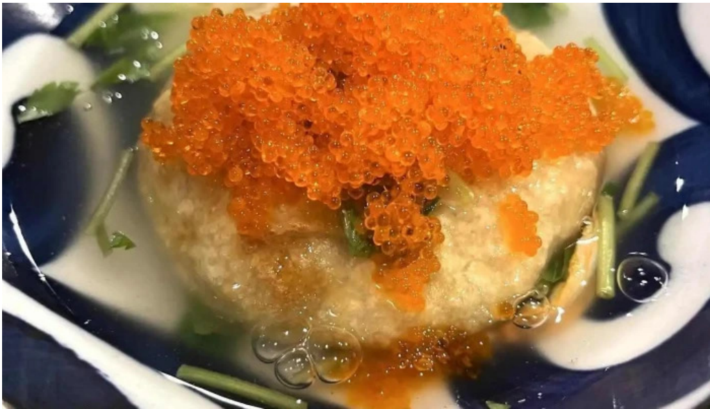
海鮮炭火 いちごいちえ 枚方本店 最新