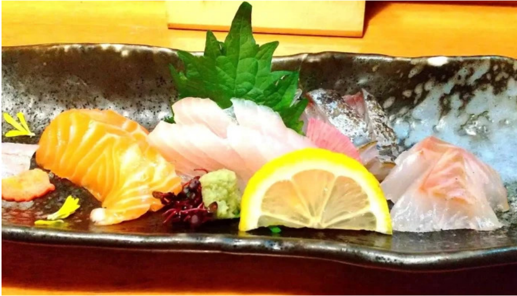
海鮮炭火 いちごいちえ 枚方本店 動画