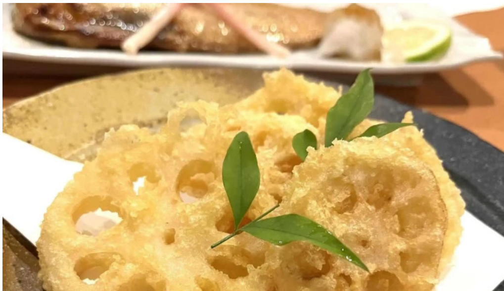
海鮮炭火 いちごいちえ 枚方本店 番号