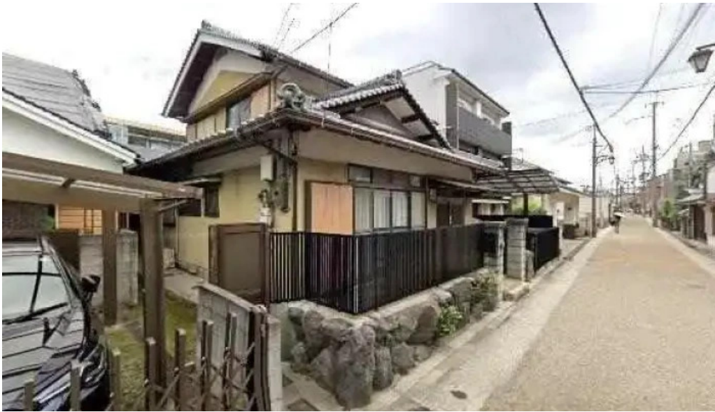
海鮮炭火 いちごいちえ 枚方本店 枚方市