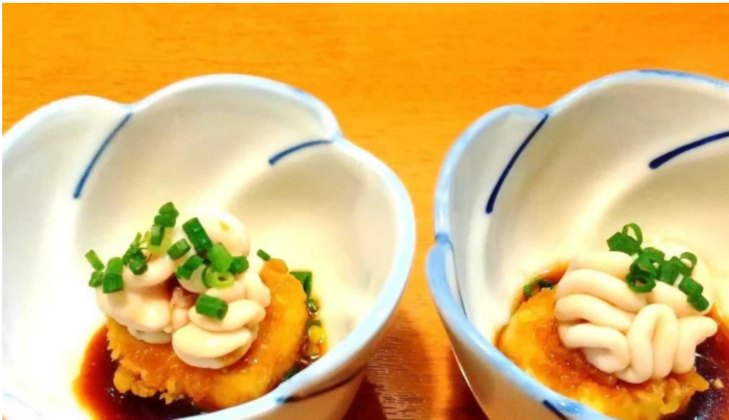
海鮮炭火 いちごいちえ 枚方本店 コメント