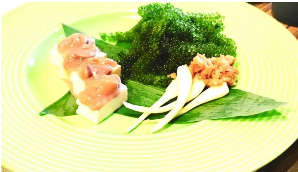
沖縄 あっぱりしゃん 枚方大垣内店 コメント