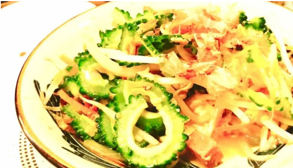
沖縄 あっぱりしゃん 枚方大垣内店 営業中