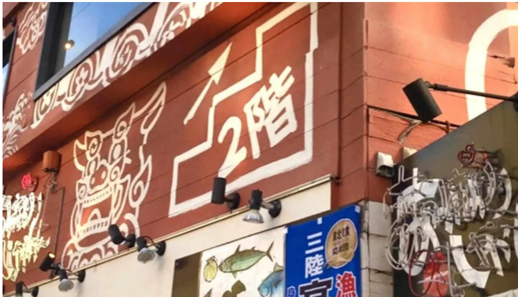
沖縄 あっぱりしゃん 枚方大垣内店 料金