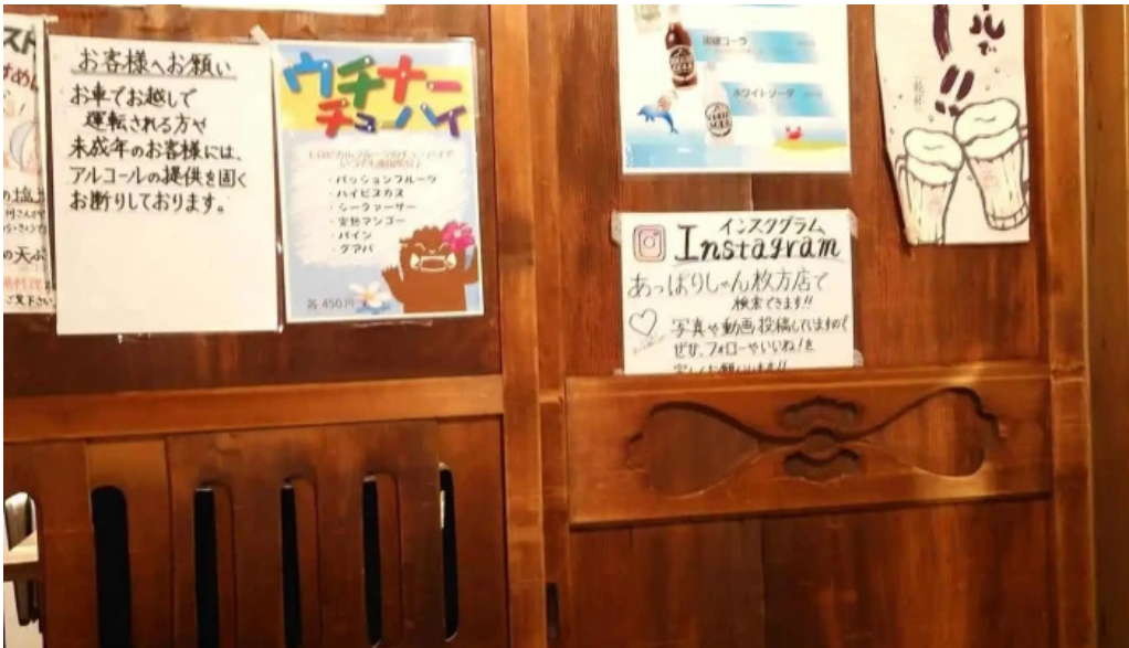
沖縄 あっぱりしゃん 枚方大垣内店 メニュー