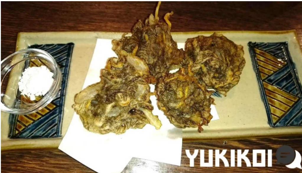
沖縄 あっぱりしゃん 枚方大垣内店 シーフード