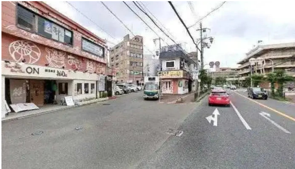
沖縄 あっぱりしゃん 枚方大垣内店 枚方市