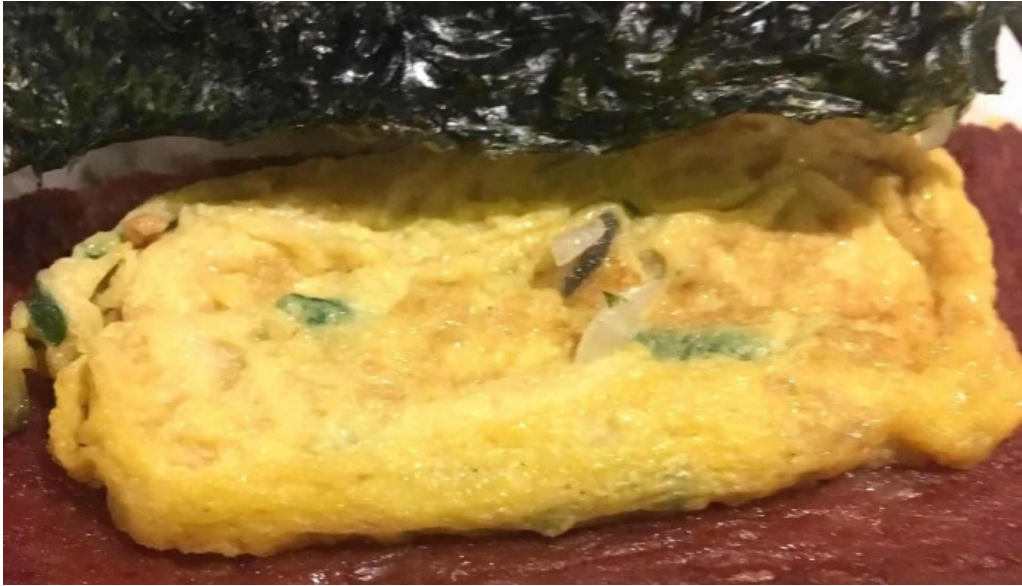
沖縄 あっぱりしゃん 枚方大垣内店 営業時間