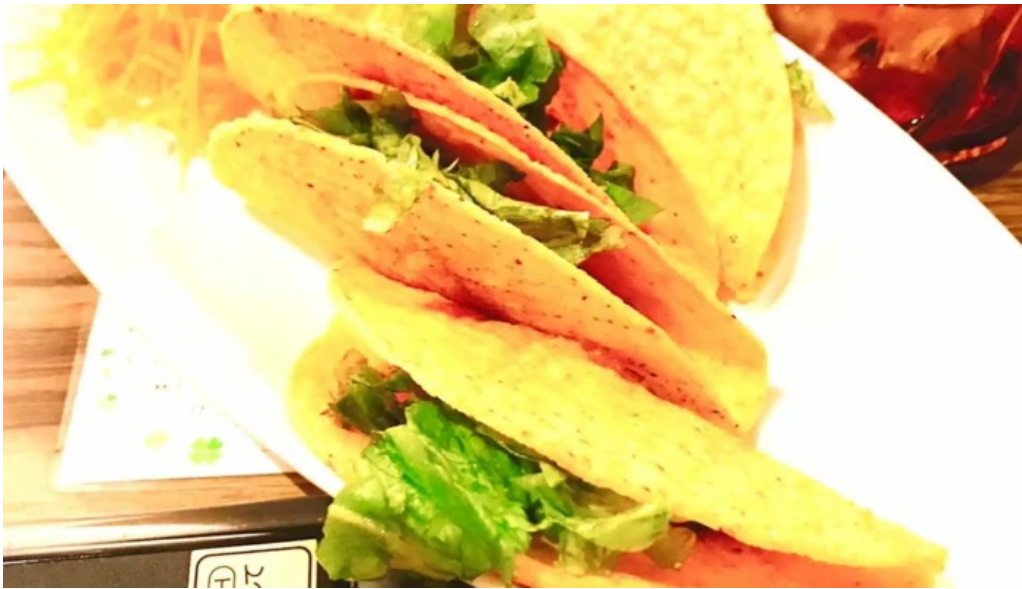
沖縄 あっぱりしゃん 枚方大垣内店 所在地