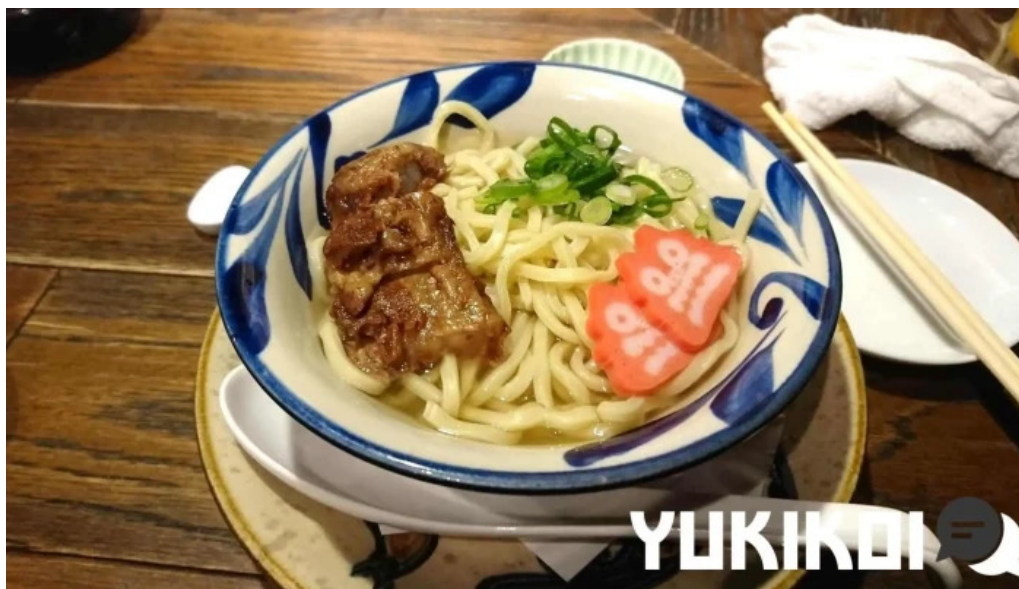
沖縄 あっぱりしゃん 枚方大垣内店 麺