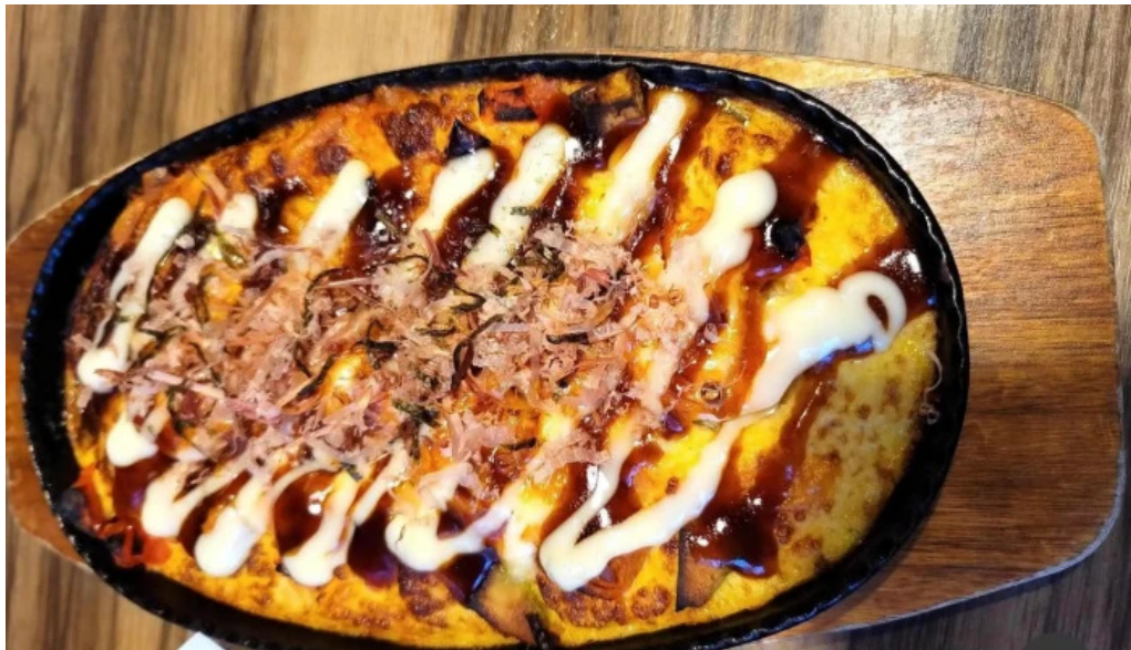
沖縄 あっぱりしゃん 枚方大垣内店 料理飲み物