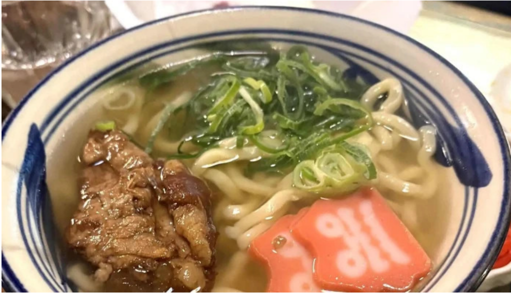
沖縄 あっぱりしゃん 枚方大垣内店 プロモーション