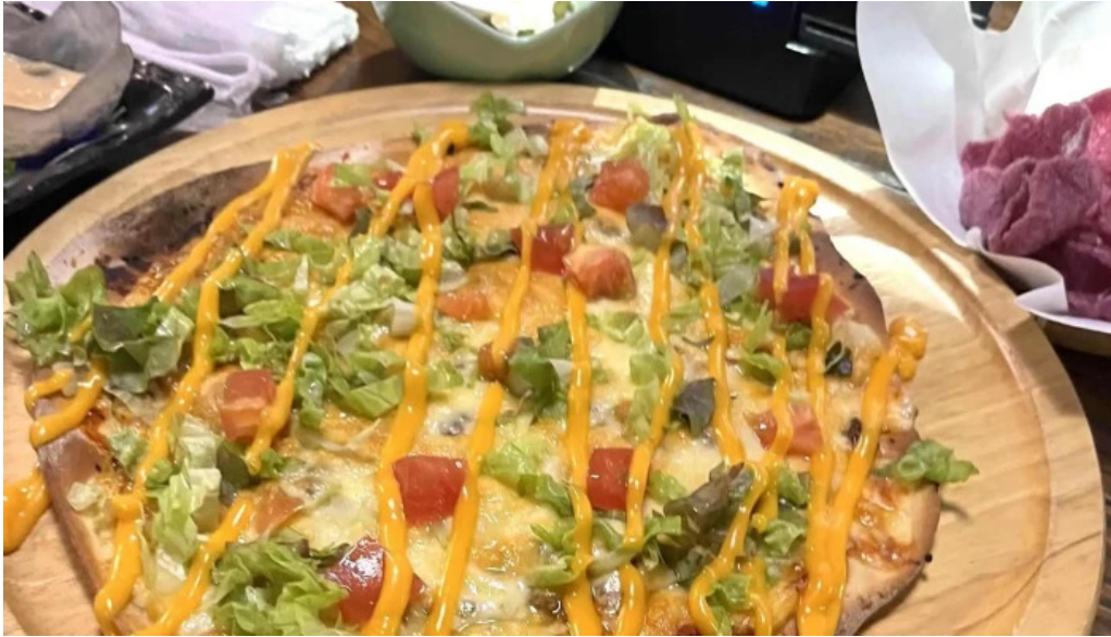
沖縄 あっぱりしゃん 枚方大垣内店 写真