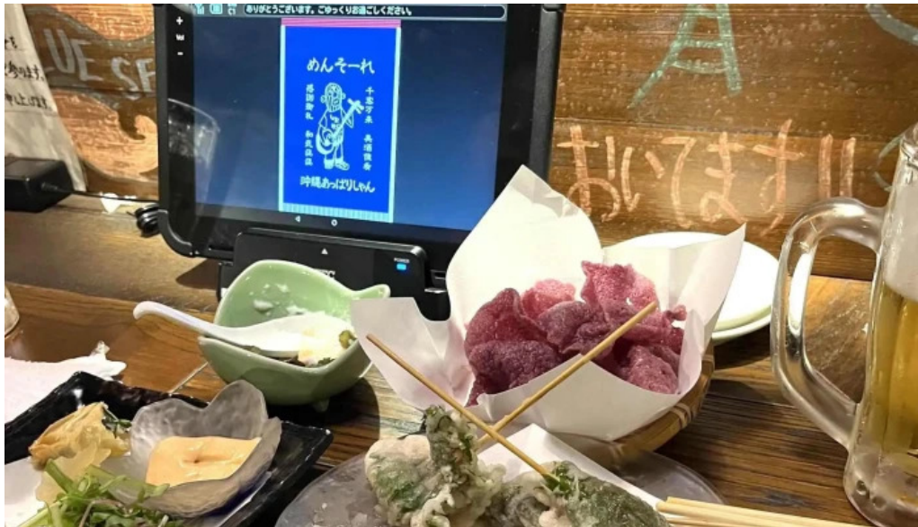
沖縄 あっぱりしゃん 枚方大垣内店 行き方