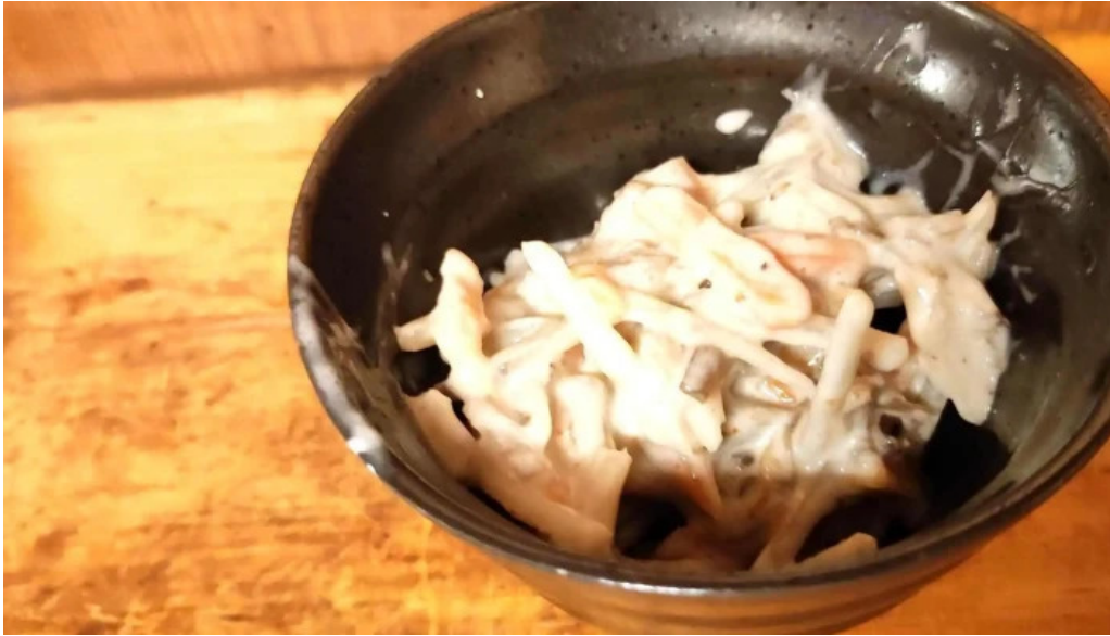
宴屋 じんべい 枚方本店 割引