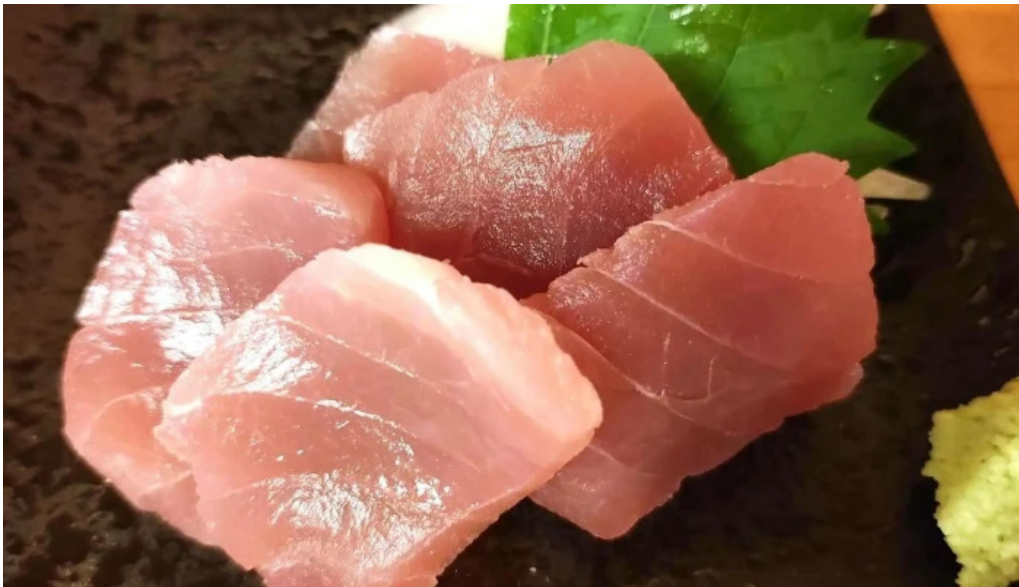
宴屋 じんべい 枚方本店 電話