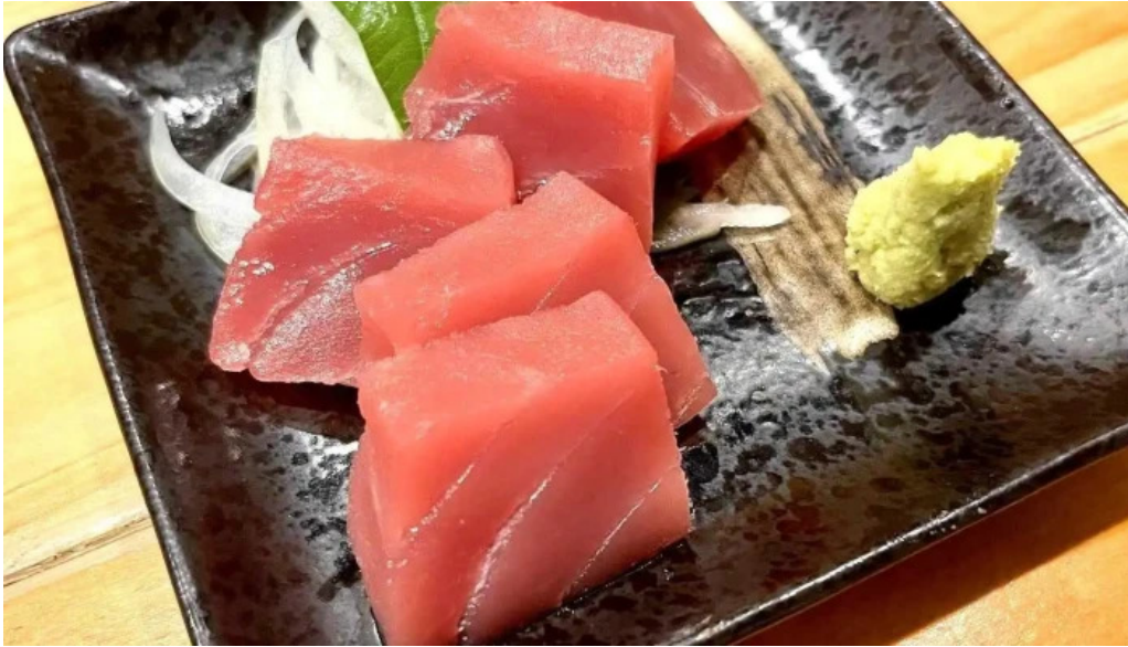
宴屋 じんべい 枚方本店 最新