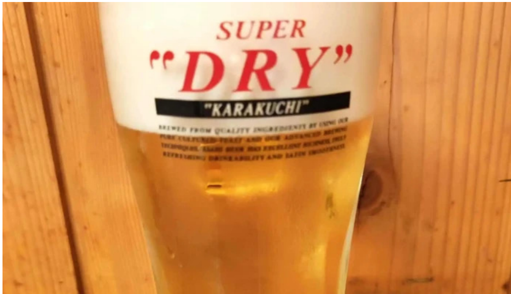
宴屋 じんべい 枚方本店 営業中