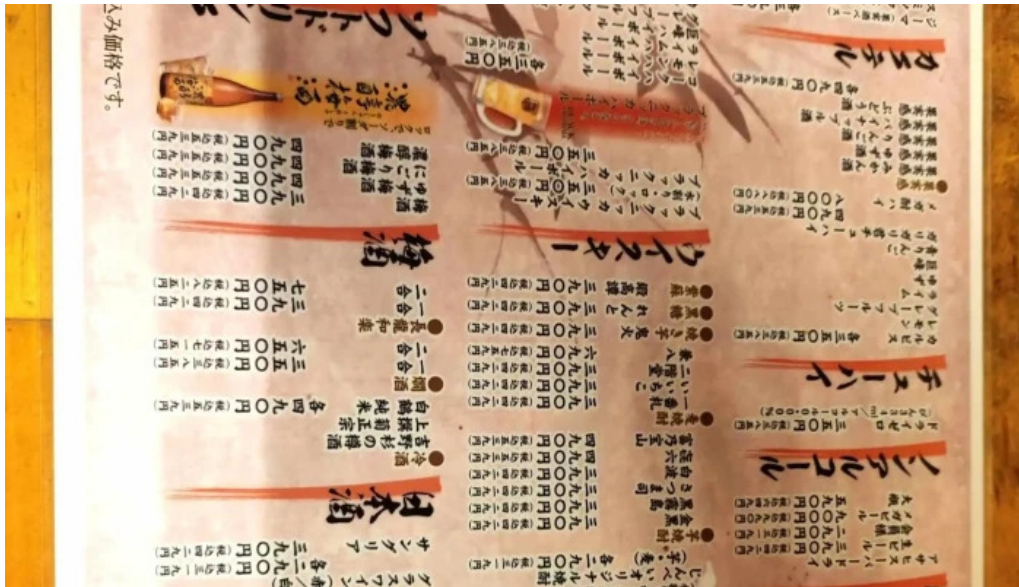
宴屋 じんべい 枚方本店 カタログ