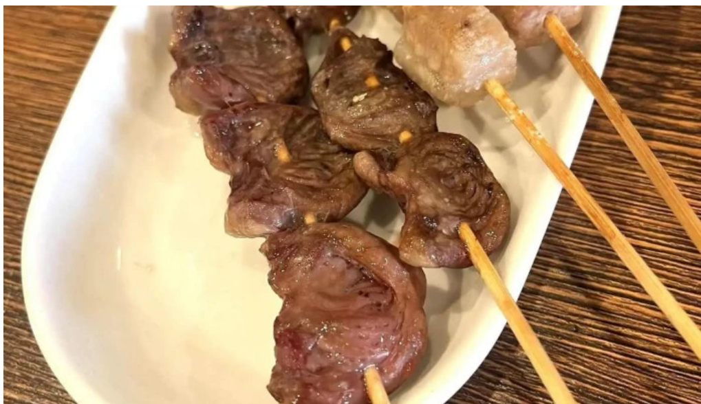
宴屋 じんべい 枚方本店 焼き鳥