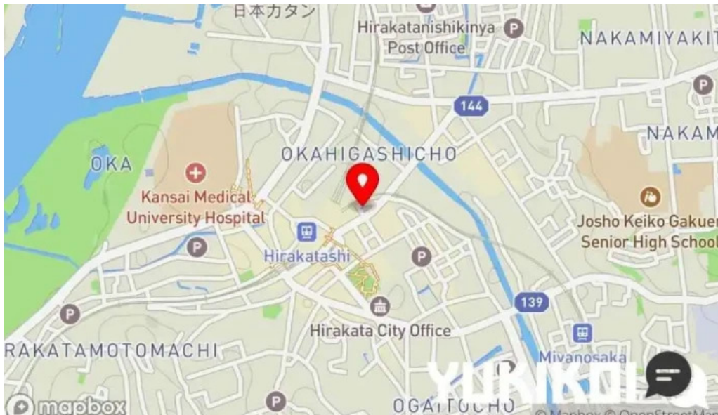
宴屋 じんべい 枚方本店 地図