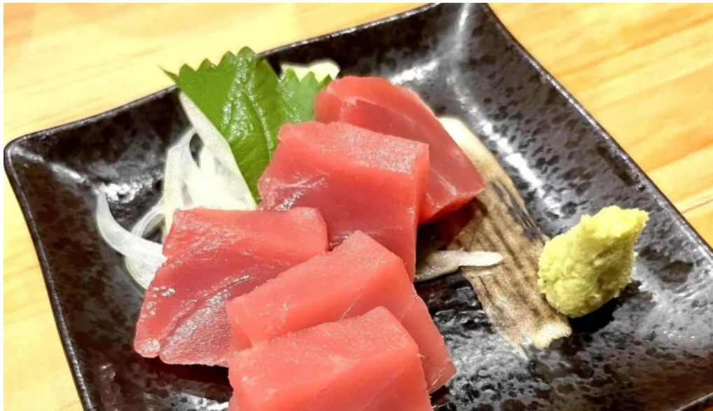
宴屋 じんべい 枚方本店 スコア