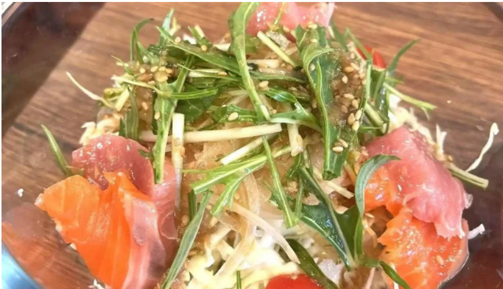
宴屋 じんべい 枚方本店 料理飲み物