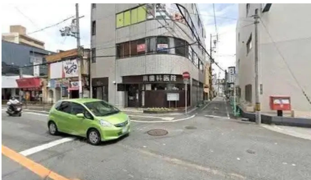
宴屋 じんべい 枚方本店 枚方市