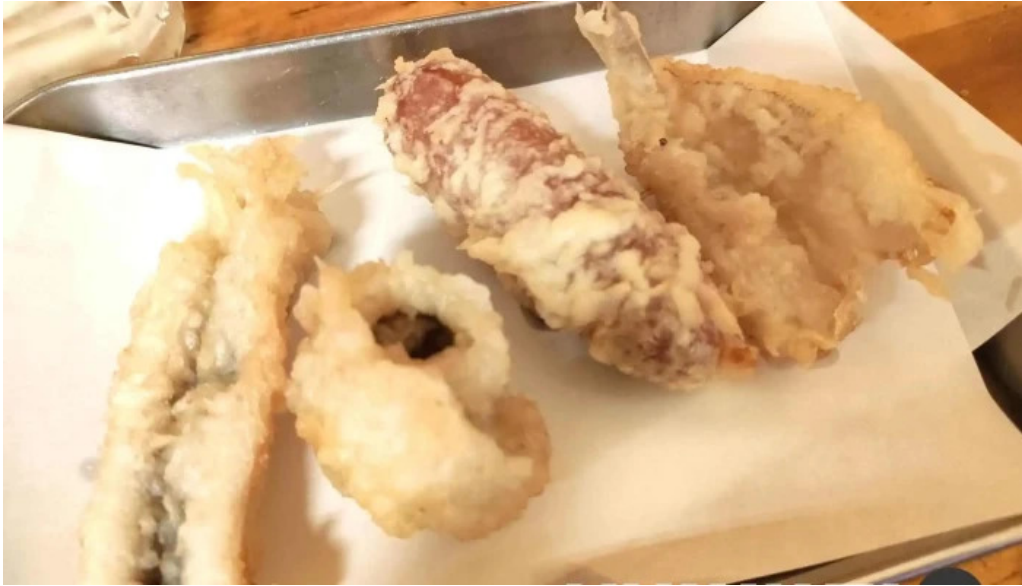
宴屋 じんべい 枚方本店 天ぷら