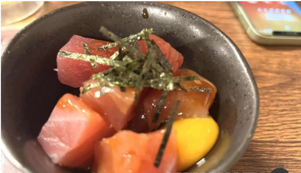
宴屋 じんべい 枚方本店 刺身