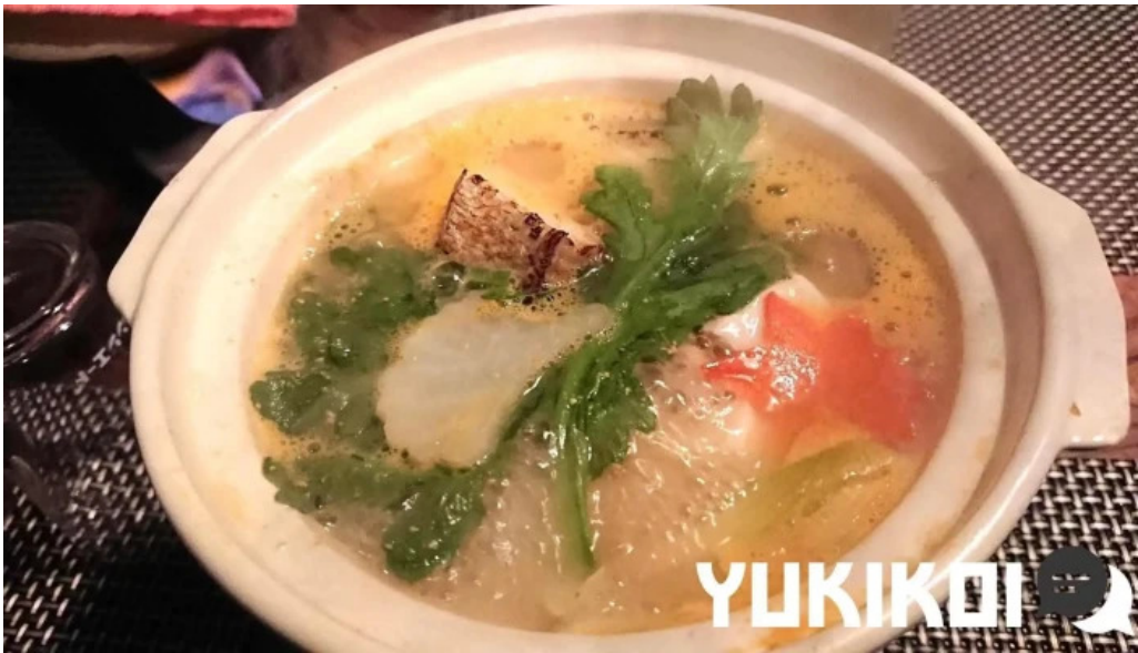
天の川 なかなか スープ