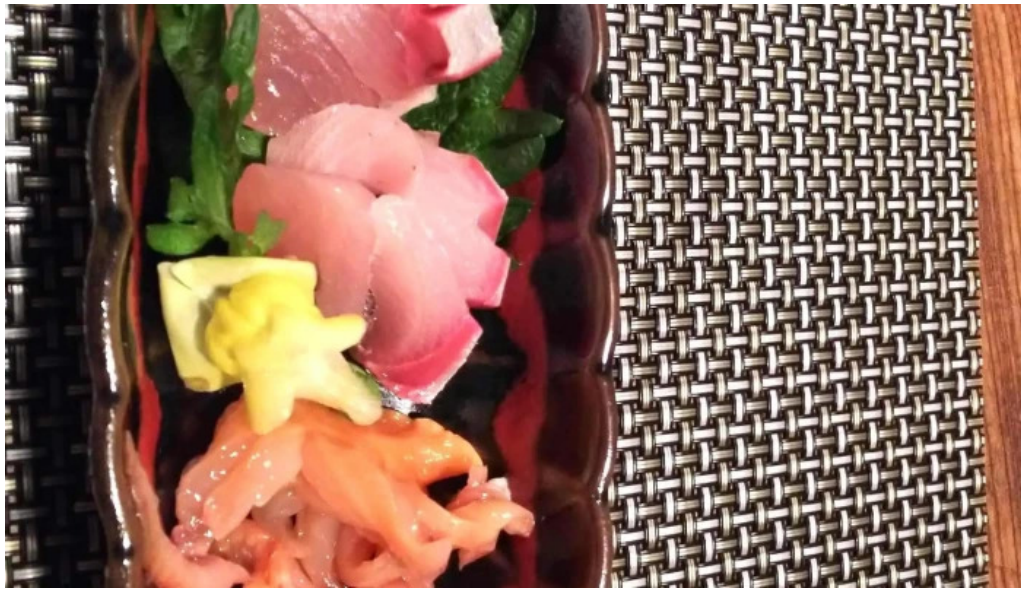
天の川 なかなか 割引