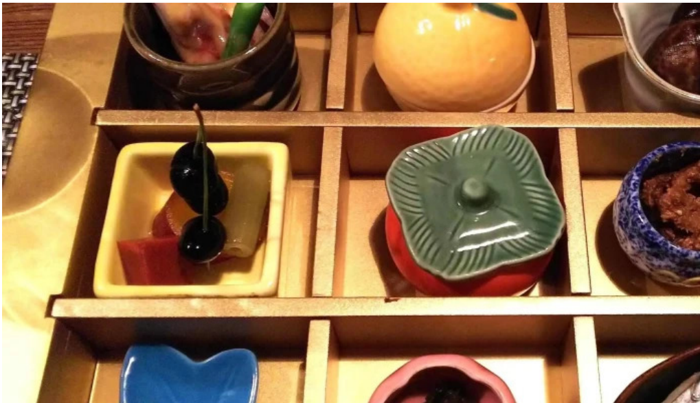
天の川 なかなか ウェブサイト