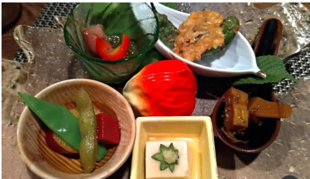
天の川 なかなか 懐石