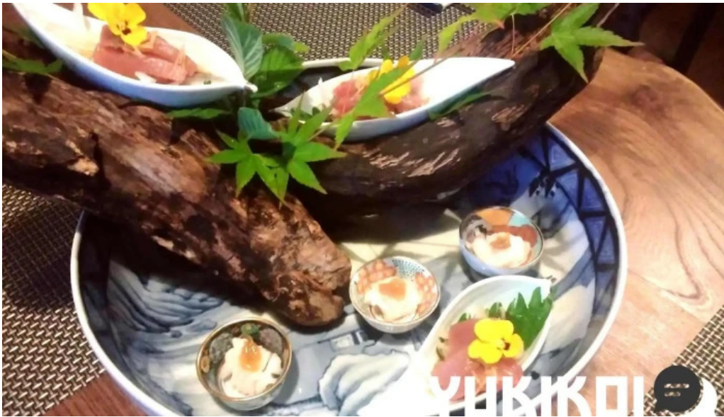
天の川 なかなか シーフード