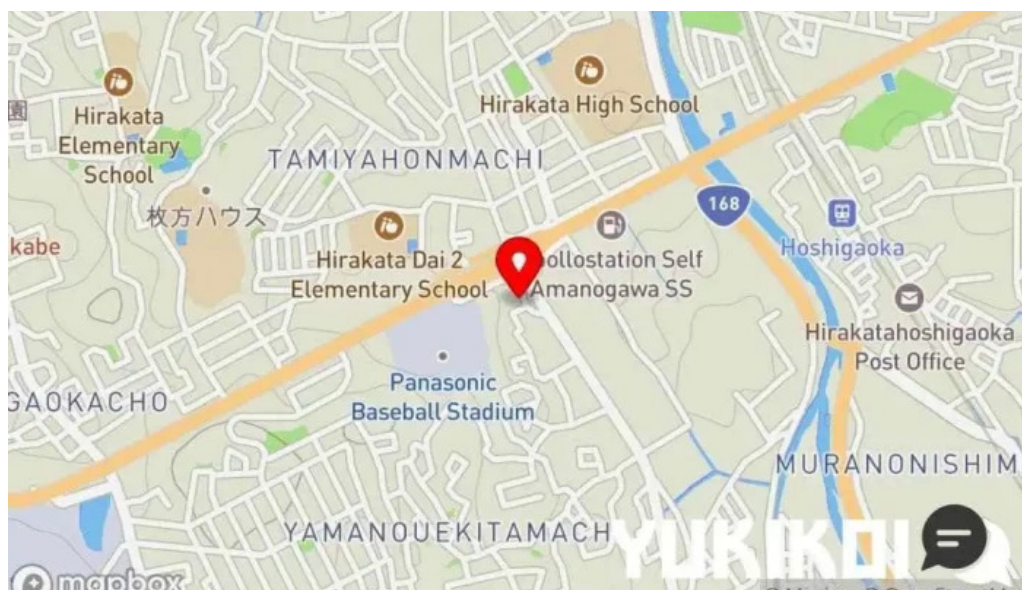
天の川 なかなか 地図