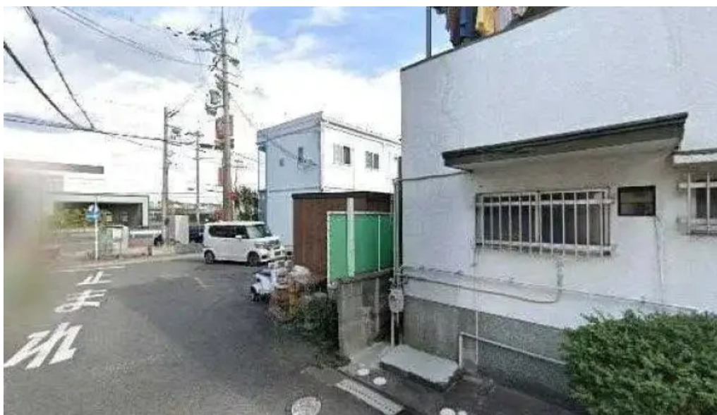
天の川 なかなか 枚方市