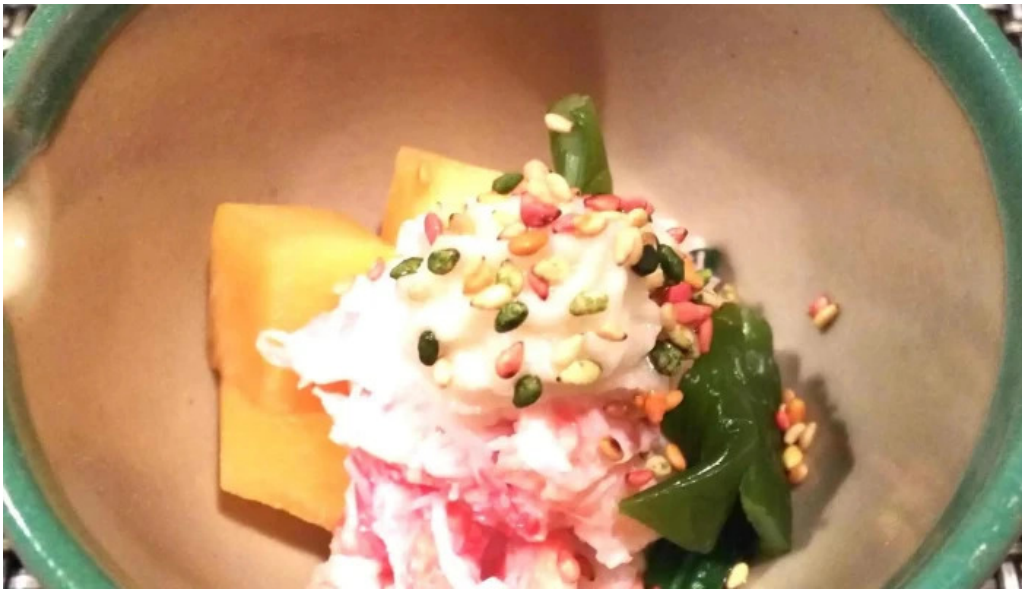
天の川 なかなか コメント