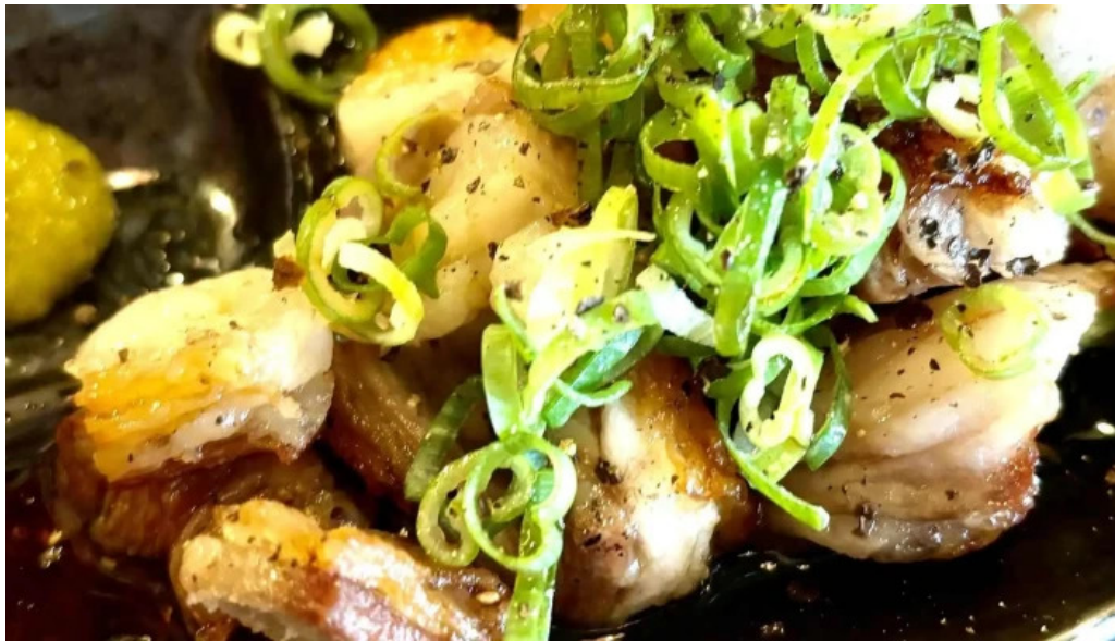
夢屋 枚方本店 料金