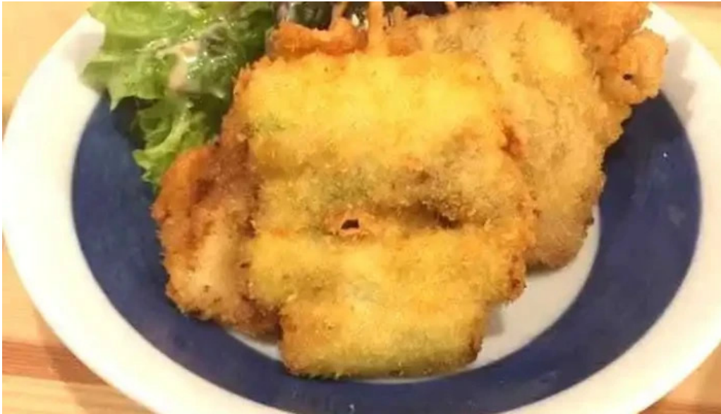
夢屋 枚方本店 天ぷら