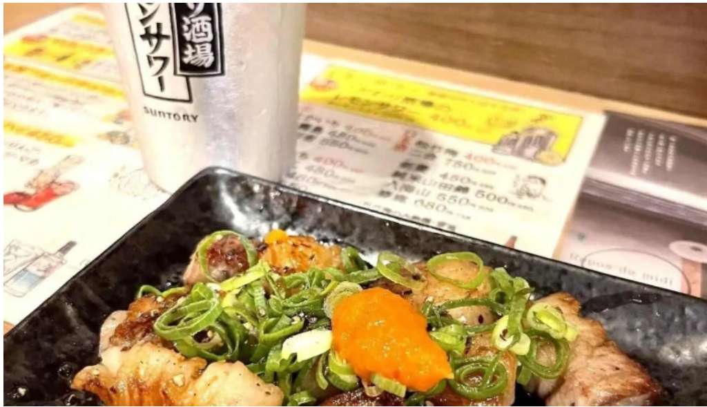
夢屋 枚方本店 最新