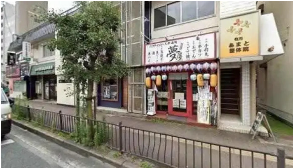
夢屋 枚方本店 枚方市