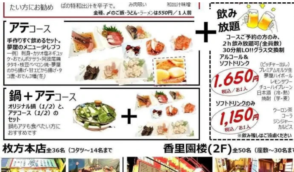
夢屋 枚方本店 メニュー