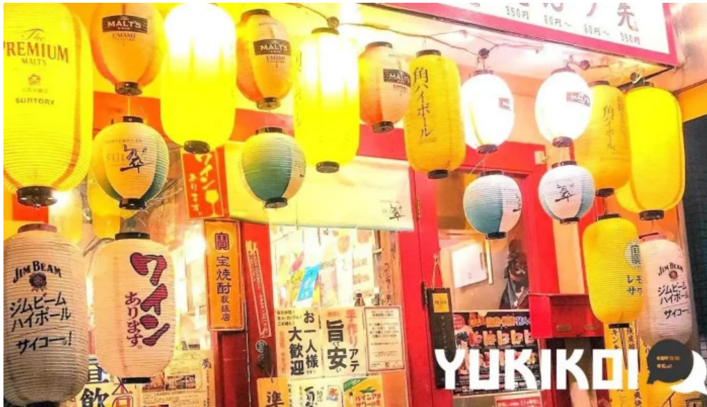
夢屋 枚方本店