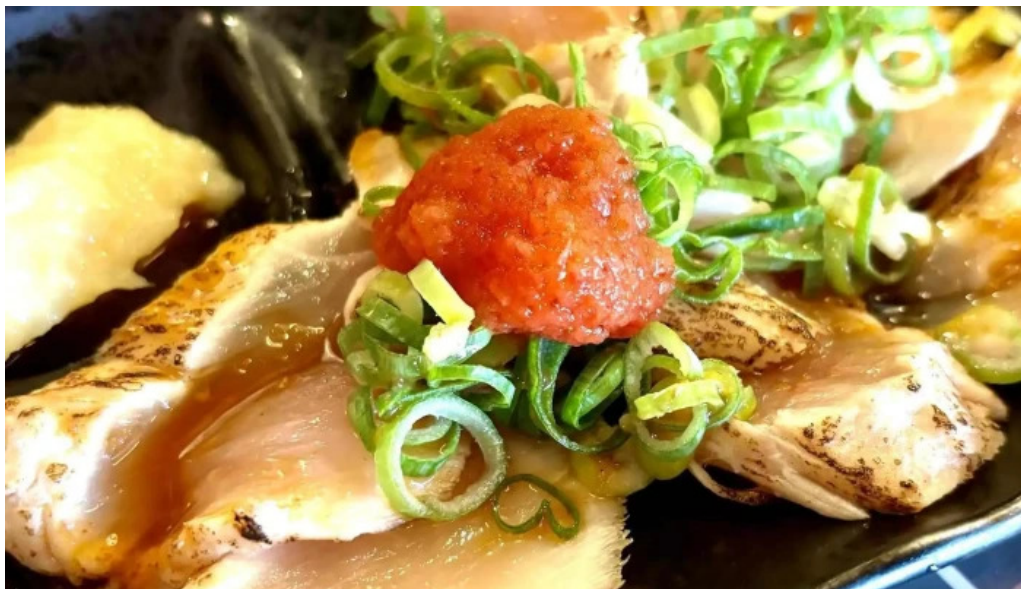
夢屋 枚方本店 カタログ