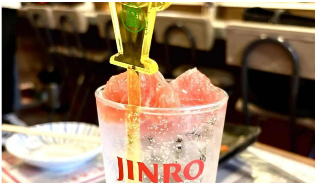
夢屋 枚方本店 プロモーション