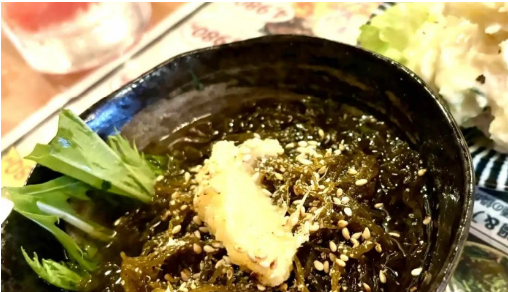
夢屋 枚方本店 instagram