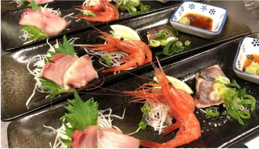
夢屋 枚方本店 料理飲み物