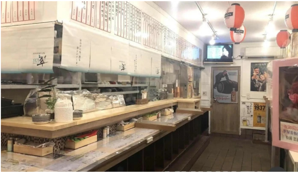
夢屋 枚方本店 雰囲気