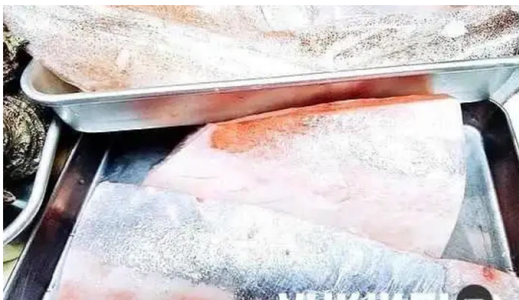
夢屋 枚方本店 魚類