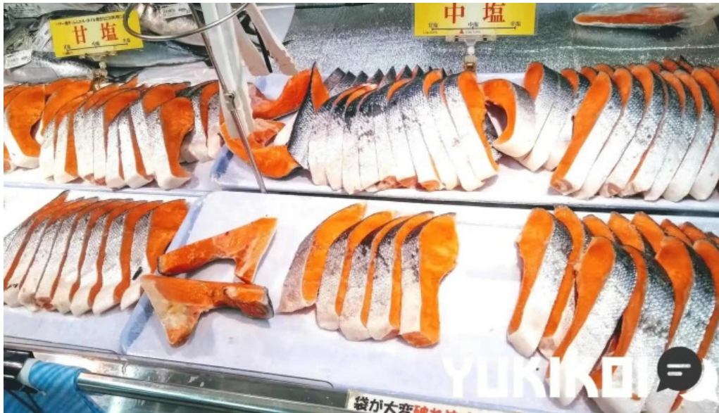
夢屋 枚方本店 シーフード