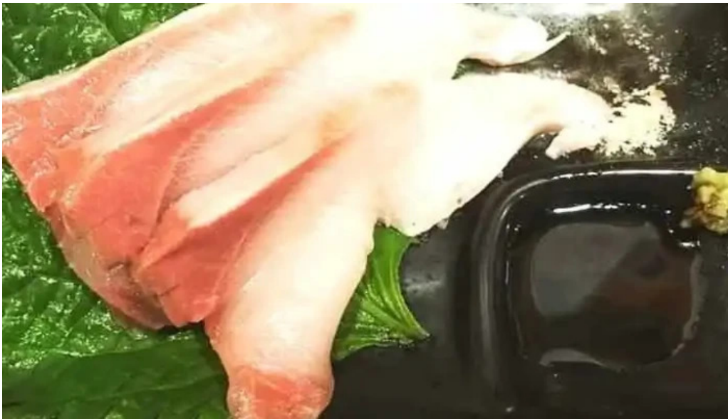
夢屋 枚方本店 刺身