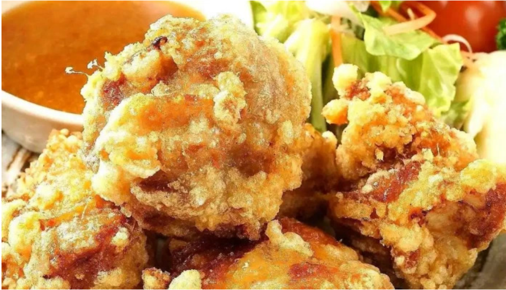
地鶏 炭火 鶏つく 枚方市駅前店