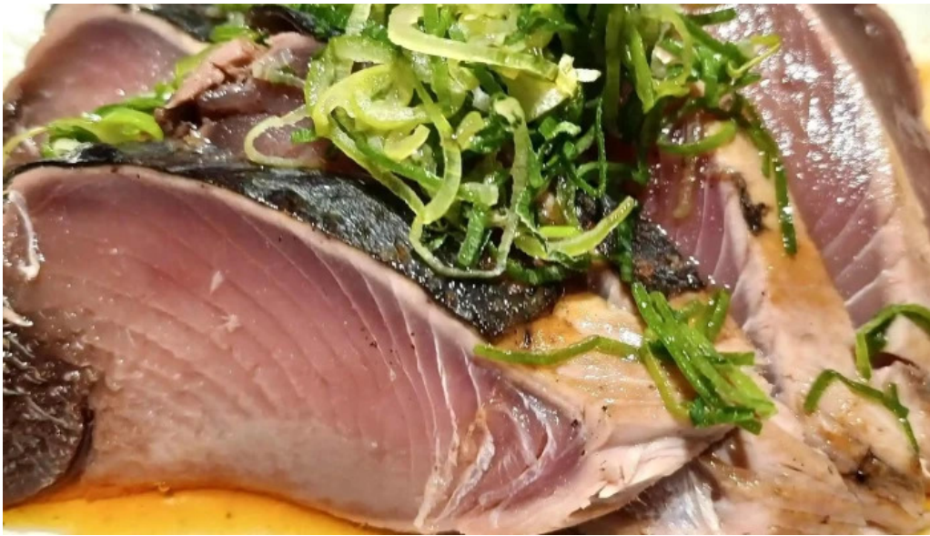
地鶏 炭火 鶏つく 枚方市駅前店 行き方