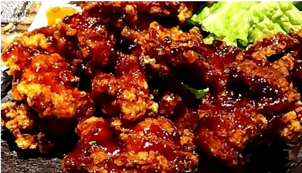
地鶏 炭火 鶏つく 枚方市駅前店 instagram