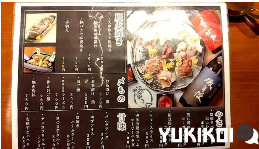
地鶏 炭火 鶏つく 枚方市駅前店 メニュー