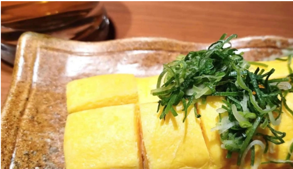
地鶏 炭火 鶏つく 枚方市駅前店 口コミ