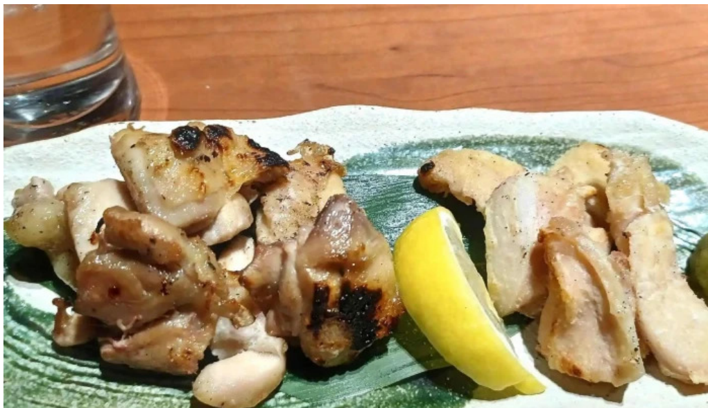
地鶏 炭火 鶏つく 枚方市駅前店 スコア