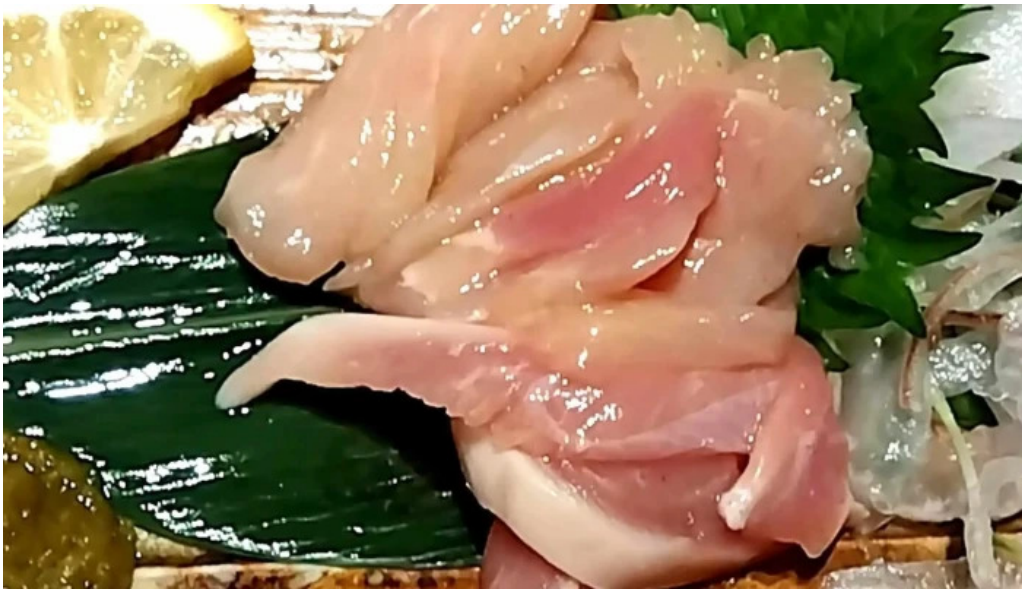
地鶏 炭火 鶏つく 枚方市駅前店 番号