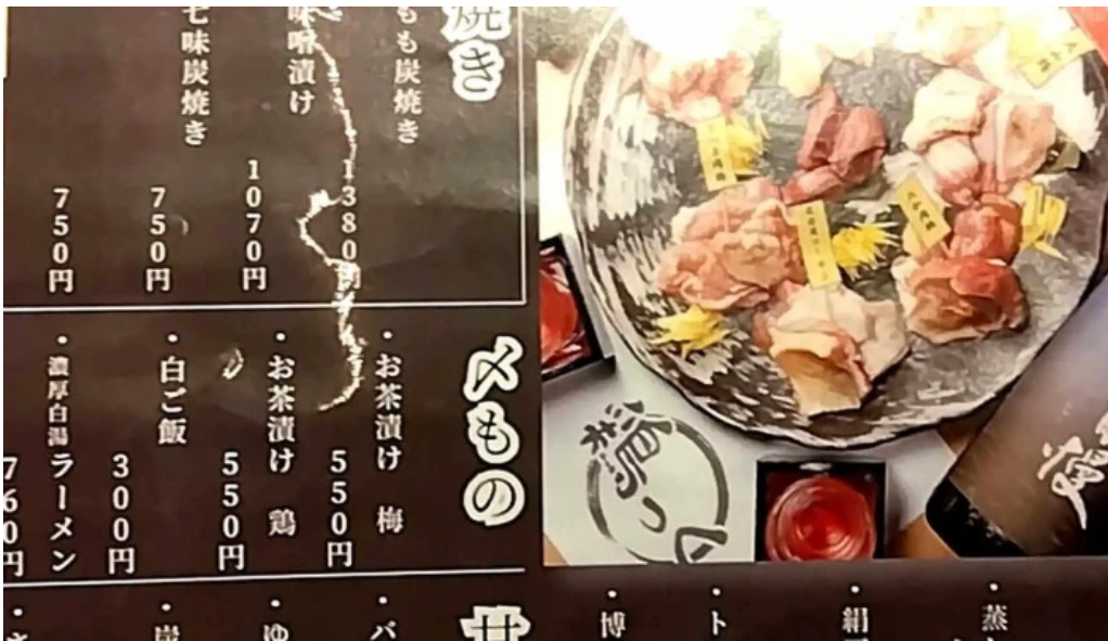
地鶏炭火鶏つく 枚方市駅前店 料金