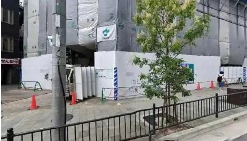
地鶏炭火鶏つく 枚方市駅前店 枚方市