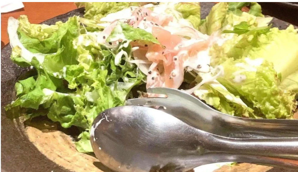
地鶏 炭火 鶏つく 枚方市駅前店 電話