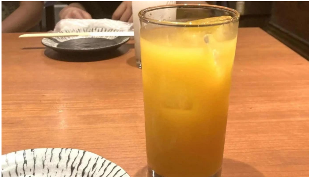
地鶏 炭火 鶏つく 枚方市駅前店 写真