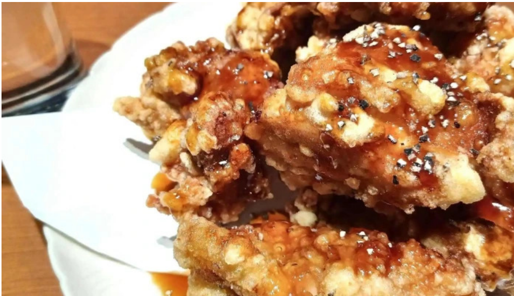
地鶏 炭火 鶏つく 枚方市駅前店 所在地