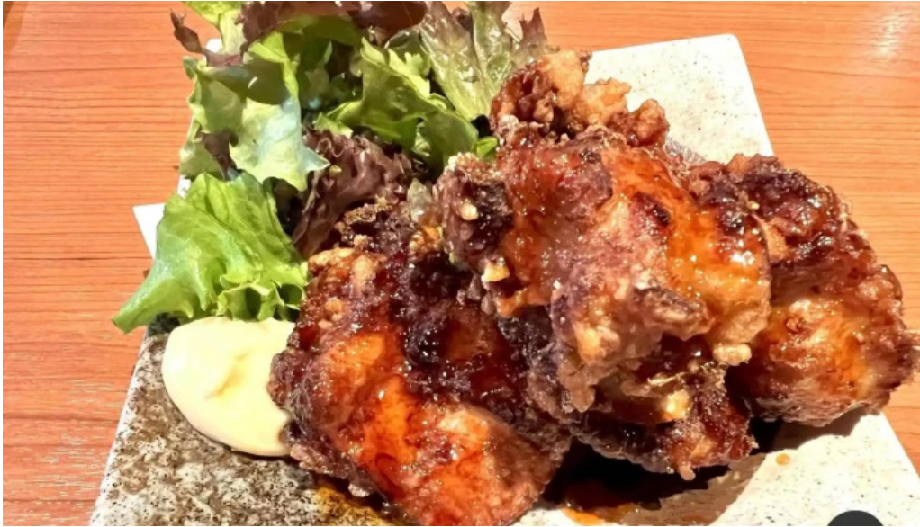
地鶏 炭火 鶏つく 枚方市駅前店 料理飲み物