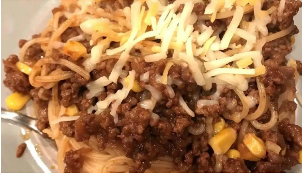
ゆうげ 料理飲み物