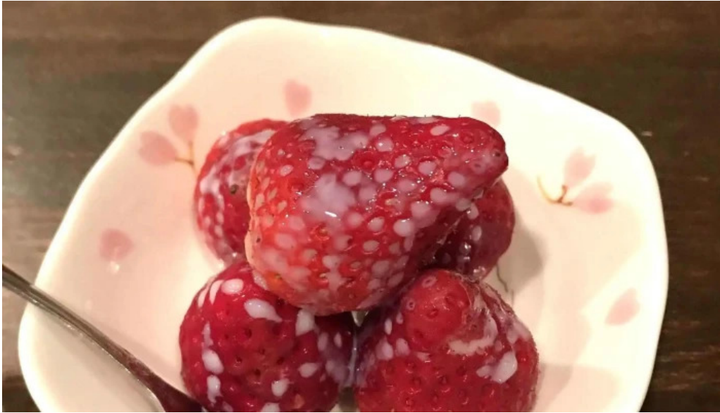
ゆうげ プロモーション