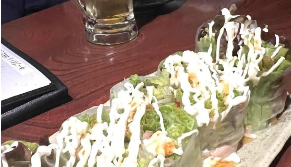
四季料理三福屋 コメント