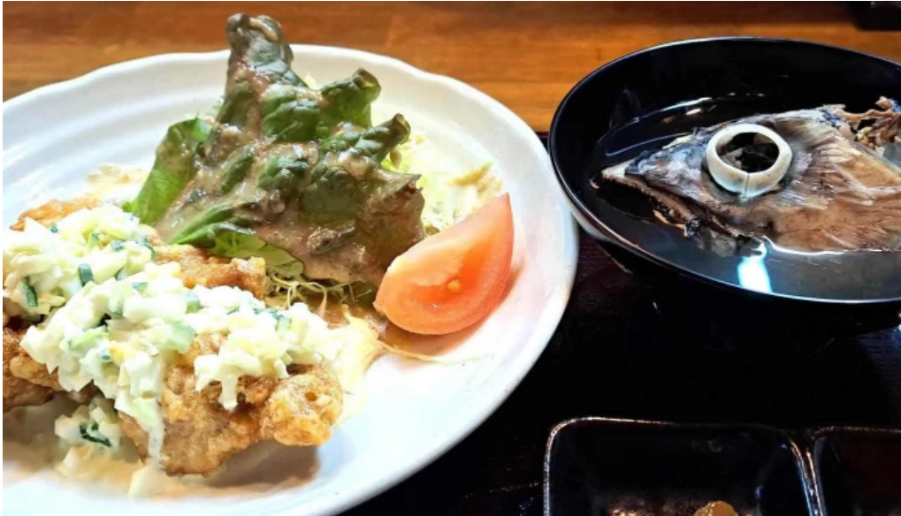
四季料理三福屋 どこ