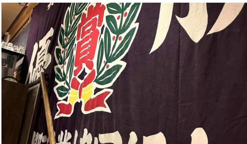
四季料理三福屋 最新