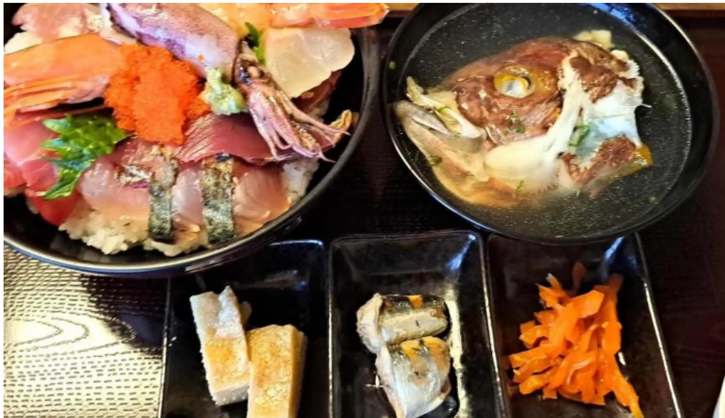
四季料理三福屋 スコア