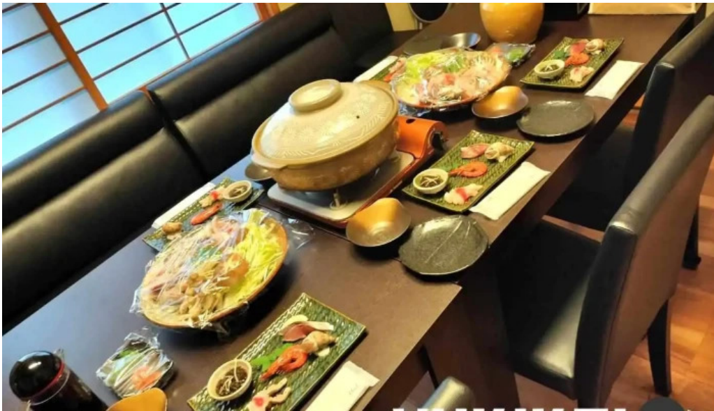
四季料理三福屋 料理飲み物