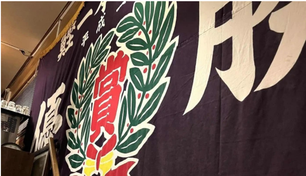
四季料理三福屋 口口三