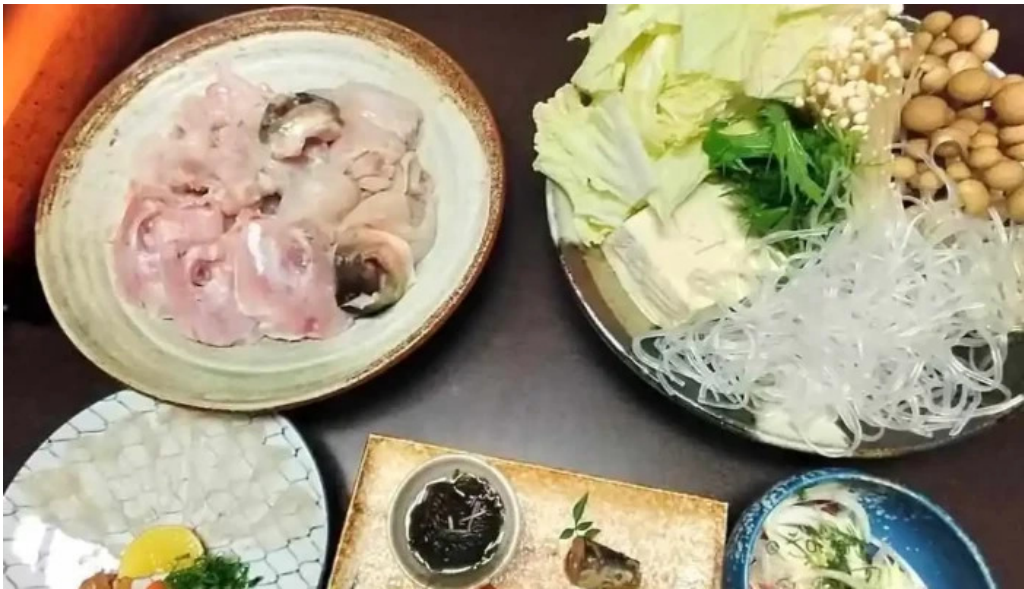
四季料理三福屋 刺身