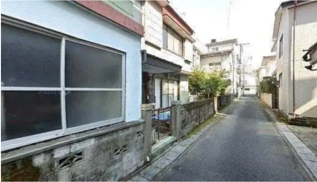
四季料理三福屋 日南市