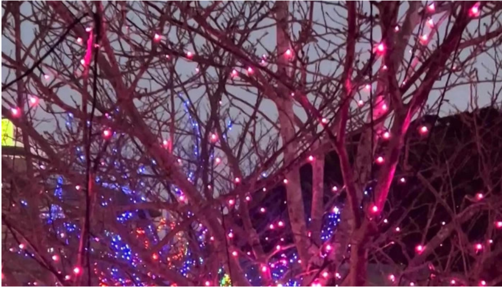
四季料理三福屋 動画