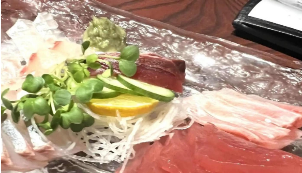
四季料理三福屋 営業中