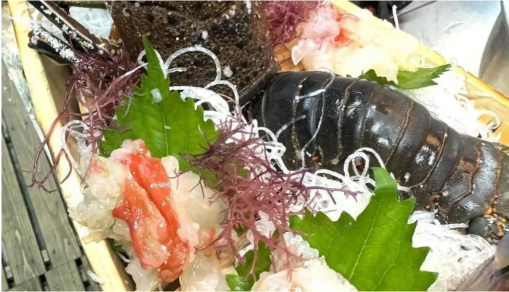
四季料理三福屋 寿司