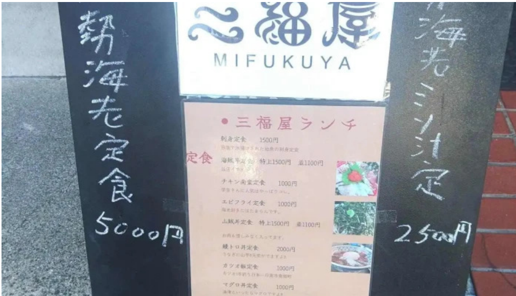
四季料理三福屋