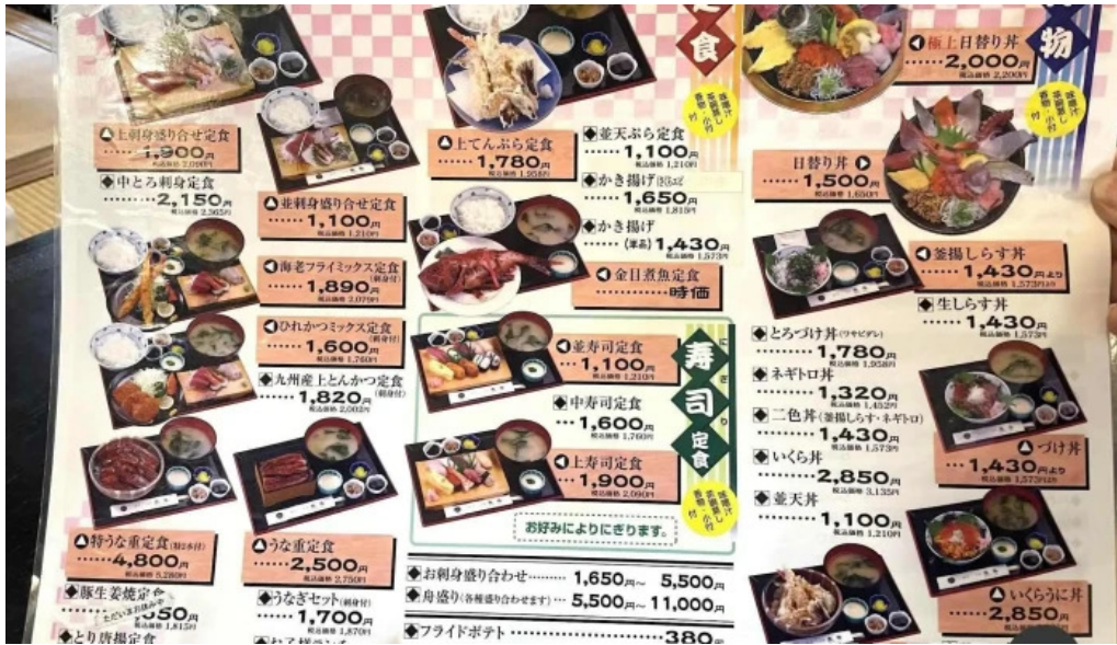
御殿場 割烹お食事処 魚啓 メニュー