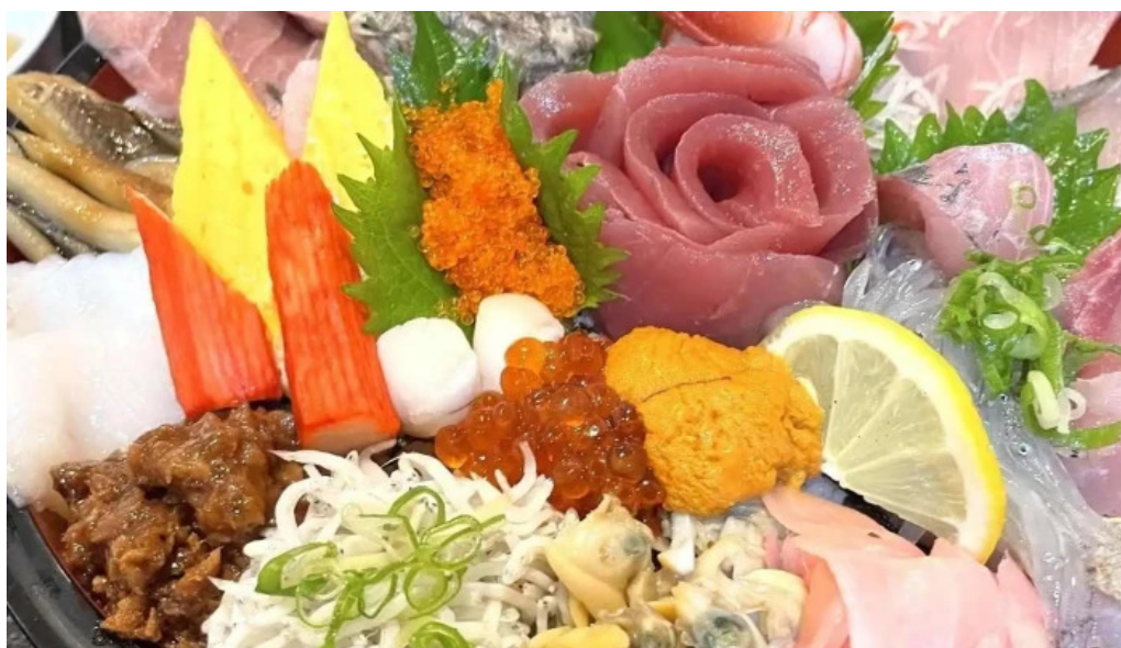
御殿場 割烹お食事処 魚啓 最新