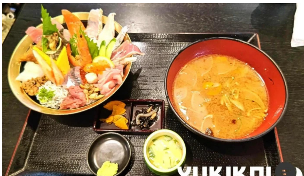
御殿場 割烹お食事処 魚啓 料理飲み物