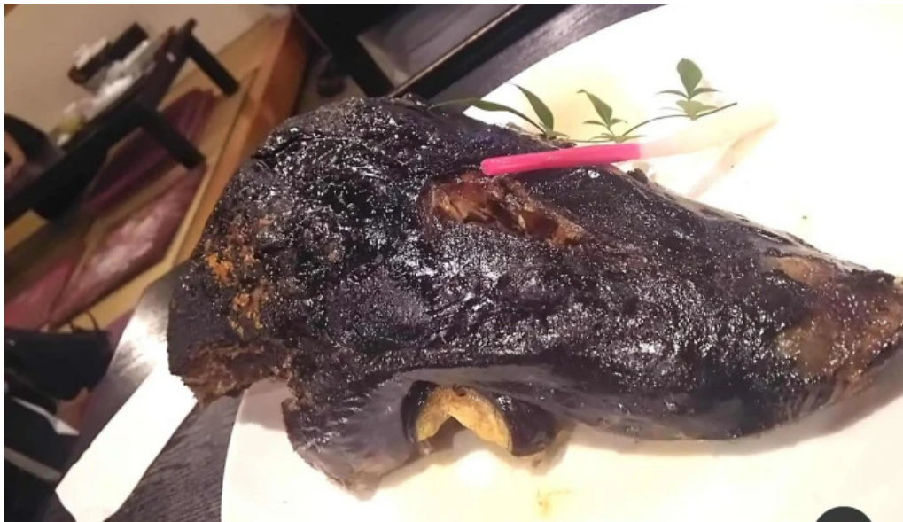
御殿場 割烹お食事処 魚啓 フライドフィッシュ