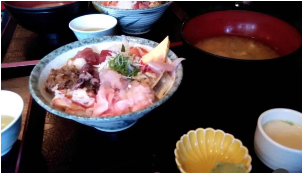
御殿場 割烹お食事処 魚啓 シーフード