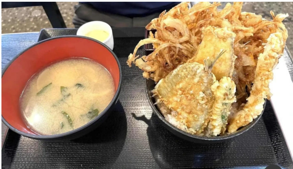
御殿場 割烹お食事処 魚啓 天ぷら