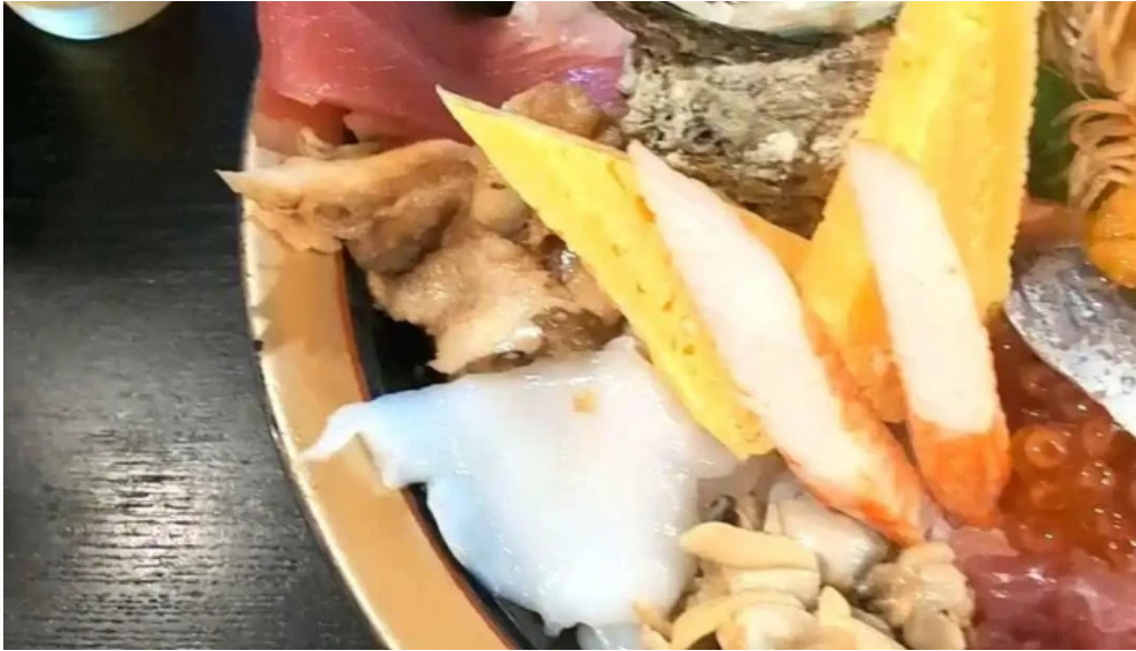
御殿場 割烹お食事処 魚啓 動画