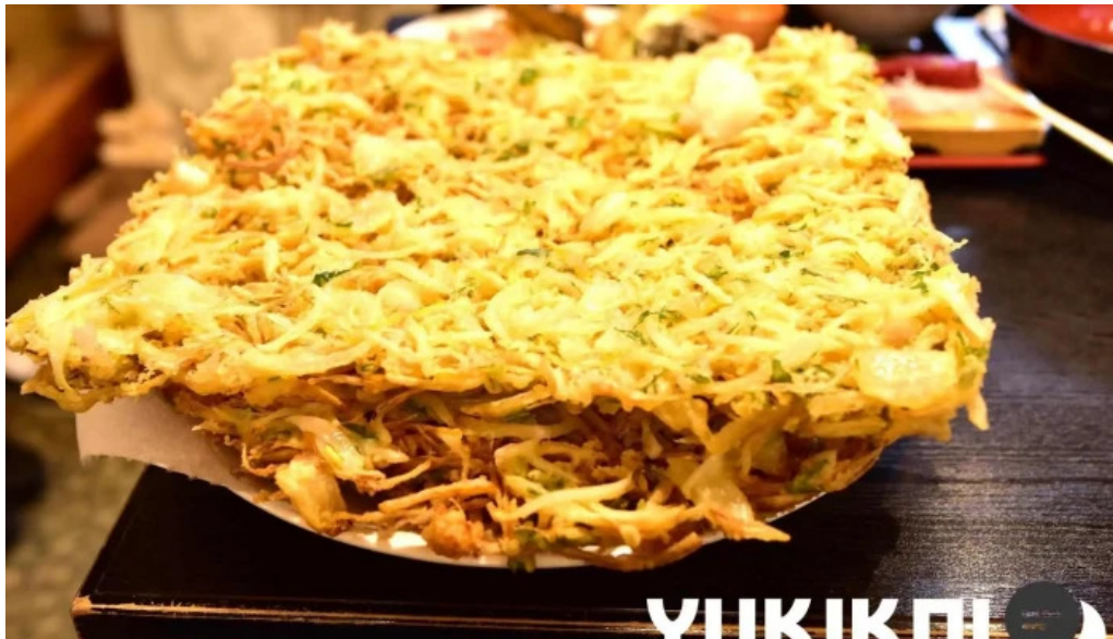
御殿場 割烹お食事処 魚啓 お好み焼き