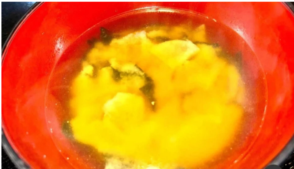
御殿場 割烹お食事処 魚啓 味噌汁