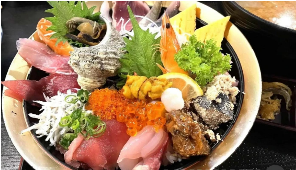
御殿場 割烹お食事処 魚啓 刺身