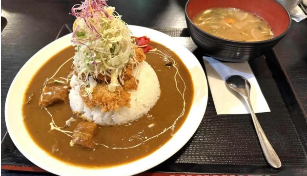
御殿場 割烹お食事処 魚啓 カレー