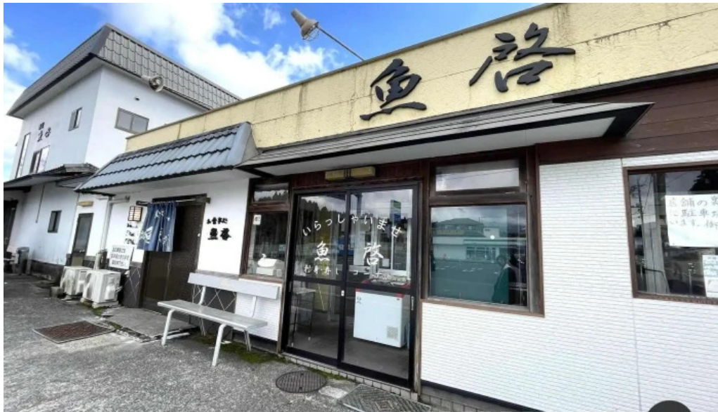
御殿場 割烹お食事処 魚啓 御殿場市