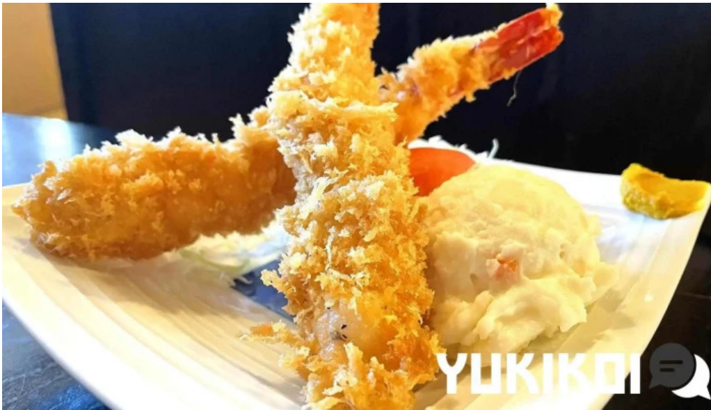
御殿場 割烹お食事処 魚啓 エビフライ