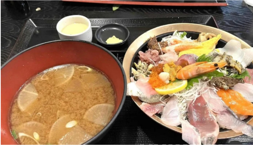
御殿場 割烹お食事処 魚啓 スープ