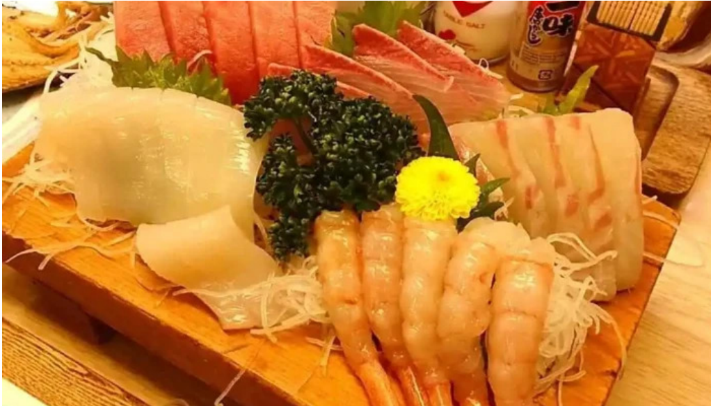
居酒屋さかなや 御殿場本店 刺身