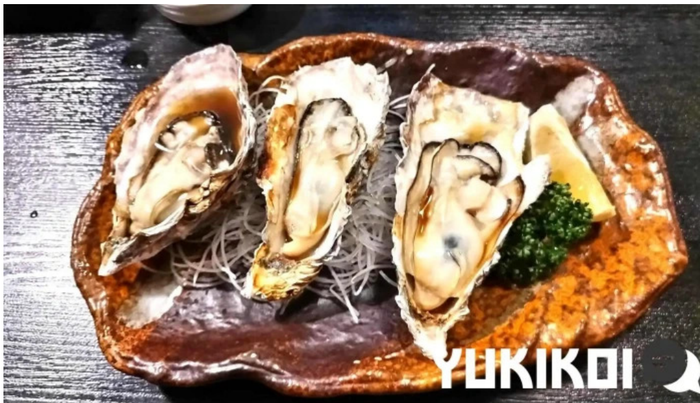
居酒屋さかなや 御殿場本店 シーフード