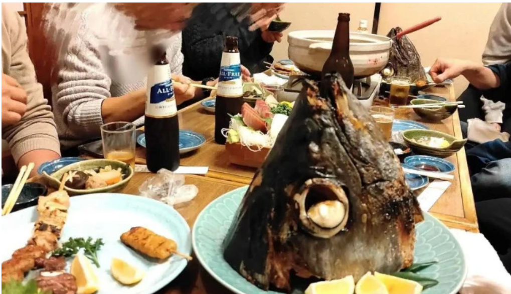
居酒屋さかなや 御殿場本店 魚類