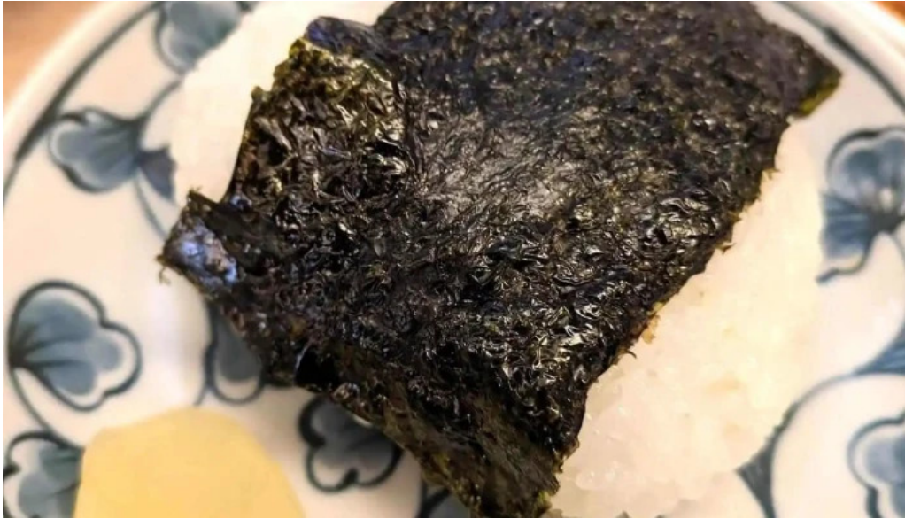
居酒屋さかなや 御殿場本店 寿司