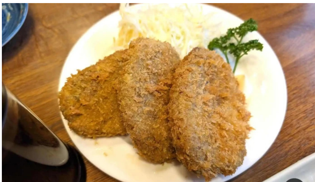
居酒屋さかなや 御殿場本店 豚カツ