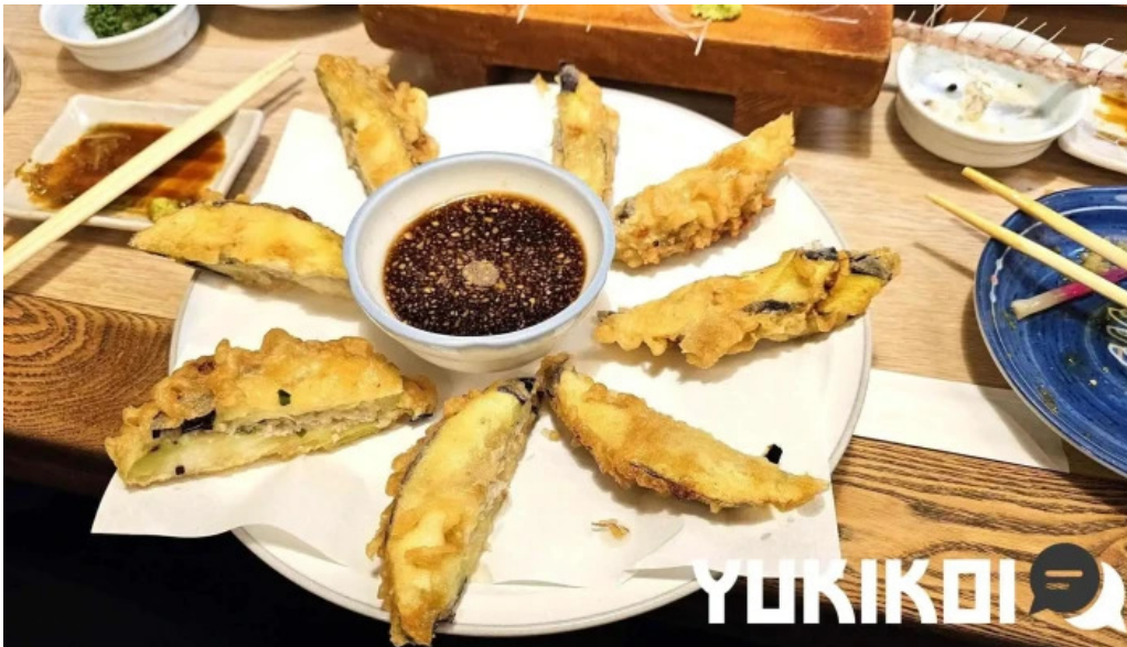
居酒屋さかなや 御殿場本店 天ぷら