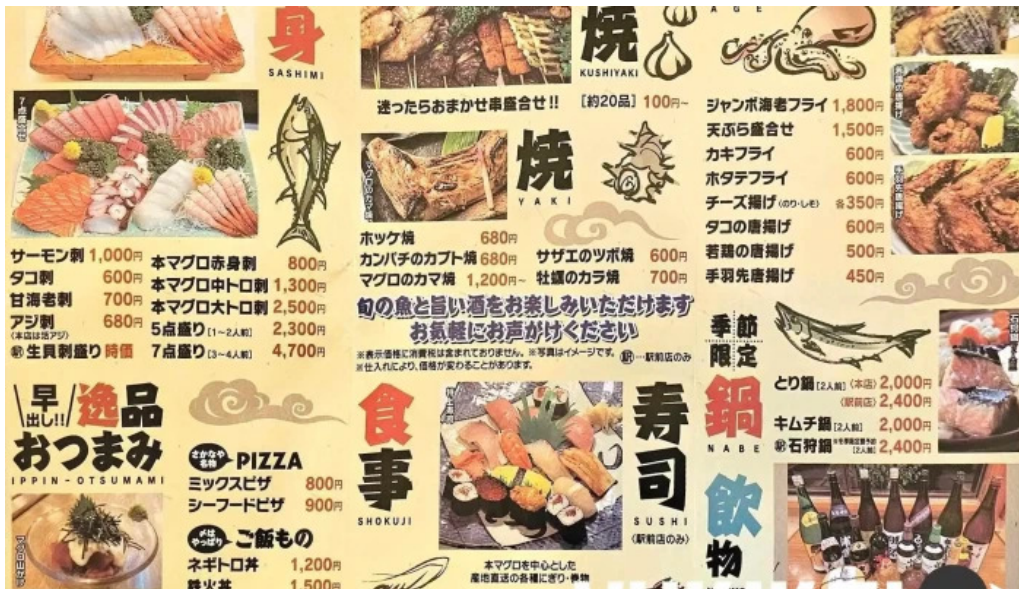
居酒屋さかなや 御殿場本店 メニュー