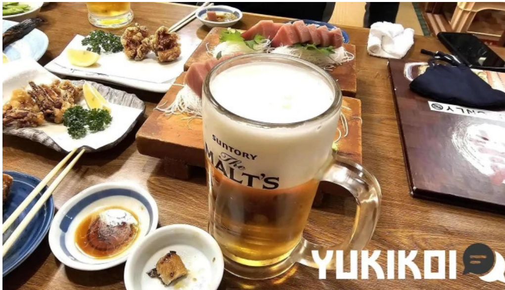
居酒屋さかなや 御殿場本店 ビール