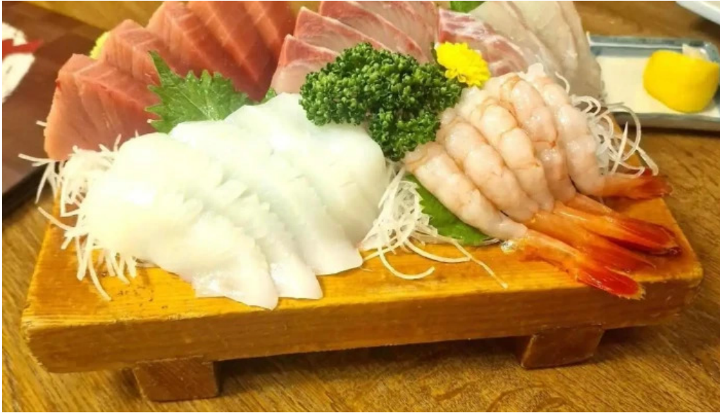
居酒屋さかなや 御殿場本店 料理飲み物