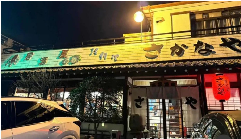
居酒屋さかなや 御殿場本店 御殿場市