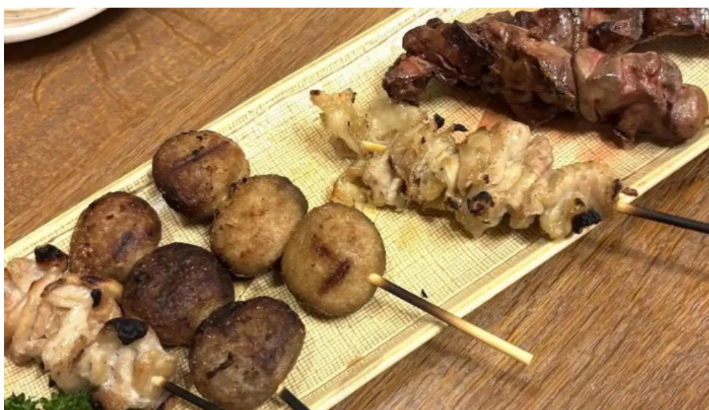
居酒屋さかなや 御殿場本店 最新