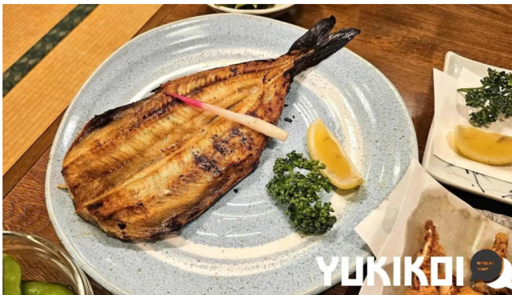
居酒屋さかなや 御殿場本店 サバ