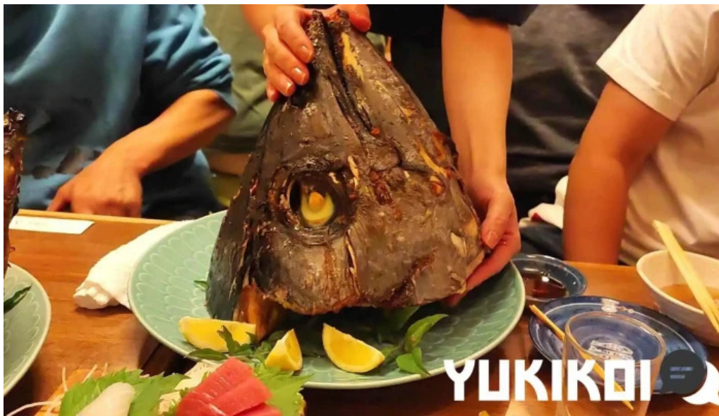
居酒屋さかなや 御殿場本店 動画