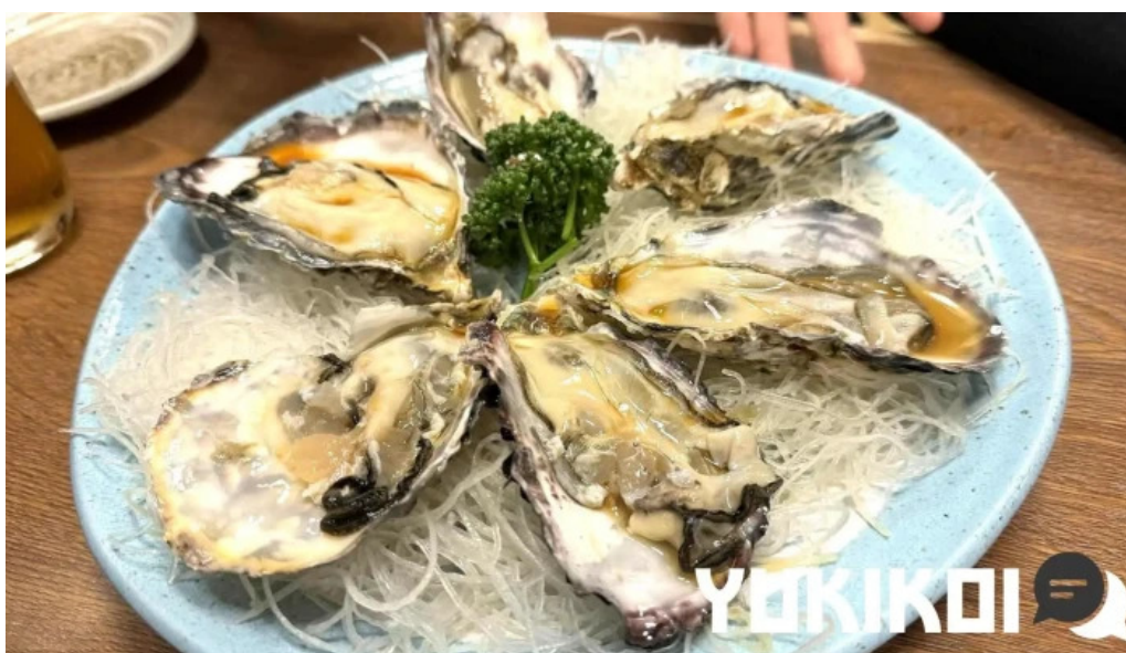
居酒屋さかなや 御殿場本店 カキ