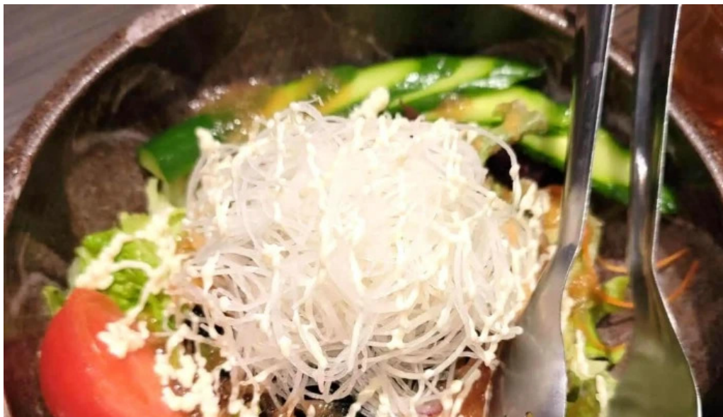
九十厨 御殿場店 プロモーション