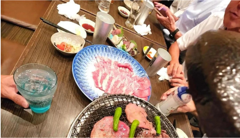
九十厨 御殿場店 営業時間