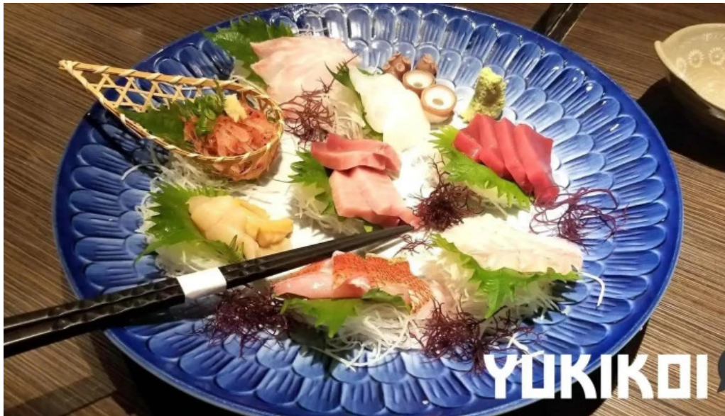
九十厨 御殿場店 刺身