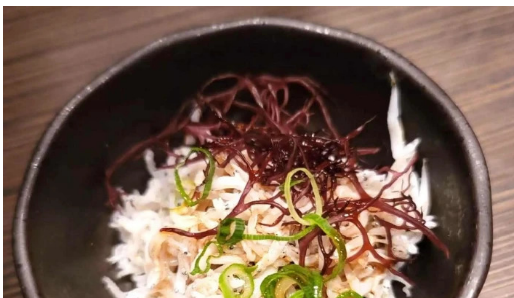
九十厨 御殿場店 どこ