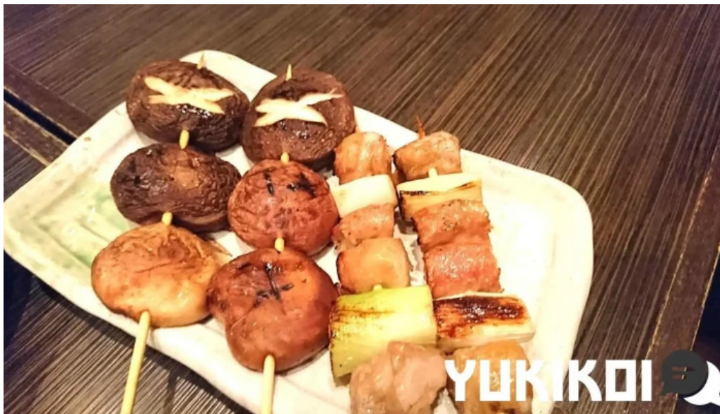
九十厨 御殿場店 料理飲み物