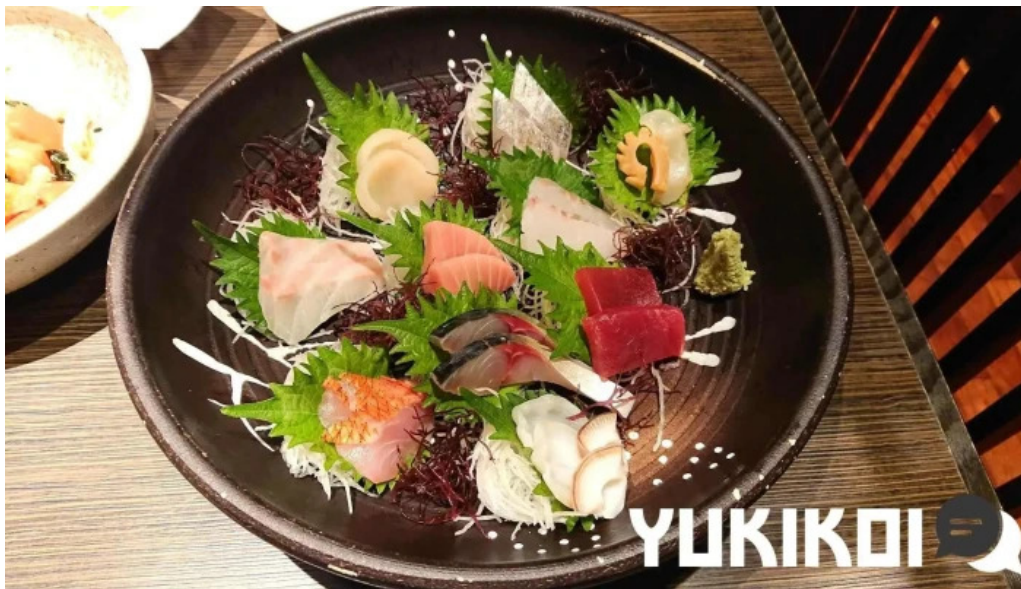
九十厨 御殿場店 シーフード