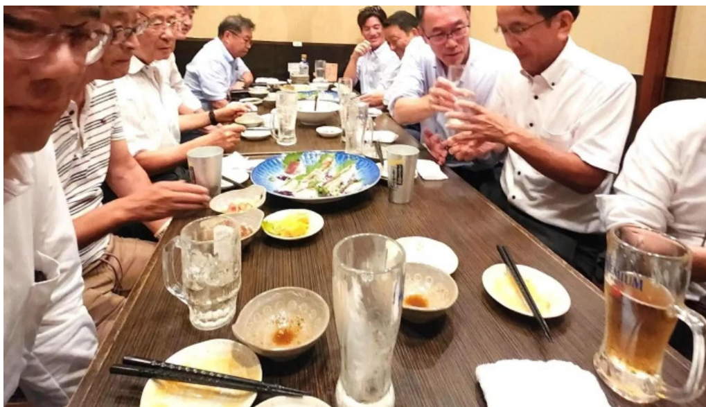
九十厨 御殿場店 エリア