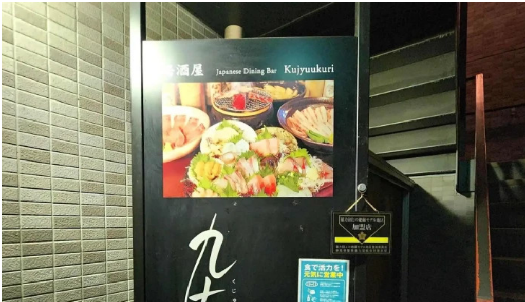
九十厨 御殿場店 営業中