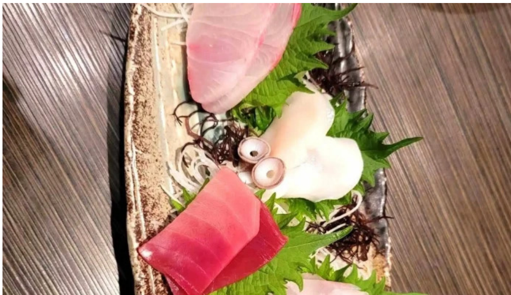
九十厨 御殿場店 コメント