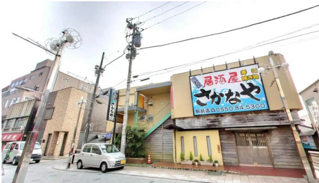
九十厨 御殿場店 御殿場市