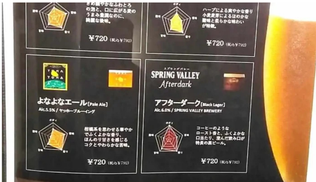
九十厨 御殿場店 メニュー