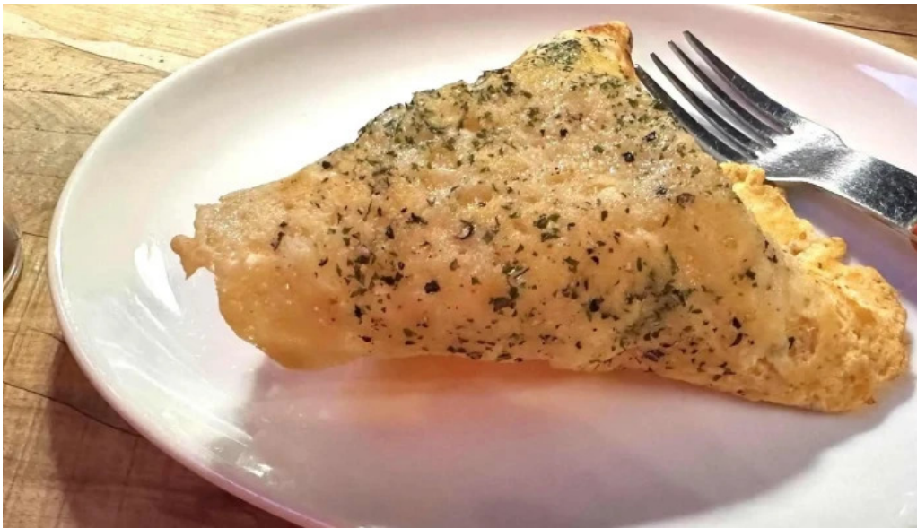
ピザとビール ほらあな 料金