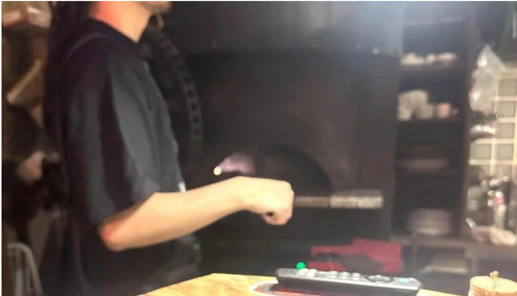
ピザとビールほらあな 動画