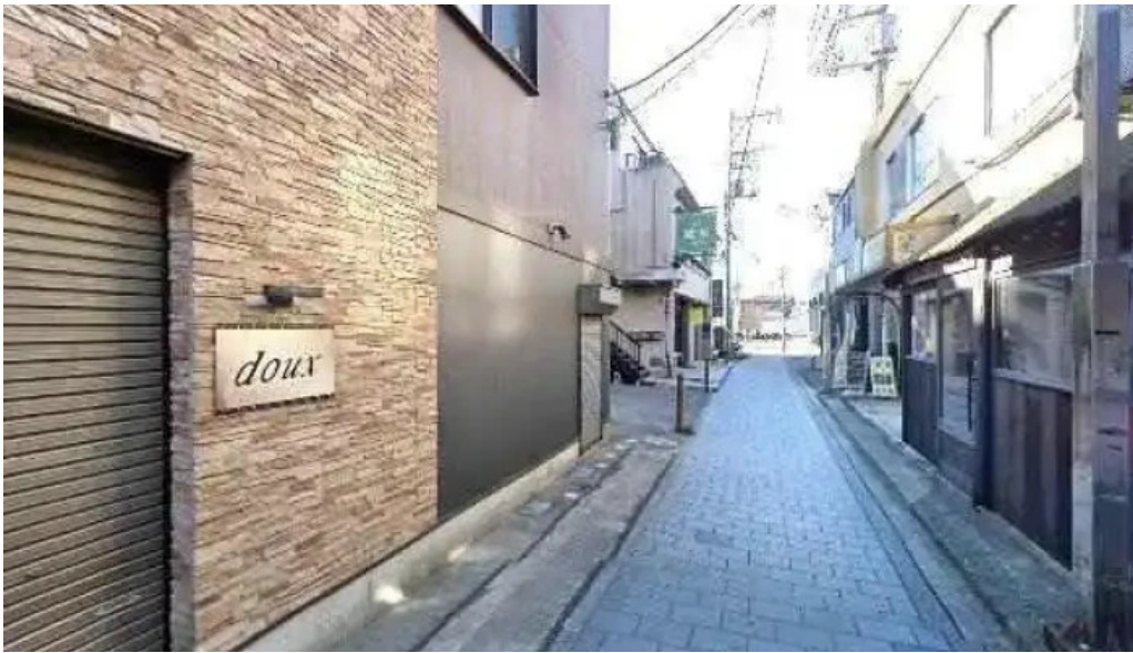
ピザとビール ほらあな 最新