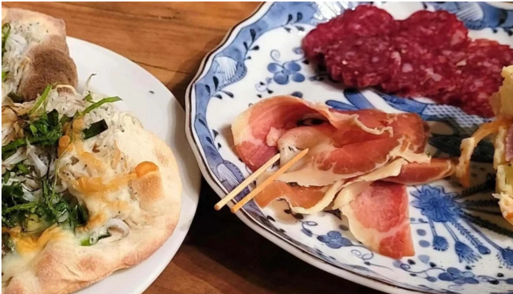
ピザとビール ほらあな 電話