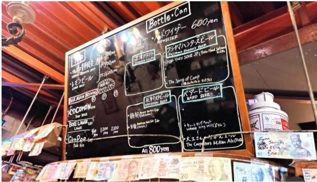
ピザとビール ほらあな メニュー