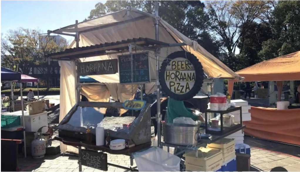
ピザとビール ほらあな 雰囲気