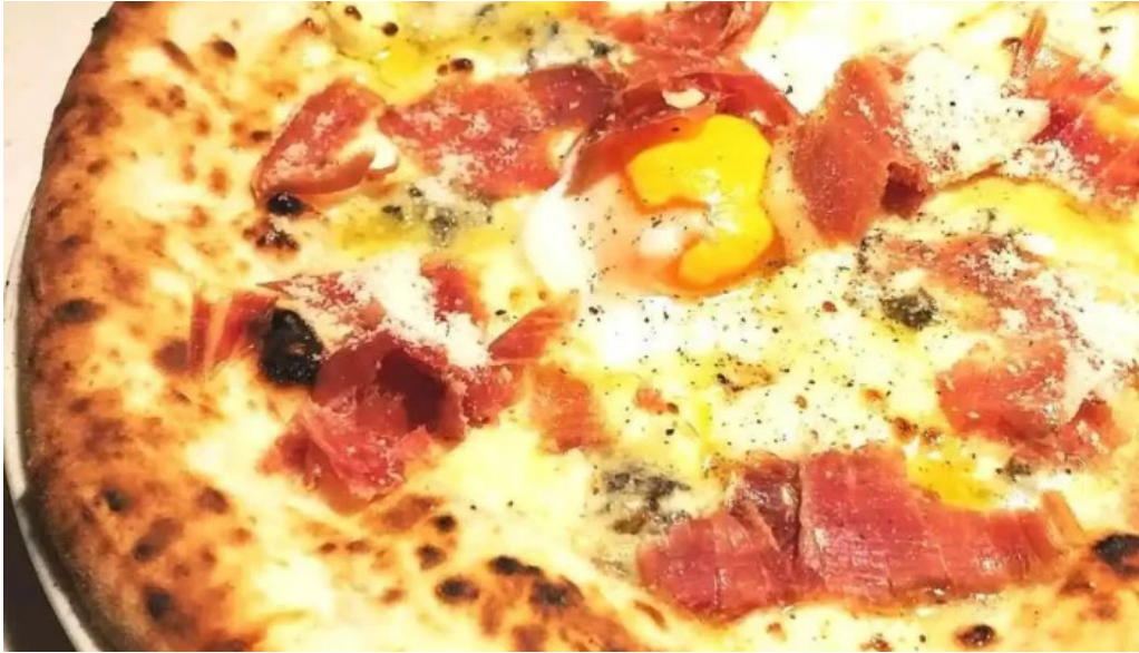
ピザとビール ほらあな 料理飲み物