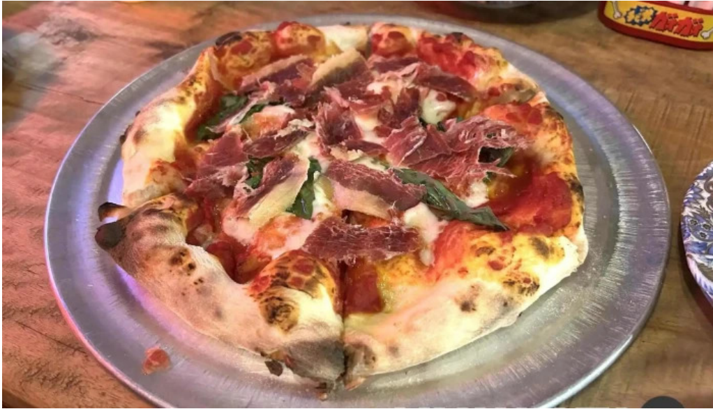
ピザとビール ほらあな ピザ