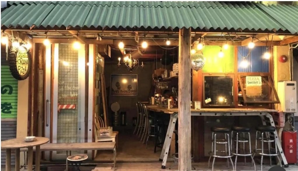
ピザとビール ほらあな