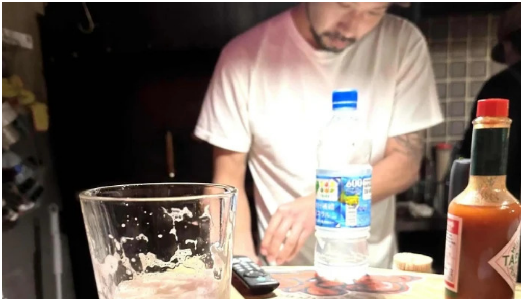
ピザとビール ほらあな 御殿場市