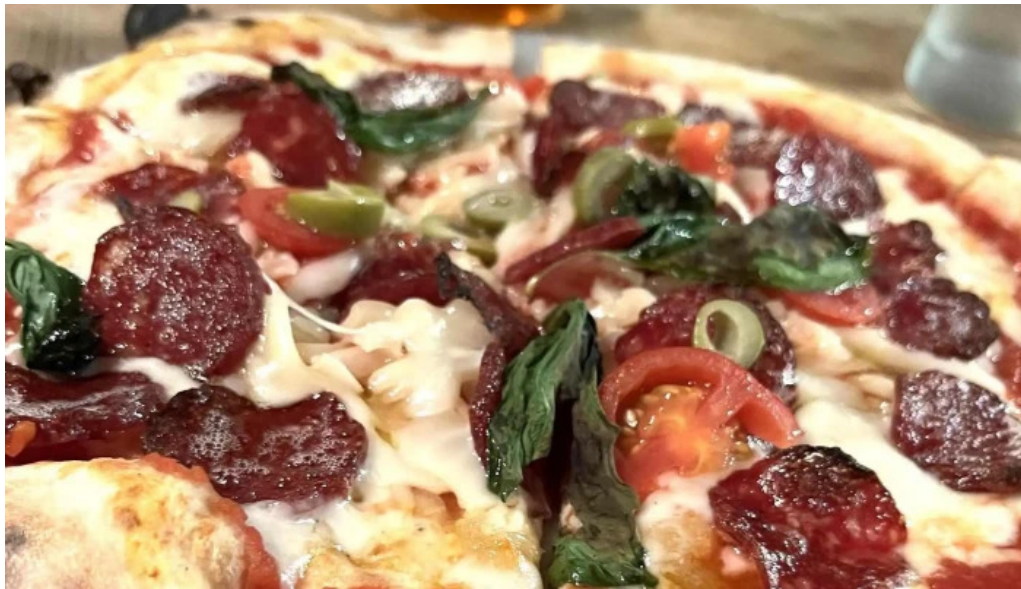
ピザとビール ほらあな プロモーション