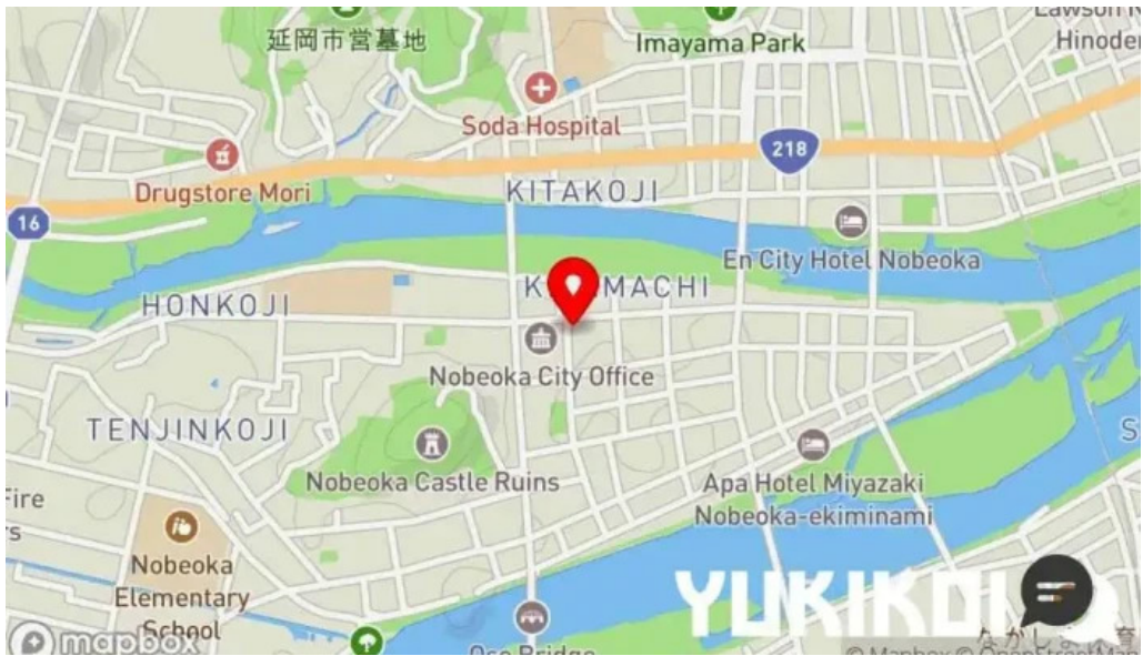
酒饌 とが和 地図