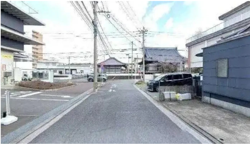
酒饌 とが和 延岡市