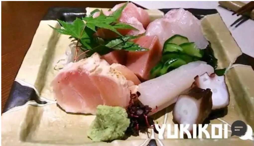
酒饌 とが和 刺身