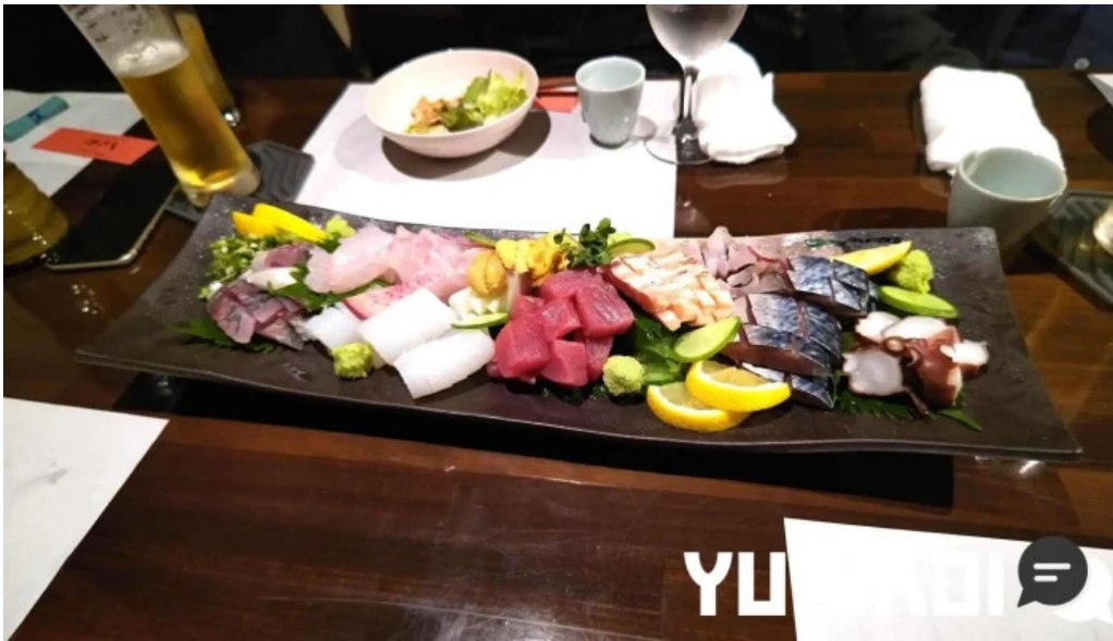
酒饌 とが和 最新