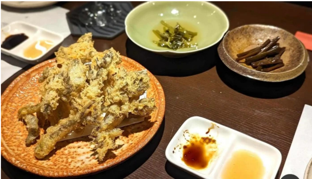
酒饌 とが和 天ぷら