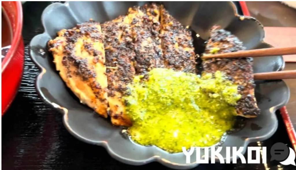
酒饌 とが和 料理飲み物