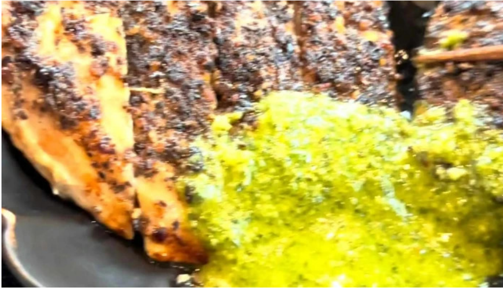
酒饌 とが和 プロモーション