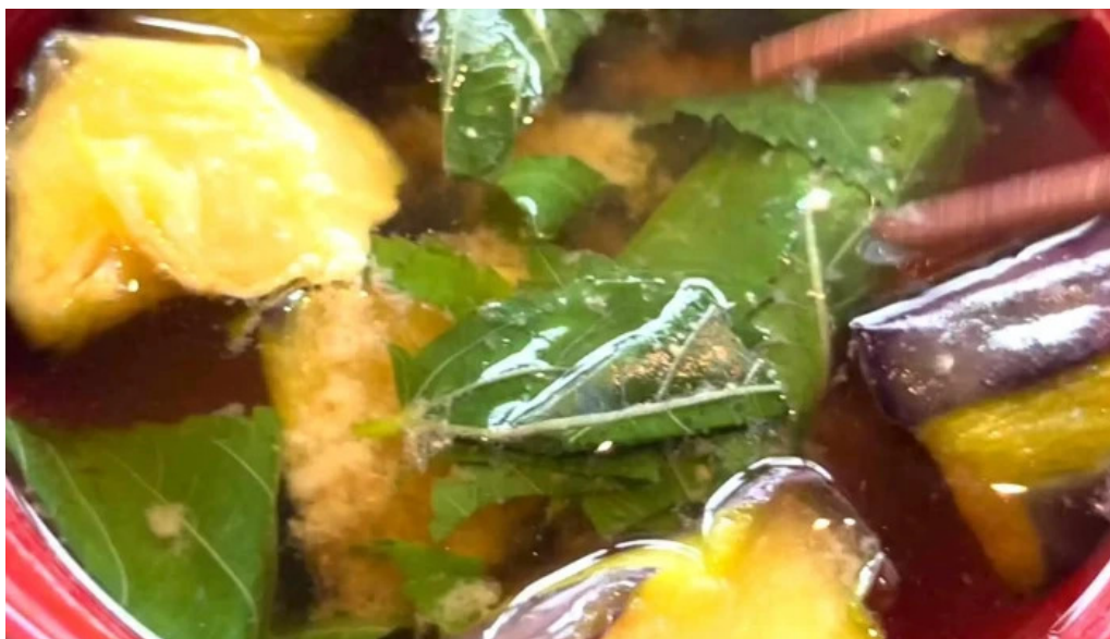
酒饌 とが和 コメント