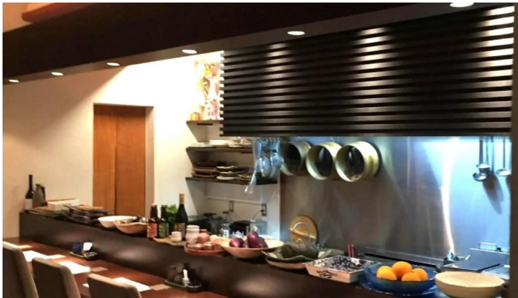
酒饌 とが和 雰囲気