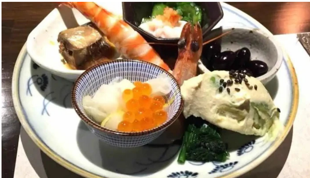
酒饌 とが和 懐石