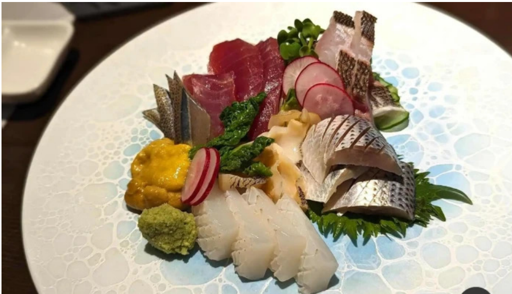
酒饌 とが和 シーフード