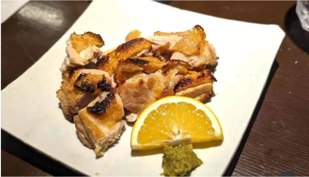
酒饌 とが和 焼き鳥