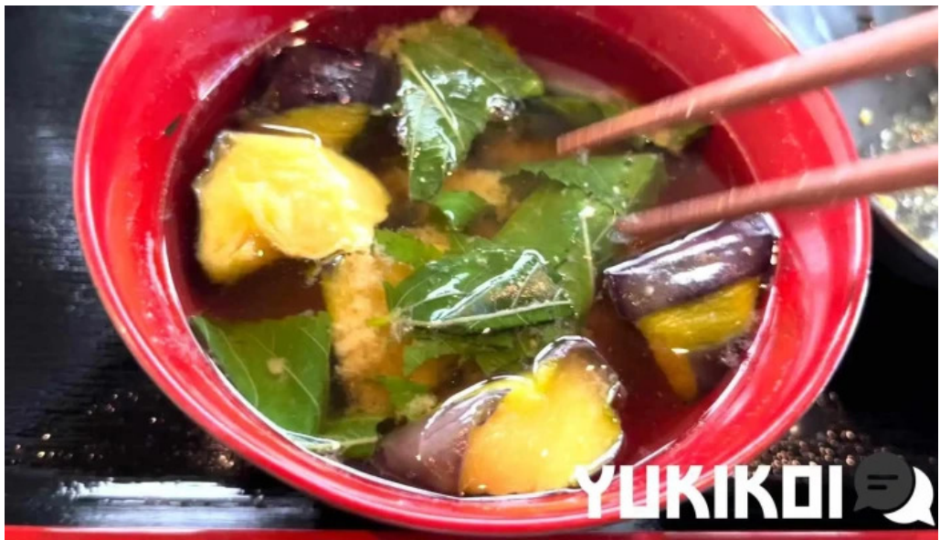
酒饌 とが和 動画