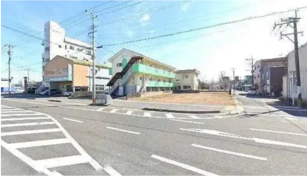
旬魚旬彩 うどう 延岡市