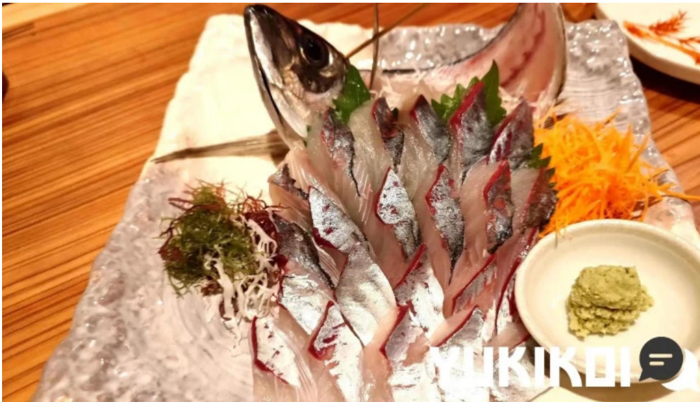
旬魚旬彩 うどう シーフード