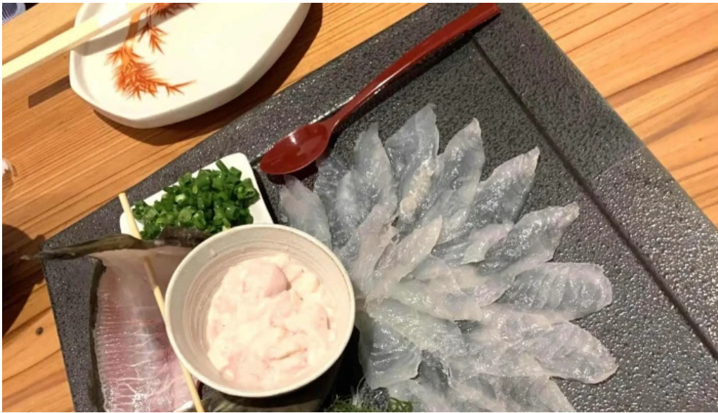
旬魚旬彩 うどん 割引