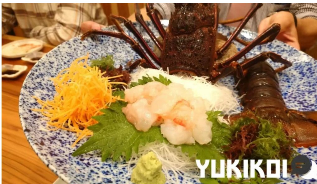
旬魚旬彩 うどう 活き造り