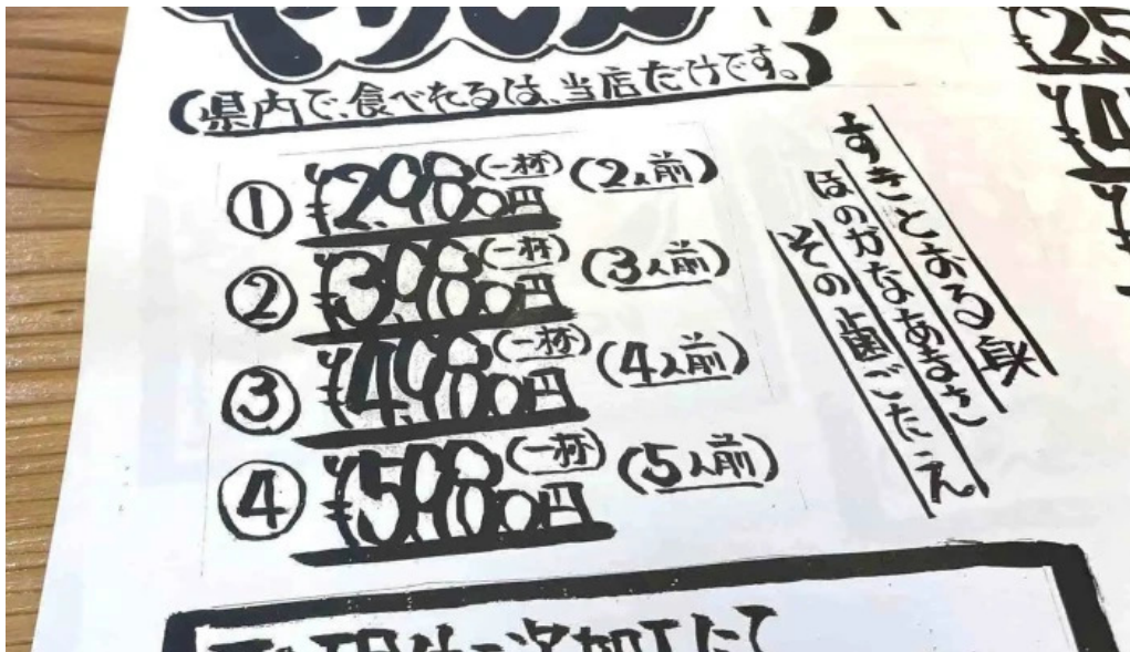
旬魚旬彩 うどう メニュー