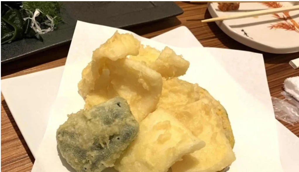
旬魚旬彩 うどう instagram