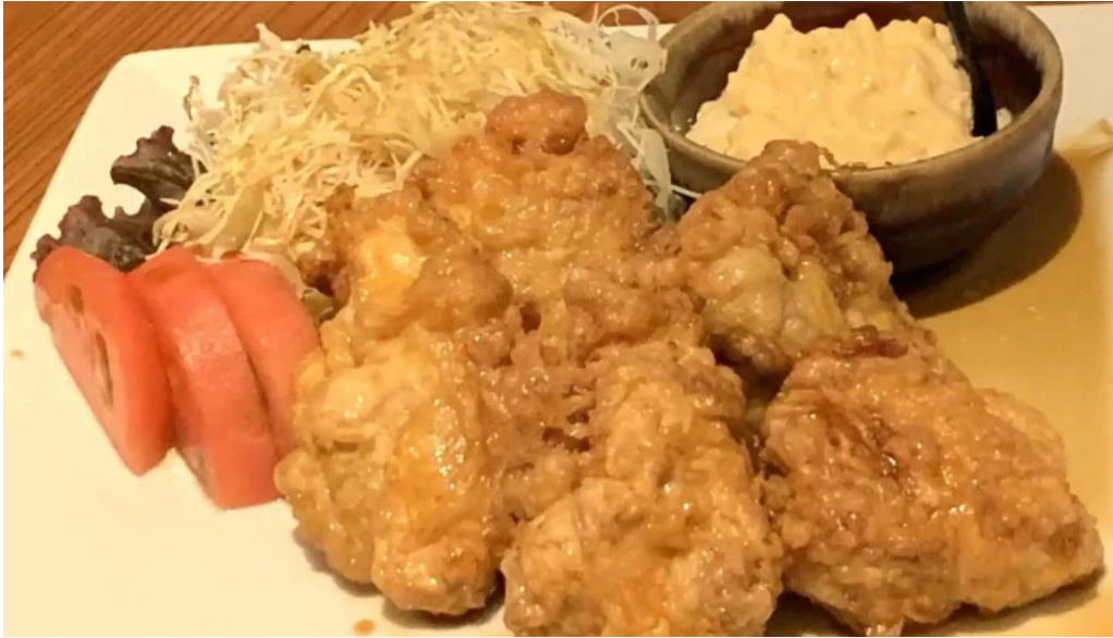
旬魚旬彩 うどう カタログ