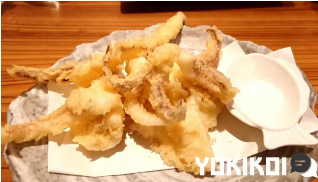
旬魚旬彩 うどう 天ぷら