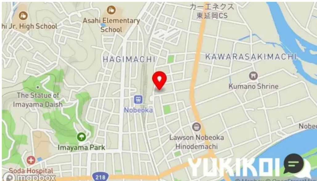
旬魚旬彩 うどう 地図