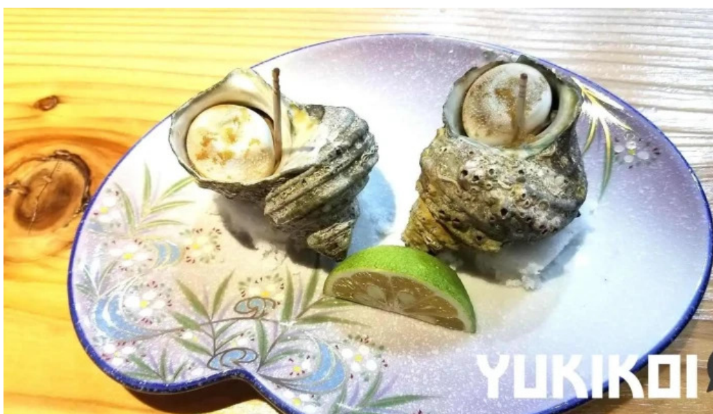
旬魚旬彩 うどう 料理飲み物