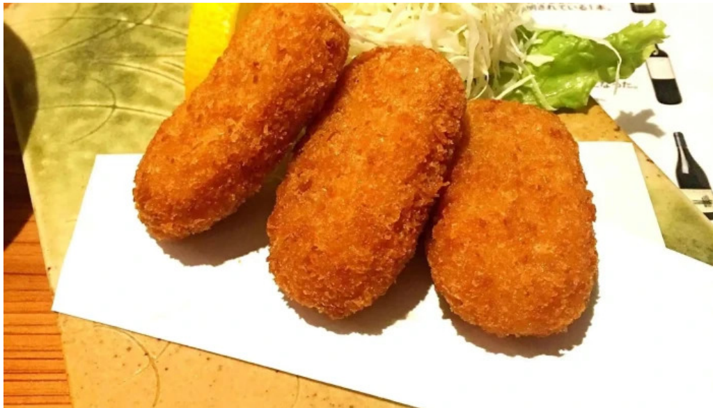
旬魚旬彩 うどう 動画