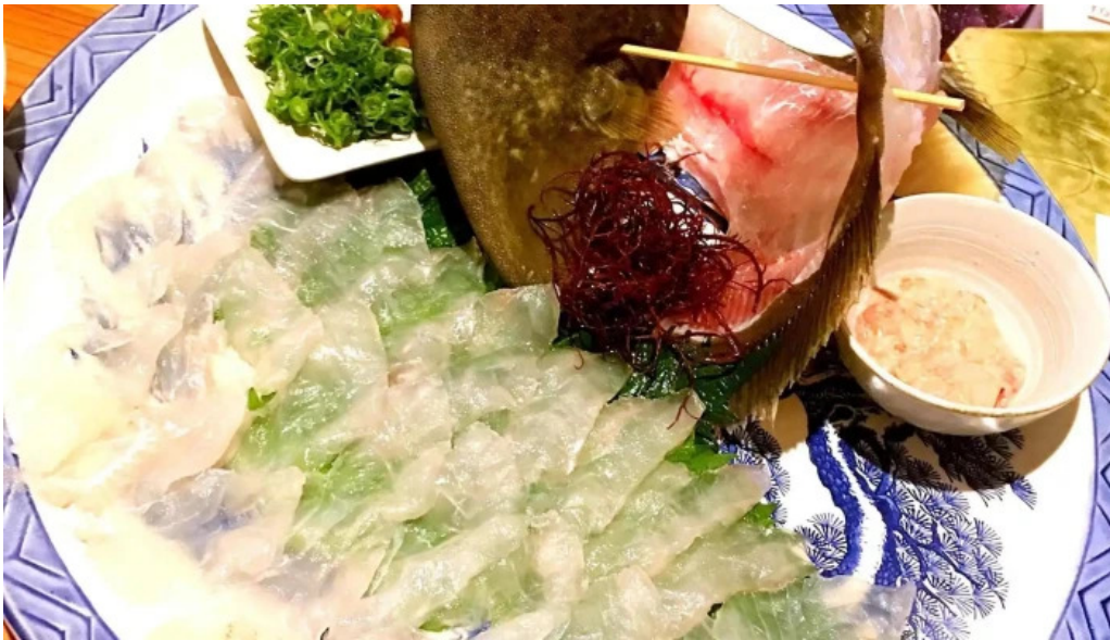
旬魚旬彩 うどん 写真