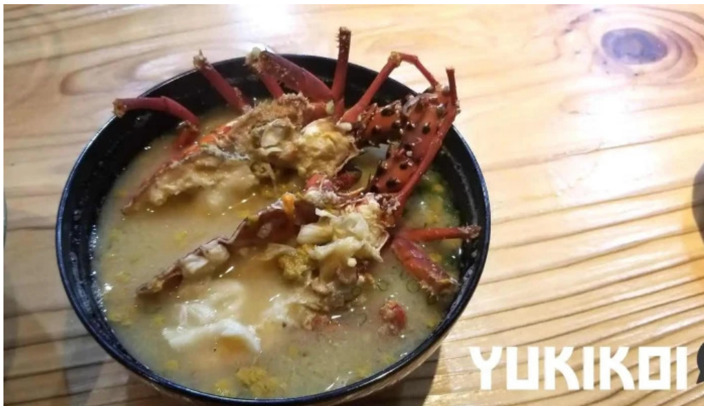
旬魚旬彩 うどう スープ