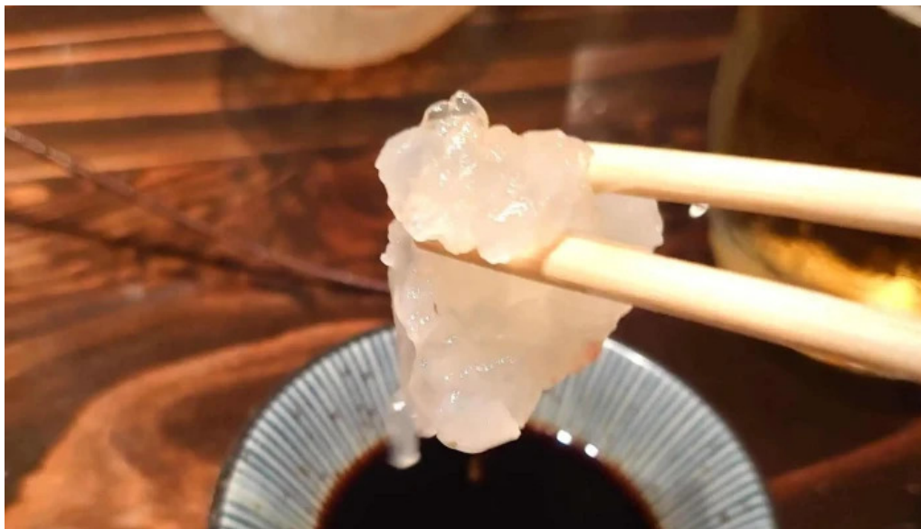
旬菜 ゆるり家 行き方