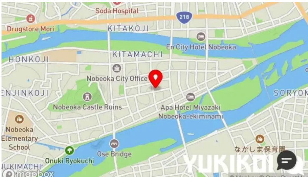
旬菜 ゆるり家 地図