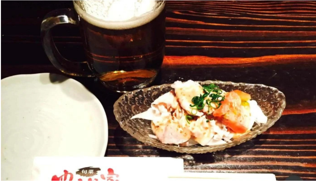
旬菜 ゆるり家 料理飲み物