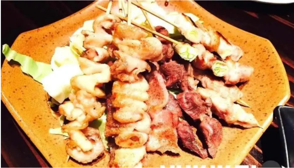
旬菜 ゆるり家 シーフード