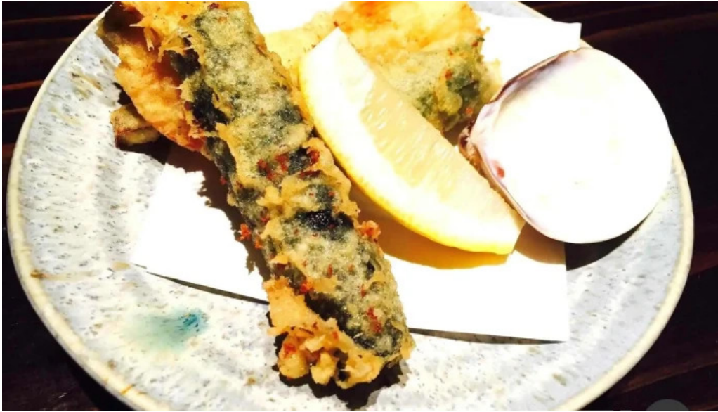
旬菜 ゆるり家 天ぷら