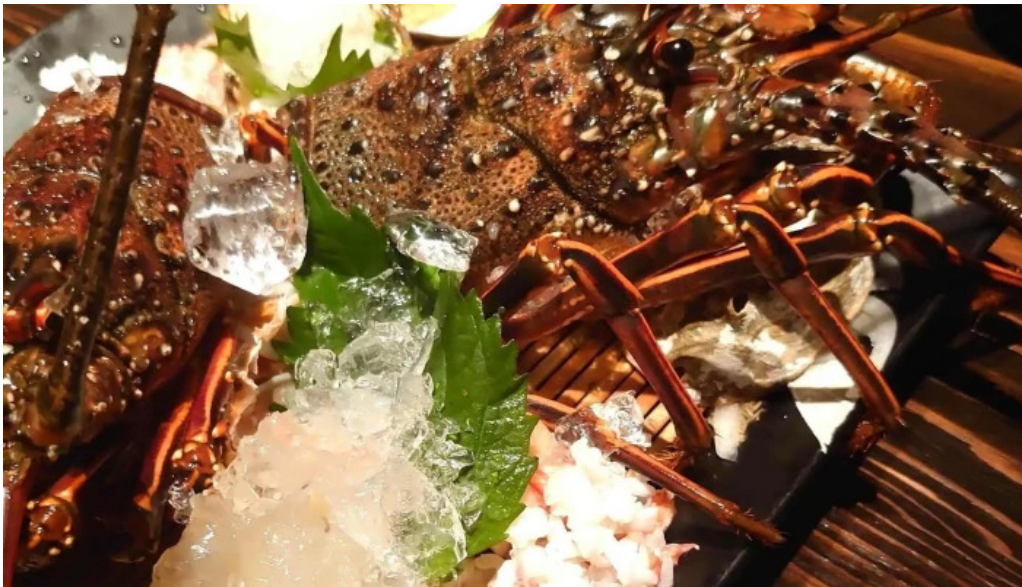
旬菜 ゆるり家 instagram