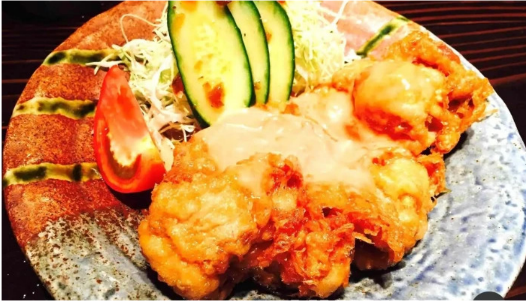
旬菜 ゆるり家 から揚げ