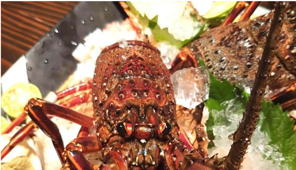
旬菜 ゆるり家 カタログ