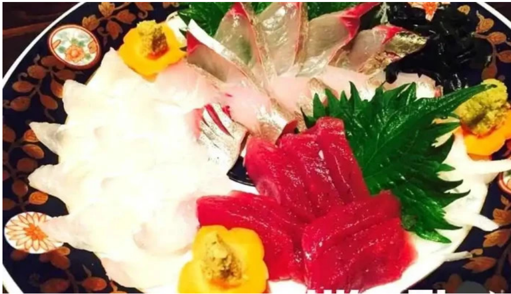
旬菜 ゆるり家 刺身