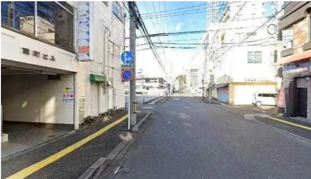
旬菜 ゆるり家 延岡市