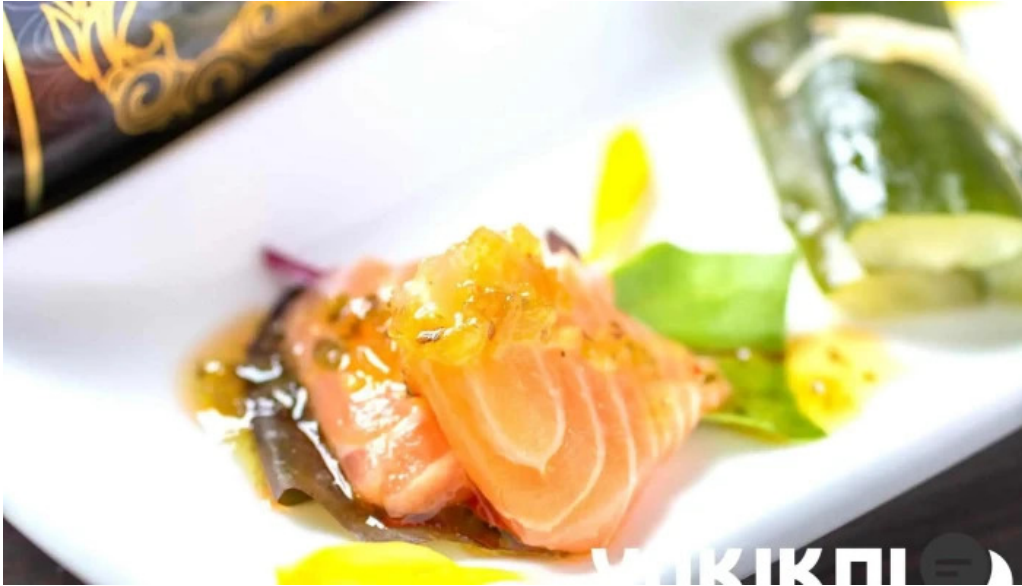
寝屋川創作酒家 吉利 料理飲み物