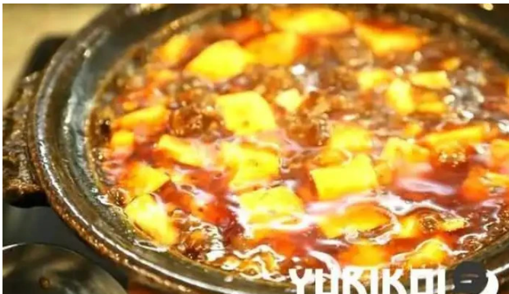
寝屋川創作酒家 吉利 麻婆豆腐