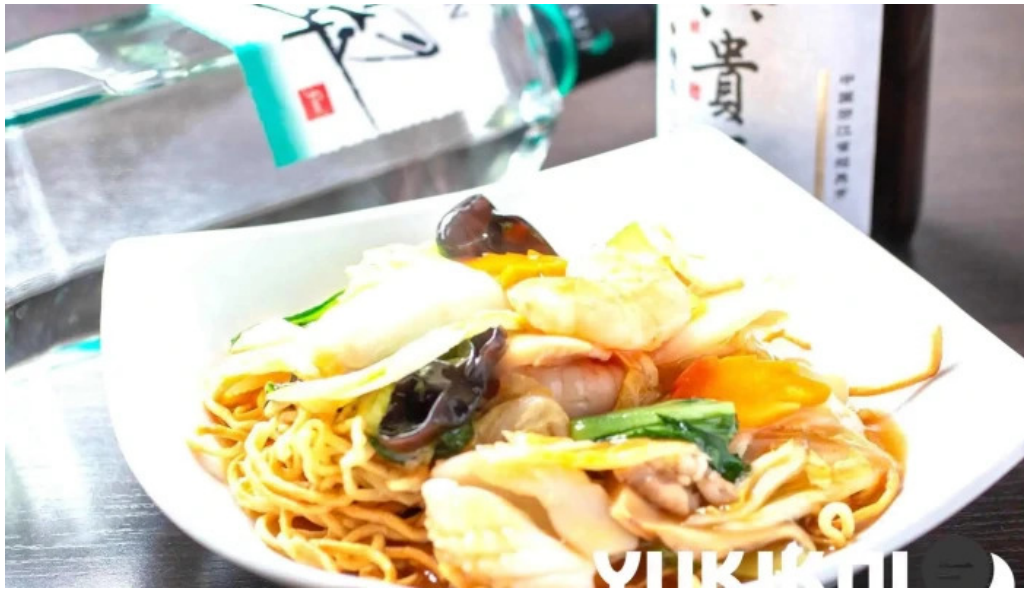
寝屋川創作酒家 吉利 麵