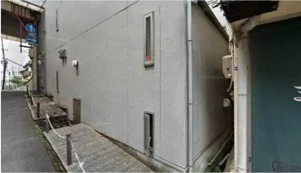
寝屋川創作酒家 吉利 寝屋川市