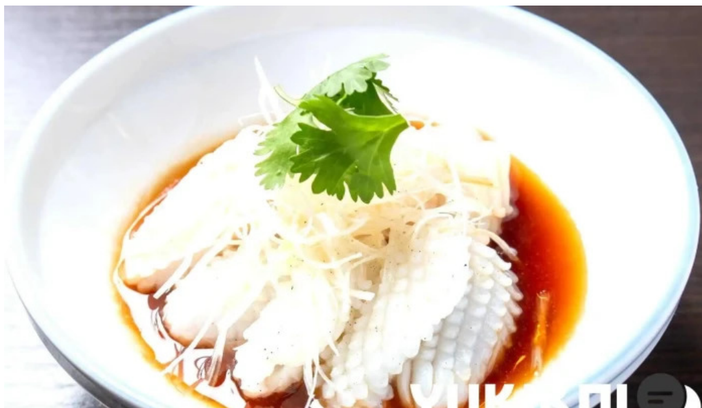
寝屋川創作酒家 吉利 スープ