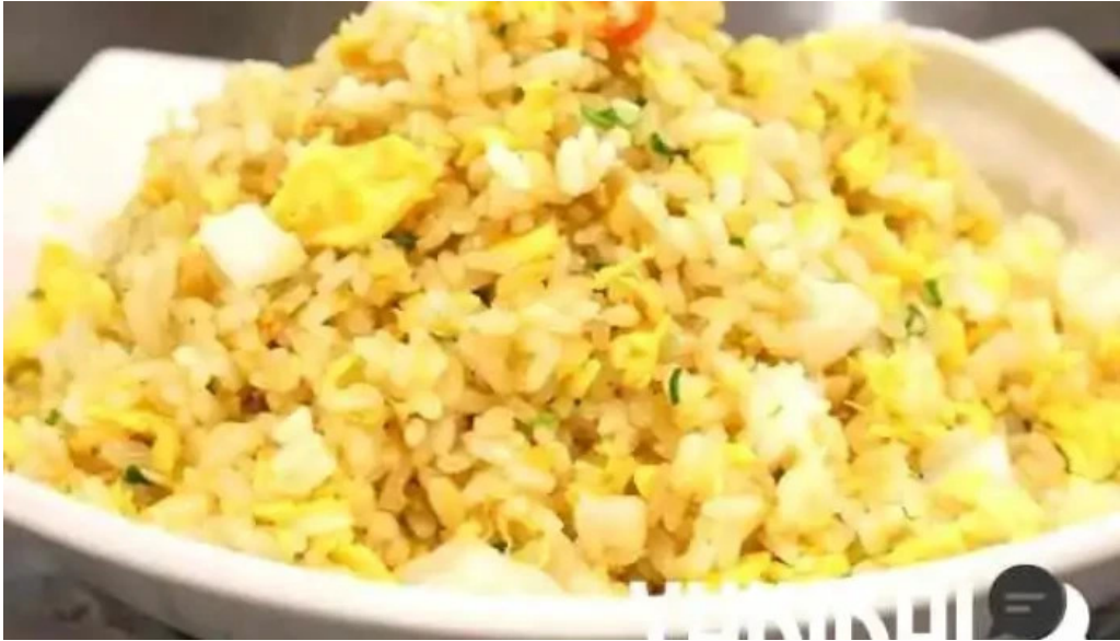
寝屋川創作酒家 吉利 焼き飯