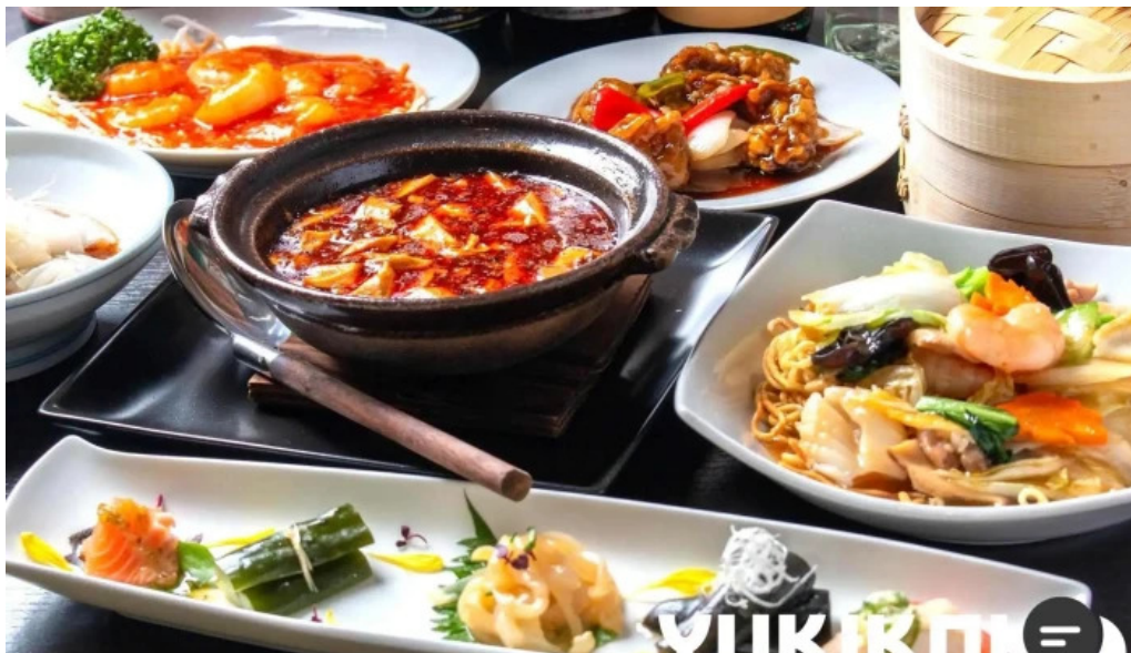
寝屋川創作酒家 吉利