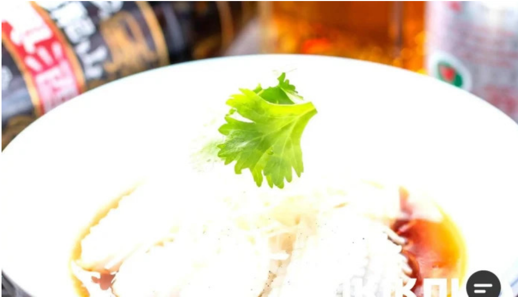
寝屋川創作酒家 吉利 揚げ出し豆腐