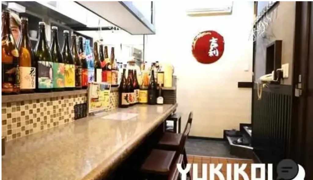
寝屋川創作酒家 吉利 雰囲気