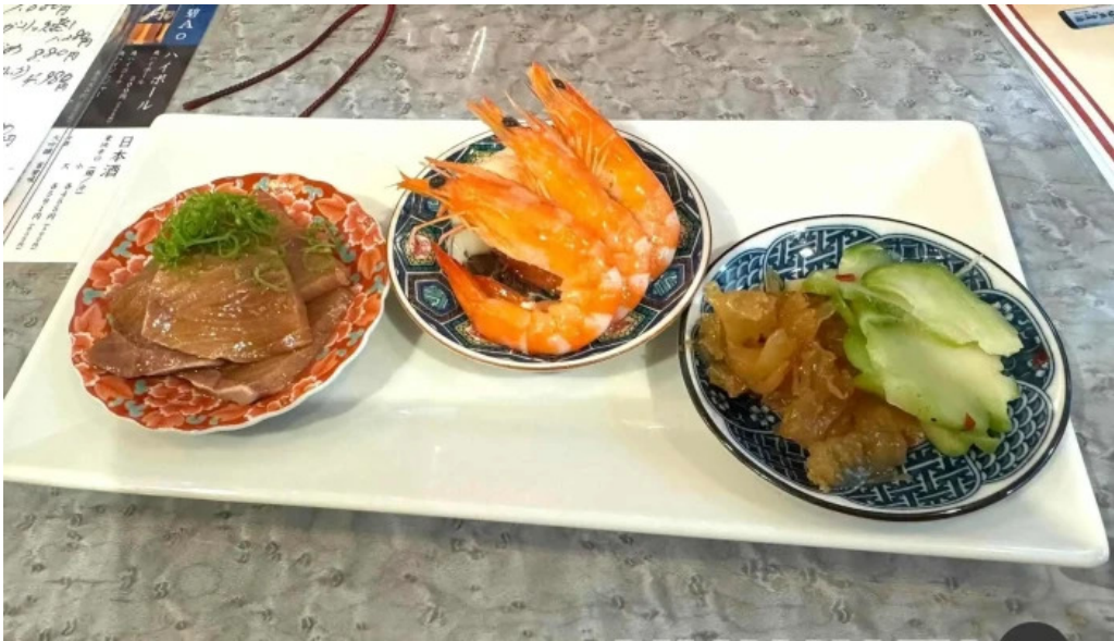
寝屋川創作酒家 吉利 最新