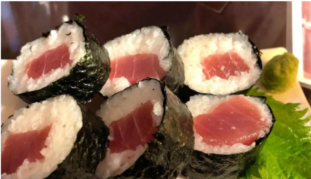
宴屋 じんべい 寝屋川店 番号