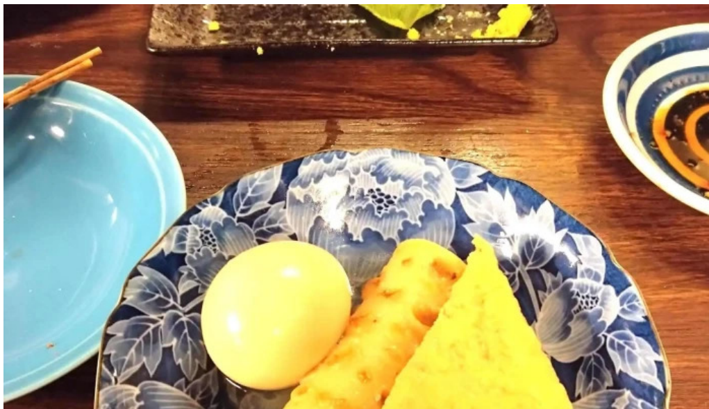
宴屋 じんべい 寝屋川店 近く