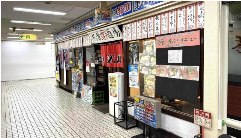
宴屋 じんべい 寝屋川店 雰囲気