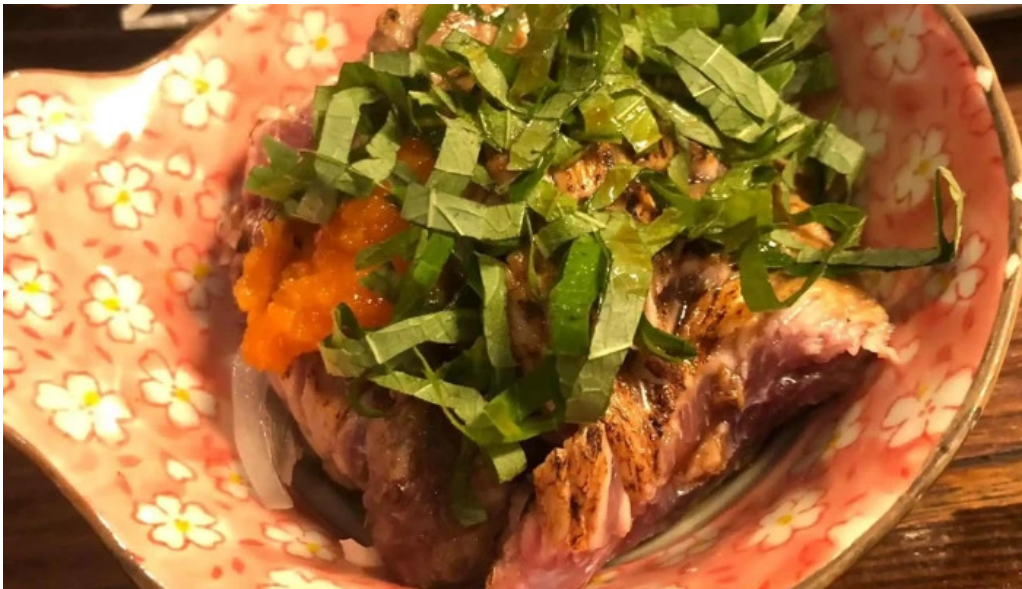
宴屋 じんべい 寝屋川店 instagram