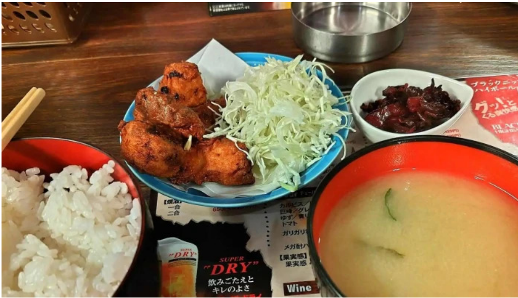
宴屋 じんべい 寝屋川店 行き方