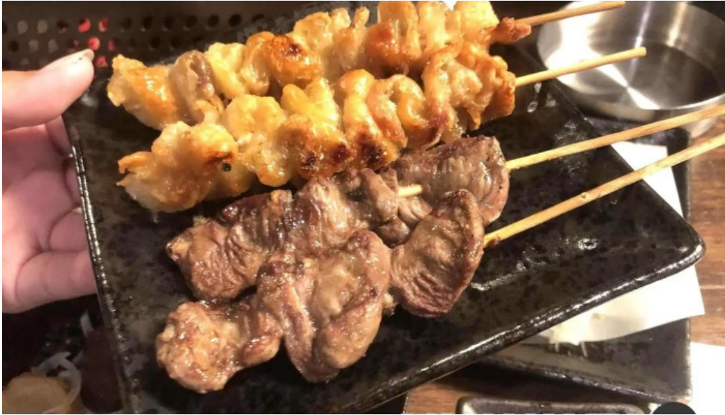
宴屋 じんべい 寝屋川店 料理飲み物