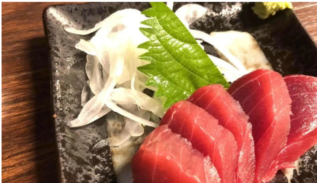
宴屋 じんべい 寝屋川店 カタログ