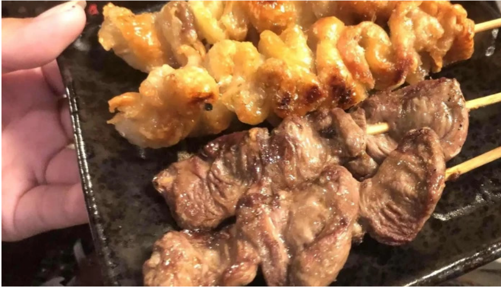
宴屋 じんべい 寝屋川店 どこ