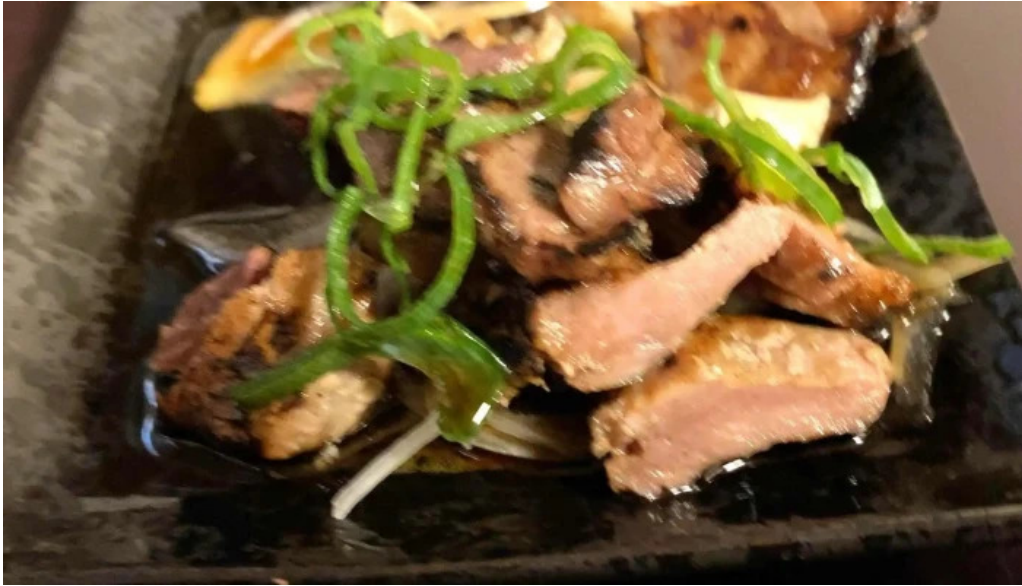
宴屋 じんべい 寝屋川店 口コミ