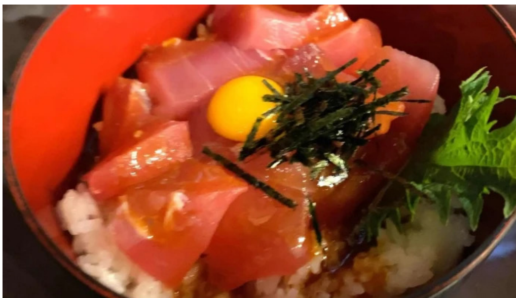
宴屋 じんべい 寝屋川店 電話