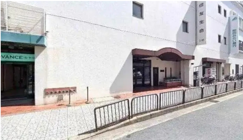
宴屋 じんべい 寝屋川店 寝屋川市