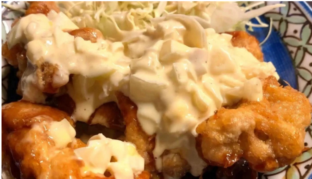
宴屋 じんべい 寝屋川店 営業中