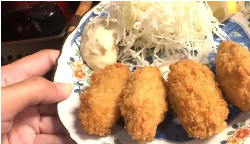
宴屋 じんべい 寝屋川店 住所