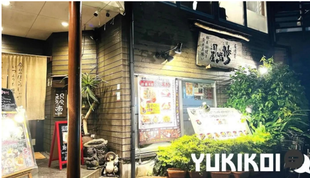
居酒屋誇羅司屋2号店 最新