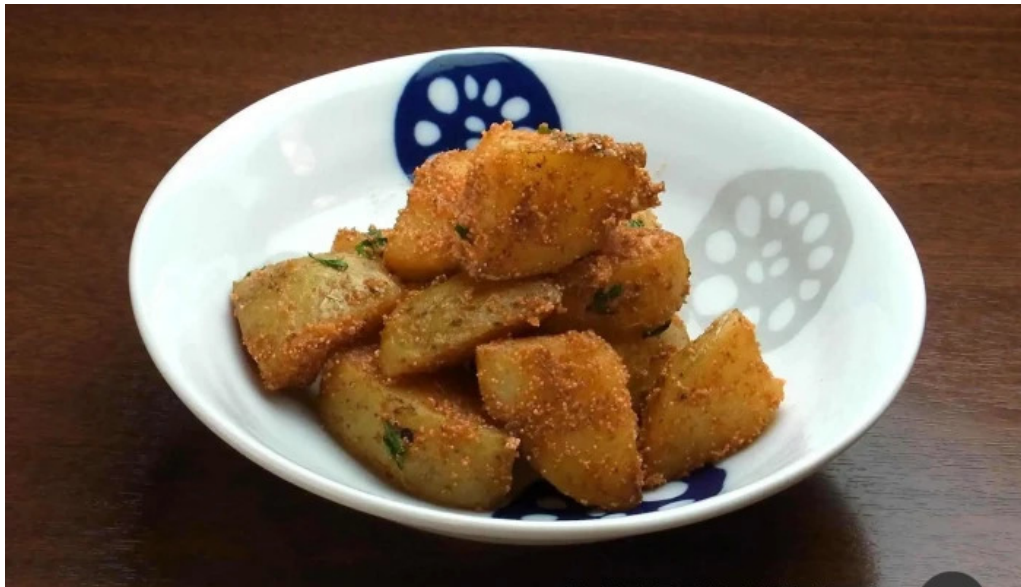
居酒屋誇羅司屋2号店 料理飲み物