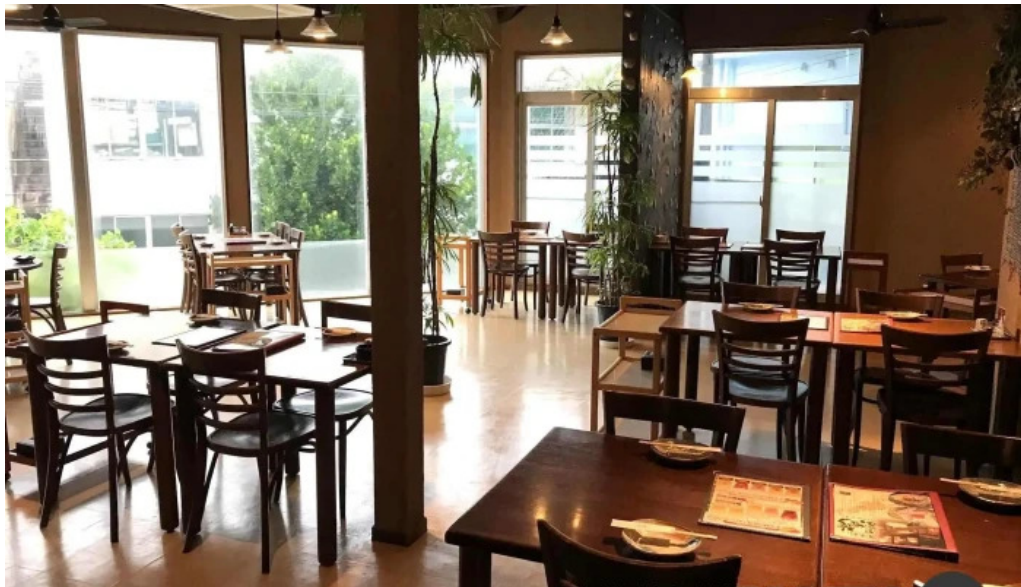
居酒屋誇羅司屋2号店 奄美市