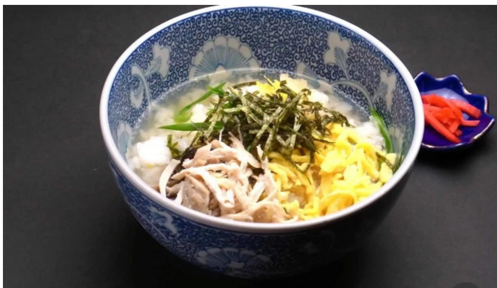
居酒屋誇羅司屋2号店 麺