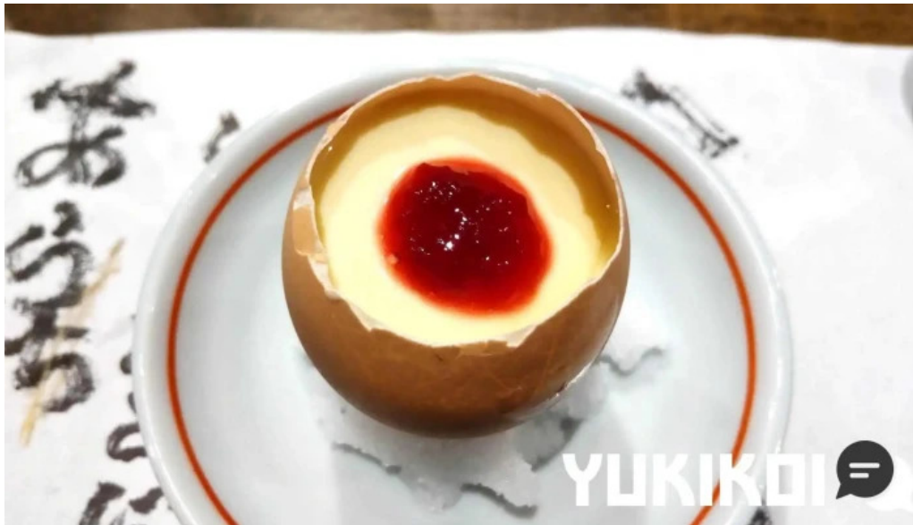
居酒屋誇羅司屋2号店 パンナコッタ