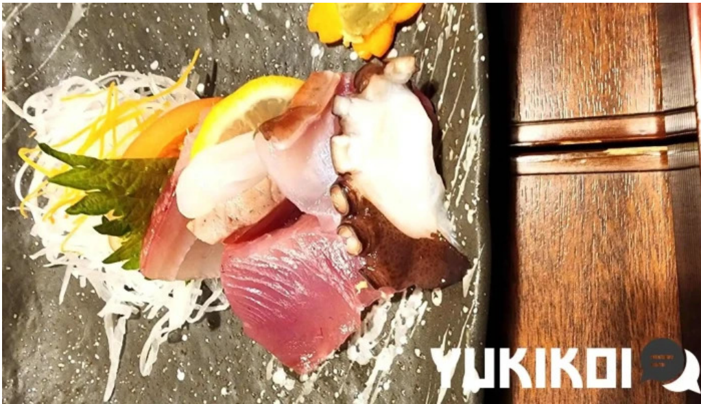
居酒屋誇羅司屋2号店 刺身