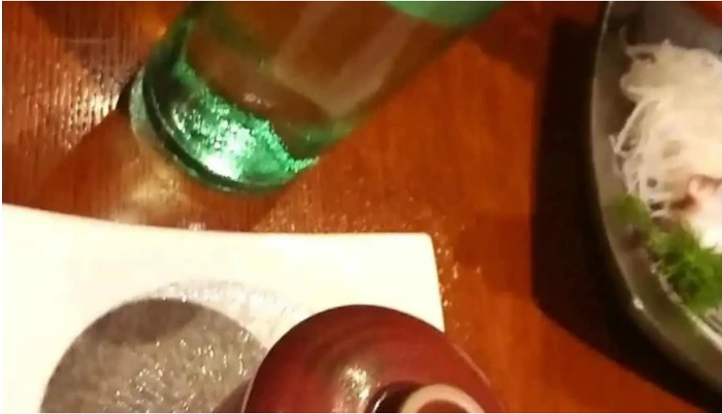
居酒屋誇羅司屋2号店 動画