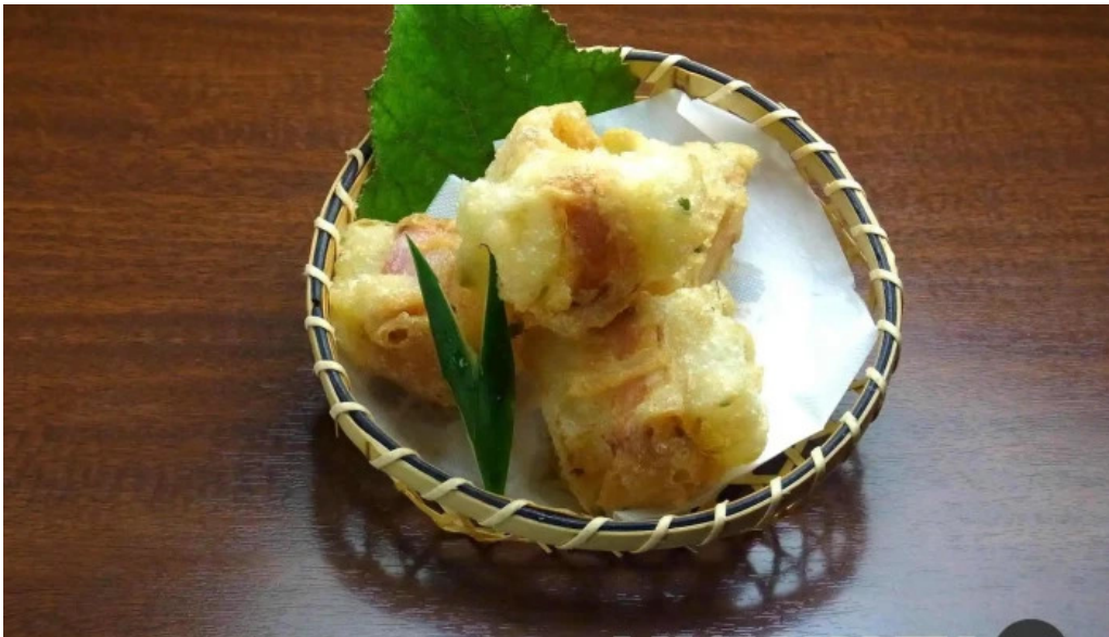
居酒屋誇羅司屋2号店 天ぷら