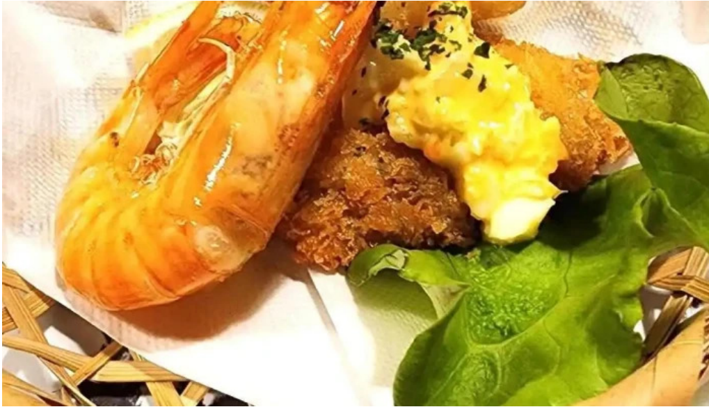
居酒屋誇羅司屋2号店 エビ