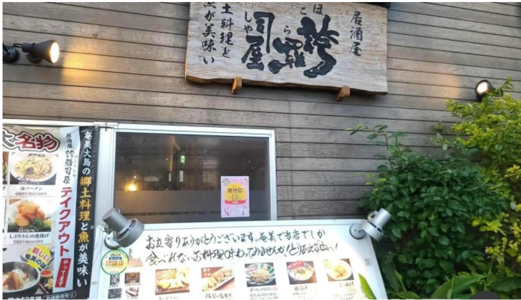
居酒屋誇羅司屋2号店 メニュー