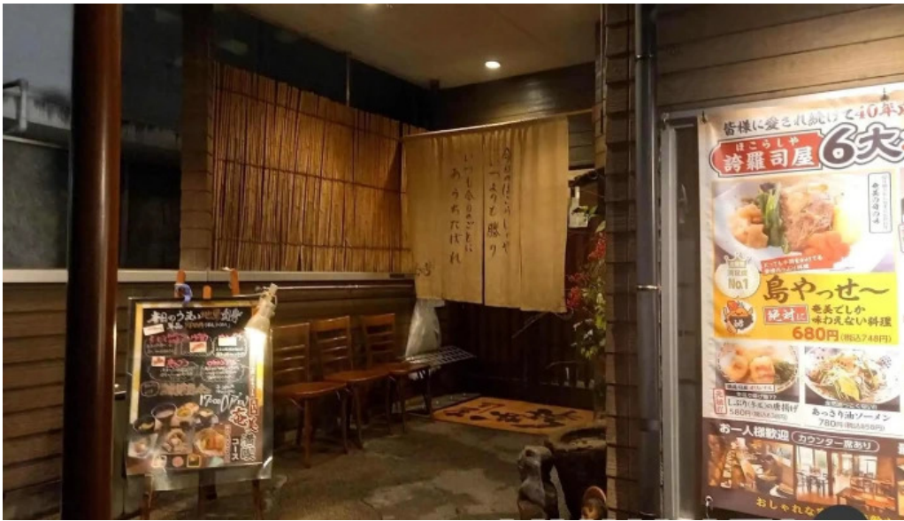
居酒屋誇羅司屋2号店 雰囲気