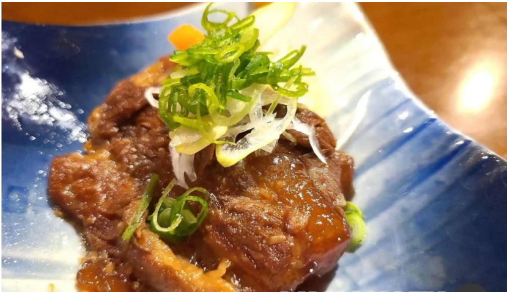
居酒屋誇羅司屋2号店 角煮