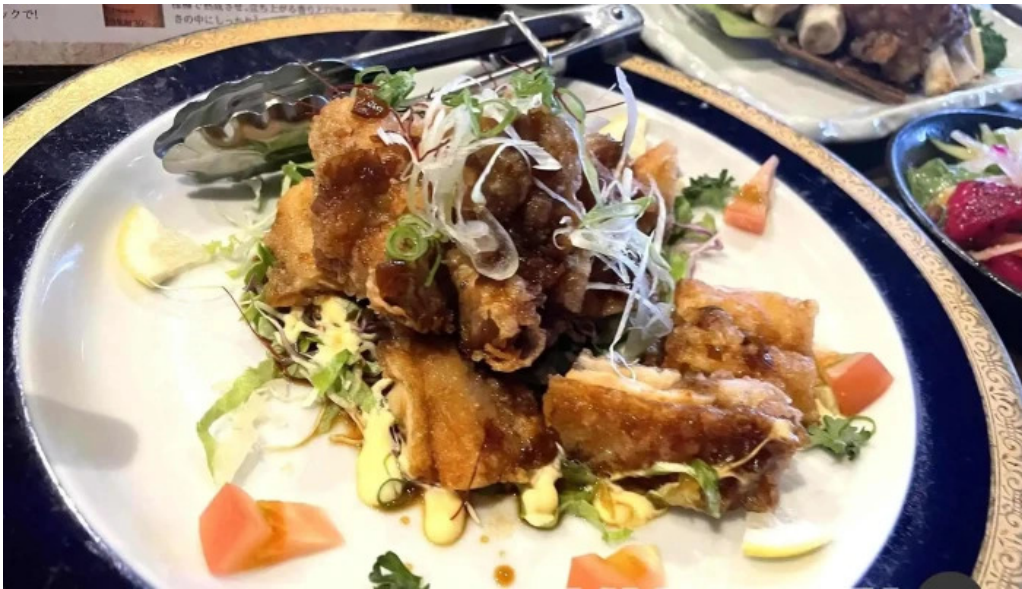
居酒屋誇羅司屋2号店 焼き鳥