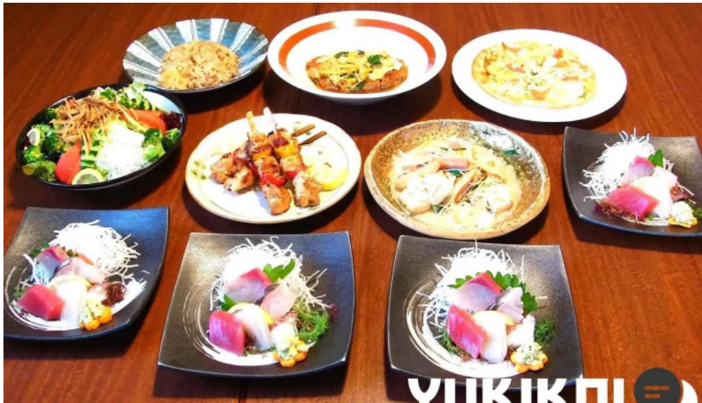
居酒屋誇羅司屋2号店 懐石