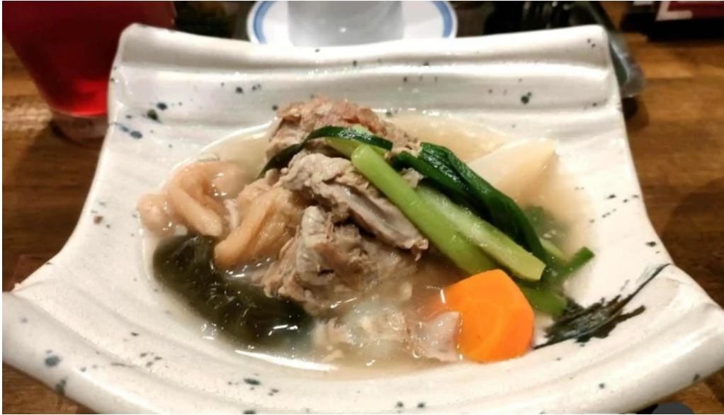
居酒屋誇羅司屋2号店 蕎麦