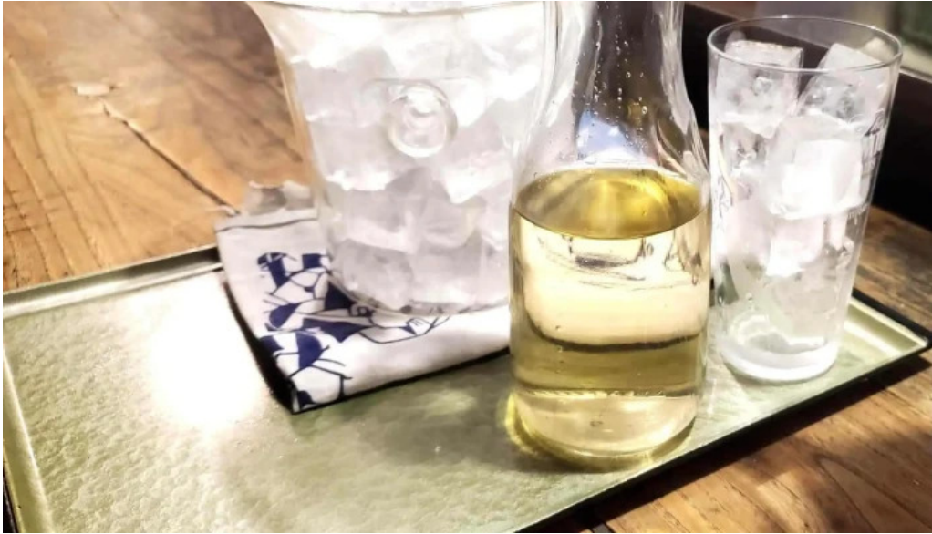
和知 プロモーション