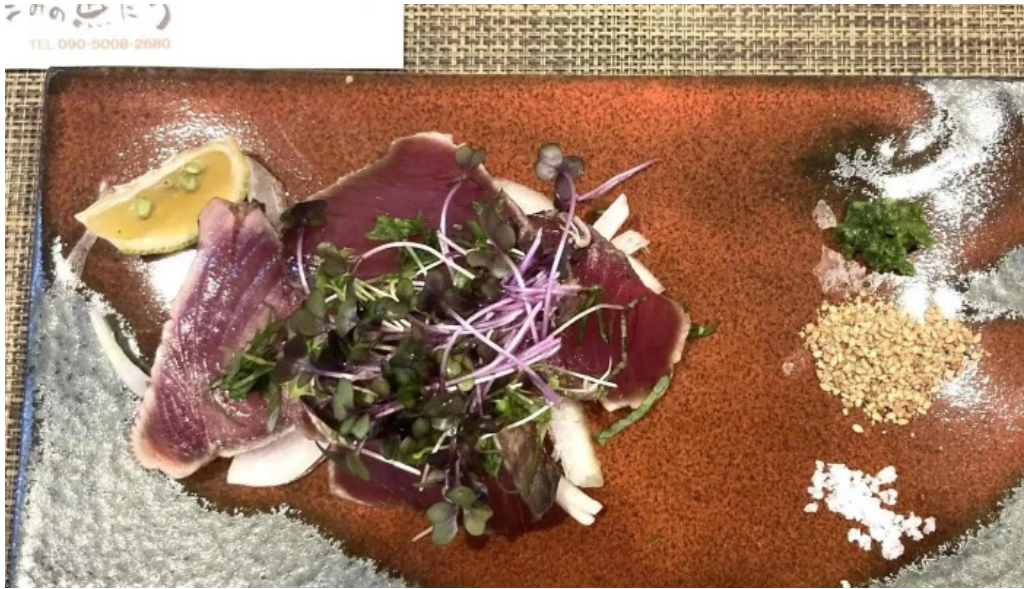
あまみの魚たち 電話