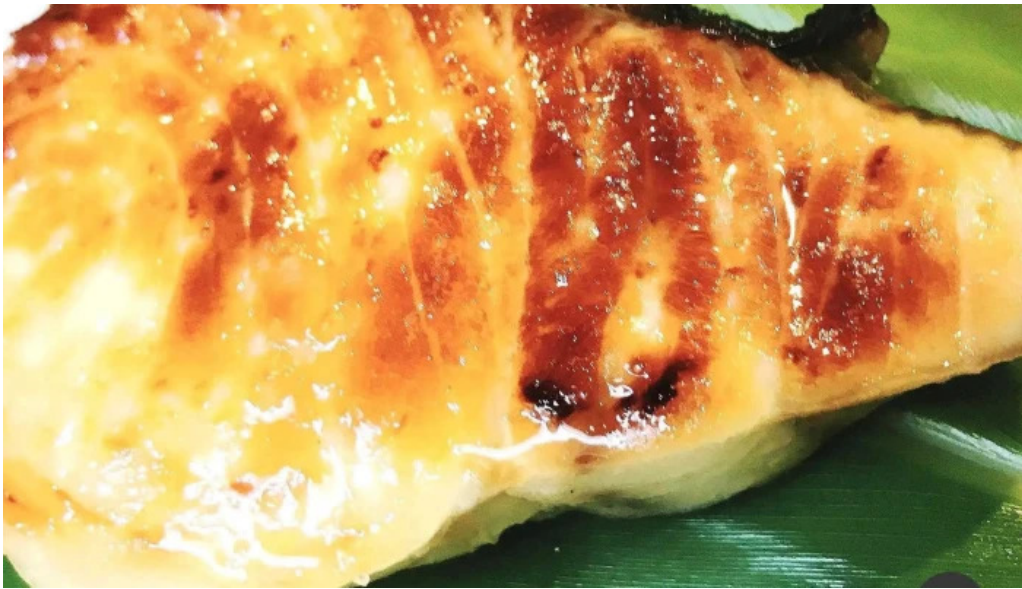
あまみの魚たち 料理飲み物