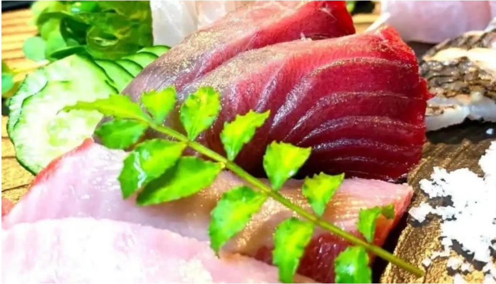
あまみの魚たち シーフード