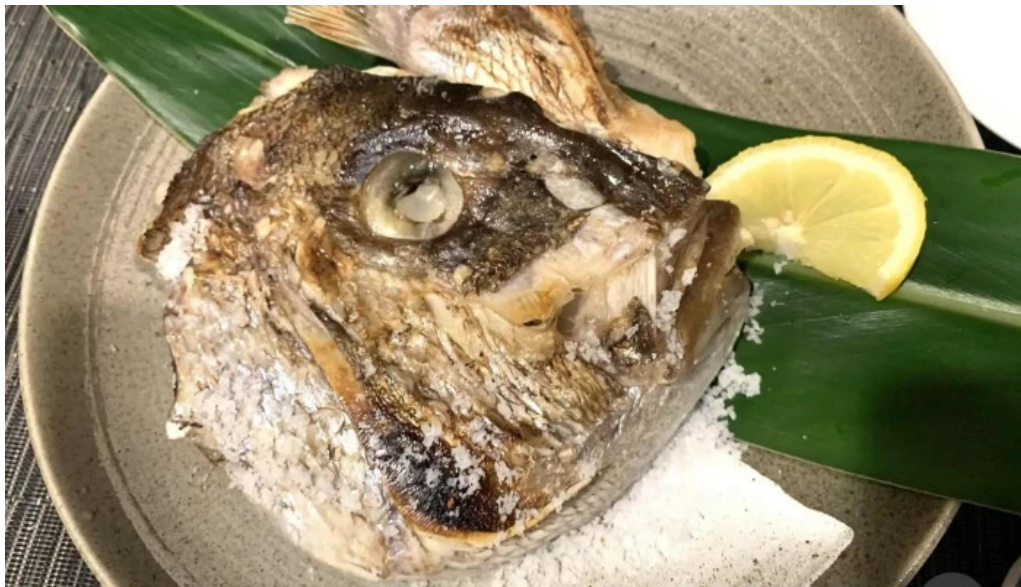
あまみの魚たち 魚類