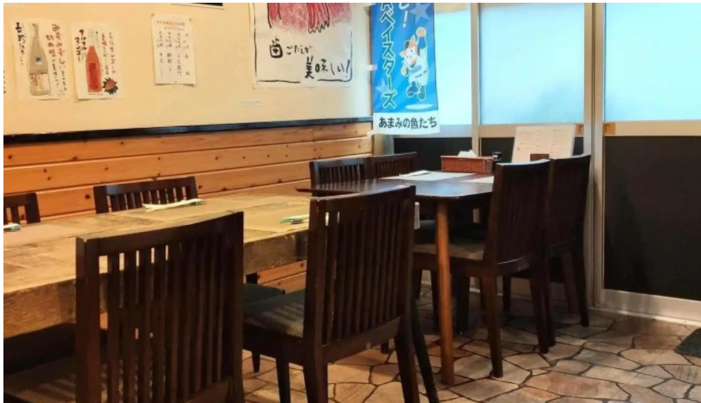
あまみの魚たち 雰囲気