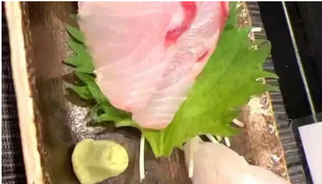
あまみの魚たち 刺身