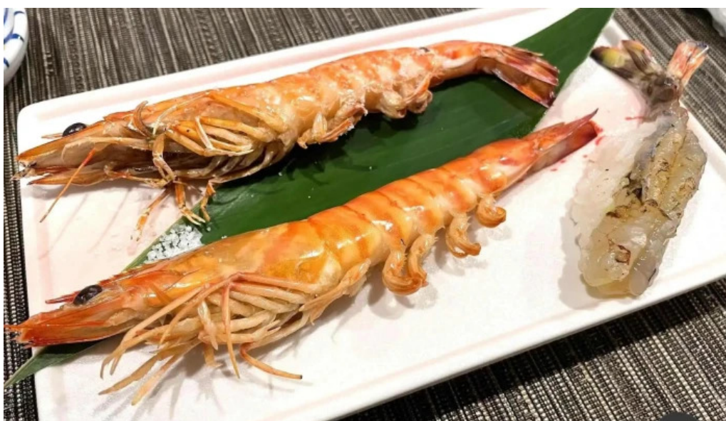
あまみの魚たち エビ