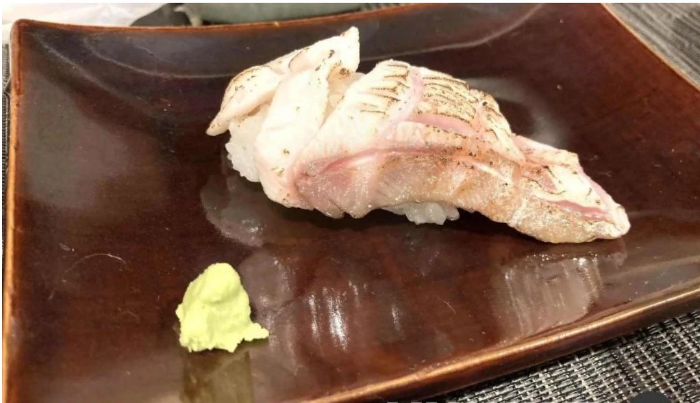
あまみの魚たち 寿司