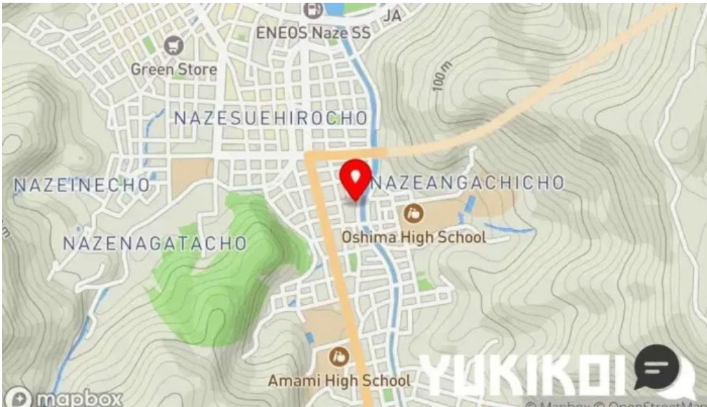
あまみの魚たち 地図