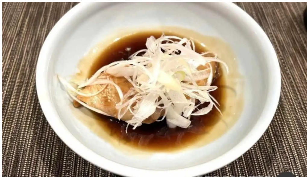
あまみの魚たち スープ