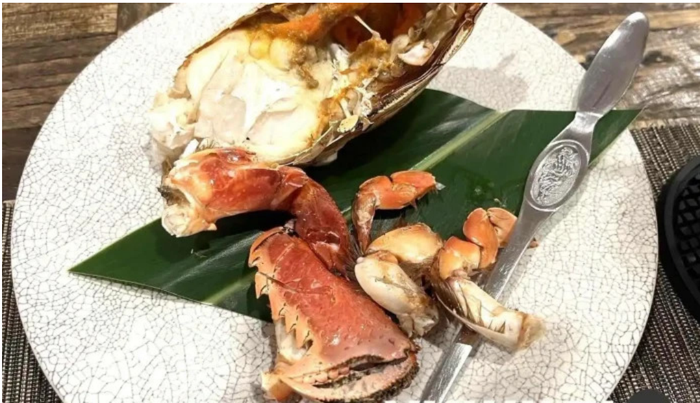
あまみの魚たち カニ