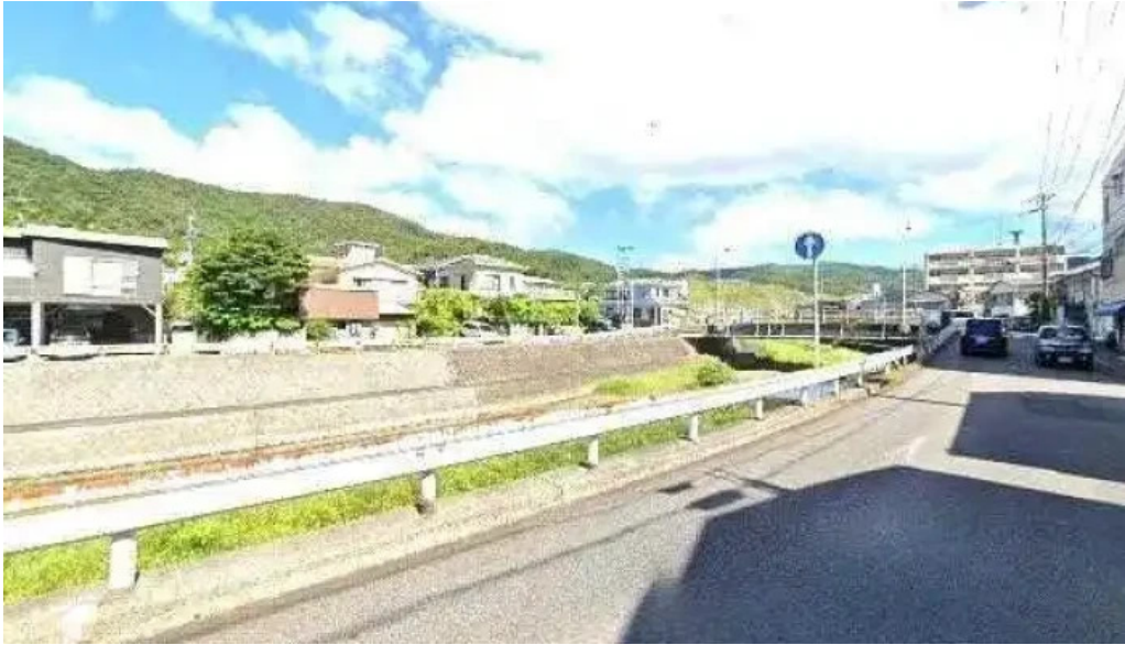
あまみの魚たち 奄美市