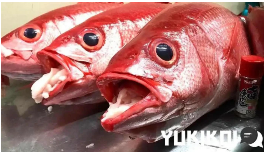
あまみの魚たち