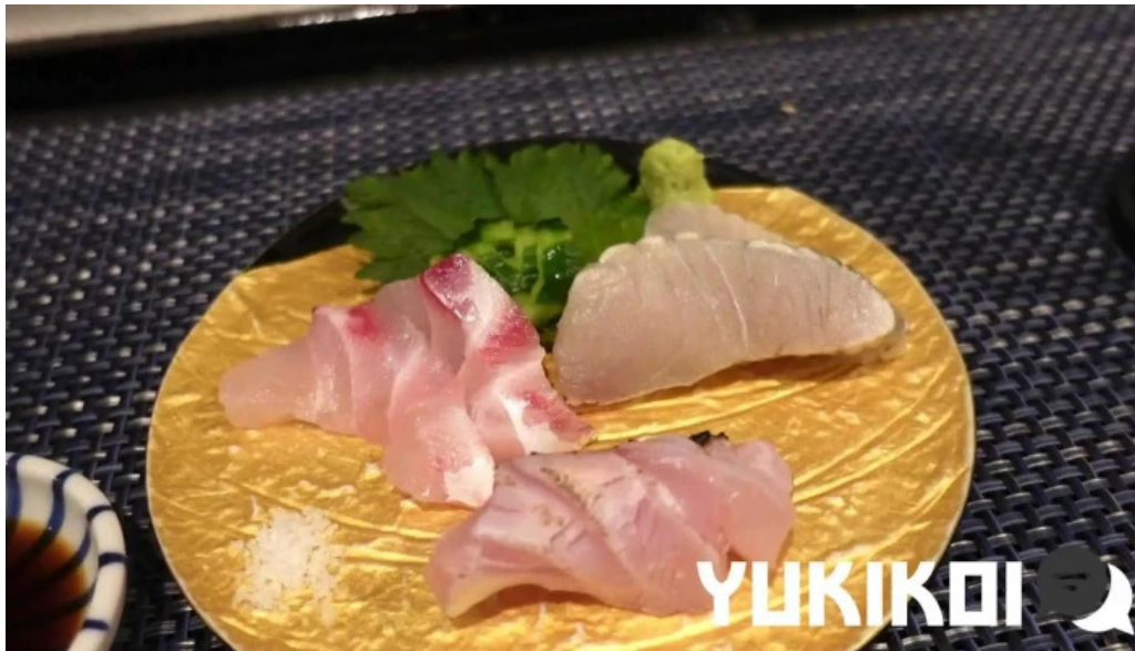
あまみの魚たち 動画