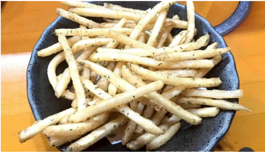
えんや フライドポテト