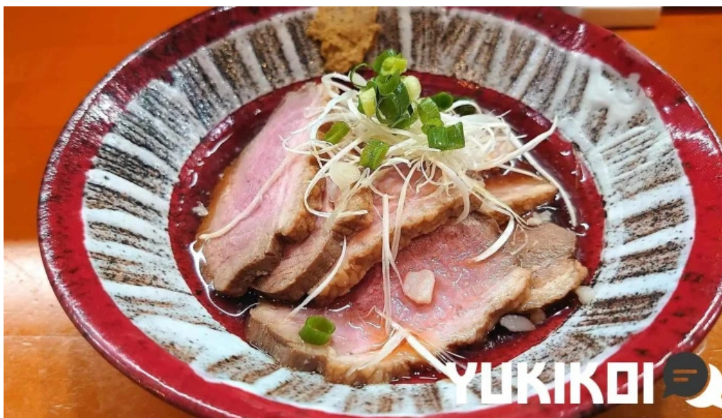
えんや 料理飲み物