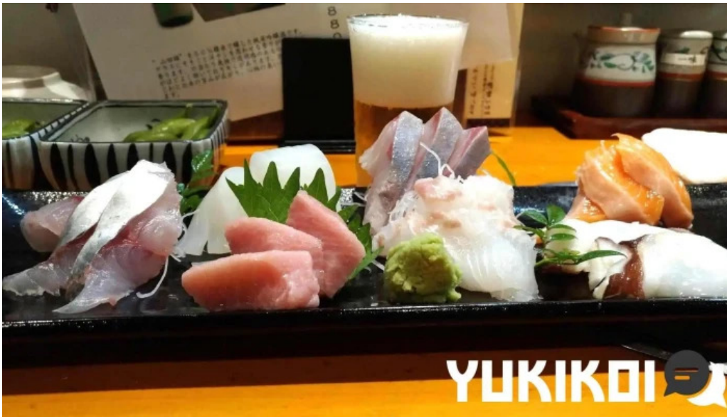
えんや シーフード