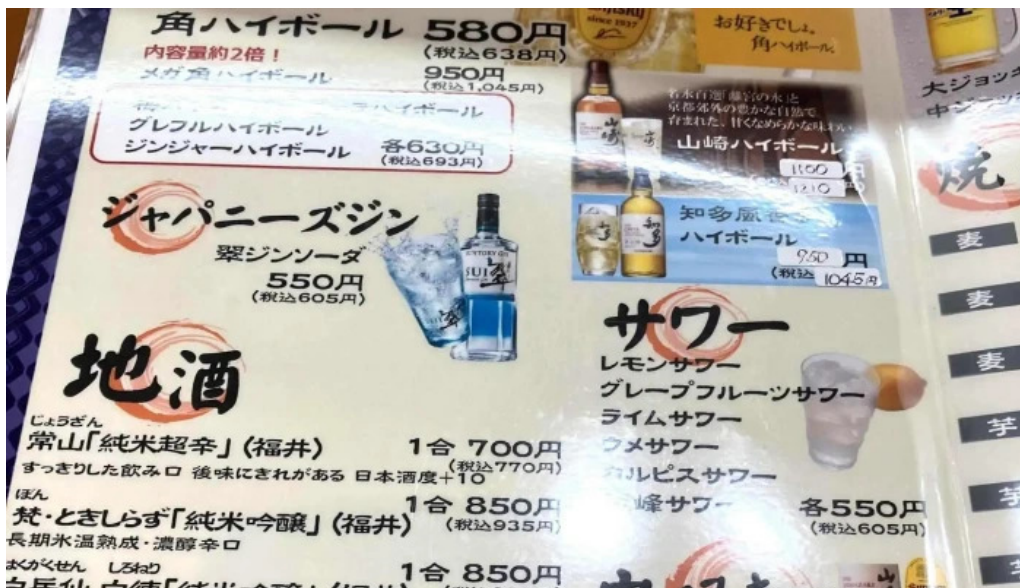
えんや ウェブサイト