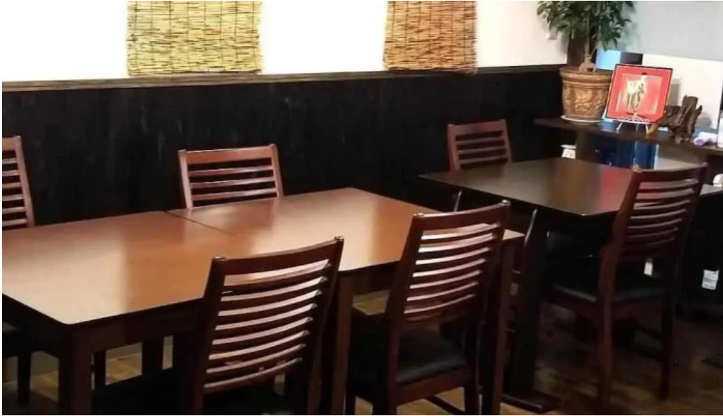
釜山の味