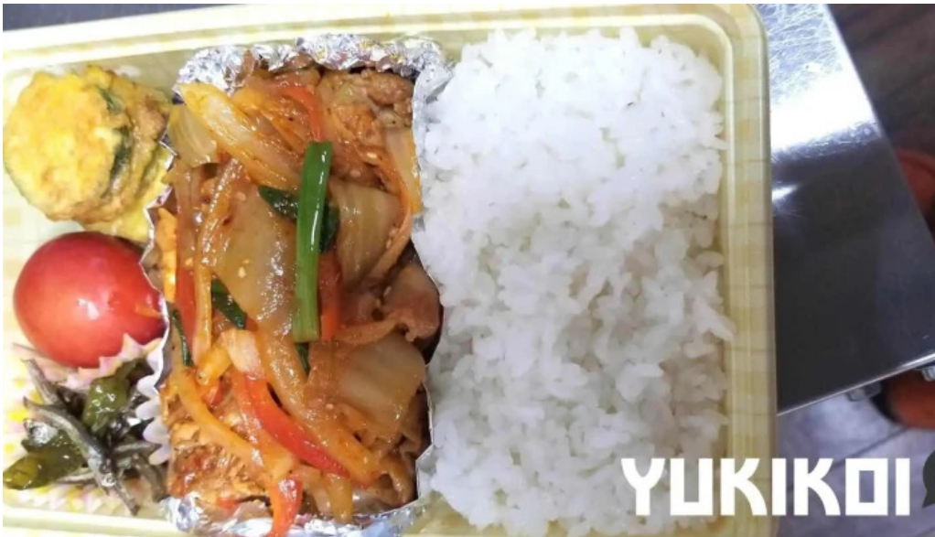
釜山の味 料理飲み物