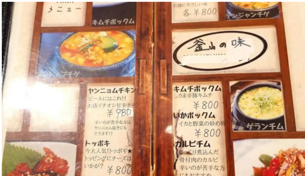
釜山の味 メニュー