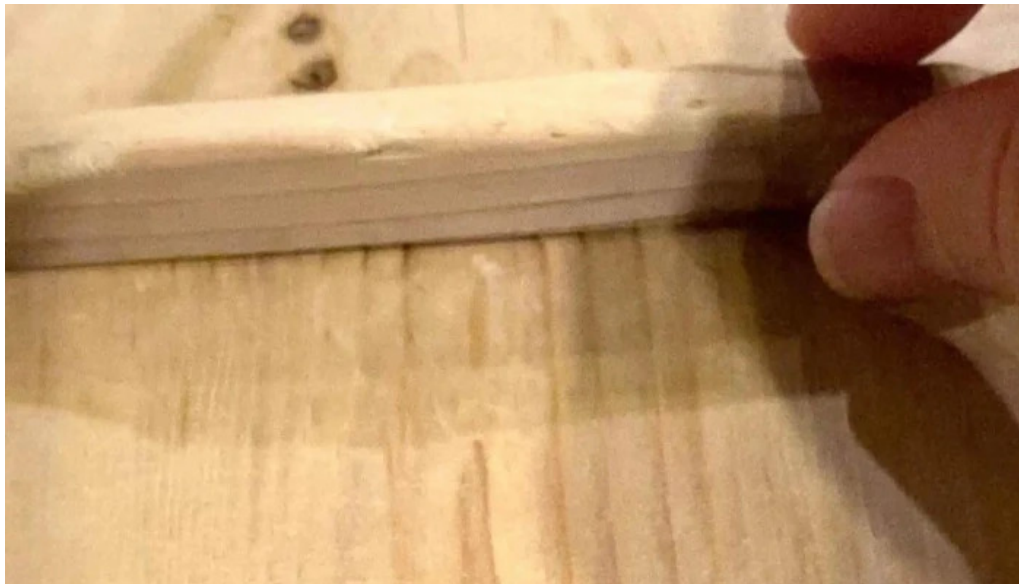
味登古呂 糸蔵 コメント