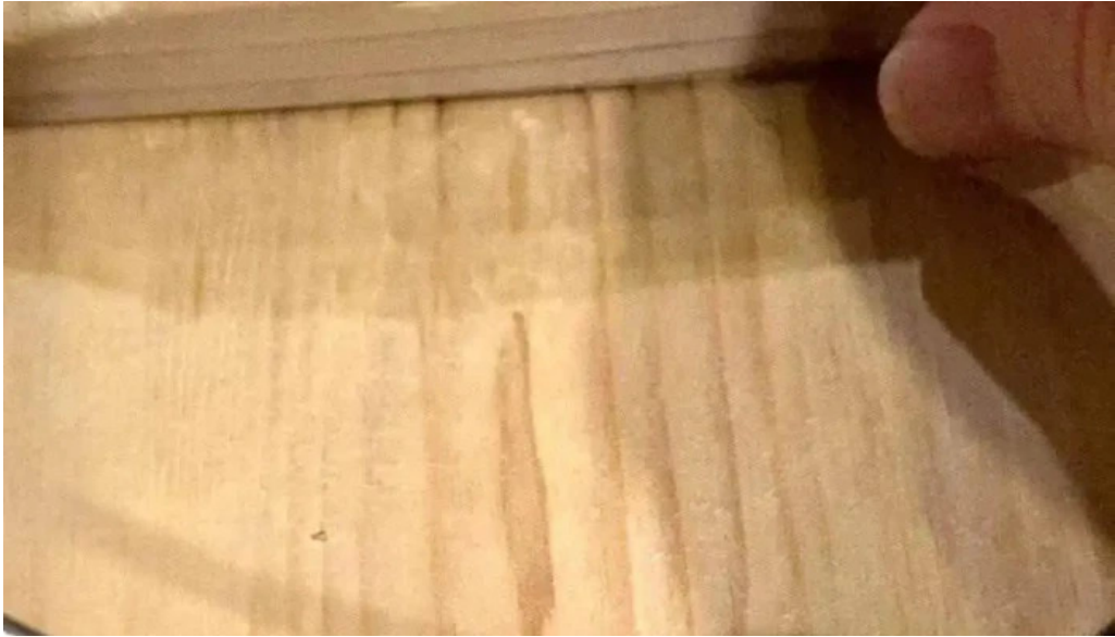
味登古呂 糸蔵 最新