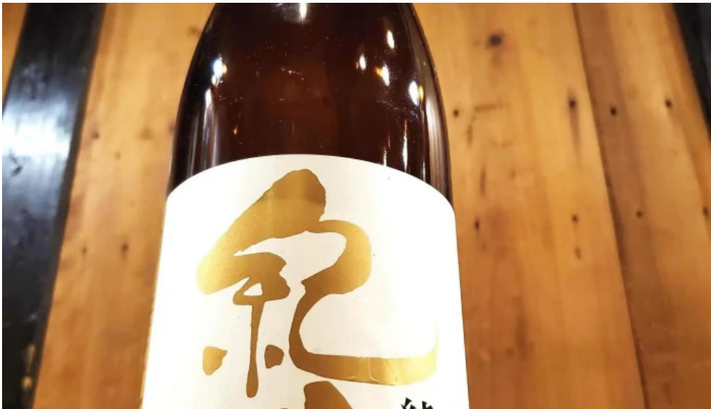
味登古呂 糸蔵 日本酒