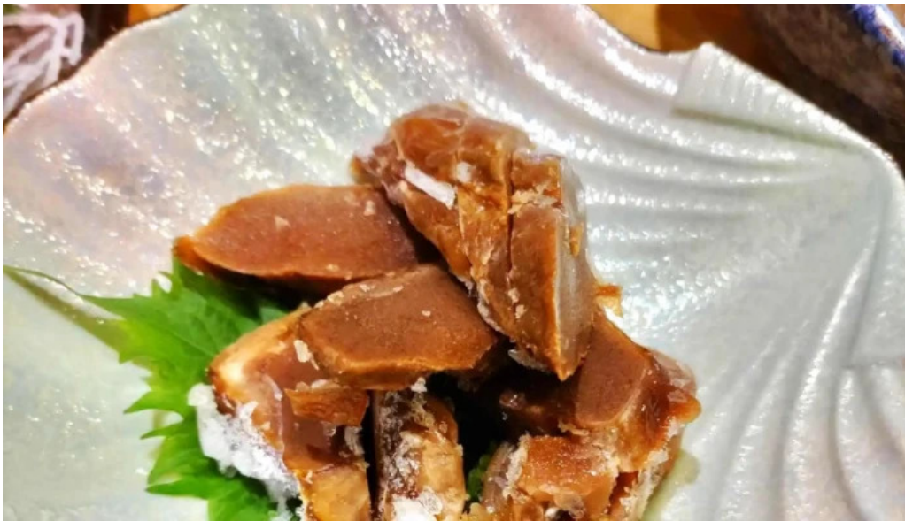
味登古呂 糸蔵 動画