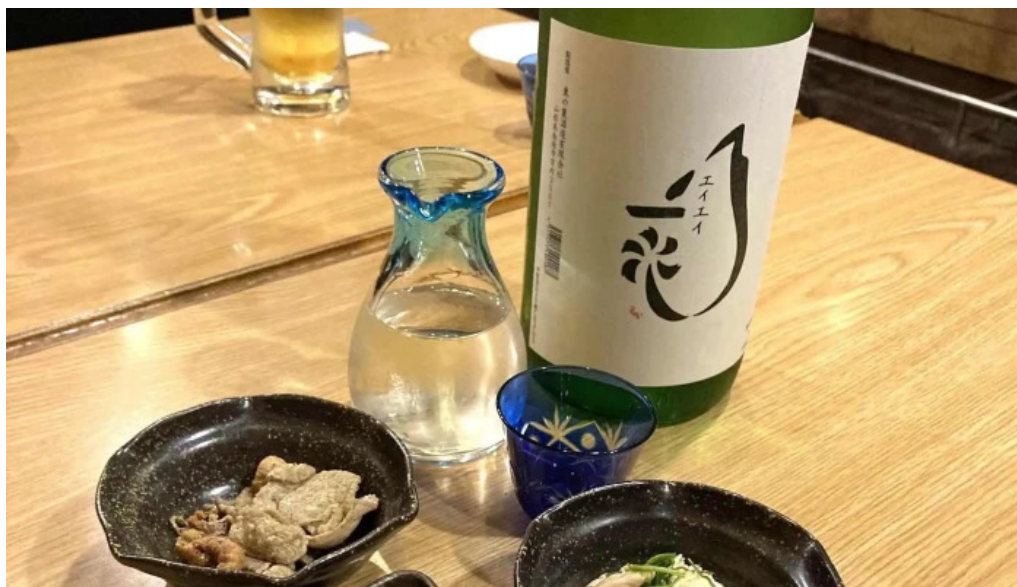
味登古呂 糸蔵 電話