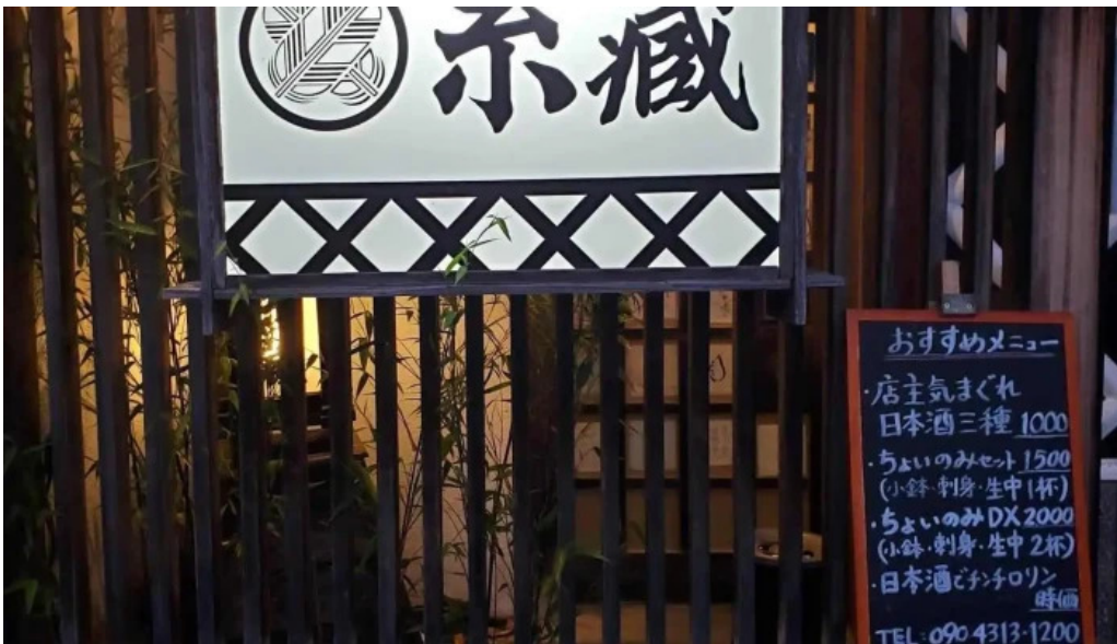
味登古呂 糸蔵