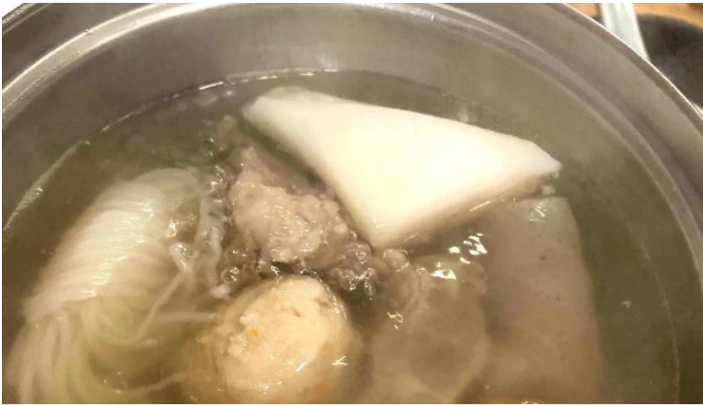
味登古呂 糸蔵 カタログ