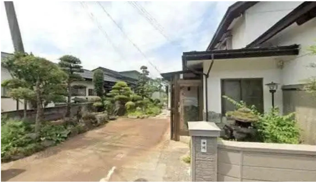
味登古呂 糸蔵 南陽市