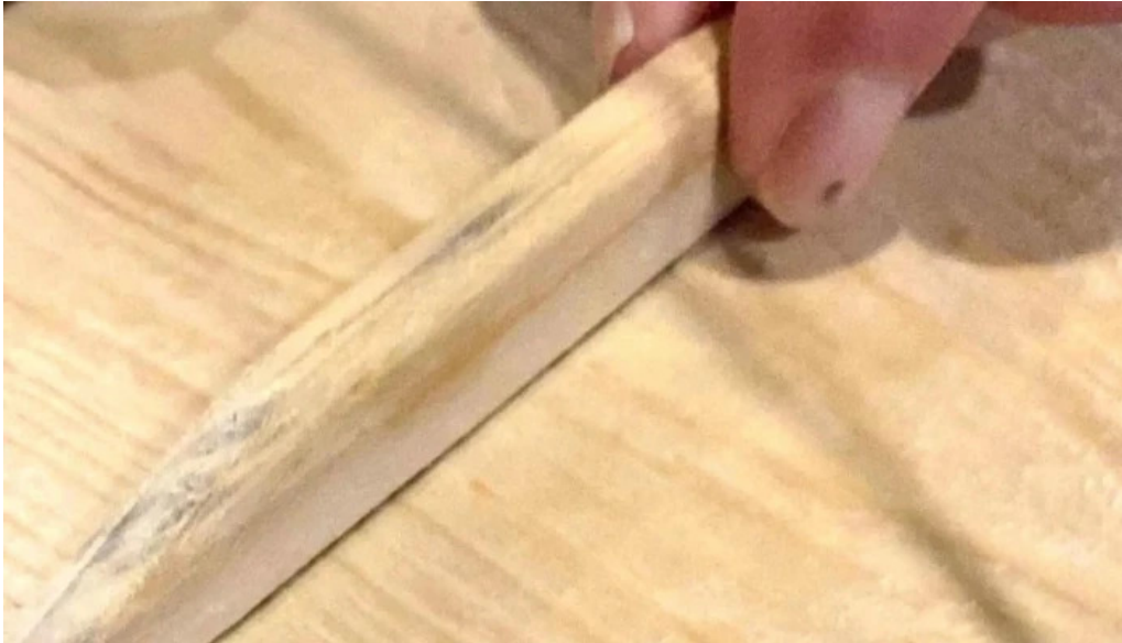
味登古呂 糸蔵 どこ