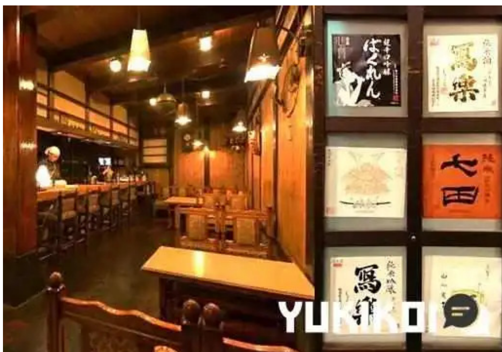
味登古呂 糸蔵 雰囲気