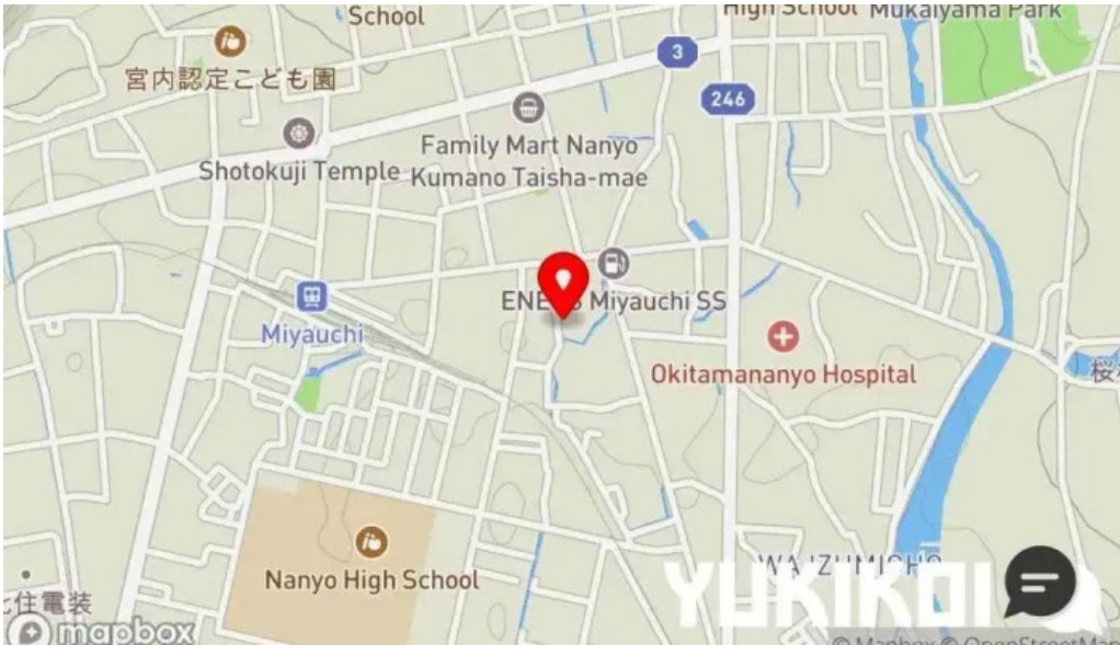
味登古呂 系蔵 地図