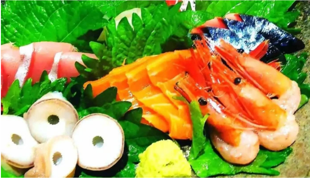
味登古呂 系蔵 料理飲み物