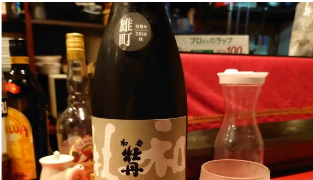
ダイニングバー 伝 どこ