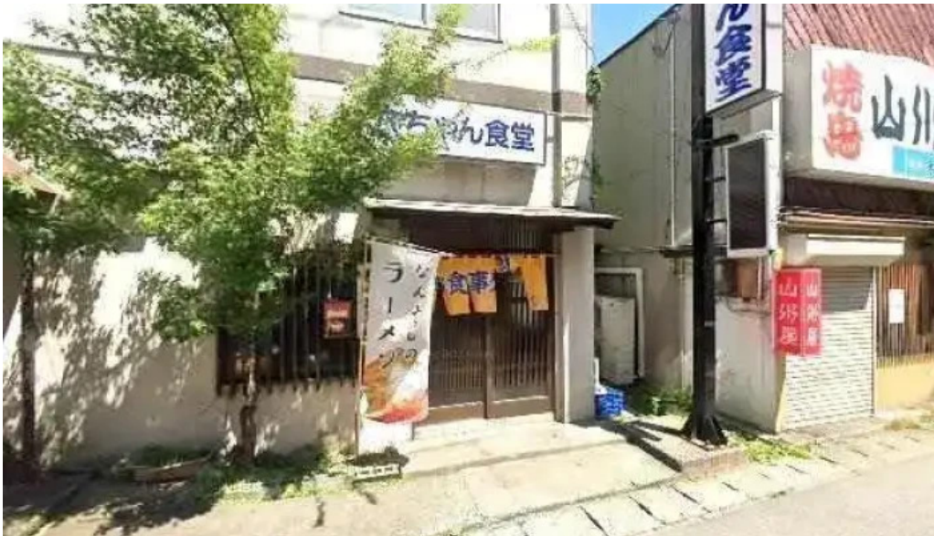
ダイニングバー 伝 南陽市