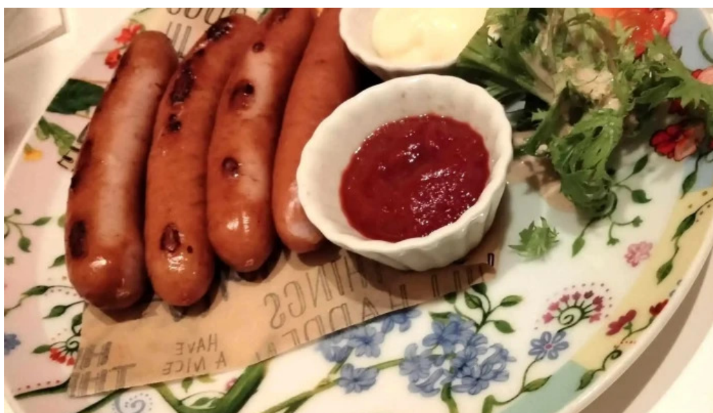
ダイニングバー 伝 電話