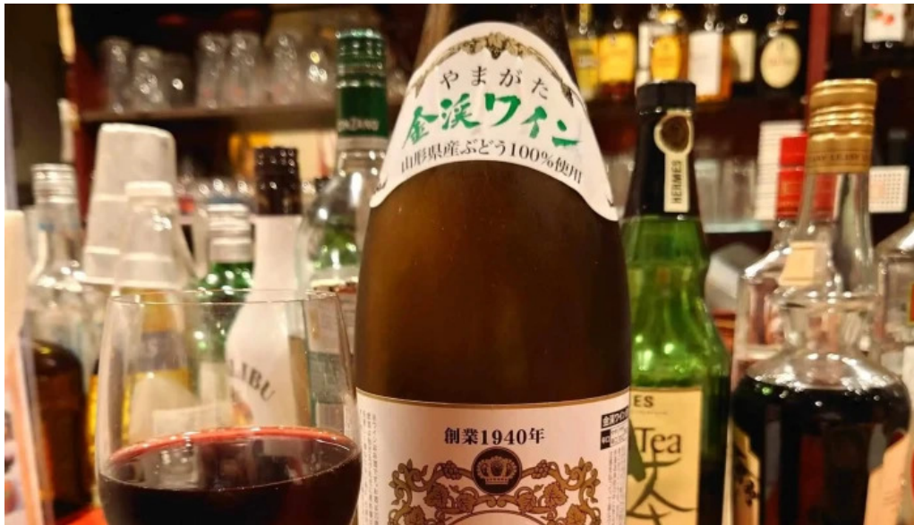
ダイニングバー 伝 エリア