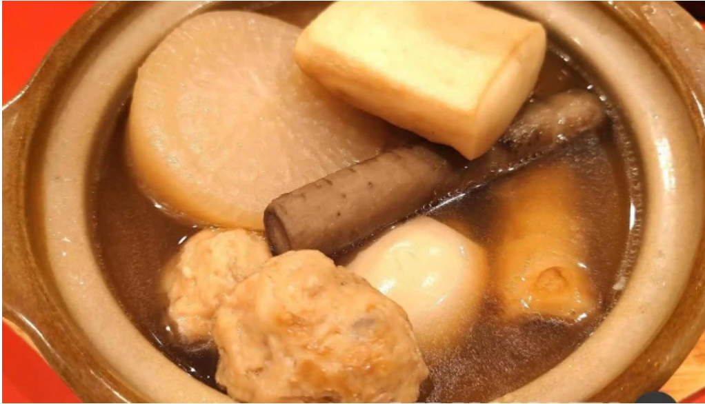
ダイニングバー 伝 料理飲み物