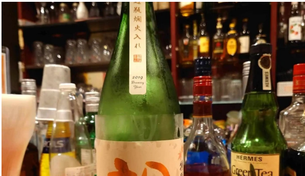
ダイニングバー 伝 営業中