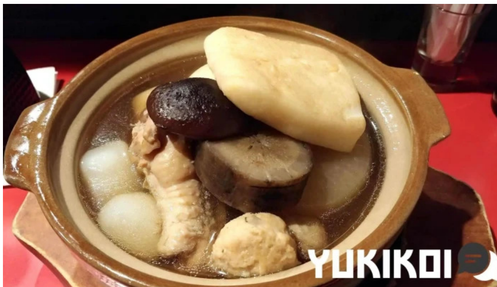
ダイニングバー 伝 スープ