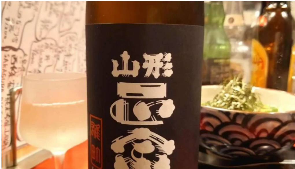
ダイニングバー 伝 日本酒