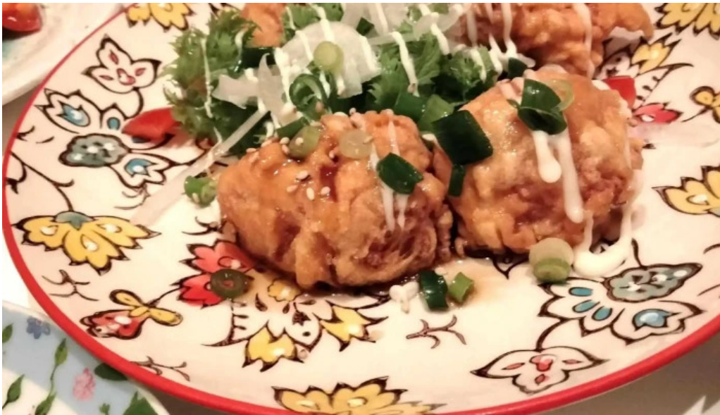
ダイニングバー 伝 動画