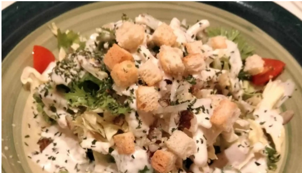
ダイニングバー 伝 料金