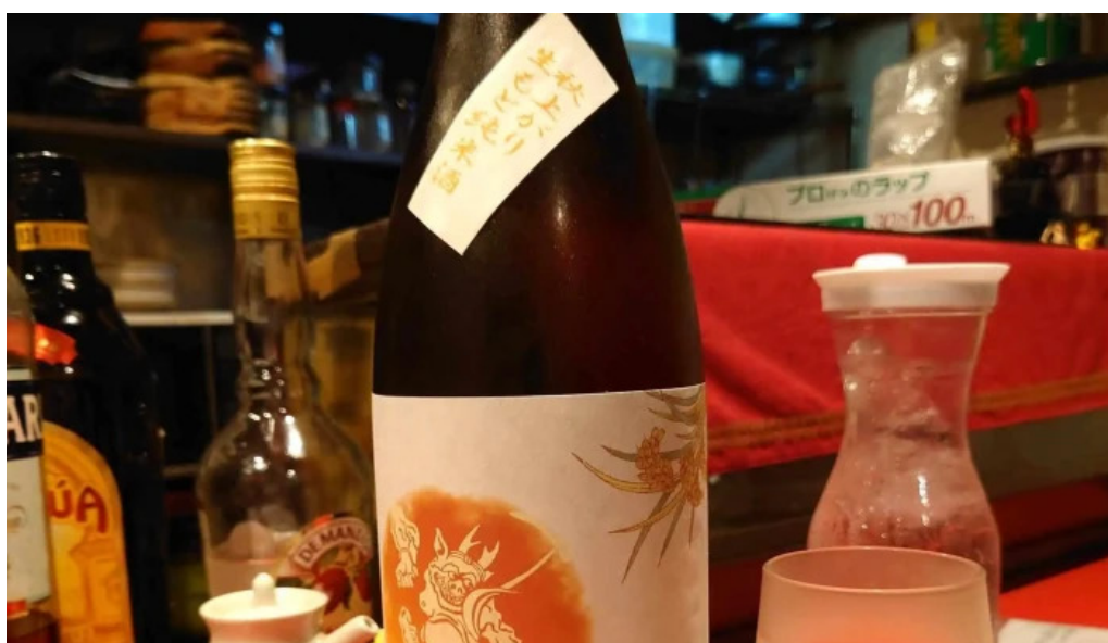
ダイニングバー 伝 番号