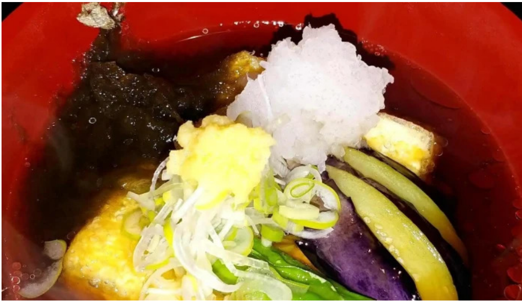
あらたまや コメント