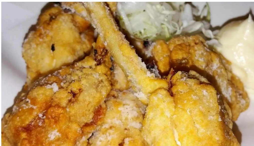
あらたまや 行き方