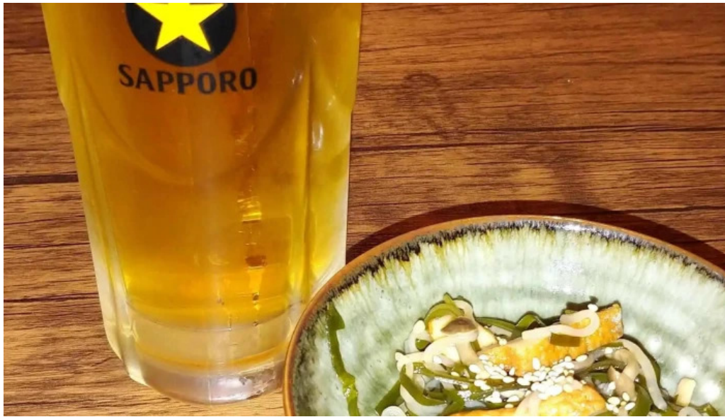
あらたまや ウェブサイト