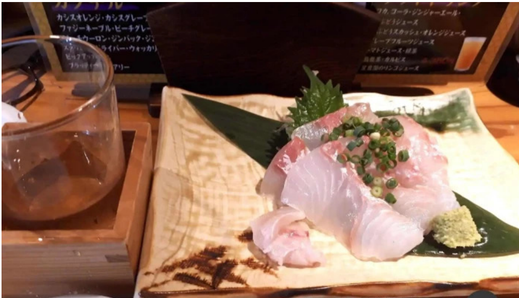
あらたまや メニュー