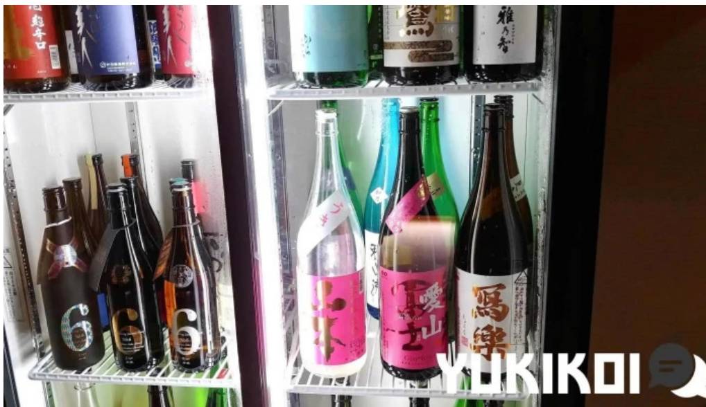
あらたまや 日本酒