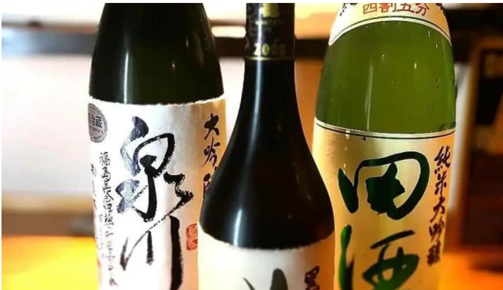
あらたまや オーナー提供