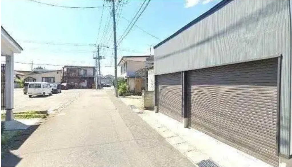
あらたまや 南陽市