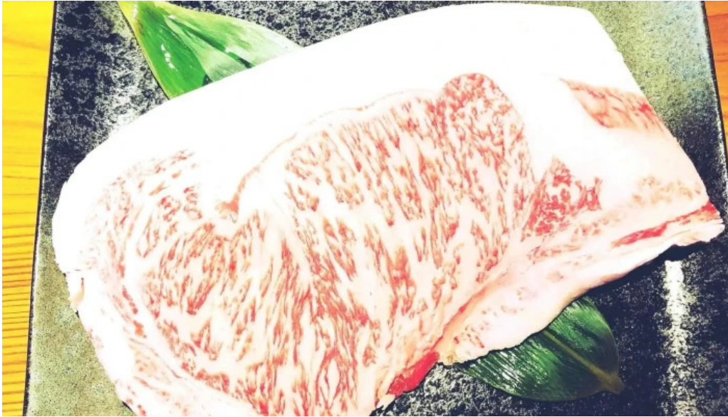
あらたまや 料理飲み物