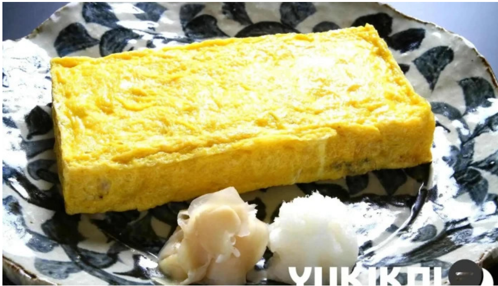
旬味 鹿六 卵焼き