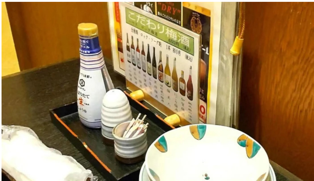
旬味 鹿六 動画