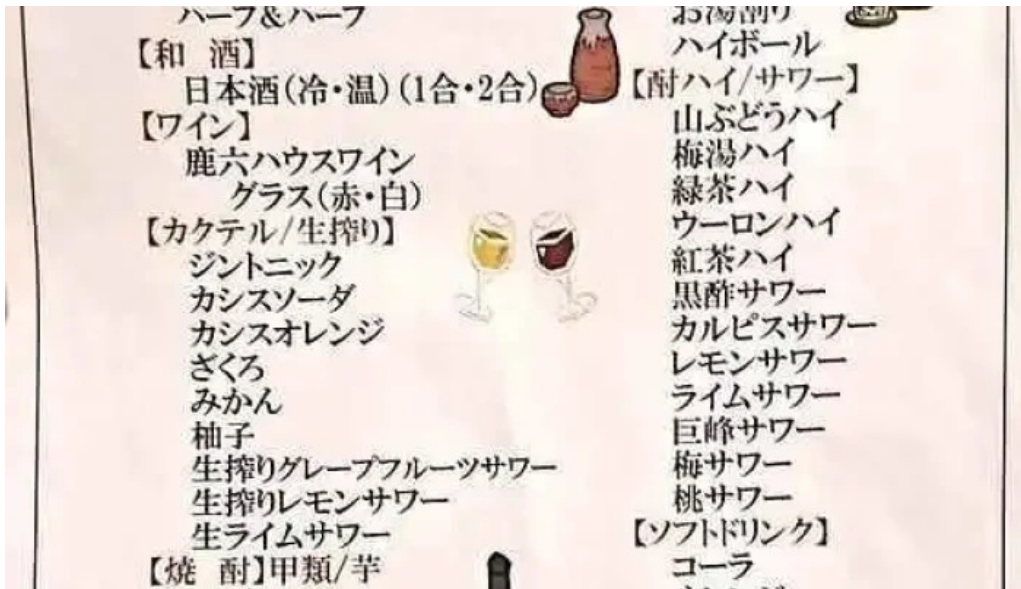
旬味 鹿六 メニュー