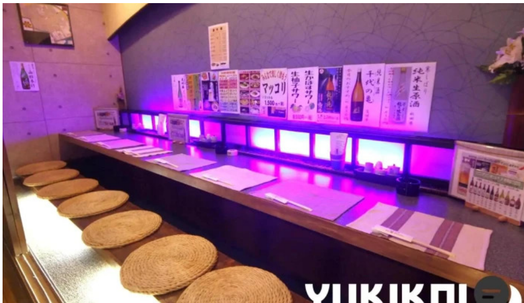
旬味 鹿六 雰囲気