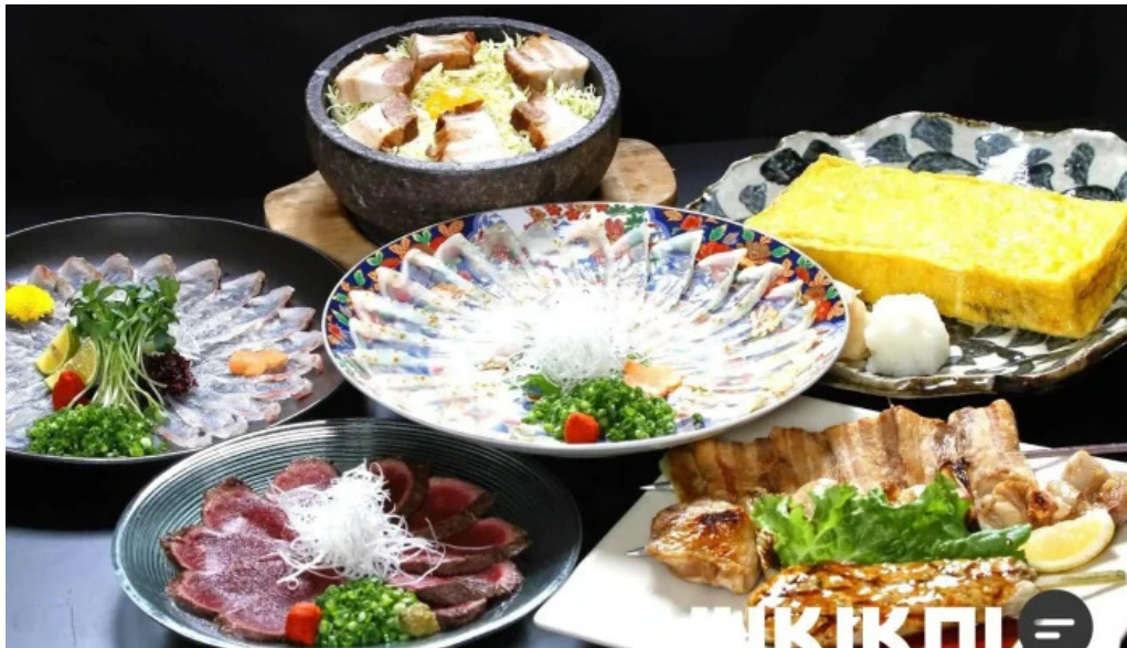
旬味 鹿六 シーフード