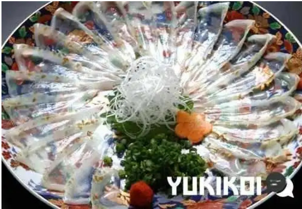
旬味 鹿六 オーナー提供