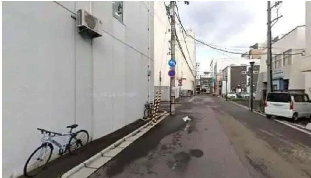
旬味 鹿六 函館市