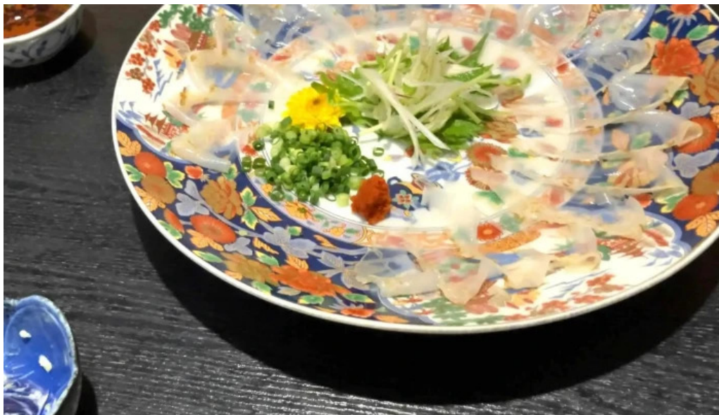
旬味 鹿六 コメント