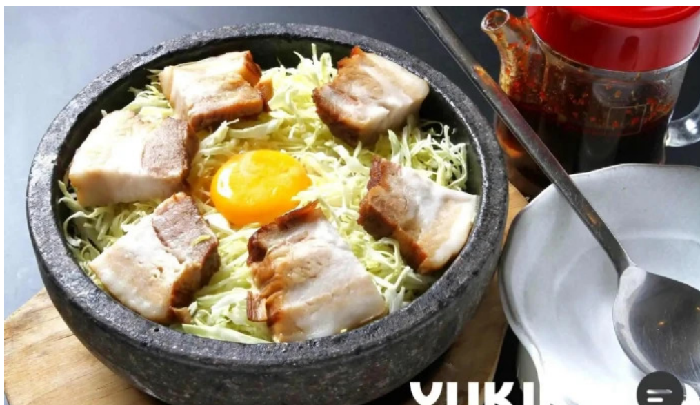
旬味 鹿六 料理飲み物