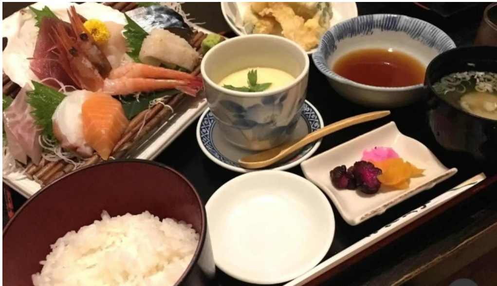
旬味 鹿六 スープ