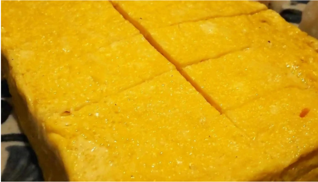
旬味 鹿六 所在地