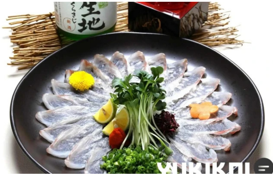
旬味 鹿六 フグ