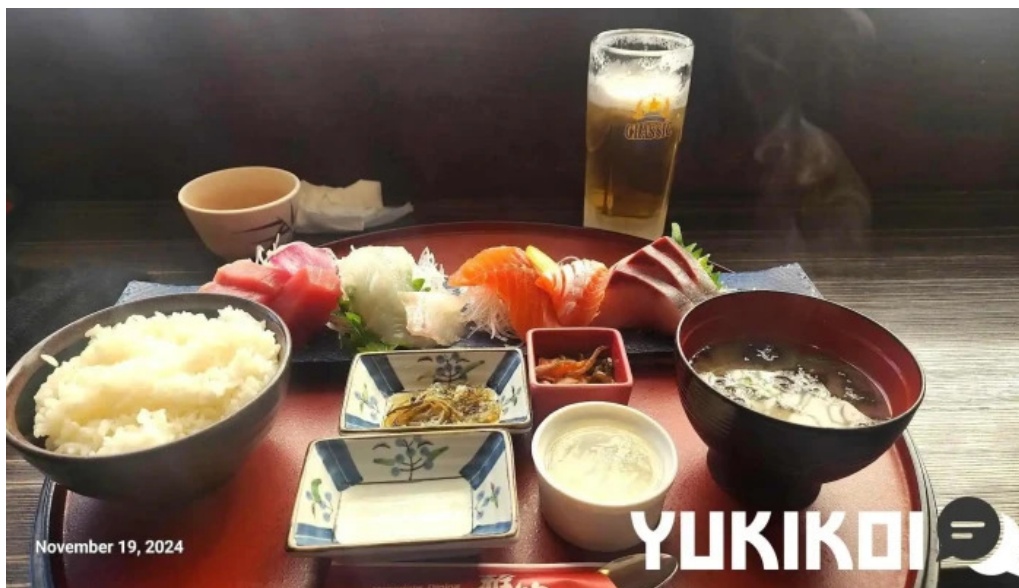
函館ダイニング 雅家 スープ