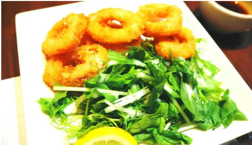
函館ダイニング 雅家 天ぷら