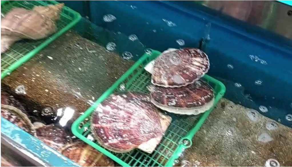
函館ダイニング 雅家 動画