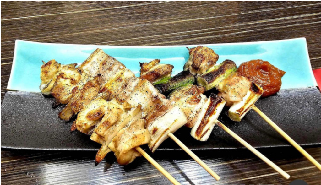
函館ダイニング 雅家 焼き鳥