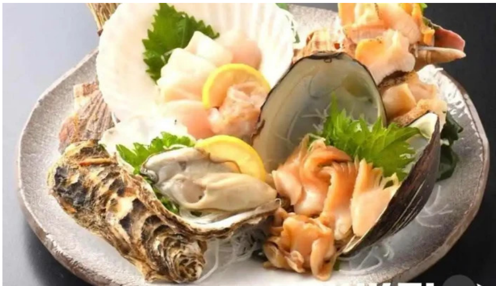
函館ダイニング 雅家 料理飲み物