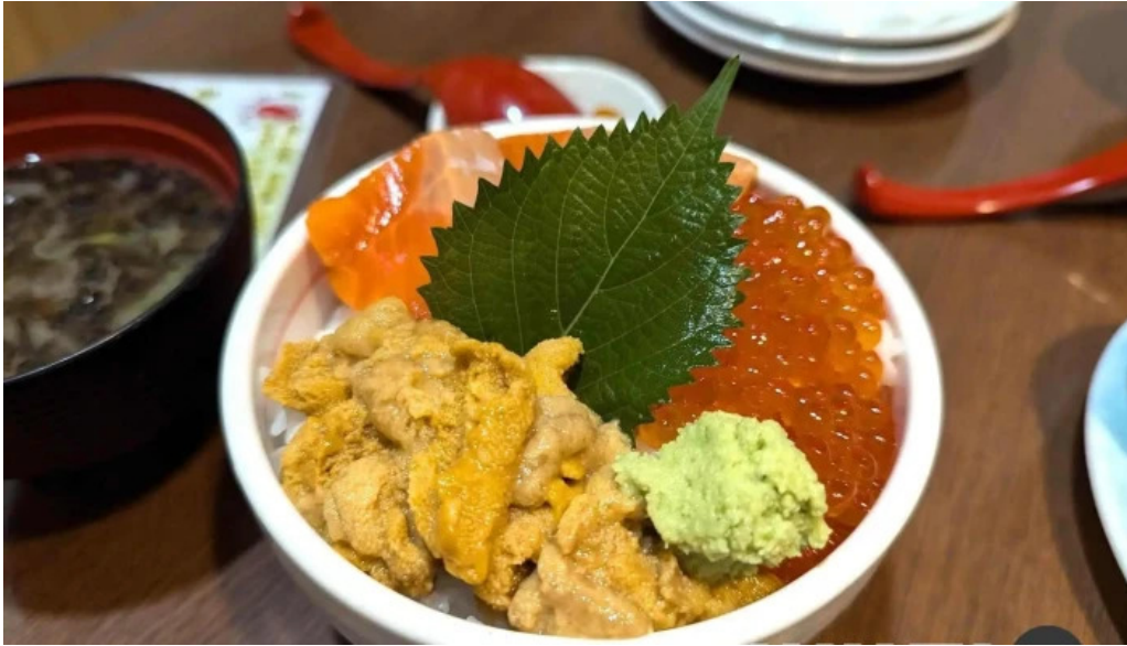
函館ダイニング 雅家 井物