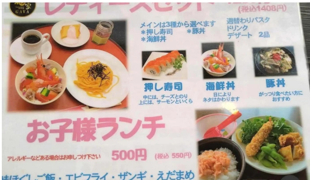
函館ダイニング 雅家 メニュー