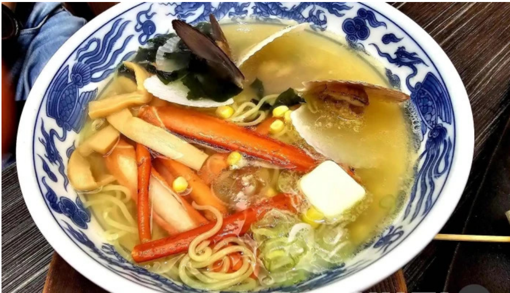
函館ダイニング 雅家 ラーメン