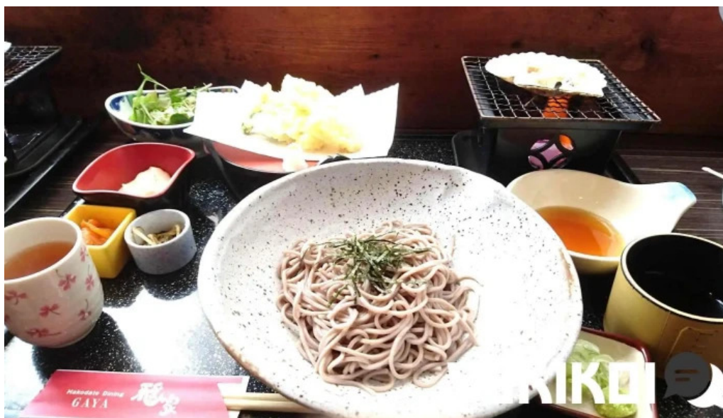
函館ダイニング 雅家 麺