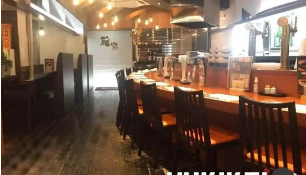
函館ダイニング 雅家 雰囲気