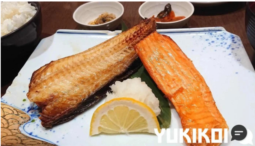
函館ダイニング 雅家 サバ