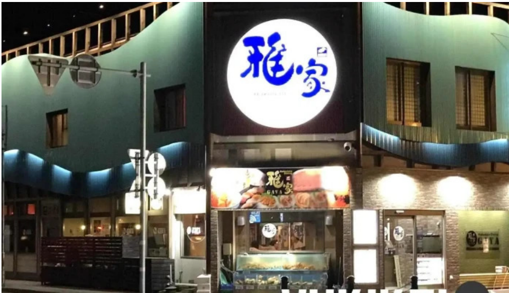
函館ダイニング 雅家 函館市