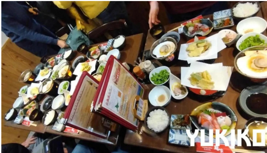
函館ダイニング 雅家 最新