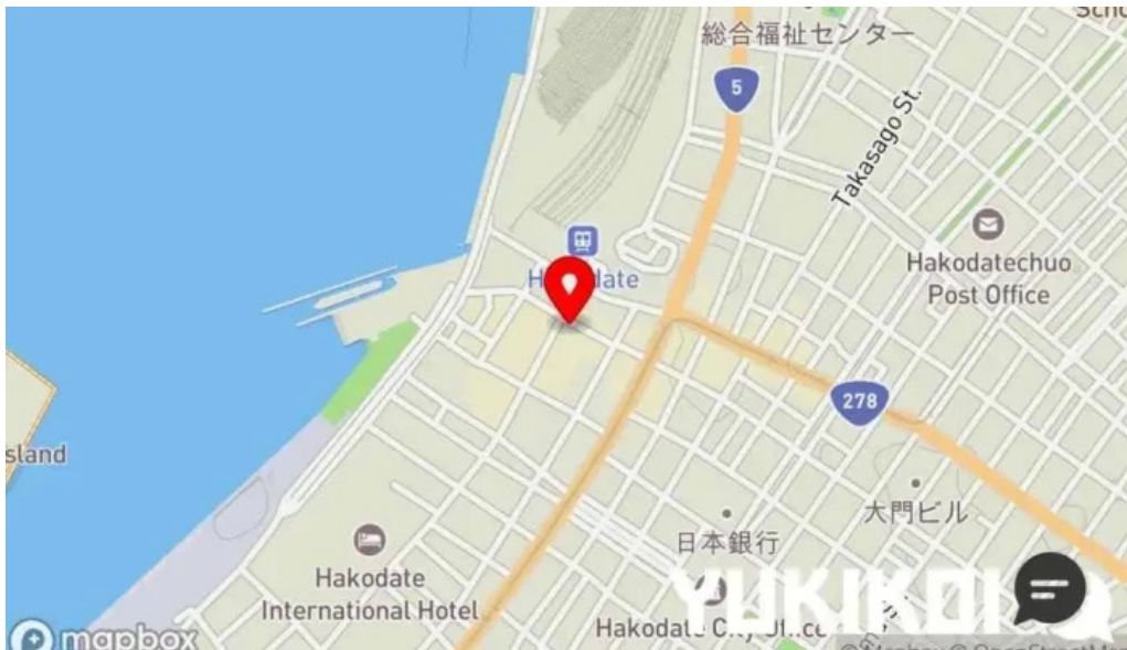
函館ダイニング 雅家 地図