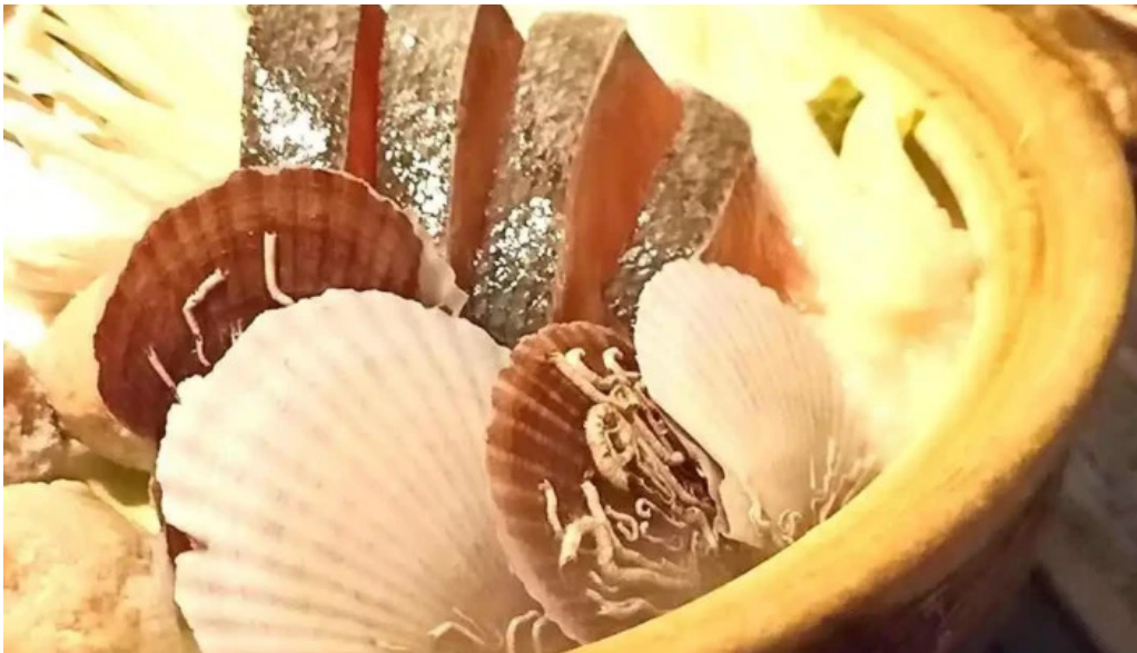
函館ダイニング 雅家 シーフード