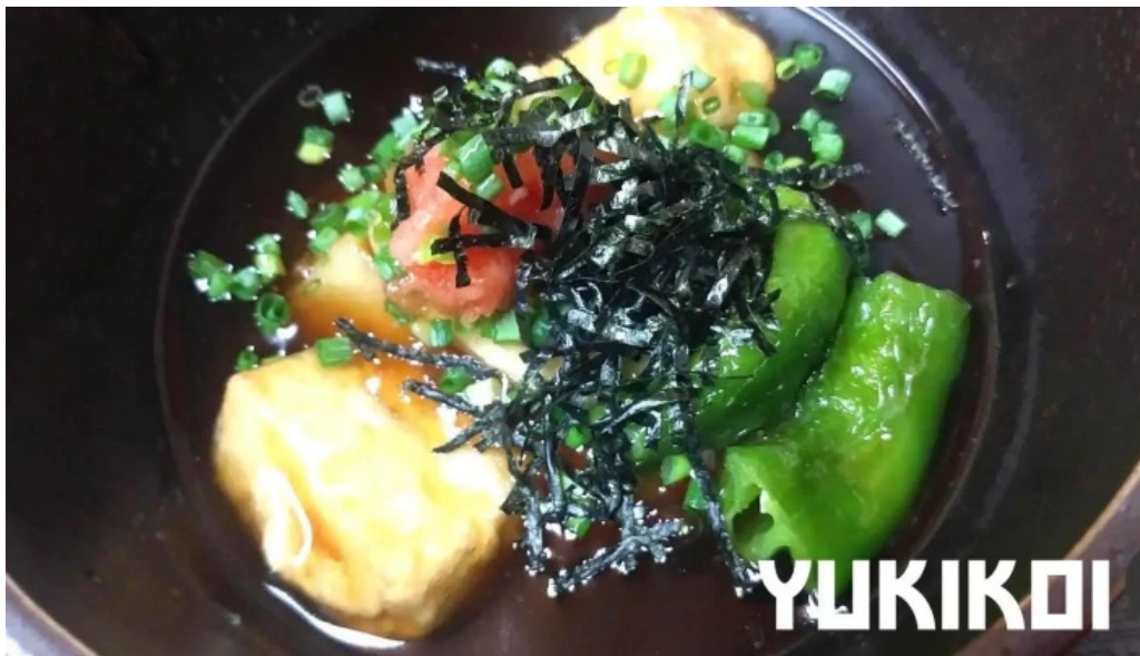
二代目佐平次 揚げ出し豆腐