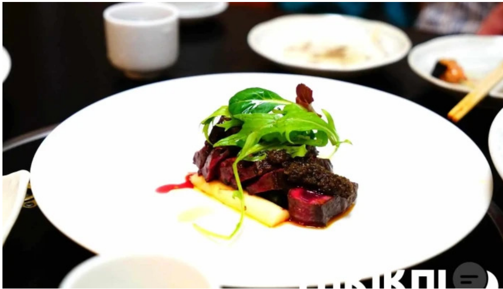
二代目佐平次 料理飲み物