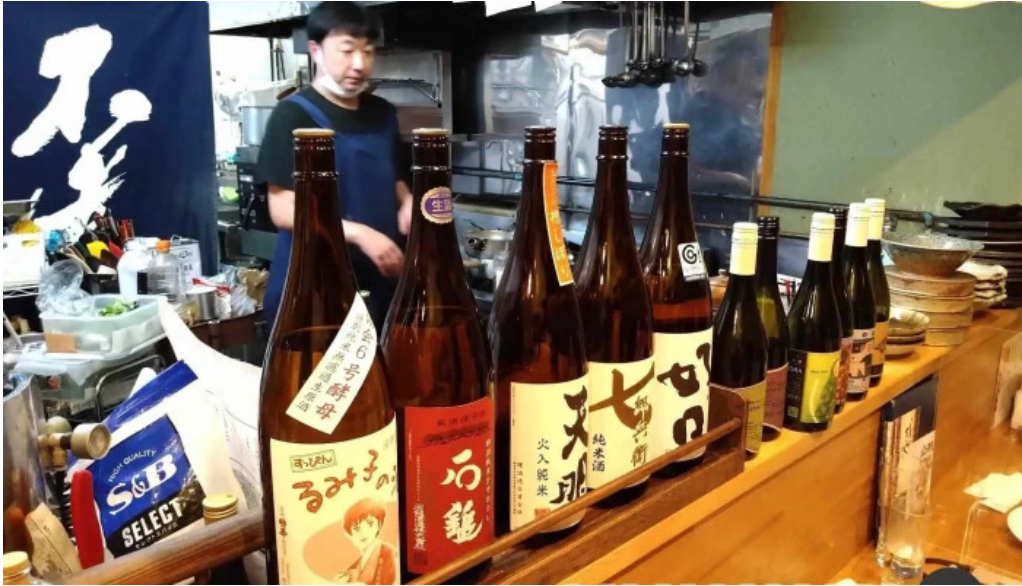
二代目佐平次 雰囲気