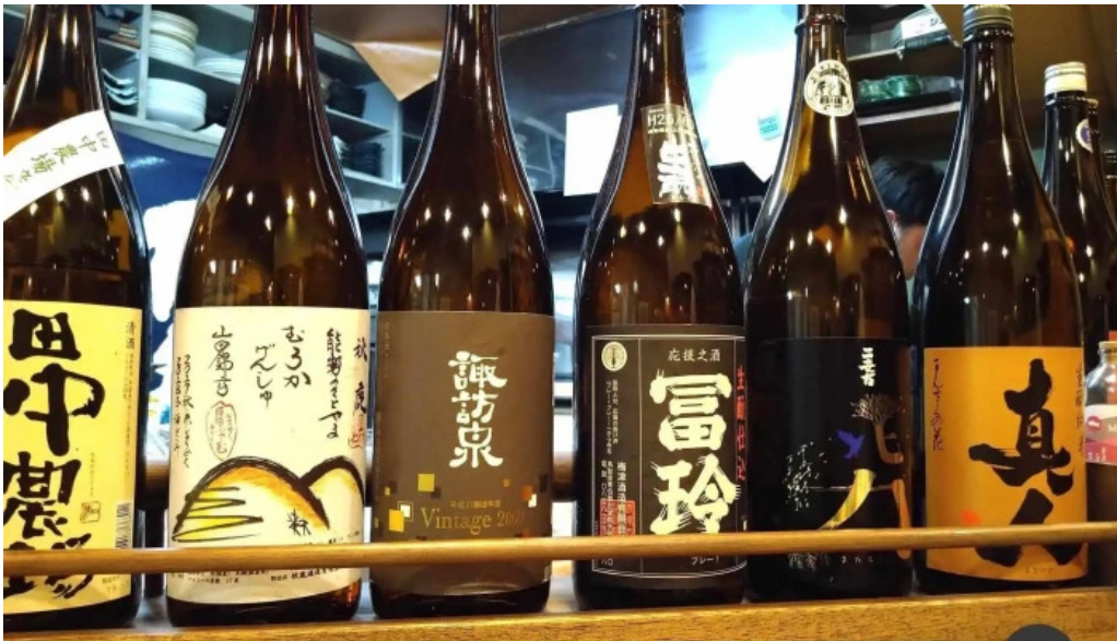
二代目佐平次 日本酒