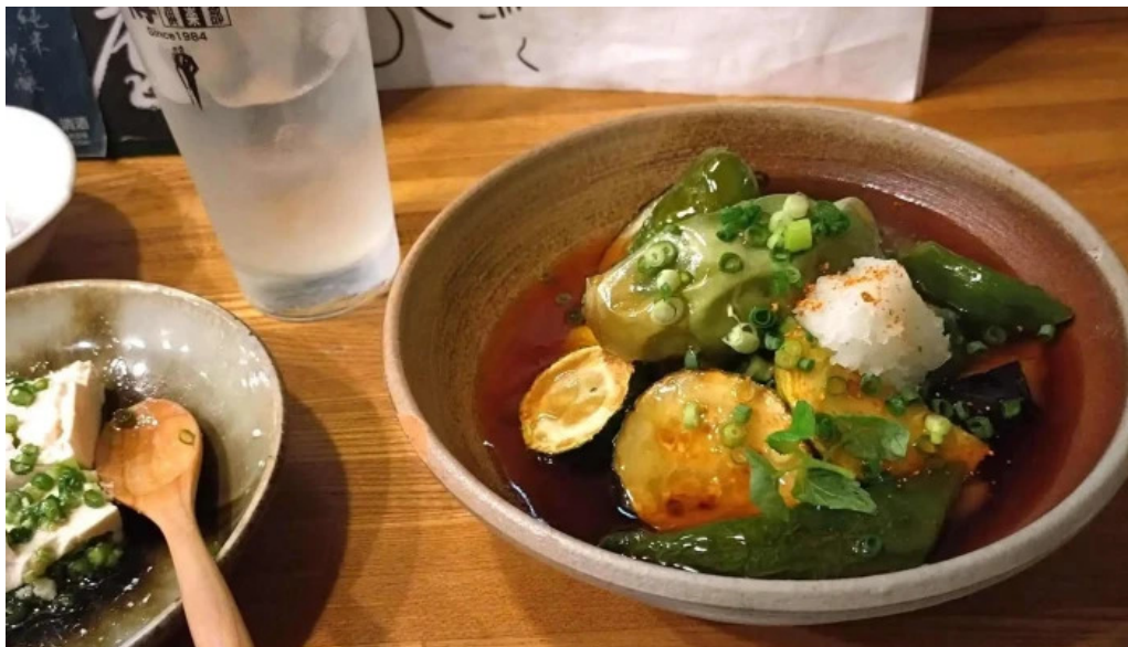
二代目佐平次 どこ