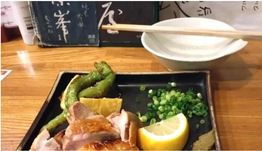
二代目佐平次 所在地