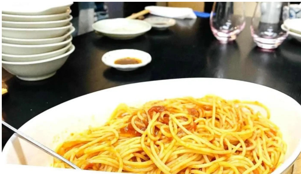
二代目佐平次 スパゲッティ