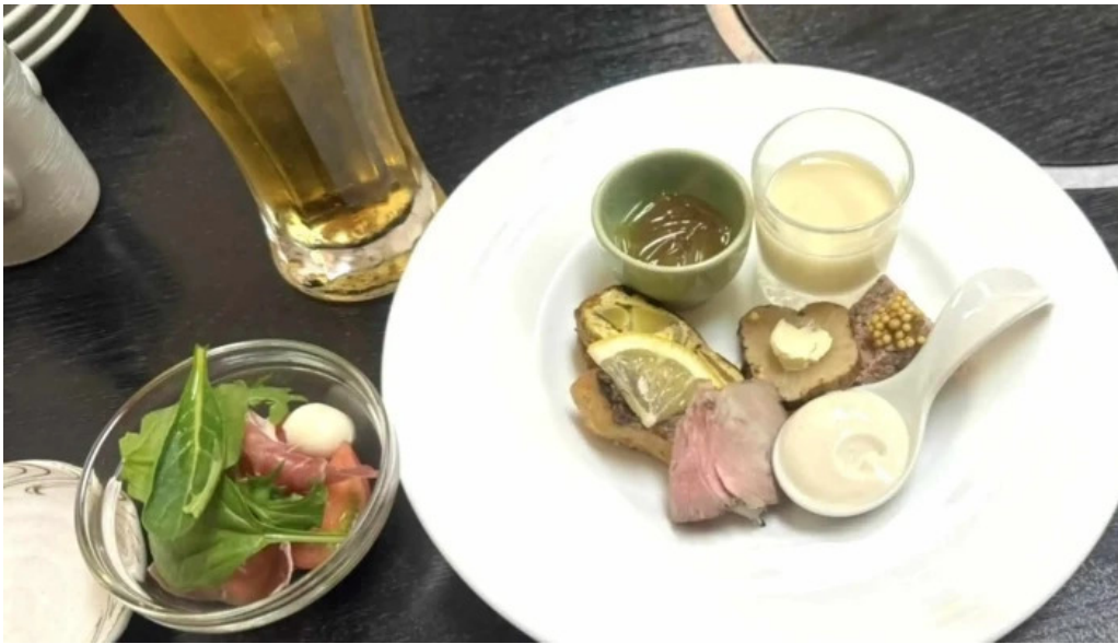
二代目佐平次 動画