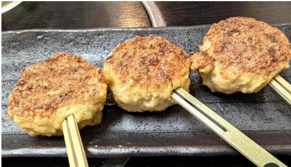
二代目佐平次 クラブケーキ