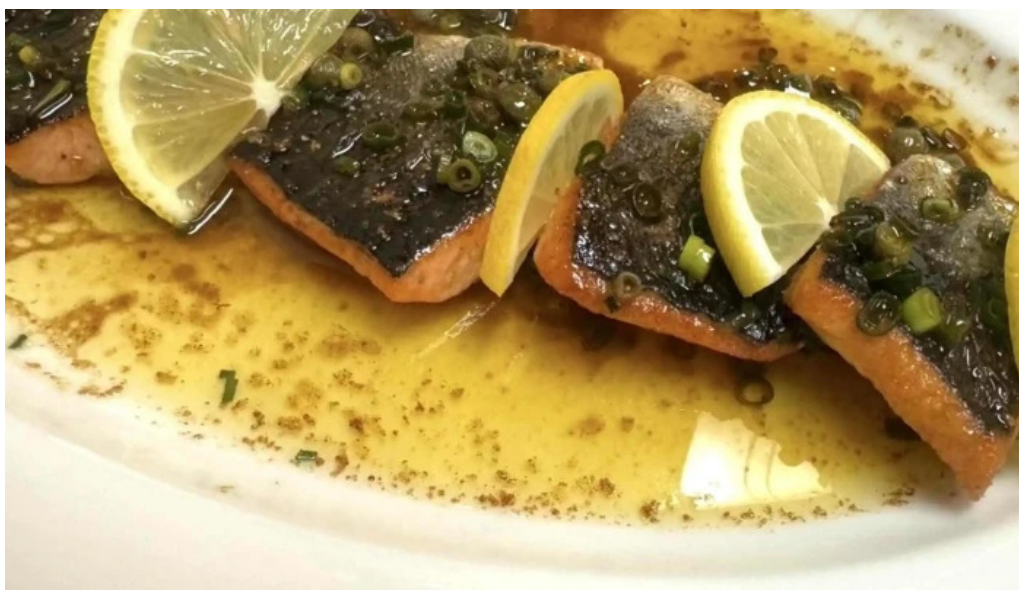
二代目佐平次 電話