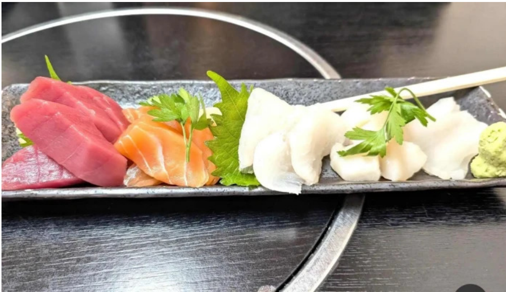
二代目佐平次 刺身