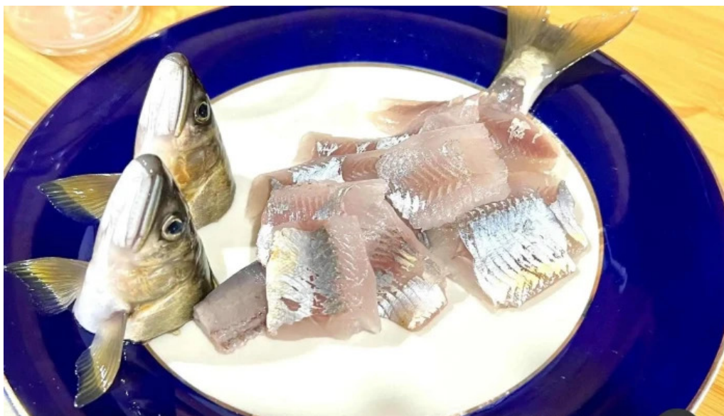
勝よし 料理飲み物