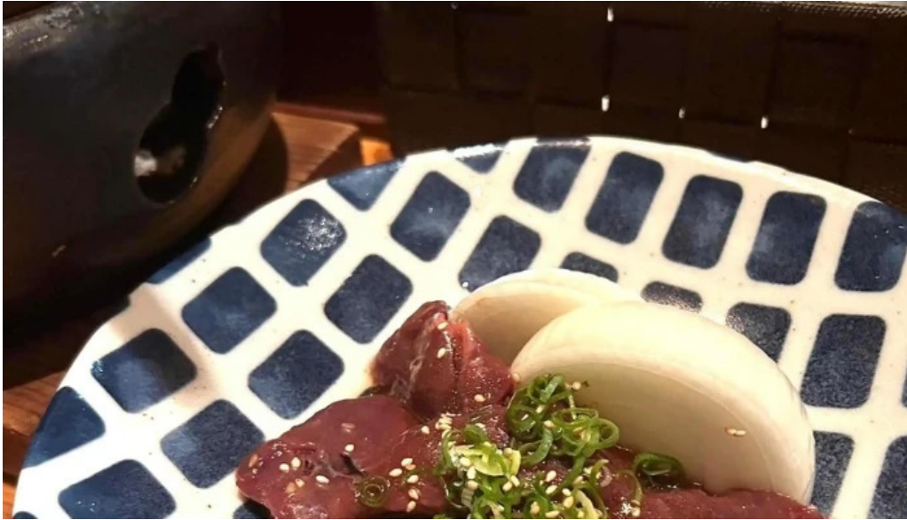
八百甚 炉端焼き プロモーション