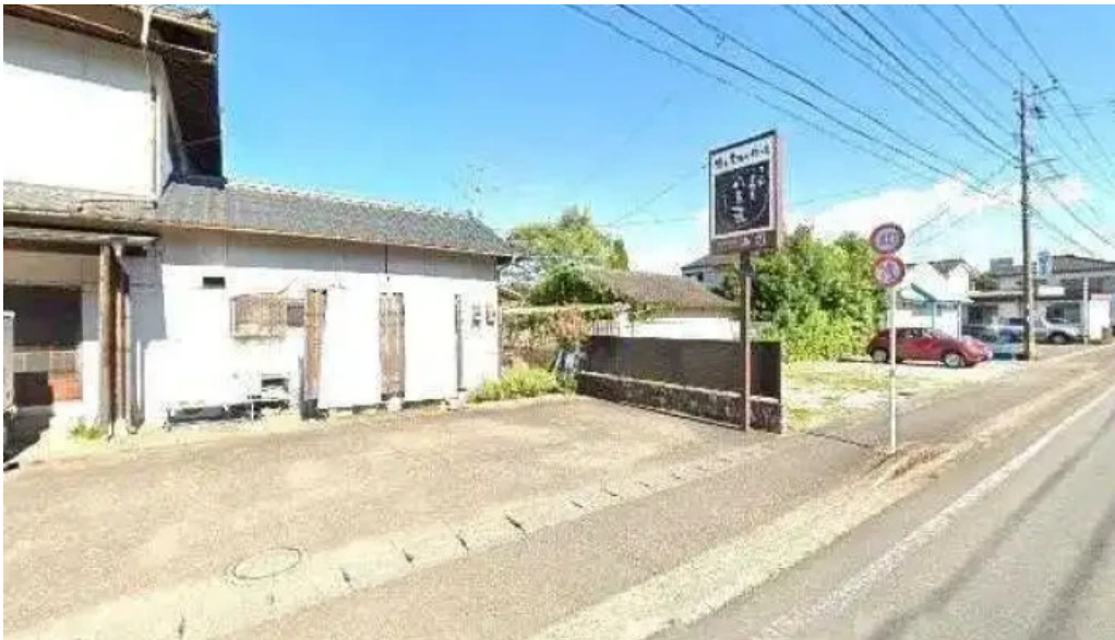
八百甚 炉端焼き 人吉市