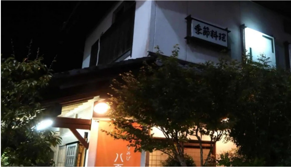
八百甚 炉端焼き 写真