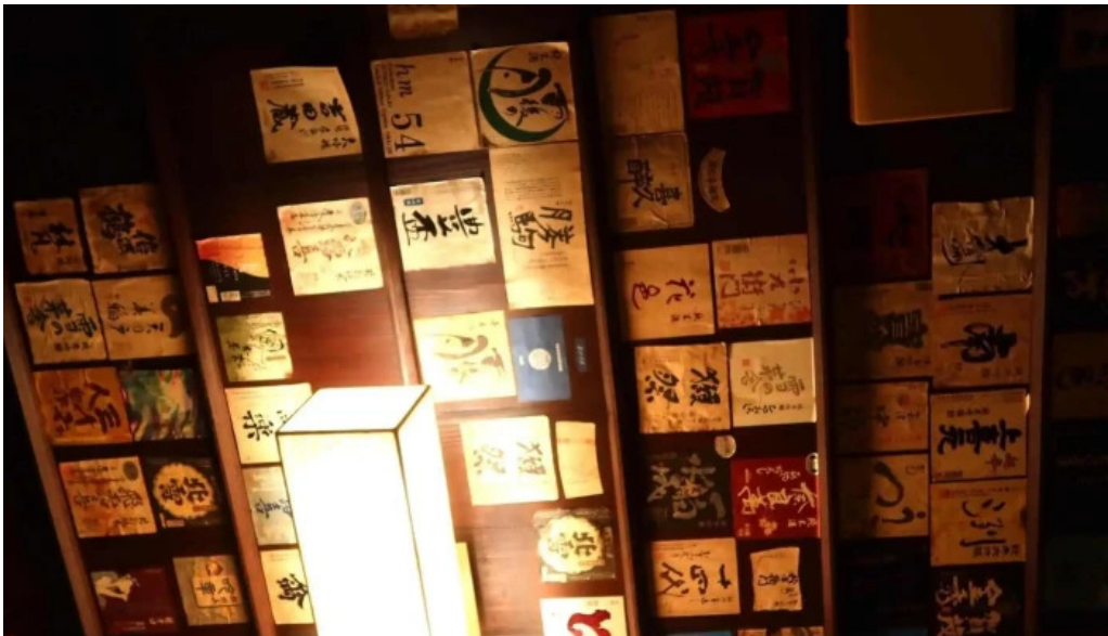
八百甚 炉端焼き どこ