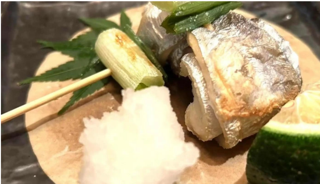
八百甚 炉端焼き 住所