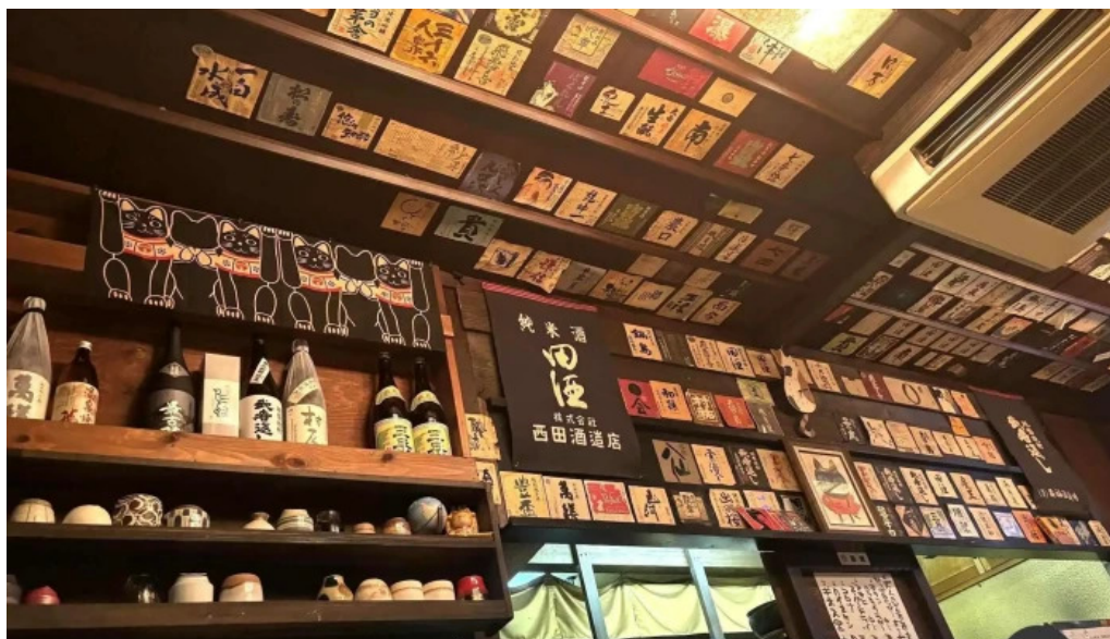
八百甚 炉端焼き 雰囲気