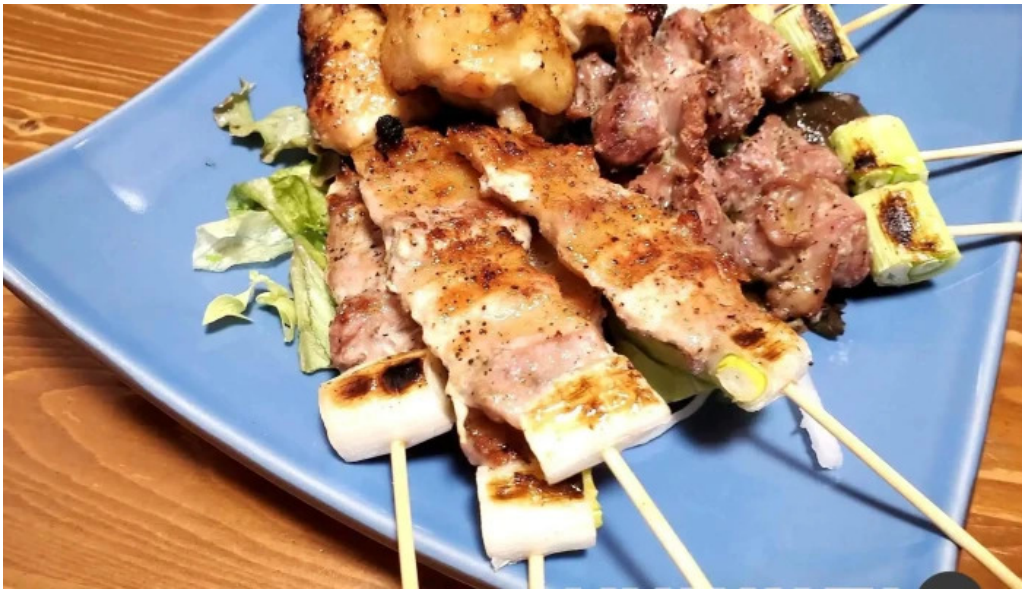
八百甚 炉端焼き 料理飲み物