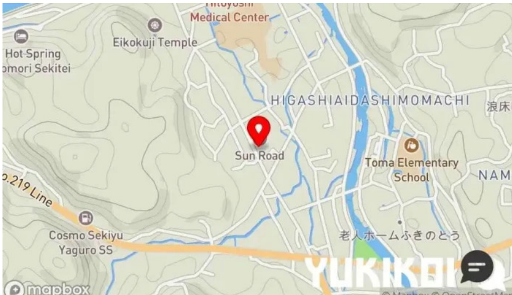
八百甚 炉端焼き 地図