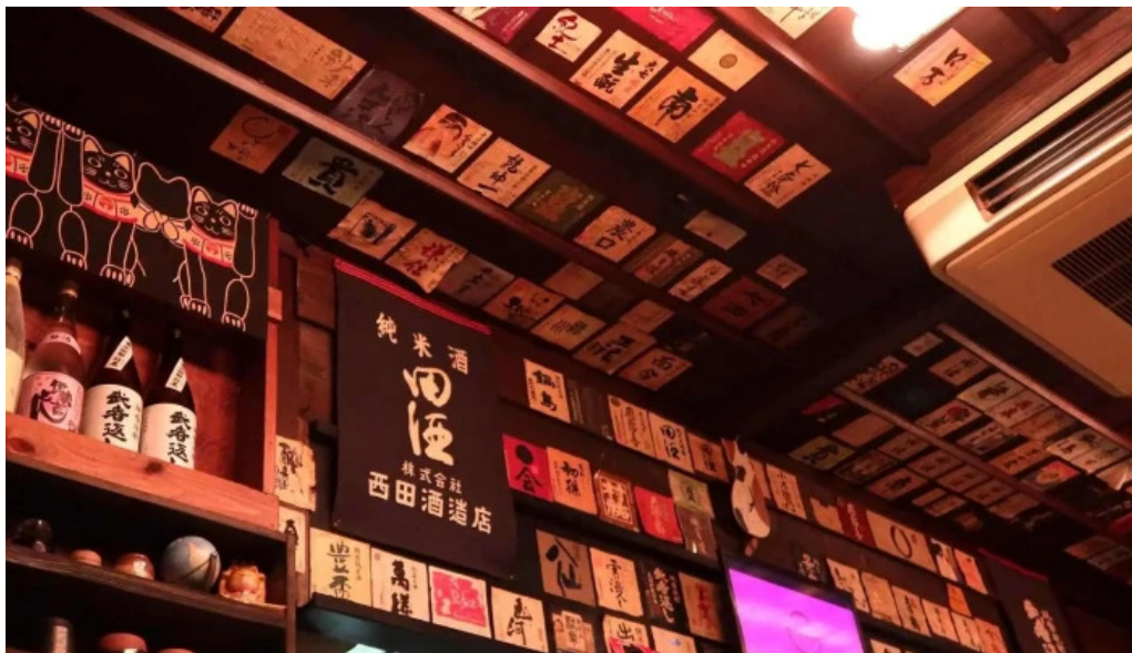
八百甚 炉端焼き 動画