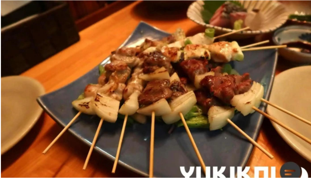
八百甚 炉端焼き 焼き鳥