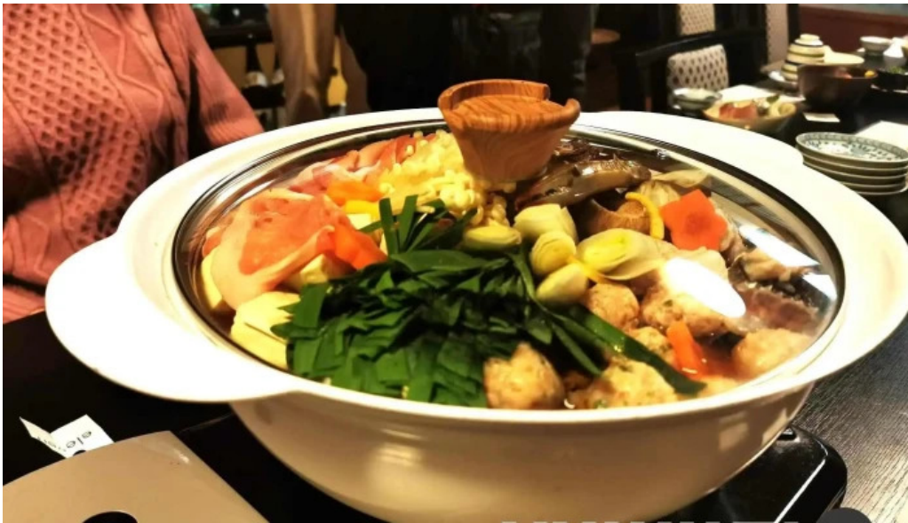
八百甚 炉端焼き スープ