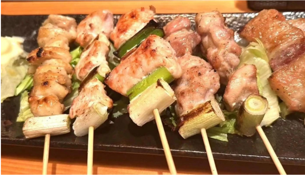
八百甚 炉端焼き コメント