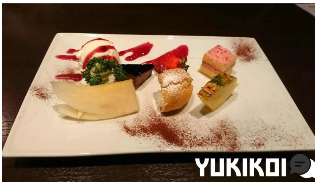
かめ家ダイニング 料理飲み物