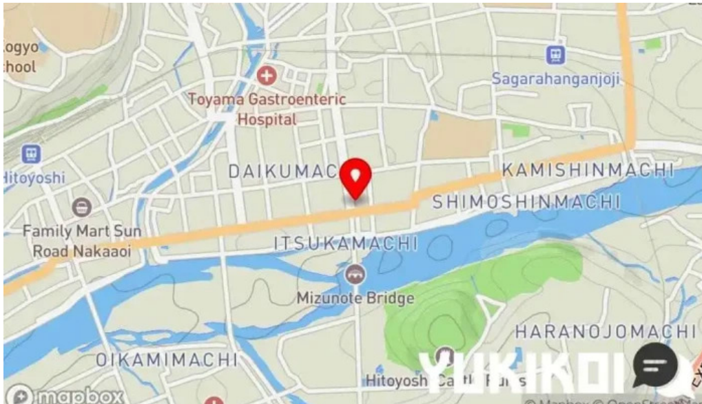
かめ家ダイニング 地図