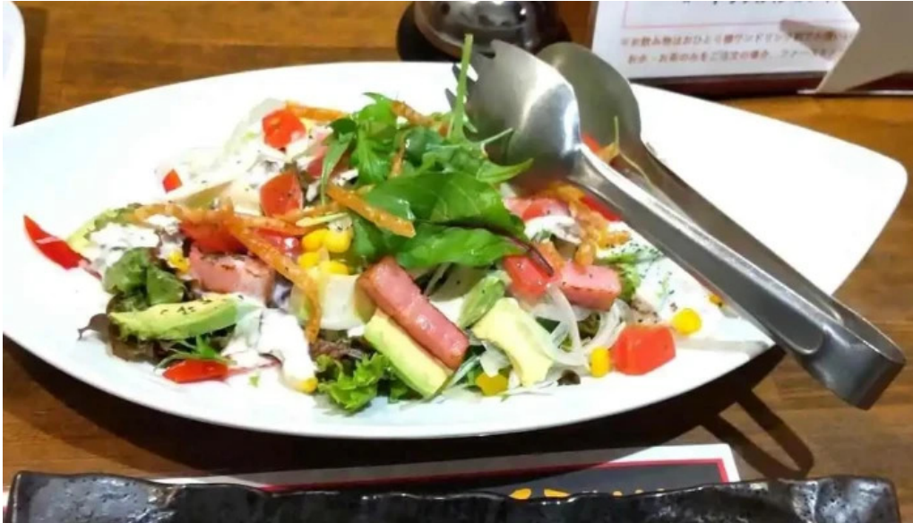
かめ家ダイニングメニュー