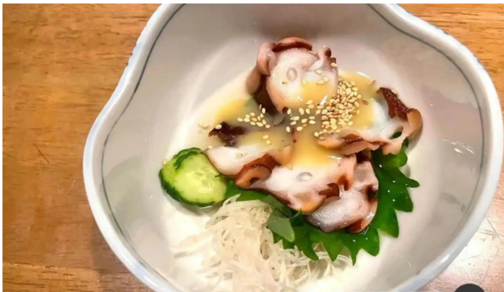
赤兵衛 料理飲み物