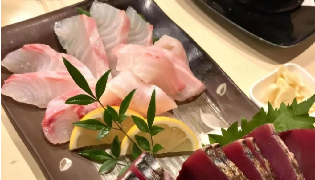
くいもん屋 しんちゃん プロモーション