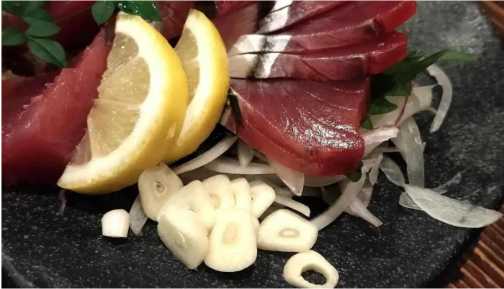
くいもん屋 しんちゃん 刺身