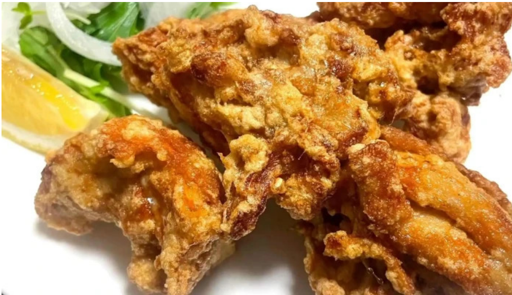
くいもん屋 しんちゃん ウェブサイト