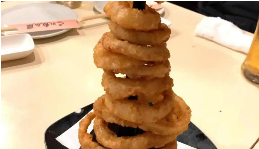
くいもん屋 しんちゃん タマネギ