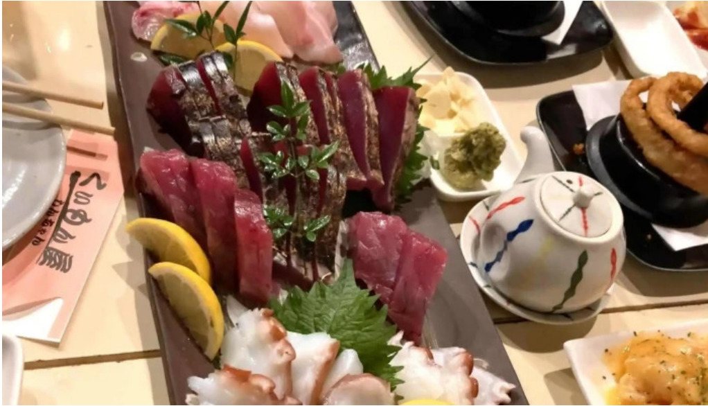
くいもん屋 しんちゃん 口コミ