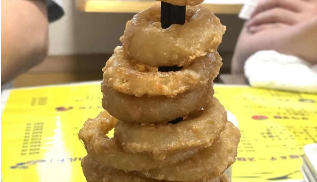
くいもん屋 しんちゃん エリア