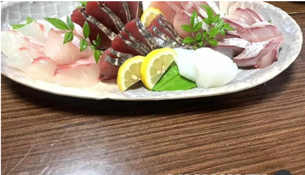
くいもん屋 しんちゃん 料理飲み物