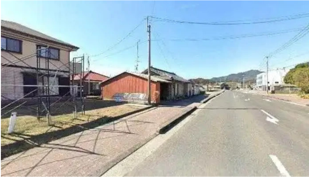
くいもん屋 しんちゃん 串間市