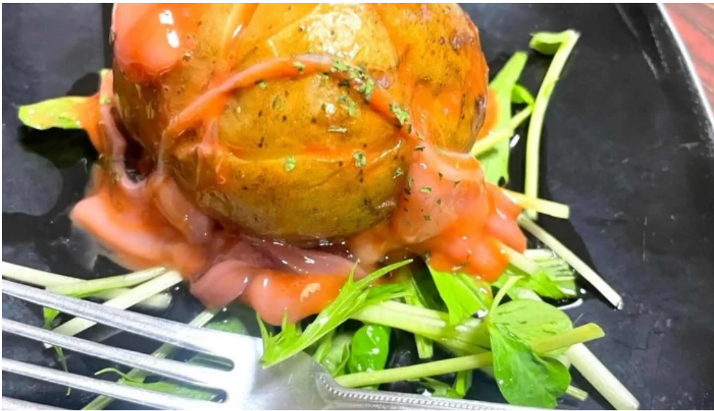
くいもん屋 しんちゃん 所在地