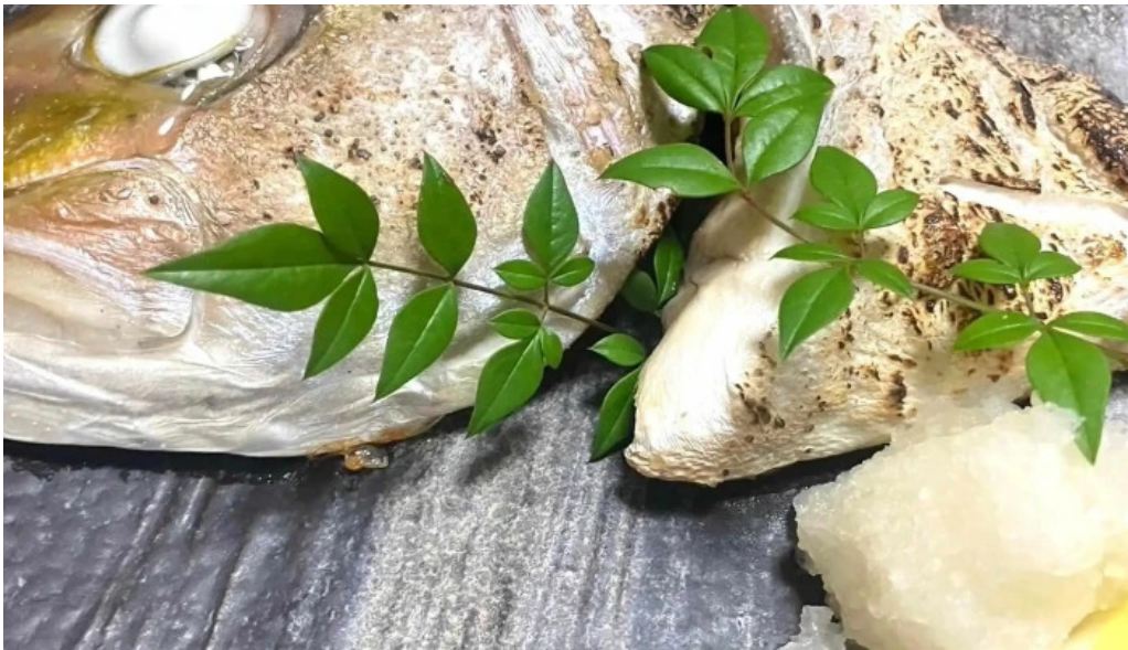
くいもん屋 しんちゃん 割引