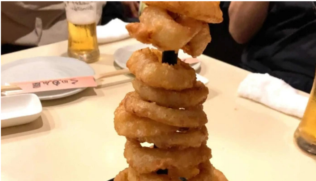
くいもん屋 しんちゃん 住所