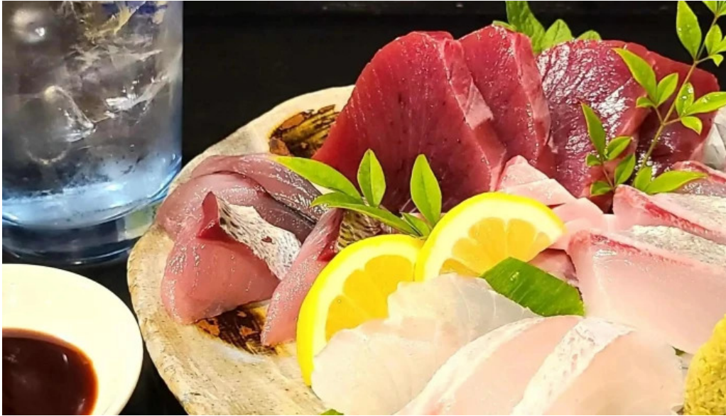
くいもん屋 しんちゃん 行き方