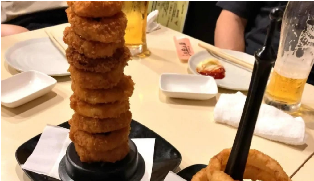
くいもん屋 しんちゃん 電話