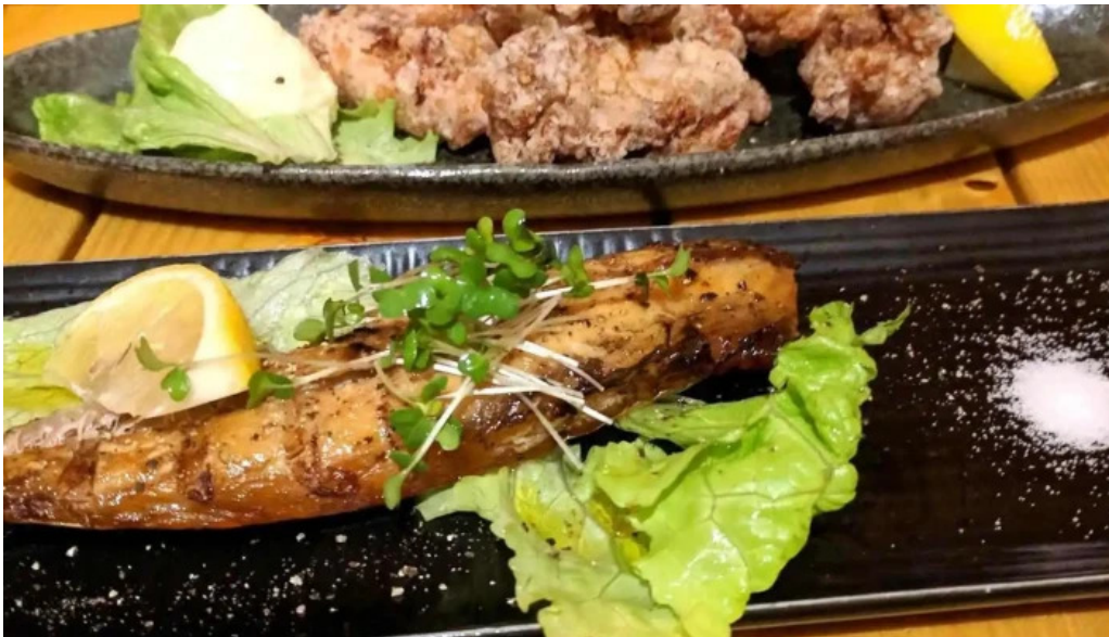
唐火七 シーフード