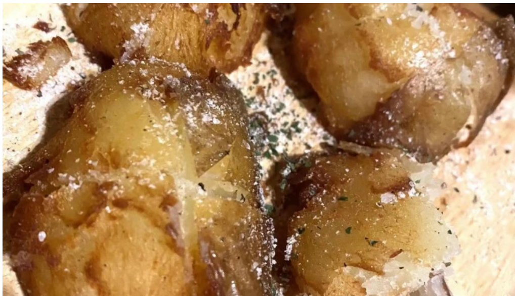
唐火七 バイクドポテト