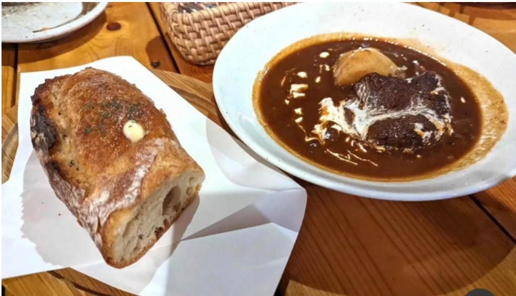
唐火七 料理飲み物